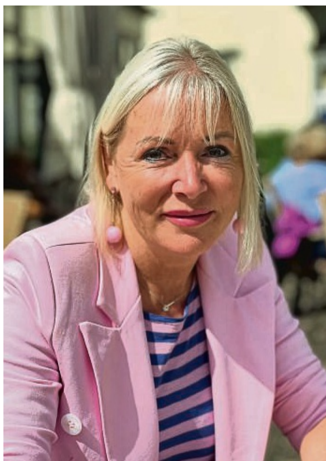
Bleibt Digitalministerin: Dr. Kristina Sinemus gehört auch dem künftigen Kabinett von Hessens Ministerpräsident Boris Rhein an.