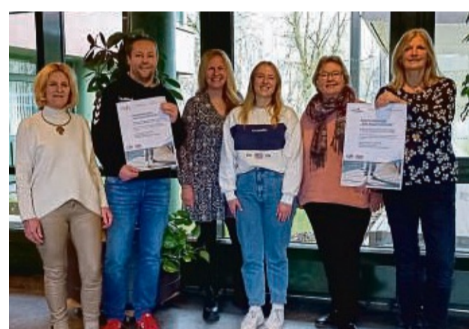
Gemeinsame Aktion: Der Landkreis, der TSV Korbach und der Soroptimist Club Korbach laden am 14. Februar zu einer Tanzdemo in der Fußgängerzone in Korbach ein.

Jährlich beteiligt sich auch der Fachdienst Frauen und Chancengleichheit des Landkreises mit einer Aktion. In diesem Jahr ist es wieder eine Tanzdemo, die zusammen