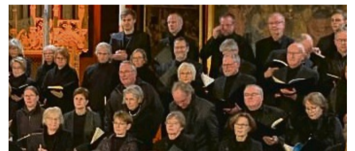
Die evangelische Kantorei Korbach bereitet sich auf die Ausführung von Bachs „Matthäus-Passion“ vor.

Der Teilregionalplan Energie sieht vor, insgesamt zwei Prozent der Fläche Nordost Hessens für Windkraftprojekte zu nutzen. Die Errichtung und der Betrieb von Windenergieanlagen mit einer Gesamthöhe von mehr als 50 Metern bedürfen dabei in der Regel einer Genehmigung nach dem Bundes-Immissionsschutzgesetz (BImSchG). Zuständig sind die Immissionschutzdezernate des Regierungspräsidiums Kassel.