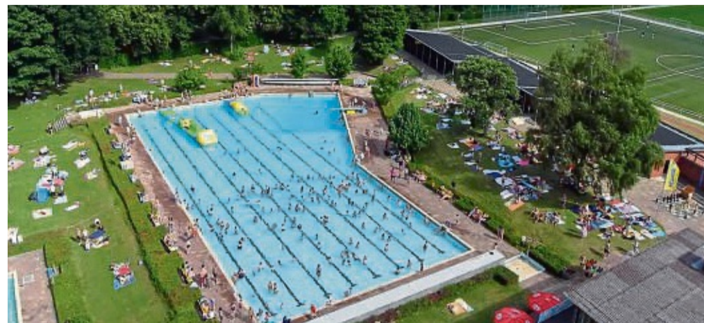
Das Korbacher Freibad: Die Förderung für die Sanierung steht noch aus.

Das hat unter anderem Auswirkungen auf die europaweit auszuschreibenden Architektenleistungen. Um