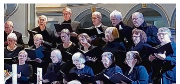
Die Kreiskantorei Twiste-Eisenberg wirkt auch an der Aufführung mit.

Eintrittskarten für das besondere Konzert der Kantoreien sind je nach Platzkategorie zu Preisen von 15 bis 25 Euro im Vorverkauf erhältlich. Vorverkaufsstellen sind die Buchhandlung Colibri in der Prof.-Kümmell-Straße in Korbach und die Buchhandlung Kirstein in der Bahnhofstraße in Bad Arolsen. red