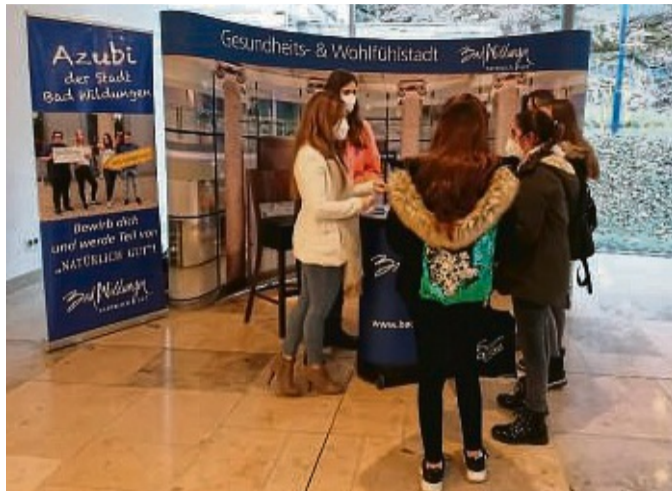
Alle, die sich für einen Ausbildungs- oder Praktikumsplatz interessieren sind in Bad Wildungen willkommen.

Alle sind willkommen, die sich für eine Berufsausbildung oder einen Praktikumsplatz interessieren. „Wir erwarten wieder über 250 Schülerinnen und Schüler, die sich über ihren ganz persönlichen beruflichen Einstieg in Form eines Ausbildungs- oder Praktikumsplatzes informieren wollen“, sagt Ute Kühlewind vom Stadtmarketing. Die Unternehmen aus Bad Wildungen und der Region Edersee informieren über Ausbildungs- und Praktikumsplätze im öffentlichen Dienst, bei Ban-