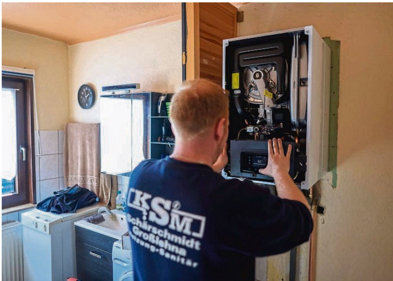
Eine energetische Sanierung macht viele Umbaumaßnahmen nötig, die der Staat fördert. Der Handwerker sollte aber nicht beginnen, bevor der Antrag auf Förderung raus ist.