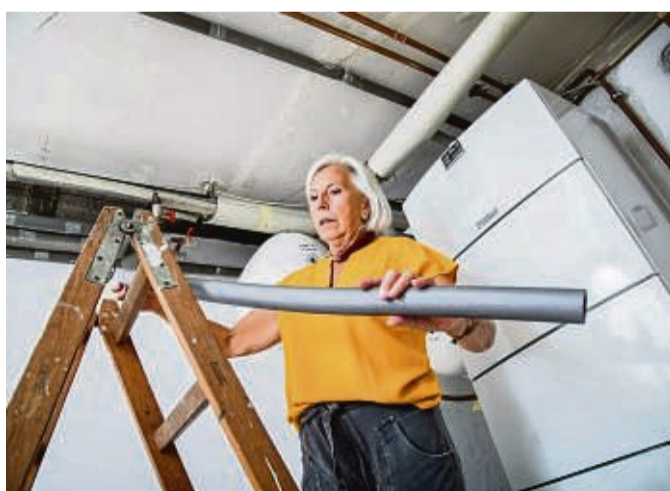
Eine effektive Dämmung schützt Rohrleitungen im Winter vor dem Zufrieren.

Aber soweit muss es gar nicht erst kommen. Hier sind die Tipps zum Finden und Schützen gefährdeter Leitungen: