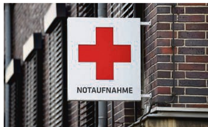
Von Notfällen spricht man, wenn das Leben in Gefahr ist oder bleibende Schäden drohen.

Auch starke Brustschmerzen oder Herzbeschwerden sind ein Fall für die Notaufnahme, weil sie auf einen Herzinfarkt hindeuten können. Ebenso Atemnot, hinter der zum Beispiel eine Lungenembolie oder eine schwe-