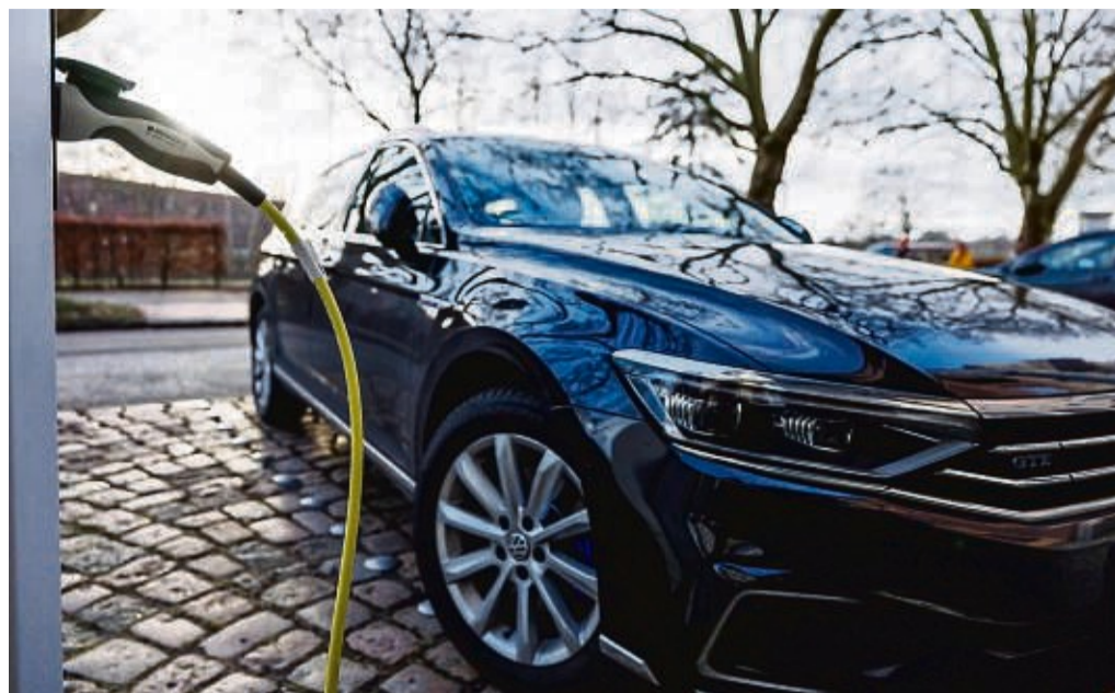
Spart Energie: Beim Vorheizen an der Wallbox kommt der Strom aus dem Stromnetz – und nicht aus der Batterie.

1. Vorheizen noch an der Wallbox: Auch weil die Energie für die Innenraumheizung nicht aus der Motorabwärme kommt, braucht ein E-Auto im Winter mehr Energie. Über die Standheizung kann der Innenraum aber schon vor dem Start noch an der Wallbox etwa über eine App vorgewärmt werden. So kommt der Strom aus dem Stromnetz und nicht aus der Batterie. Rund 15 Minuten reichen je nach Modell. Oft erspart das auch schon das Scheibenfreikratzen oder macht es einfacher.