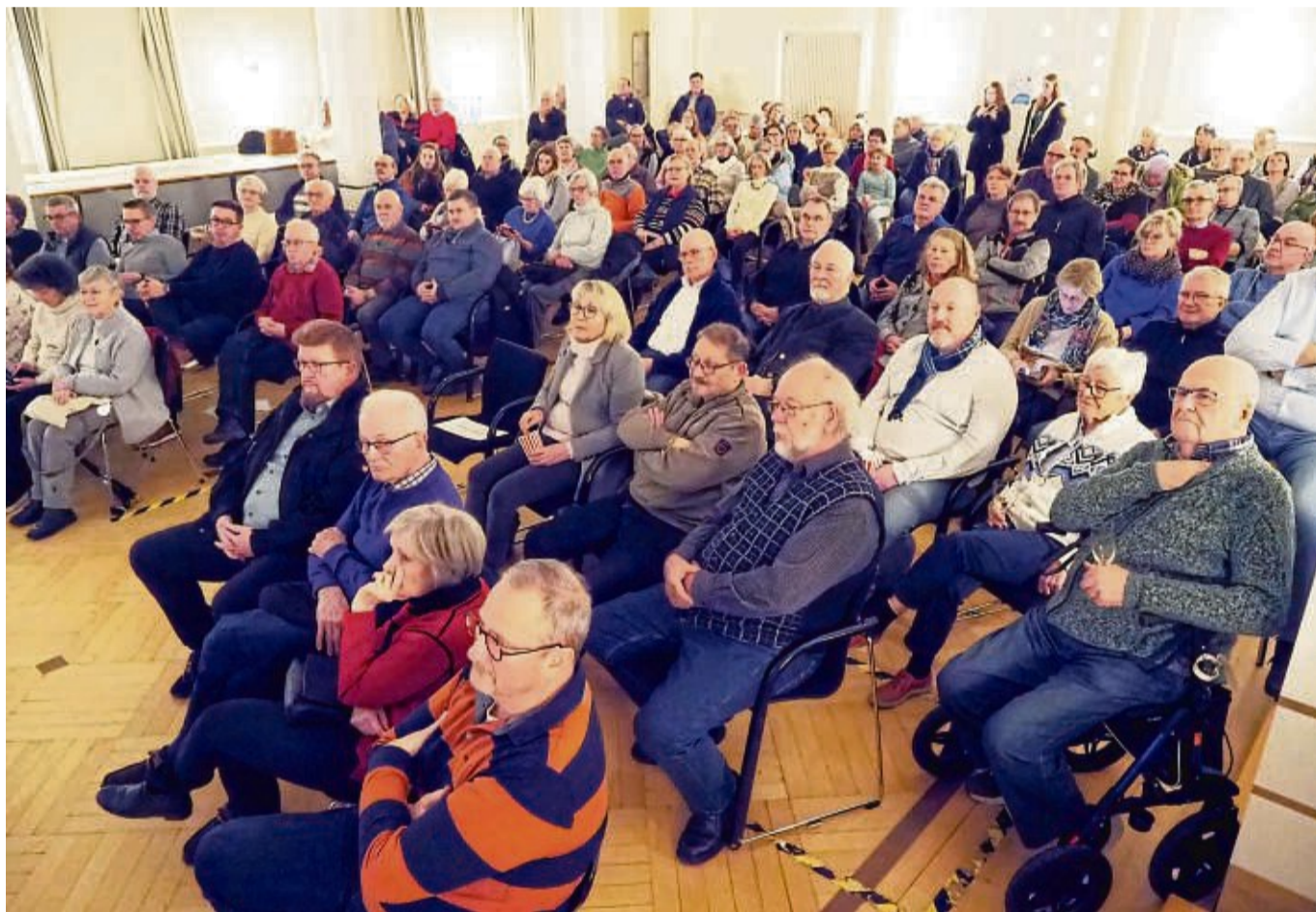
Das Interesse war riesig: Ein großes Publikum schaute den Film zur 1000-Jahr-Feier am Dienstagabend im Rathaussaal der Stadt Eschwege.

Zusammen mit dem Geschichtsverein Eschwege luden die Eschweger Filmamateure zum Auftakt des Jubiläumsjahrs zur Wiederaufführung in den Eschweger Rathaussaal ein. Gefeiert wurde das mit Sekt und Popcorn. Und das Interesse an dem etwa 45 Minuten langen Streifen war riesig, alle Plätze im Saal belegt. Der Film begann indes mit einem anderen Großereignis des Jahres 1974, der Nordhessenschau, zu der Landrat Höhne die Aussteller und Besucher begrüßte und mit der sich auch der frisch zusammengelegte Werra-Meißner-Kreis präsentierte.