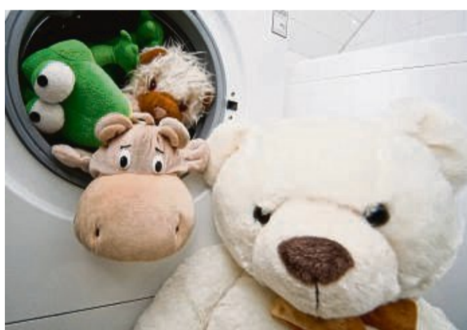
Kuscheltiere sollten nur in der Waschmaschine gereinigt werden, wenn der Hersteller das auch empfiehlt.

Zum Desinfizieren von lackiertem und unlackiertem Holzspielzeug, gerade für die Kleinen, empfiehlt sich laut Hersteller Sindibaba klarer Essig oder Apfelwein, der mit Wasser verdünnt ist. Auf Desinfektionstücher wie auch Reinigungsmittel für Holz sollte man aber verzichten, da diese giftige Substanzen enthalten könnten.