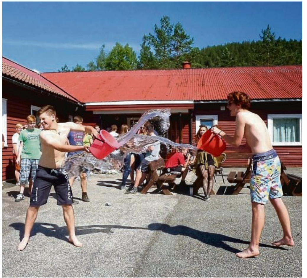
Ausgelassene Stimmung: In dem Freizeitheim in Gautestad im Süden Norwegens gibt es für die Jugendlichen zwischen 13 und 17 viel zu erleben.

Musikworkshops und Jamsessions, bei denen man neue