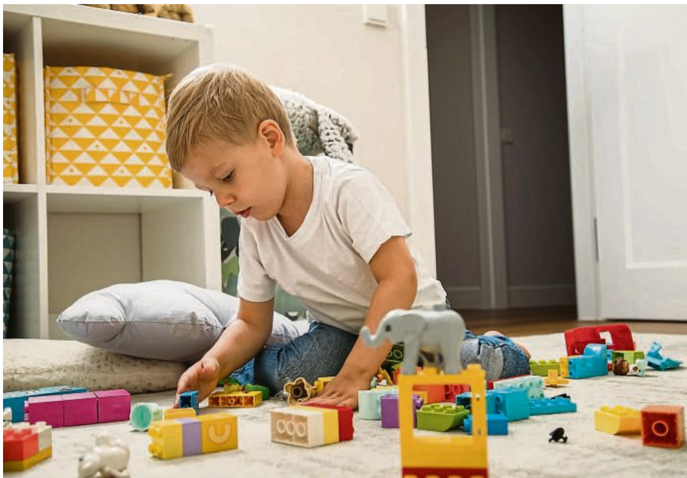
Bauklötze werden in der Waschmaschine am besten in einem Kopfkissenbezug mit Reißverschluss gewaschen. Es fungiert als großes Wäschenetz.

Der Hersteller rät, die Bausteine von Hand mit Wasser und einem weichen Tuch