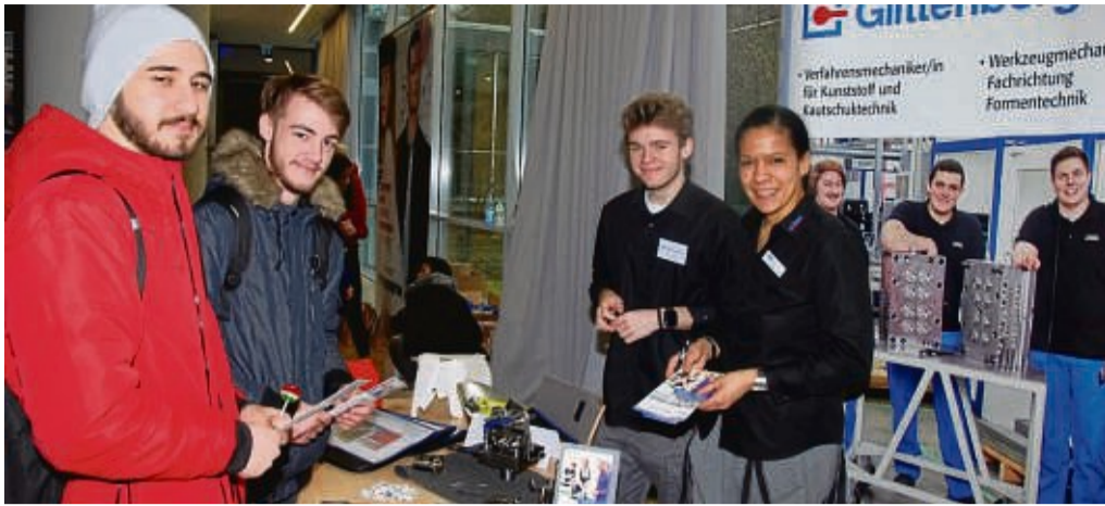
Informieren und mit Auszubildenden ins Gespräch kommen: Beim „Tag der Ausbildung“ können sich Schüler über eine Vielzahl an Ausbildungsberufen heimischer Unternehmen informieren, wie auf unserem Archivbild am Stand des Wangershäuser Unternehmens Glittenberg.