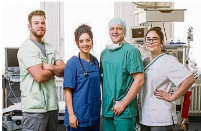
Eine Ausbildung am Asklepios Bildungszentrum, dem größten seiner Art in Nordhessen, bietet viele Möglichkeiten.

Ausbildung im Asklepios Bildungszentrum Nordhessen