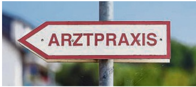
Mehr Arztpraxen im ländlichen Raum: Studienplatzquote soll Einstieg in Medizinstudium erleichtern.

Viele Patienten auf dem Land kennen ihren Hausarzt