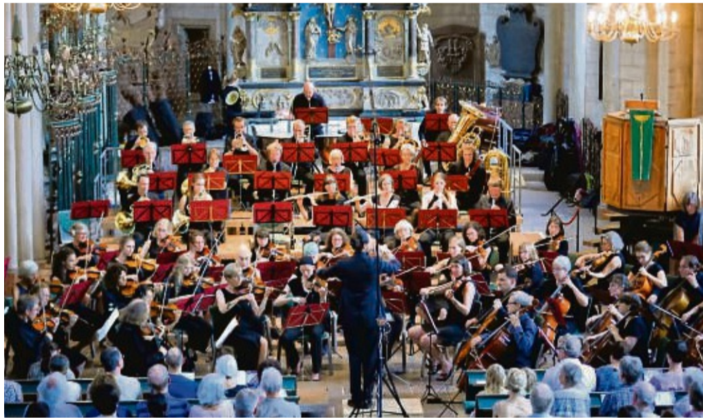
Die Marburger Philharmonie spielt am Samstag, 27. Januar, ab 19 Uhr ein sinfonisches Winterkonzert in der Kulturhalle in Frankenberg.

Arbeitslose, freier Eintritt für Kinder bis 12 Jahren) an folgenden Vorverkaufsstellen: Buchhandlung Jakobi und Buchhandlung Hykel. nh/mab