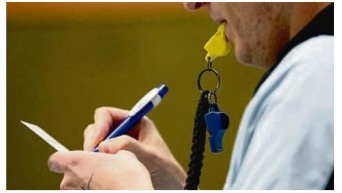
Die Fußballschiedsrichtervereinigung bietet Lehrgang an für alle, die sich für die Spielleitung interessieren.

Und sie hat für den Regionalvorstand die Zusammenarbeit mit der Landespolitik in Wiesbaden koordiniert. Ihr Fachbereich ist Ansprechpartner für die Landesregierung, Parteien, Kammern, Verbände und andere Organisationen bei allen Fragen zur Arbeitsmarktpolitik. red/sg