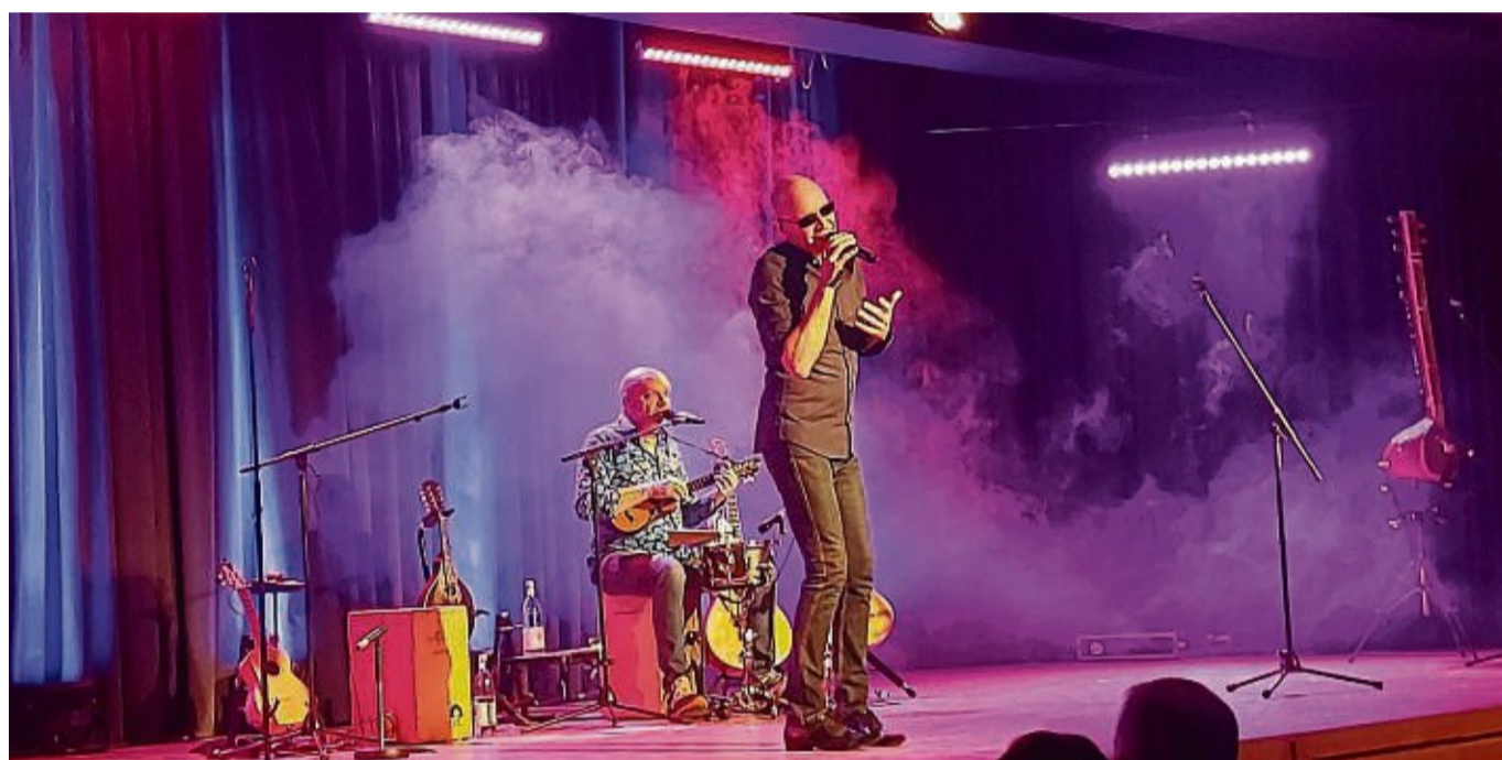
„Die Feisten“ waren zu Gast im Bürgersaal in Gudensberg.

Berührt von ungewaschenen Händen nach dem Toilettengang oder gar von krankmachenden Keimen infiltrierte? Diese Art von Humor zieht sich wie ein roter Faden durch das Programm der beiden Bajazzos aus Göttingen und Uslar, die in dieser Besetzung seit 2013 auf