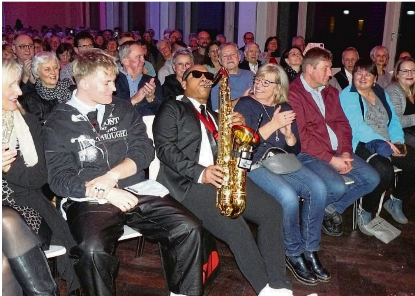
Der Saxofonist der Gruppe „Men in Blech“ spielte beim Neujahrskonzert in der Fritzlarer Stadthalle auch inmitten des Publikums.

Mit ihren Blechblasinstrumenten, Sonnenbrillen, gekleidet im schwarzen Anzug, mit einer feinen schwarzen Krawatte auf dem weißen