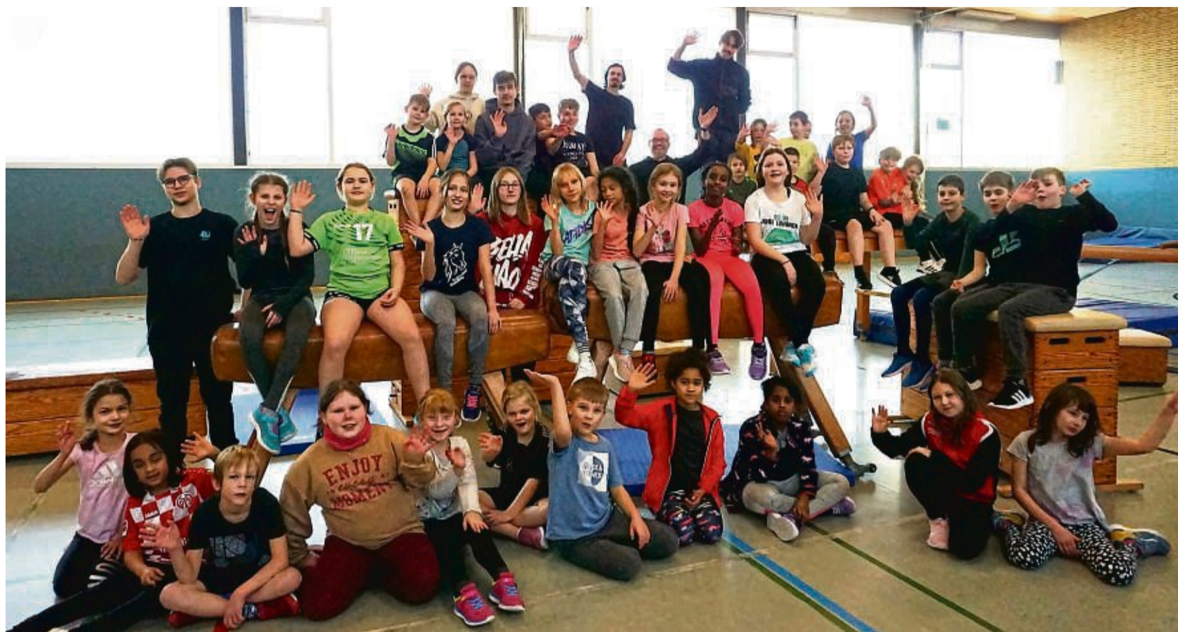
Am Parkourtag während der Winterferienspiele der Haspel ging es für die Kinder und Jugendlichen wortwörtlich drunter und drüber.

Zum Abschluss gab es ein Programm im Melsunger Jugendtreff. Bastelaktionen,