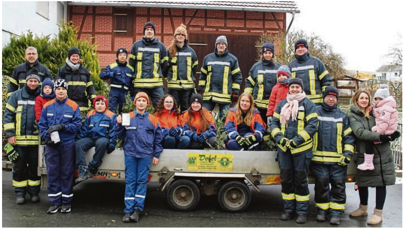
Mit dem Feuerwehrbus und dem Anhänger der Firma Döbel waren Mitglieder der Jugendfeuerwehr und Kinderfeuerwehr sowie Betreuer und Mitglieder der Einsatzabteilung unterwegs, um in Mühlhausen traditionell die Weihnachtsbäume einzusammeln.

Den traditionellen Bürgerservice gab es auch in Mühlhausen. Seit 46 Jahren werden in Mühlhausen die Weihnachtsbäume eingesammelt