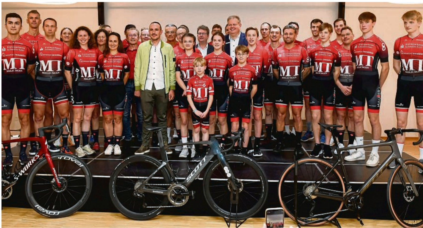
Ein Höhepunkt 2023: die Teampräsentation der Radsportler der MT auf der Bühne der Kreissparkasse in Melsungen mit Radprofi John Degenkolb (Mitte) als Gast.