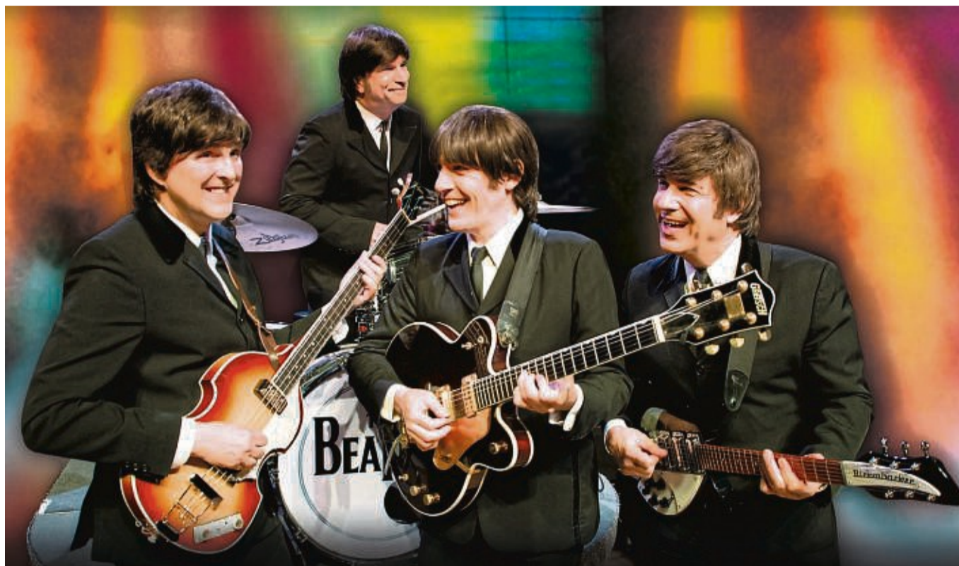
All you need – Das Beatles Musical ist am 4. Februar zu Gast in der Stadthalle Kassel.

Die Zuschauer können jenes legendäre Jahrzehnt nach-