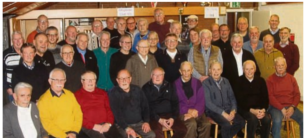
Wiedersehen mit guten Freunden: Das gab es beim traditionellen Ü60-Treffen des FSV Wolfhagen, das zum 43. Mal über die Bühne ging.

Zum 43. Mal seit der Premiere 1981 kamen also in diesem Jahr wieder alte Fußballfreunde im Vereinsheim Liemeckestadion zusammen, um in geselliger Runde bei einem guten Schluck sowie herzhaften Imbiss in Geschichten aus der guten, al-