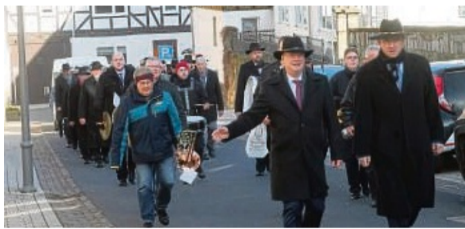
Marsch mit der Festkapelle durch die Stadt: Dieses Bild der Rohrbacher Bruderschaft Zierenberg entstand beim Jahresfest im vorigen Jahr.

Es geht dort los am Donnerstag, 1. Februar, 20 Uhr, mit dem Aufschroten des Festtagsbräu – in einer reinen Herrenrunde. Früher prüften die Brüder dabei das extra für das Fest gebräute Bier und nahmen zwischendurch auch einen hochprozentigen Schluck aus den altertümlichen Brant-