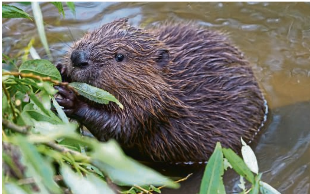
Mehr als 60 Biber leben aktuell in den Fließgewässern rund um Kassel. In den kommenden Jahren wird sich der Nager weiter ausbreiten. Unser Bild zeigt einen jungen Biber, der an der Fulda an Weidenzweigen frisst.

„Ja“, sagt Bräuer. Noch gebe es Platz genug vor allem östlich von Kassel. Zwar seien die Fulda und auch die Losse bis rauf nach Fürstentum schon gut besetzt. „Aber vor allem die Nieste wird für wei-