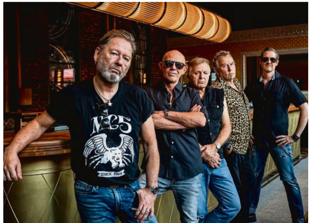
„Extrabreit“: Die Punk-Pop-Band aus Hagen spielt am 14. September in Höxter.