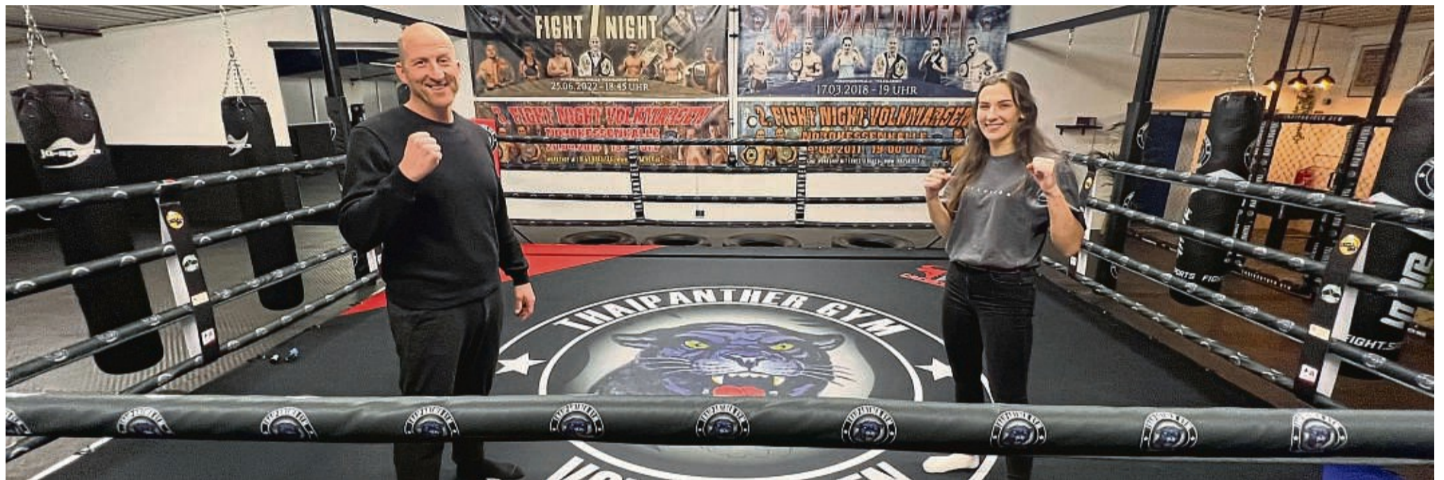
Der Kraftsportverein Breuna Volkmarsen hat eine neue Trainingshalle für Kick-/Thaiboxen eröffnet. Als Trainer fungieren Heinfried Wicke und Mirka Nasemann.