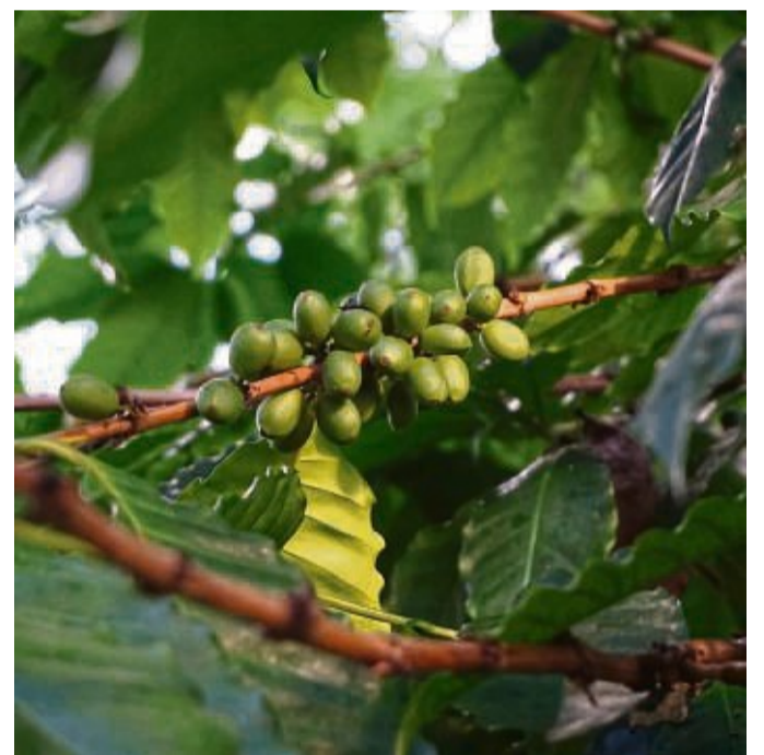
Witzenhäuser Kaffee: Diese und andere in Deutschland seltener Pflanzen, wie Kakao und Bananen, wachsen im Tropengewächshaus.