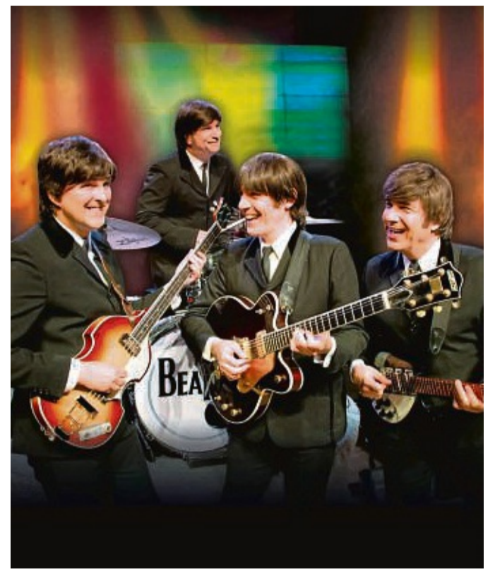
All you need – Das Beatles Musical ist am 4. Februar zu Gast in der Stadthalle Kassel.