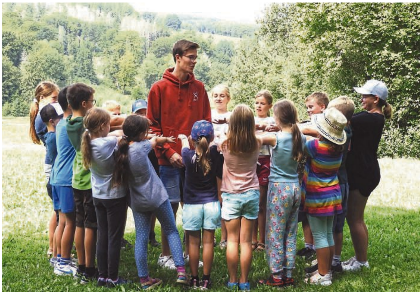
Engagement und Teamfähigkeit werden für den Einsatz als Freizeitbetreuer (hier mit einer Kindergruppe im Waldlabor) vorausgesetzt – die neue Ausbildungsreihe startet in Kürze.

Im März haben die neuen Betreuer die Möglichkeit, während eines Projektwochenendes unter Anleitung erfahrener Freizeitbetreuer in kleinen Teams erste praktische Erfahrungen zu sammeln. Das Projektwochenende steht unter dem Motto „Weltreise“ und lässt jede Menge Raum, um eigene Ideen zu diesem Thema umzusetzen.