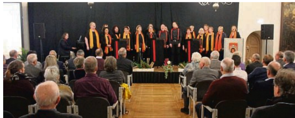
Die Flaxtöne sorgten für die musikalische Untermalung im Rittersaal des Welfenschlosses.

der Stadt Hann. Münden. Dabei gab er einen Ausblick auf anstehende Projekte. Auf Kritik gestoßen sei das Parkraumbewirtschaftungskonzept. Rat und Verwaltung machten es sich aber nicht leicht, solche Entscheidungen zu treffen. Man stehe immer wieder vor der Entscheidung, Einnahmen zu erhöhen oder Ausgaben zu senken. Einsparoptionen, wie eine Schließung des Freibades, des Geschwister-Scholl-Hauses oder einen Verkauf von Dorfgemeinschaftshäusern