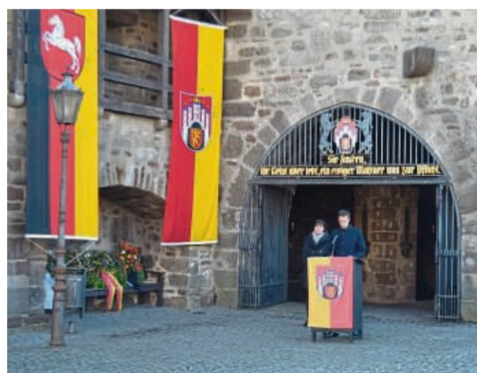
An der Mündener Rotunde werden am Volkstrauertag Kränze niedergelegt.