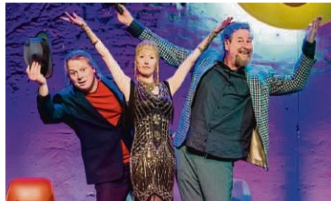
Das Kabarett-Theater „Berliner Distel“ zeigt am 10. November sein Programm: „Wer hat an der Welt gedreht?“