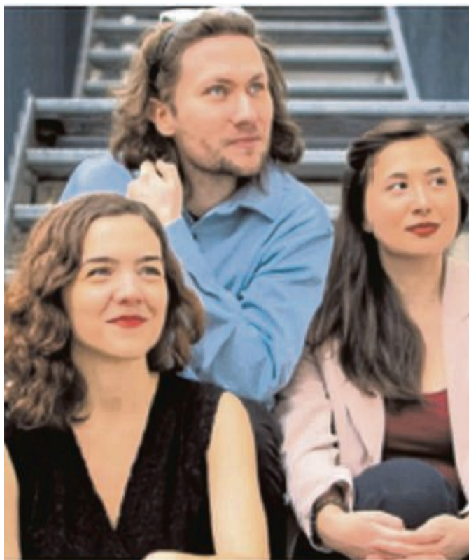
Die Händel-Festspiele Göttingen kooperieren mit dem Kulturring beim Auftritt des Ensembles Chaconne am 19. Mai.