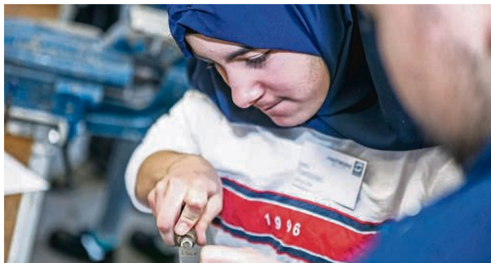
Auch Mädchen können in handwerklichen Berufen richtig gut sein. Begabungen und Interessen sind schließlich individuell.

Doch sind Frauen wirklich besser für helfende Berufe