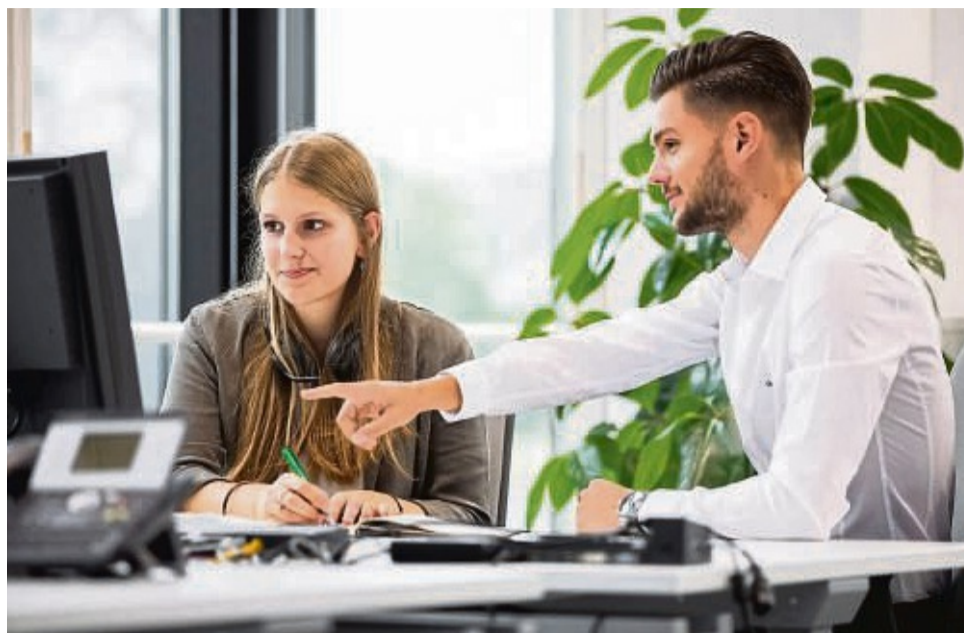
Die künftigen Vertriebstalente im Außendienst sind gefragt und die Entwicklungsperspektiven ausgezeichnet.

Ausbildungstipp mit Zukunft: Vertriebstalente sind gefragt