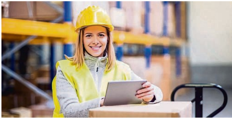
Glücklich im neuen Job: Eine Umschulung eröffnet langfristig berufliche Perspektiven. Den Weg zum Abschluss muss man nicht alleine beschreiten.

Umschulung in Vollzeit ab 1. Februar 2024