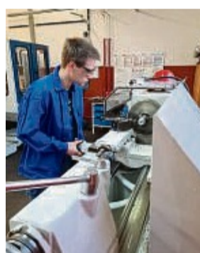
Kupfer spielt in vielen metallverarbeitenden Berufen eine Rolle.

Dazu gehören zum Beispiel Blechner, Blasinstrumentenbauer, Klempner, Schmiede oder der Elektriker. Alle diese Berufe haben nach wie vor eine wichtige Bedeutung, doch Kupfer spielt heute in einer Vielzahl weiterer Arbeitsfelder eine zentrale Rolle. Denn der vielseitige Werkstoff ist unentbehrlich in Zukunftsbranchen, die entscheidend für die Dekarbonisierung sind und sich mit erneuerbaren Energien, Elektromobilität oder hoch entwickelter Elektronik beschäftigen.