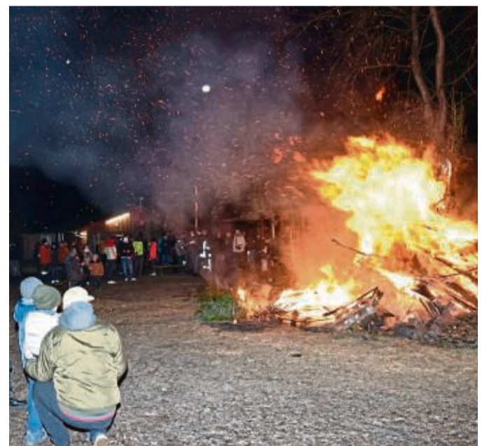
Viele Weihnachtsbäume wurden verbrannt.