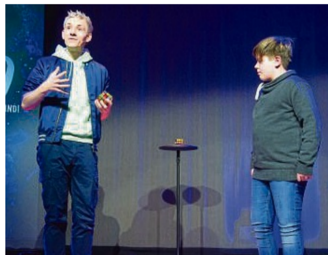
Was war da los: Assistent Titus (rechts) schaute skeptisch, als Mellow andeutete, dass es ihm gelingen würde, aus rund 43 Trilliarden Möglichkeiten dieselbe Kombination aus dem Zauberwürfel herauszudrehen wie er selbst.

Dabei gelang es dem Zauberkünstler nicht nur, seinem Publikum vor Staunen