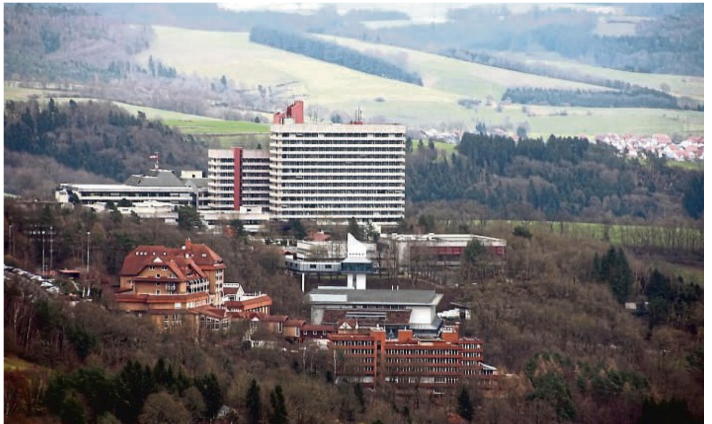
Da Wahrzeichen von Rotenburg: Hoch über der Stadt thront weithin sichtbar das Rotenburg Herz- und Kreislaufzentrum mit dem daneben gelegenen Hotel Rodenberg.

Das Zentrum verfügte bei seiner Gründung über eine Vielzahl von Einrichtungen, darunter ein Film-, Theater- und Konzertsaal sowie ein Diagnostikzentrum mit modernster medizinischer Ausrüstung. Der medizinische Gesamtkomplex wurde von der Architektengemeinschaft H. Meise, H. Bart und K. Ilic entworfen und umfasste zusätzlich ein modernes Hotel in malerischer Lage, gelegen auf einem Plateau des Rotenburger Hausbergs mit wunderschöner Landschaftskulisse. Zur Feier des Jubiläums veranstaltet das Zentrum eine Reihe von Events, darunter eine Fachkonferenz mit renommierten Kardiologen im Rahmen der Herzwochen der Dt. Herzstiftung, eine