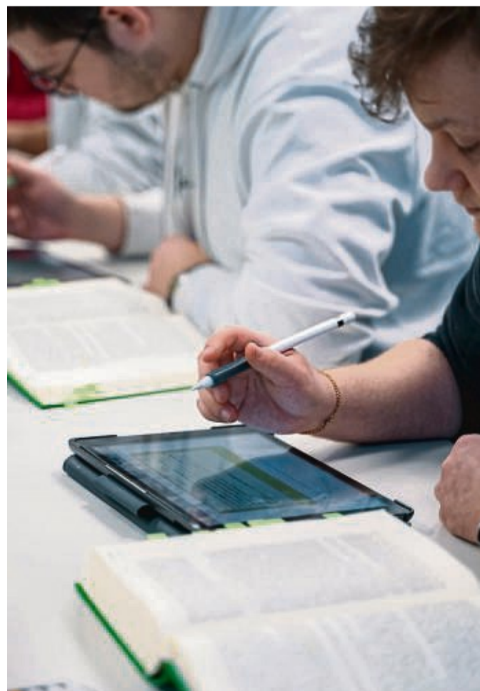
Informativ: Wer mehr über Studiengänge und Ausbildungsmöglichkeiten in der hessischen Finanzverwaltung sowie der hessischen und thüringischen Justiz erfahren möchte, sollte den Infotag besuchen.

Wir freuen uns auf zahlreiche Besucher und einen erfolgreichen Infotag!