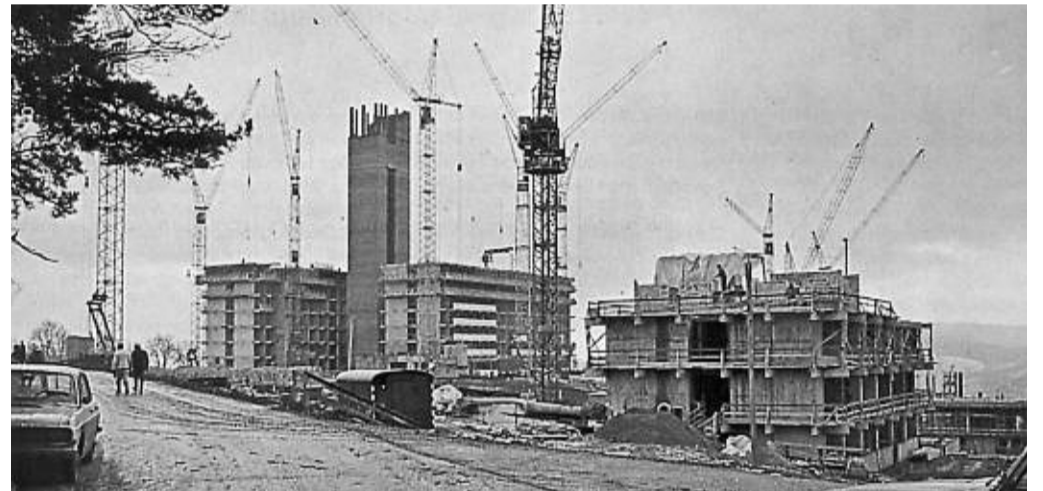
So fing vor 50 Jahren alles an: Das historische schwarz-weiß Foto zeigt den Beginn der Bauarbeiten. Der charakteristische Treppenturm ist bereits gut zu erkennen.