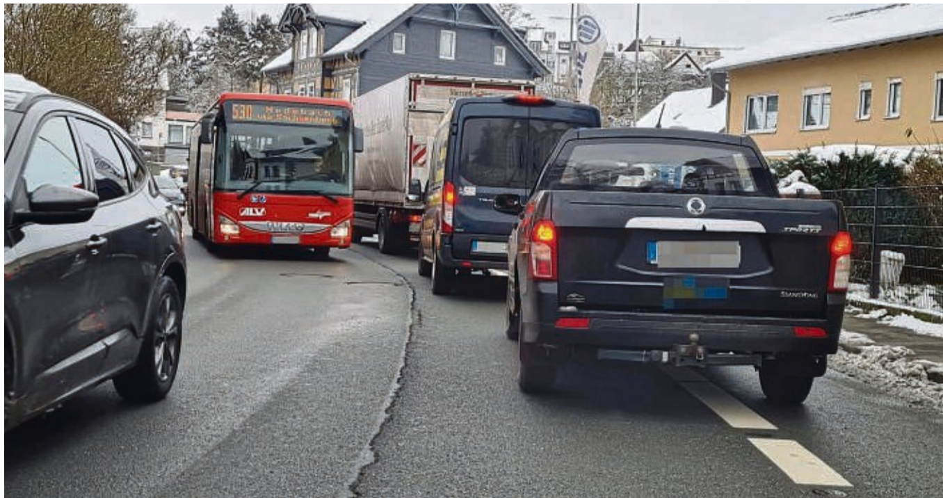
Wird es eng, wird der Radweg genutzt: In der Wilhelmstraße Frankenau ist das Radfahren trotz Radweg gefährlich, erklärt der Kreisverband des Allgemeinen Deutschen Fahrrad Clubs.