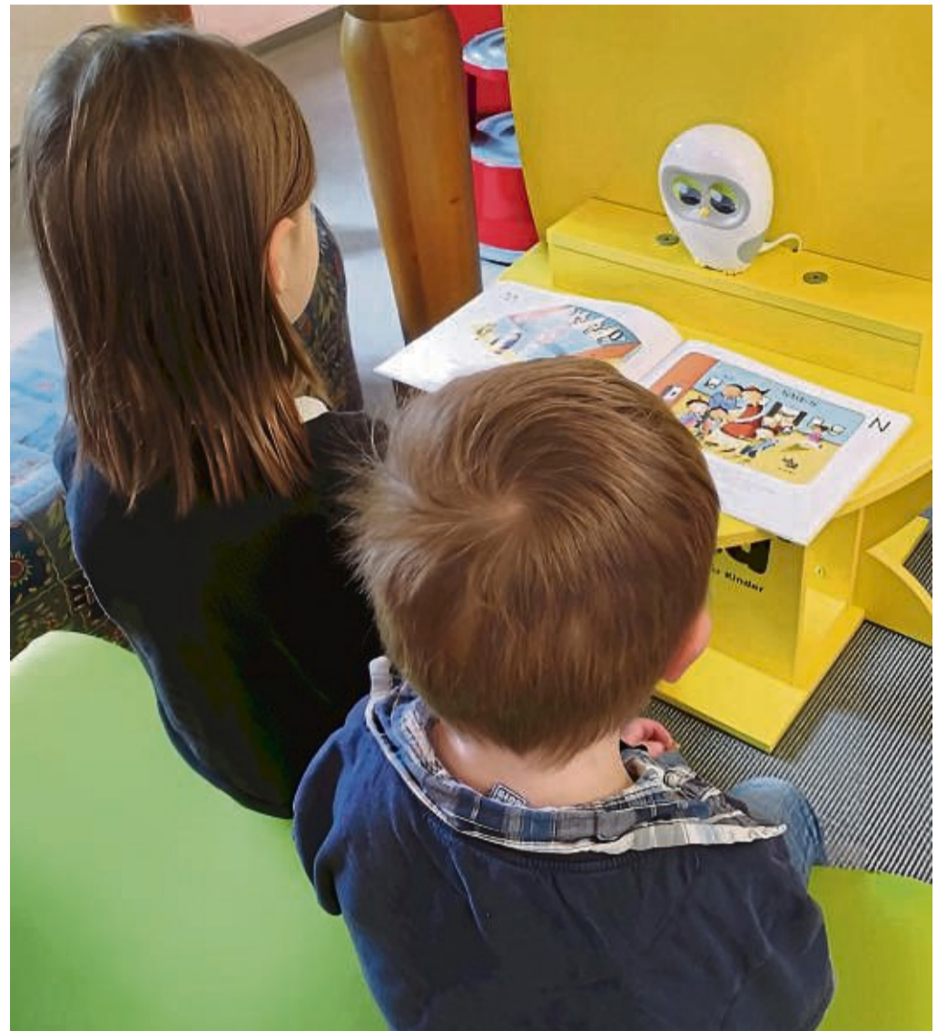
Seit einem Jahr ist die Leseeule Luka im Einsatz in der Stadtbücherei Korbach, ein digitaler Vorleseroboter.

Leseeule Luka ist Teil der Leseförderungsstrategie der Stadtbücherei. Auch hier werden klassische Formate mit neuen technischen Möglichkeiten kombiniert. Im Laufe des Jahres wurden über 100 Veranstaltungen für Kinder und Jugendliche angeboten. Auch das Angebot im Bereich Medienkompetenz für