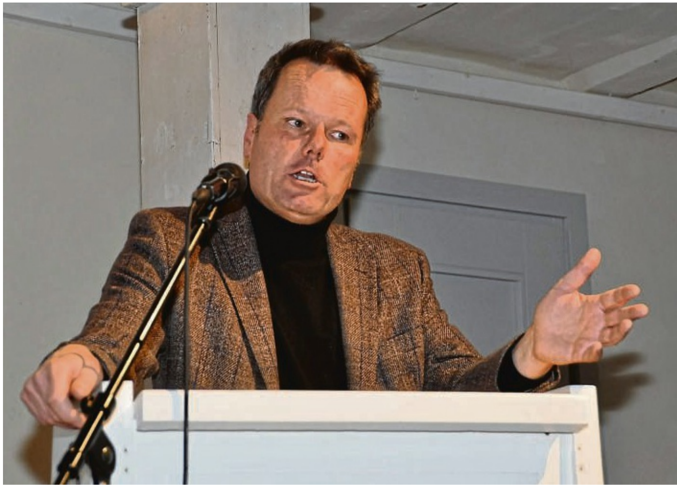
Der Nahost-Konflikt habe eine extreme emotionale und politische Dimension aufgrund seiner Geschichte, sagt Prof. Woertz von der Uni Hamburg.

Der Zionismus – das Streben nach einem unabhängigen jüdischen Staat – sei eindeutig begründet im Europäischen Nationalismus 1881 bis 1918 und dem erweiterten Konflikt bis 1948, dem Holocaust und seinen Folgen, so Woertz. „Ohne Antisemitismus in Europa hätte es den Zionismus so nicht gegeben und den Drang, in Palästina einen eigenen Staat zu entwickeln“. Vertreibungen und ethnische Bereinigungen hätten einen enormen Leidensdruck ausgelöst. Wobei Palästina, auf das die Wahl schließlich fiel, als politische Einheit erst nach dem Ersten