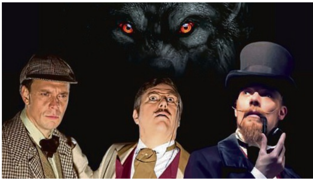
„Sherlock Holmes und der Hund der Baskervilles“ lautet der Titel der nächsten Theaterproduktion in der Fürstlichen Reitbahn.