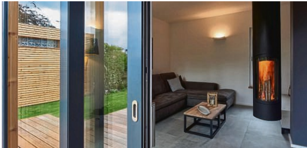
Moderne Fenster bieten beste Wärmedämmwerte - und ein wohlig-warmes Raumgefühl im Haus.

Energiesparen rund ums Haus ist nicht erst seit den weltpolitischen Konflikten dieser Tage und deren Folgen für Öl- und Gaspreise ein zentrales Anliegen für Verbraucher und Eigenheimbesitzer. Anders als häufig nahegelegt, sollte für das Mindern der Heizkosten allerdings die Sanierung der Gebäudehülle an erster Stelle stehen. Denn sie bietet in der Regel das größte Potenzial für eine Verbrauchsminde- rung. Hochwertige Wärmeschutzfenster zeigen, wie das geht: Sie lassen möglichst wenig Wärme nach außen entweichen und das eindringende Sonnenlicht lässt sich optimal nutzen. „Dadurch