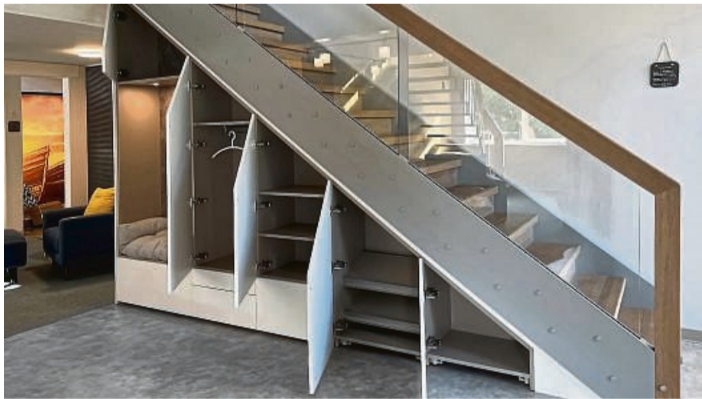
Der Raum unter den Treppenstufen lässt sich vielseitig nutzen. Ein genau eingepasster Schrank kann beispielsweise als Garderobe dienen.