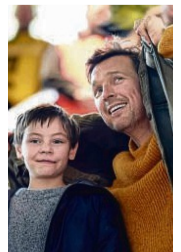
Fußballfans: Der Film „Wochenendrebellen“ läuft im kommunalen Kino.