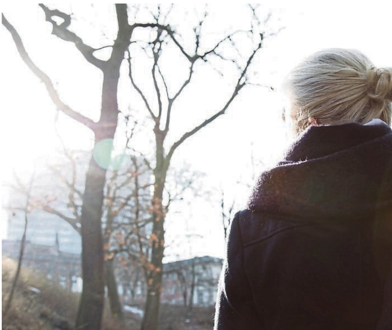
Sonne tanken: Durch die UV-B-Strahlung kann unser Körper Vitamin D bilden – und tut das vor allem in den Sommermonaten.

Ihre Empfehlung lautet: Um ausreichend Vitamin D