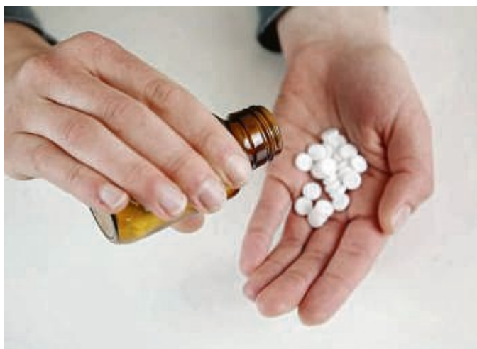
Viel hilft viel? Bei Vitamin D gilt das nicht. Wer hochdosierte Nahrungsergänzungsmittel einnimmt, riskiert Nierenschäden.