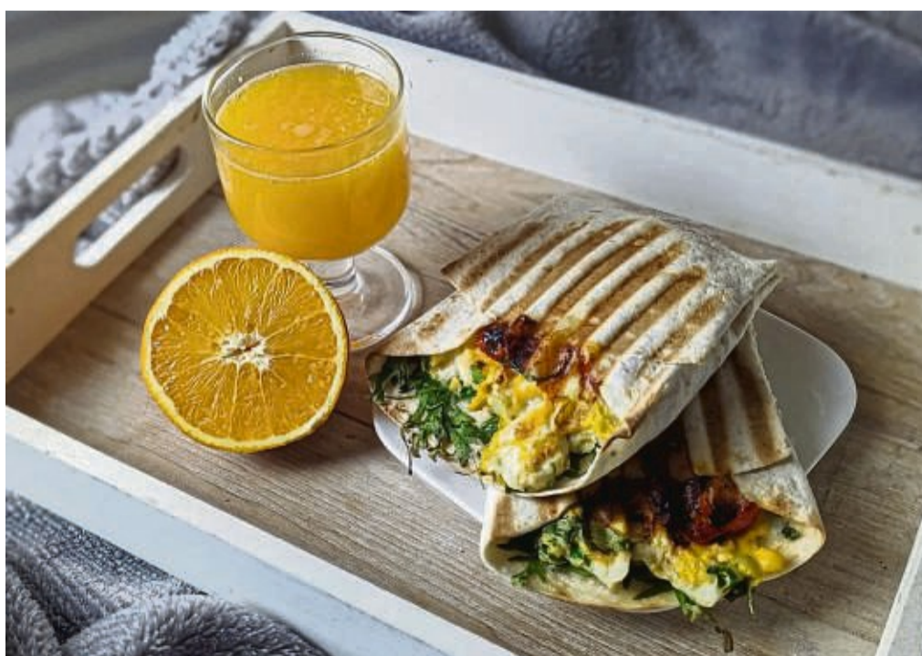
Die Weizentortillas sind gefüllt, gefaltet und gegrillt – und dürfen als Burrito zum Frühstück ans Bett serviert werden.

Was für eine geniale Erfindung ist doch da ein Frühstücksburrito! Einfach einen Weizentortilla zu einer Tasche formen, mit guten Dingen befüllen und im Kontaktgrill heiß werden lassen. Schon sind die lästigen Krümel im Bett Geschichte. Eine saubere Sache!