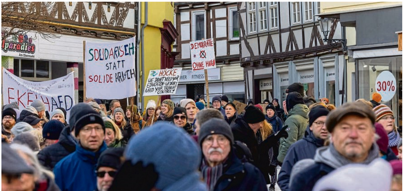
Etwa 1000 Menschen waren am Samstag dem Aufruf gefolgt, gegen rechtsradikale Tendenzen aufzubegehren. Der Organisator hatte zu Beginn nur mit zehn Teilnehmern gerechnet.