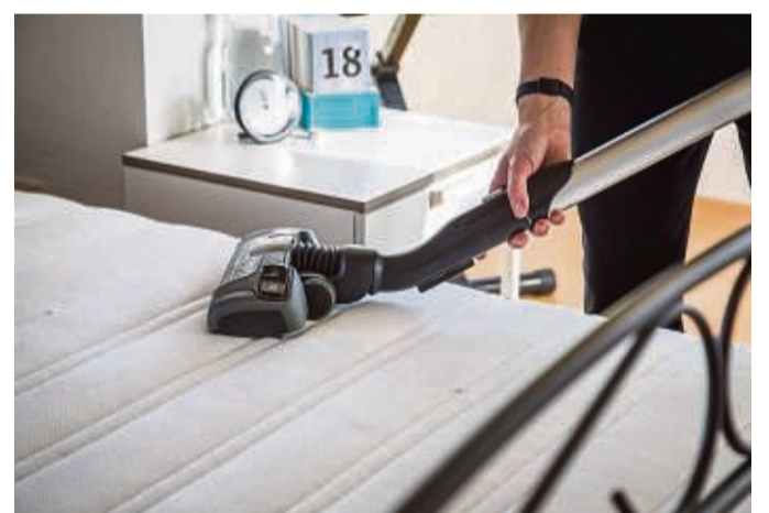
Nach der Einwirkzeit die Matratze absaugen... und? Leider in unserem Test durchgefallen.