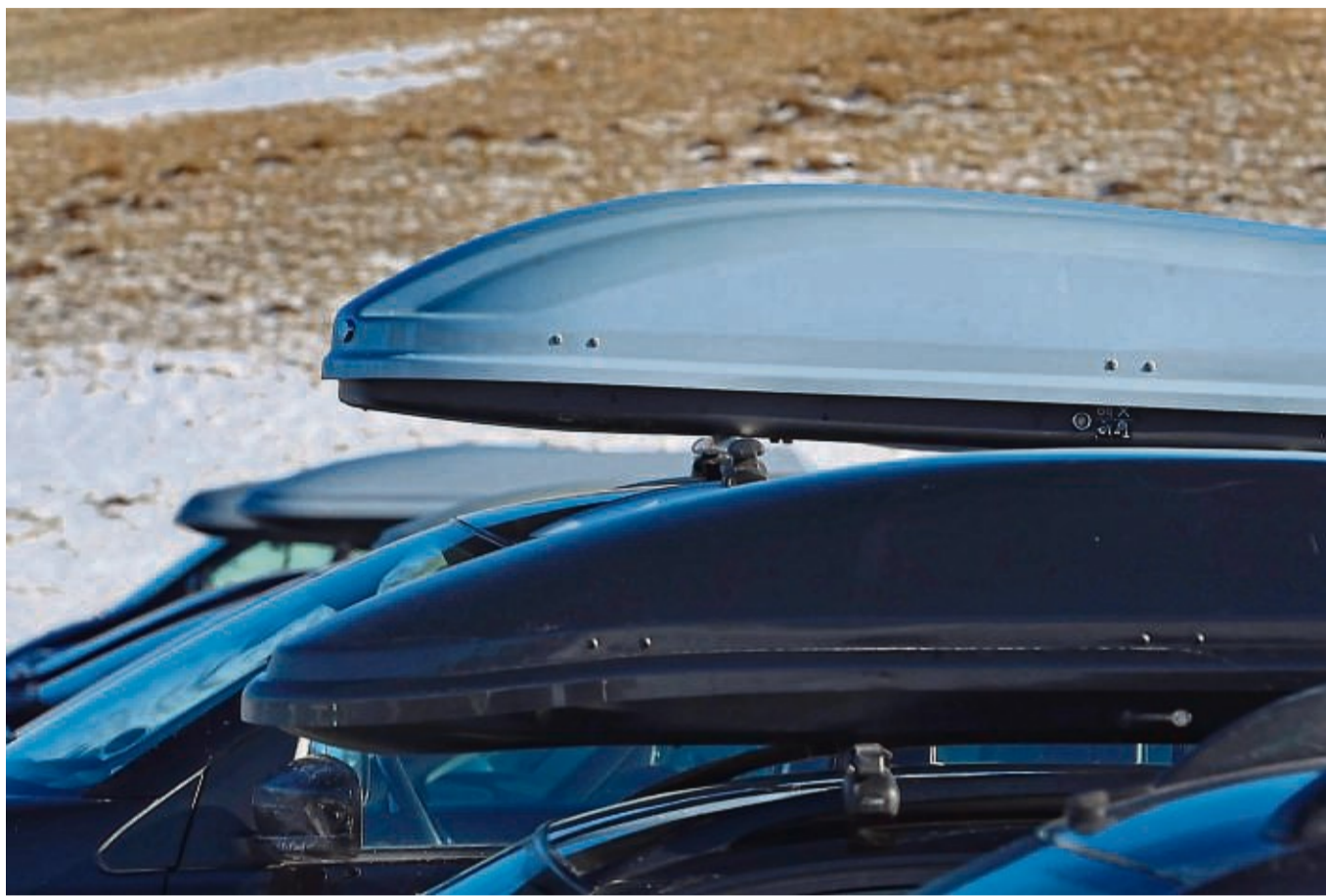
Dachboxen sind praktisch: Aber sie bedeuten auch einen Mehrverbrauch und sollten abmontiert werden, sobald sie nicht mehr benötigt werden.

Aber Sicherheit geht vor. „Das Gas geben und die Fahr-