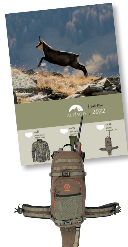
VORN Rucksack Lynx Art.-Nr.: 18124 € 309,90