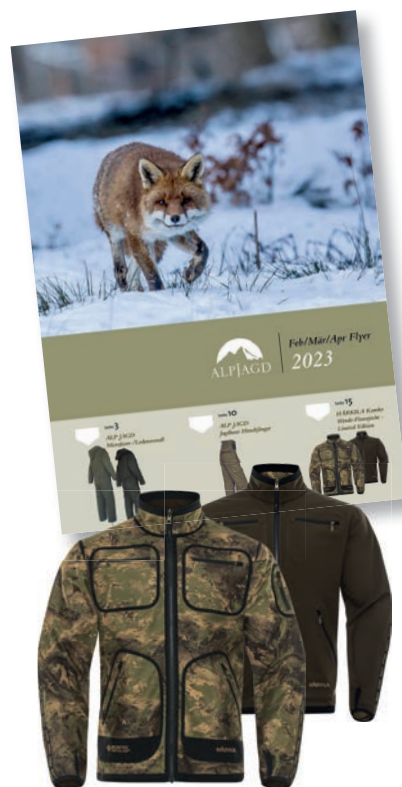
HÄRKILA Kamko Wende-Fleecejacke Art.-Nr.: 51504 € 209,90