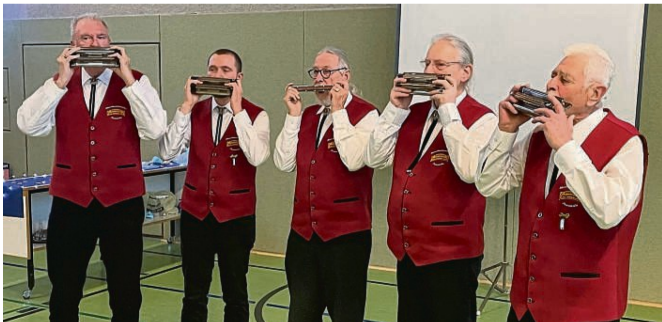
Die Mundharmonikafreunde Ziegenhagen/Oberode spielten am Jahresempfang.

Der Ortsrat Oberode lud zum Senioren-Neujahrsempfang ein