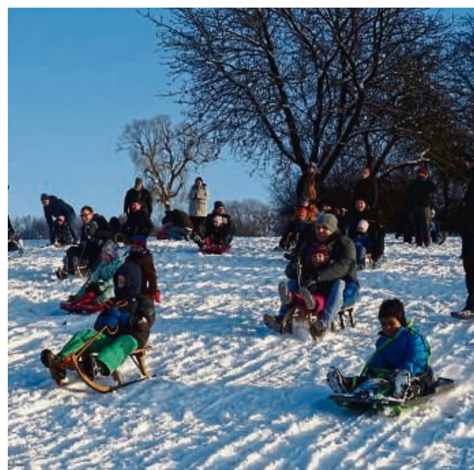
Väter, Großväter, Onkel: Mit ihnen waren 35 Kinder der DRK-Kita Schlitten fahren.