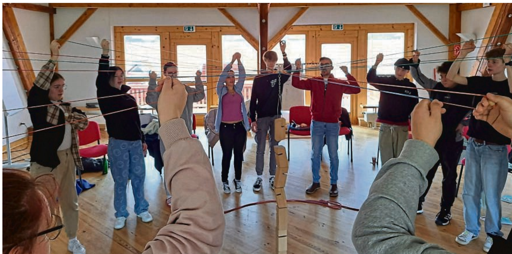
Momentaufnahme: Teilnehmer des Grundkurses lösen gemeinsam eine Kooperationsaufgabe.

Anmeldung und Informationen unter werra-meissner-kreis.ferienpro.de/ (Punkt Aus- und Fortbildungen)