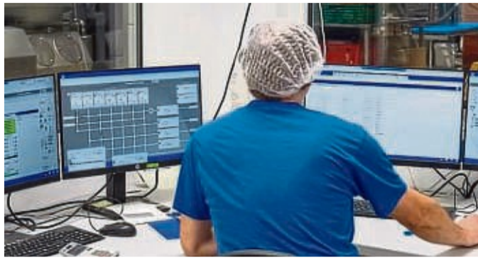
Die Upländer Bauernmolkerei bildet in den Berufen Milchtechnologie und milchwirtschaftlicher Laborant aus.