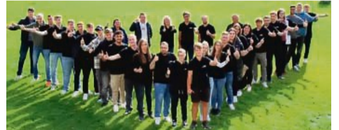
Die Auszubildenden der ALMO-Erzeugnisse Erwin Busch GmbH werden intensiv gefördert und erhalten viele Benefits.

Das zusätzliche Gesundheitsangebot für alle Mitarbeiter ist ebenso vielfältig. Angeboten werden zum Beispiel Sportkurse und ein monatlicher Beitrag für das Fitnessstudio, eine Ernährungsberatung sowie saisonale Aktivitäten.