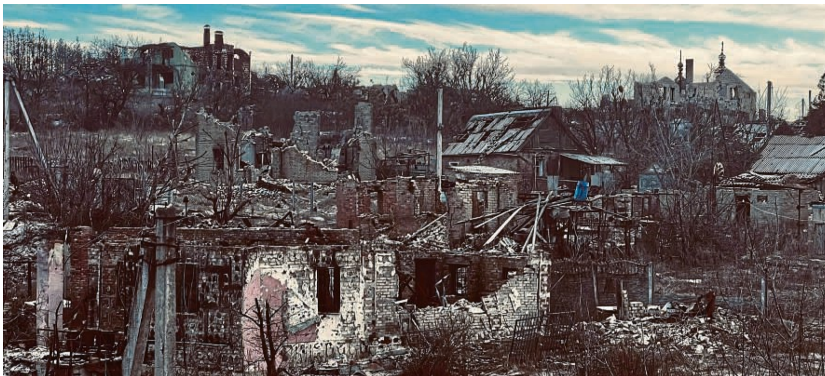
Bohorodychne heißt dieses Dorf beziehungsweise das, was davon übrig ist. Dort leben noch wenige meist ältere Menschen, die ihre Heimat nicht verlassen wollen oder nicht wissen, wohin sie gehen sollen.

In Slowjansk ist eine internationale Helfergemeinschaft tätig, denen sich die Helfer aus Korbach angeschlossen haben. Eine christliche Gemeinde stellt nötige