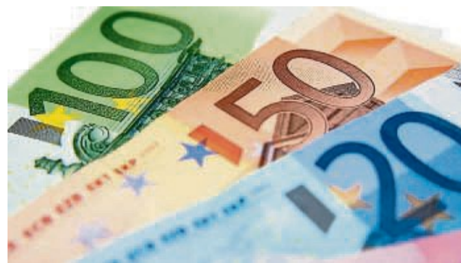
Die tariflichen Auszubildenden wurden im Schnitt um 3,7 Prozent angehoben.

Die tariflichen Auszubildenden in Deutschland sind 2023 im Vergleich zum Vorjahr im bundesweiten Durchschnitt um 3,7 Prozent gestiegen. Der Anstieg lag damit unterhalb des Vorjahresniveaus (4,2 Prozent). Die Auszubildenden in tarifgebundenen Betrieben erhielten im Durchschnitt über alle Ausbildungsjahre 1066 Euro brutto im Monat. Für Auszubildende in Westdeutschland ergab sich mit 1068 Euro ein leicht höherer Durchschnittswert als für ostdeutsche Auszubildende mit 1042 Euro. Dies sind zentrale Ergebnisse der Auswertung der tariflichen Auszubildenden für das Jahr 2023 durch das Bundesinstitut für Berufsbildung (BIBB). Aufgrund