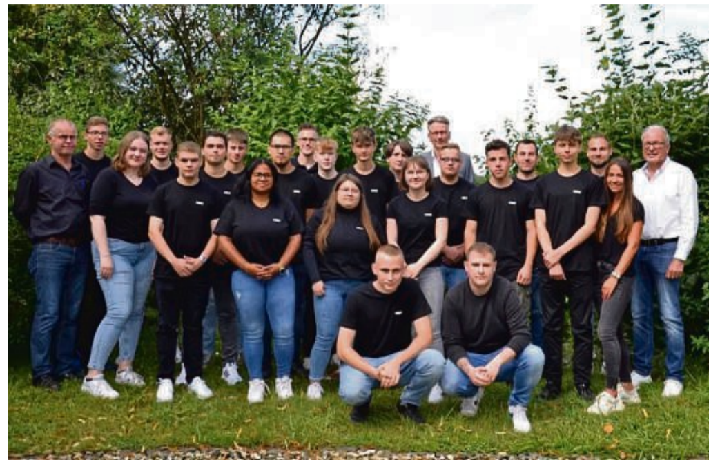
Auszubildende bei HEWI.