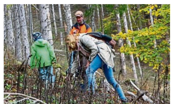
Heimische Bäume sollen am 24. Februar im Wald an der Burg Hessenstein gepflanzt werden.

Die Pflanzaktion beginnt am Samstag, 24. Februar, um 9 Uhr an der Burg Hessenstein. Im Laufe des Vormittags werden an verschiedenen Stellen im Wald neue Bäume gepflanzt. Am späten Mittag lädt das Burgteam alle