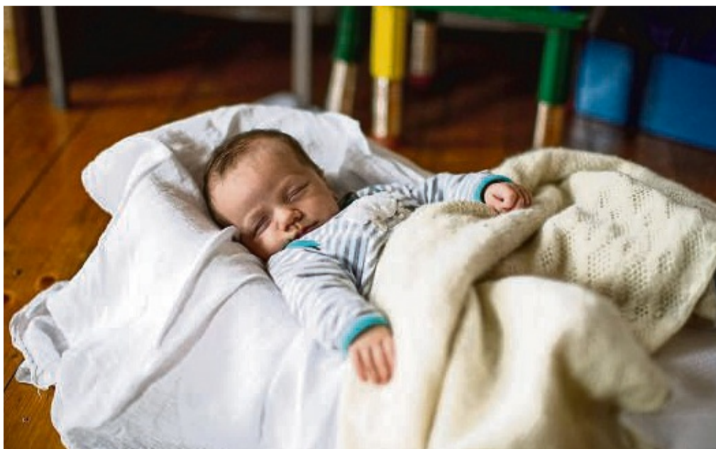
Im vergangenen Jahr waren Emilia und Liam die beliebtesten Vornamen für Neugeborene in Korbach. Insgesamt gab es im Standesamtsbezirk 277 Neugeborene.

Insgesamt wurden im vergangenen Jahr im Standesamtsbezirk Korbach 277 Neugeborene registriert, im Vorjahr waren es 311 Geburten. Die Geschlechterverteilung war relativ ausgeglichen, mit 143 Jungen und 134 Mädchen. Der Bund fürs Leben wurde laut Statistik insgesamt 136 Mal geschlossen, darunter drei gleichgeschlechtliche Ehen. Neben den Eheschließungen im Historischen Rathaus fanden wieder einige Trauungen im Korbacher Gildehaus und im Kloster Flechtdorf statt, auch die Rathäuser in Adorf und Twistetal wurden genutzt. Auch die besondere Trauungsmög-