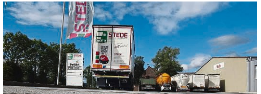
Logistik – warum nicht? Stede in Lichtenfels und Mengeringhausen hat aktuell noch Ausbildungsstellen frei.

Mit dem stetig wachsenden Fuhrpark und umfangreichen Lagerkapazitäten sorgen die Mitarbeiter dafür, dass sich jedes noch so kleine oder große Teil zur richtigen Zeit am richtigen Ort befindet. Mittlerweile hat die Spedition Stede 60 Beschäftigte und einen Fuhrpark von 16 Lkw. In 2021 hat das Unternehmen auf dem Gelände der ehemaligen Kaserne in Bad Arolsen-Mengeringhausen eine neue Logistikimmobilie gebaut. Von hier wer-