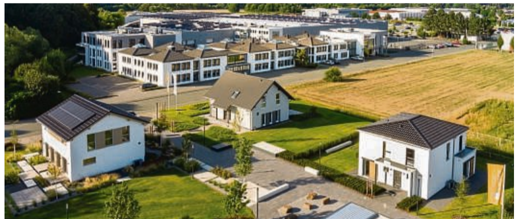
Der Fertighaushersteller FingerHaus bildet am Standort in Frankenberg derzeit in dreizehn verschiedenen Berufen aus.

Was die Auszubildenden an FingerHaus besonders schätzen? Das Gefühl, vom Arbeitgeber ernst genommen zu werden und ein Teil