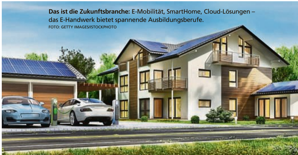
Das ist die Zukunftsbranche: E-Mobilität, SmartHome, Cloud-Lösungen – das E-Handwerk bietet spannende Ausbildungsberufe.

Ging es früher hauptsächlich um „Schlitze stemmen und Kabel ziehen“, so ist der Elektronikbereich heute einer der zukunftsorientiertesten und innovativsten in der Handwerksbranche. PV/Batteriespeicher, Errichtung und Vernetzung der E-Mobilität oder Smart Home-, oder Cloud-Lösungen sind nur einige Beispiele der spannenden Projekte. „Der Beruf des Elektrikers/der Elektronikerin hat sich in den letzten Jahren stark gewandelt. Die