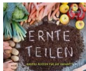
Ausschnitte aus dem Film „Ernte teilen“ werden gezeigt. FILMPLAKAT

Bei der solidarischen Landwirtschaft (SoLaWi) wird die Ernte geteilt. Das Prinzip: Mit einem festen monatlichen Beitrag tragen die Mitglieder der SoLaWi die Kosten der landwirtschaftlichen Tätigkeit und erhalten im Gegenzug ihren Anteil an den hergestellten Lebensmitteln, in dem Fall Gemüse.