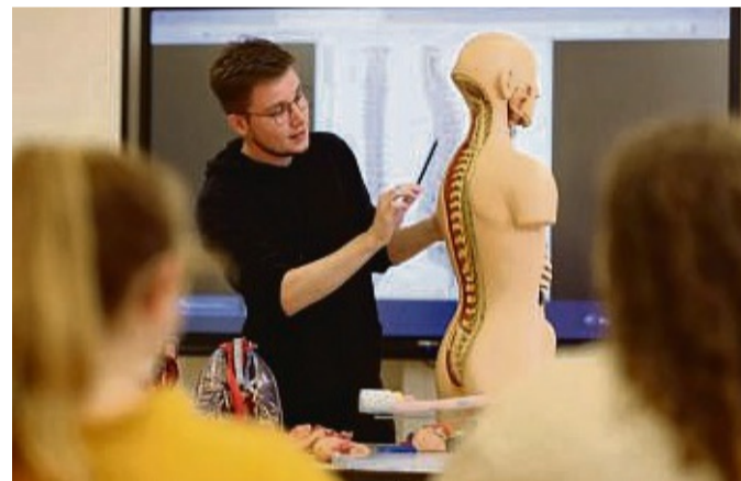
Anschaulicher Unterricht bei der Pflegeausbildung der LWL-Einrichtungen in Marsberg.