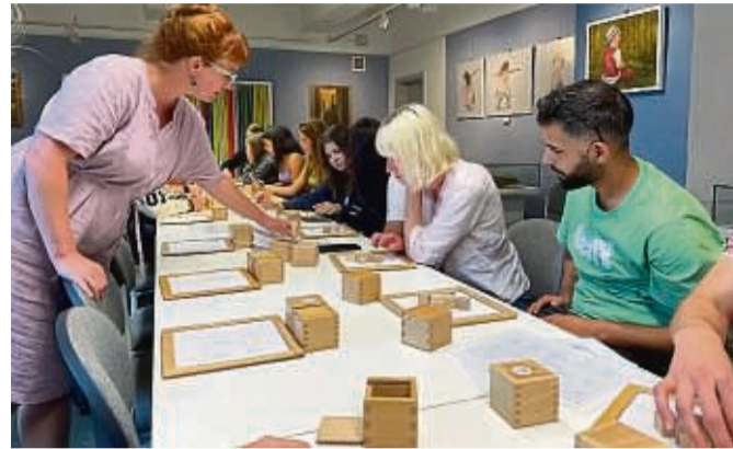
Die Ausbildung am Ev. Fröbelseminar orientiert sich an der Pädagogik des Kindergartenbegründers Friedrich Fröbel.

Wer sich für die Ausbildung zum Sozialassistenten oder Sozialassistentin interessiert, sollte den Realschulabschluss absolviert und Lust auf praxisnahes Lernen an einer Schule mit persönlicher Atmosphäre haben. Und wem der Umgang mit Kindern Spaß macht, Verantwortungsbewusst, kontaktfreudig sowie kreativ ist, für den könnte die zweijährige Sozialassistenten-Ausbildung am Ev. Fröbelseminar Korbach genau richtig sein. Sozialassistenten und Sozialassistentinnen stehen verschiedene Wege offen, sich im vielseitigen, sozialpädagogischen Tätigkeitsbereich zu entfalten.