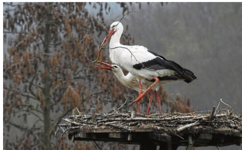
Sie fühlen sich wohl in Waldeck-Frankenberg: Das Foto zeigt ein Weißstorch-Pärchen kurz nach der Ankunft auf seinem Nistplatz in Volkmarsen.

Argylle: Sa 16, 19 u. 21.30 h, So 16 u. 19 h, Mo u. Di 19.15 h, Mi 17.15 h Butterfly Tale - Ein Abenteuer liegt in der Luft: Sa u. So 13 h, Mo bis Mi 15 h Das Nonnenrennen: Mi 20 h Die Chaosswestern und Pinguin Paul: Sa u. So 13 h, Mo bis Mi 15 h Ein ganzes Leben: Mi 19.30 h Eine Million Minuten: Sa u. So 17 u. 19.15 h, Mo u. Di 17 u. 19.30 h, Mi 17.15 h Ella und der schwarze Jaguar: Sa bis Di 15 u. 17 h, Sa u. So auch 13 h, Mi 15 u. 17.15 h Feuerwehrmann Sam - Tierische Helden: Sa u. So 13 u. 14.30 h Home Sweet Home - Wo das Böse wohnt: Sa 22 h Madame Web: Mi 15, 17.15 u. 19.45 h Mean Girls: Sa, Mo u. Di 15 h, So 19.15 h Night Swim: Sa bis Di 17.15 u. 19.30 h, Sa auch 21.45 h, Mi 19.30 h Raus aus dem Teich: Tägl. 15 h, Sa u. So auch 13 h Super Bowl: So 23.55 h The Beekeeper: Sa 22 h, Mo u. Di 19.45 h Wish: Sa u. So 15 h Wo die Lüge hinfällt: Sa 17, 19.30 u. 22 h, So 17 u. 19.30 h, Mo u. Di 17 u. 19.45 h, Mi 17.15 h Wonka: Sa 19 h, So 15 h, Mo u. Di 17.15 h