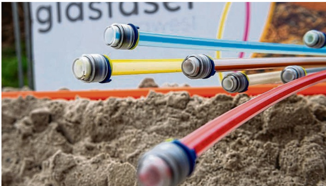
Seit 2019 sind die Glasfaserkabel der Breitband Nordhessen GmbH verlegt. Die Einnahmen aus der Vermietung des Netztes sind derzeit aber nicht ausreichend.

Laut BNG soll das Verfahren im Laufe des ersten Halbjahres abgeschlossen sein. Ziel sei, die Nutzung des Glas-