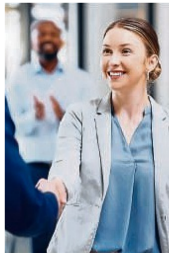
Ein fester Blickkontakt mit einem freundlichen Lächeln strahlt Selbstvertrauen und Interesse an der Kommunikation aus.