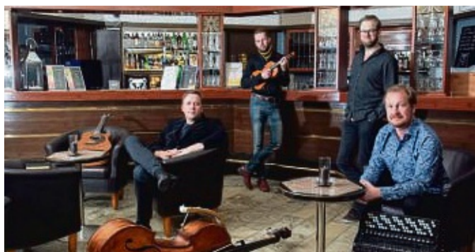
Tjango!: Die finnische Jazz-World-Gruppe spielt ihre Instrumente auf professionelle Weise.