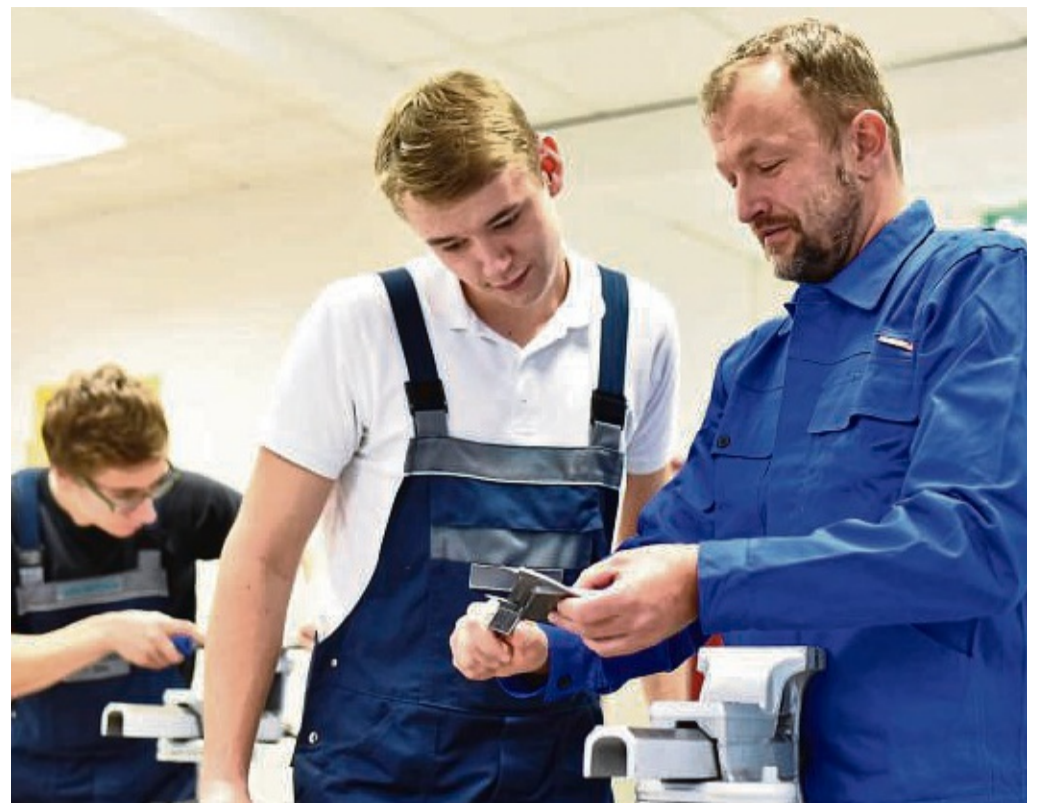
Wenn die Mitarbeitenden positiv über ihre Tätigkeiten, die Arbeitsatmosphäre und die Aufstiegschancen berichten, wird dies dazu führen, dass Auszubildende ein größeres Interesse an dem Unternehmen haben.

tem Selbstbewusstsein und Selbstüberschätzung: Wahre Stärke liegt darin, eigene Unvollkommenheiten zu akzeptieren, Kritik anzunehmen und auch mal über sich selbst zu lachen. Wer dagegen nach außen signalisiert, immer alles richtig zu machen, und Kritik an sich abgleiten lässt wie an einer Teflonbeschichtung, wirkt überheblich. Und arrogante Selbstüberschätzung kann ein echter Karrierekiller sein. txn