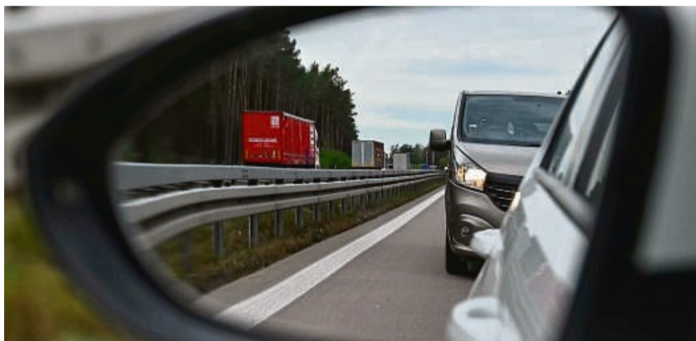
Drängler im Außenspiegel: Ausreichend Abstand zu halten, ist für die Sicherheit aller Verkehrsteilnehmer entscheidend.

Manche Autos haben Abstandsassistenten. Doch darauf sollte man sich nicht blind verlassen, und bestimmte Faustregeln kennen. Entscheidend dabei ist die Geschwindigkeit. Je schneller man fährt, umso größer muss der Sicherheitsabstand sein.