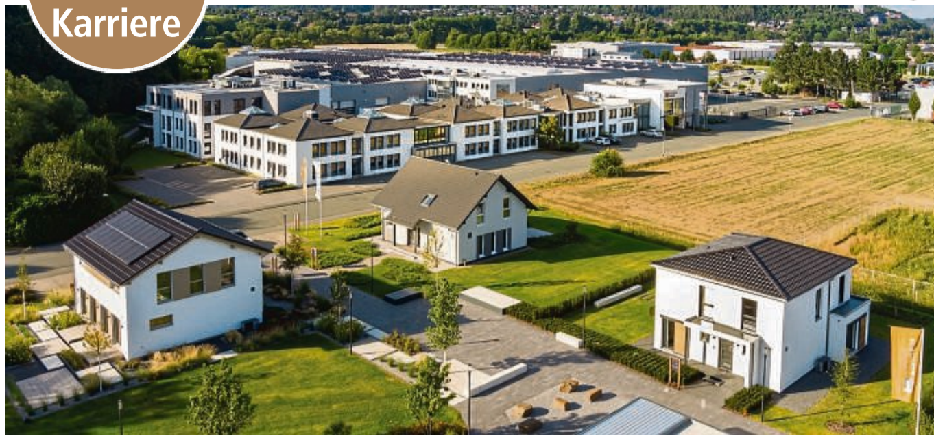
Der Fertighaushersteller FingerHaus bildet am Standort in Frankenberg derzeit in dreizehn verschiedenen Berufen aus.