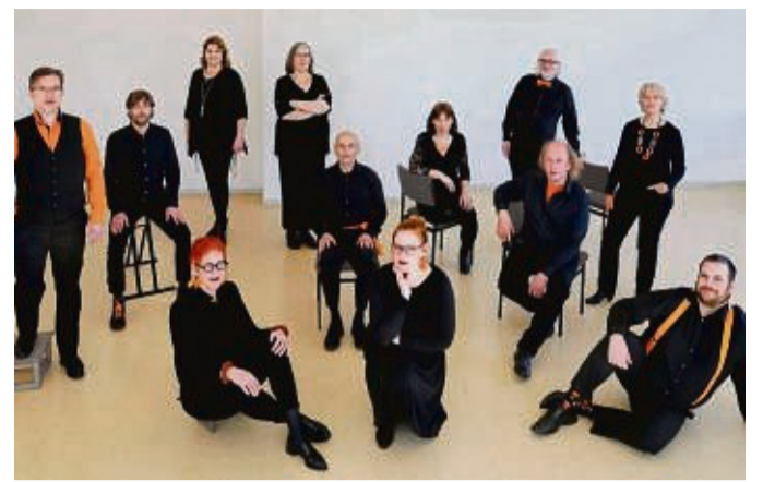
„Very British: Das Vokalensemble „Dodecanta“ präsentiert in der Flechtdorfer Klosterkirche Gesang aus Großbritannien aus verschiedenen Epochen.