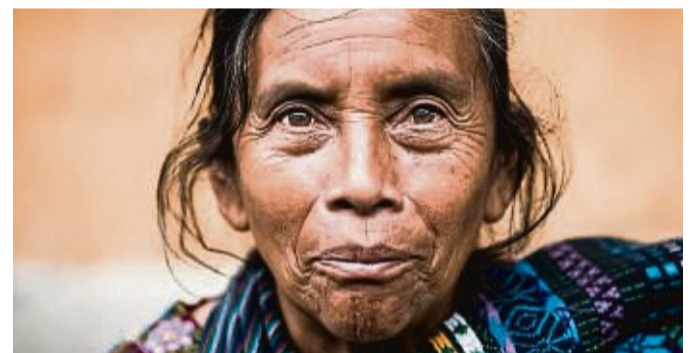
„Die Weisheit der Maya“ ist der Titel der Multivisionsshow des Fotografen Martin Engelmann, die das VHS-Kulturforum Korbach präsentiert.