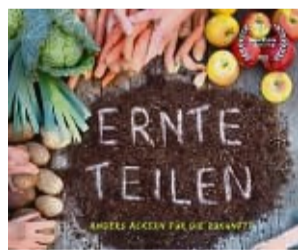
Ausschnitte aus dem Film „Ernte teilen“ werden gezeigt. FILMPLAKAT

Bei der solidarischen Landwirtschaft (SoLaWi) wird die Ernte geteilt. Das Prinzip: Mit einem festen monatlichen Beitrag tragen die Mitglieder der SoLaWi die Kosten der landwirtschaftlichen Tätigkeit und erhalten im Gegenzug ihren Anteil an den hergestellten Lebensmitteln, in dem Fall Gemüse.