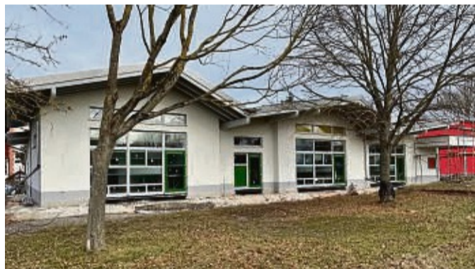
Der neue Kindergarten in der Südansicht: Große Fensterflächen des Gebäudes weisen auf die 2000 Quadratmeter große Außenspielfläche der Kindertagesstätte in der Kasseler Straße.

Verkehrskonzept vor dem neuen Kindergarten wird diskutiert