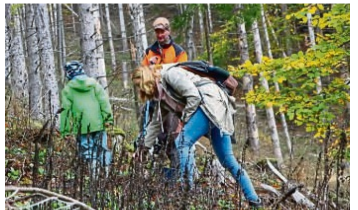
Heimische Bäume sollen am 24. Februar im Wald an der Burg Hessenstein gepflanzt werden.

Die Pflanzaktion beginnt am Samstag, 24. Februar, um 9 Uhr an der Burg Hessenstein. Im Laufe des Vormittags werden an verschiedenen Stellen im Wald neue Bäume gepflanzt. Am späten Mittag lädt das Burgteam alle