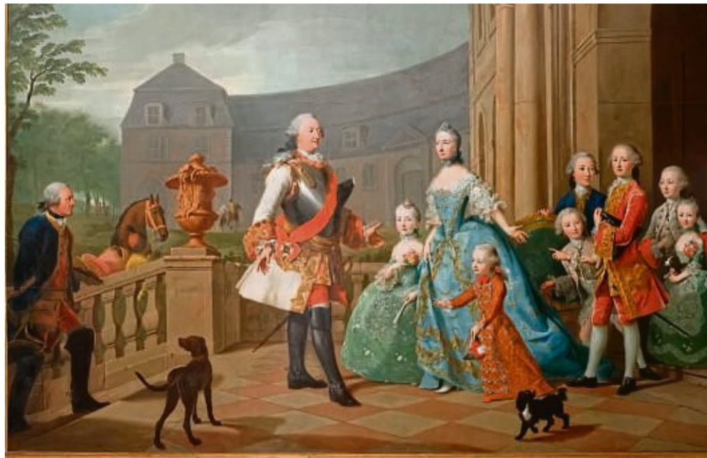
Gemälde aus dem Arolser Schloss: Johann Heinrich Tischbein d. Ä. hat den Fürsten Carl von Waldeck und Pyrmont und seine Familie 1757 in Öl auf Leinwand porträtiert.

Der Verein ruft die Bewohner des Landkreises, vor allem die Waldecker auf, in ihren privaten Beständen nachzuforschen, ob dort noch bisher unbekannte Tischbein-Werke – Gemälde, Zeichnungen, Stiche oder Radierungen – vorhanden sind. Diese soll-