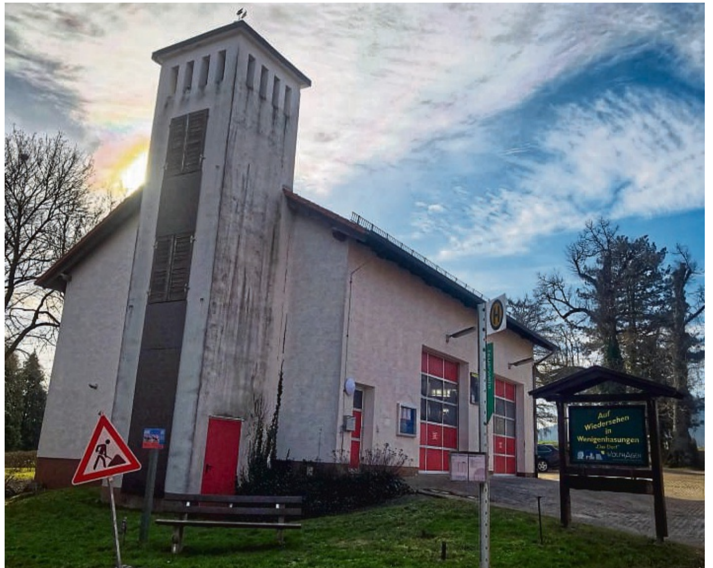
Statt Sanierung zweier alter Gebäude soll ein Neubau her: Der soll die Gerätehäuser in Wenigenhasungen (Foto) und Altenhasungen ersetzen.

Sollte es zum Bau eines modernen Feuerwehrgerätehauses kommen, will die Stadt Wolfhagen die beiden alten Gebäude für eine gewerbliche Nutzung auf dem Markt anbieten.