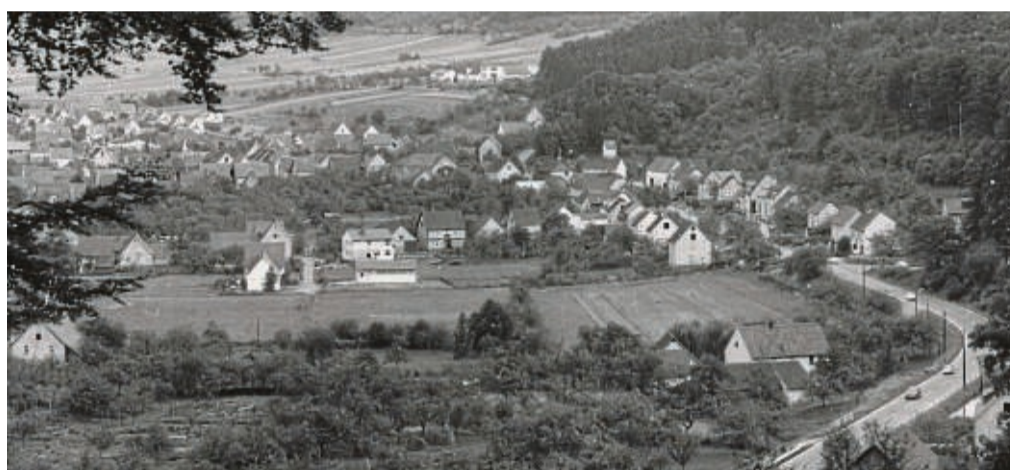
Historisches Foto: Ortsansicht Gieselwerder B 80 um 1960, aufgenommen von der Sticklen Halbe.