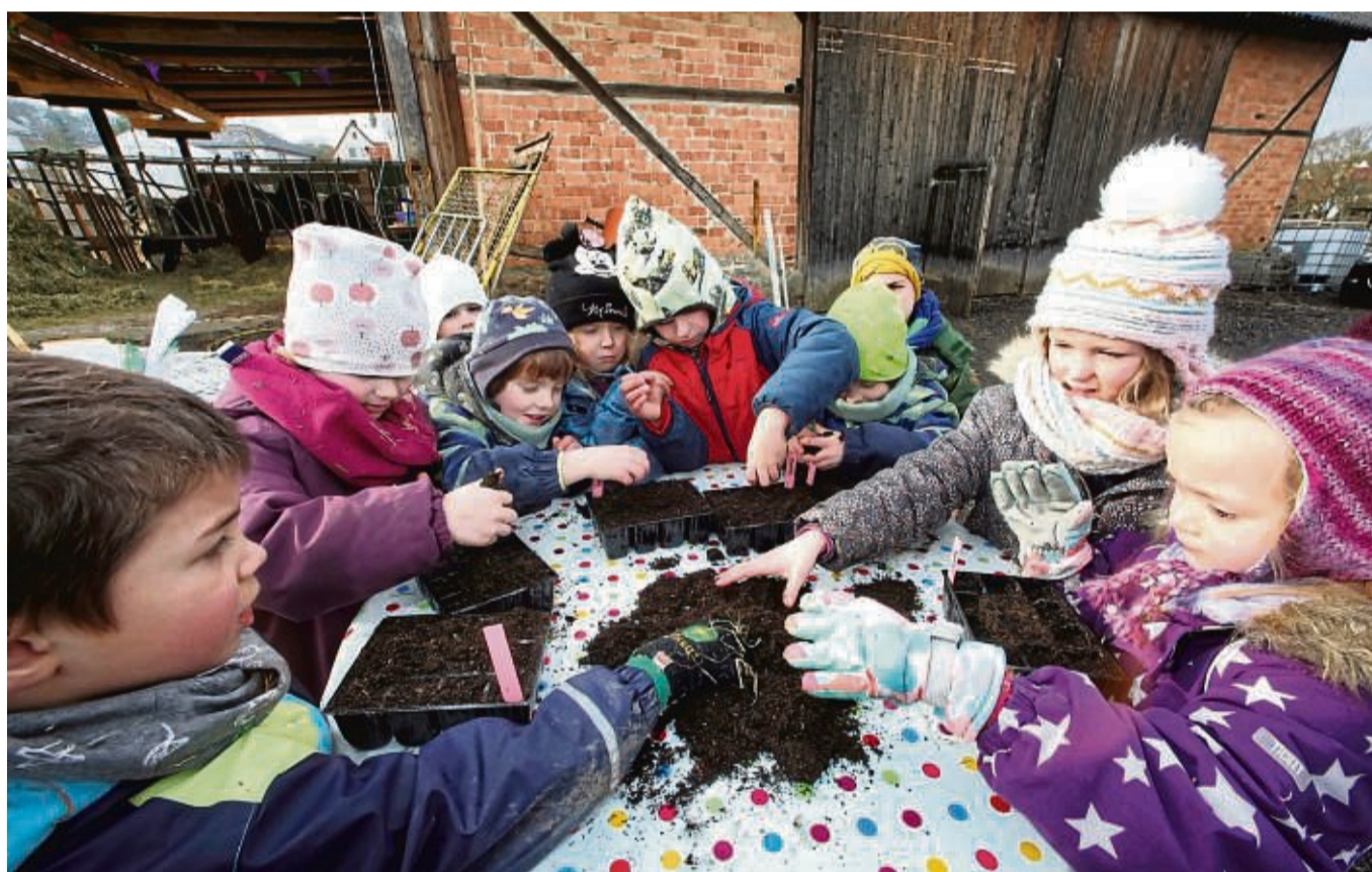
Kleine Gärtner: Am letzten Tag des Projekts pflanzten die Kinder Gemüse-Sämlinge in Vorziehkästchen, die sie mit nach Hause nehmen durften.

Bis in den Herbst beschäftigten sich die Mädchen und Jungen auch mit den rund 250 Enten und Gänsen, die