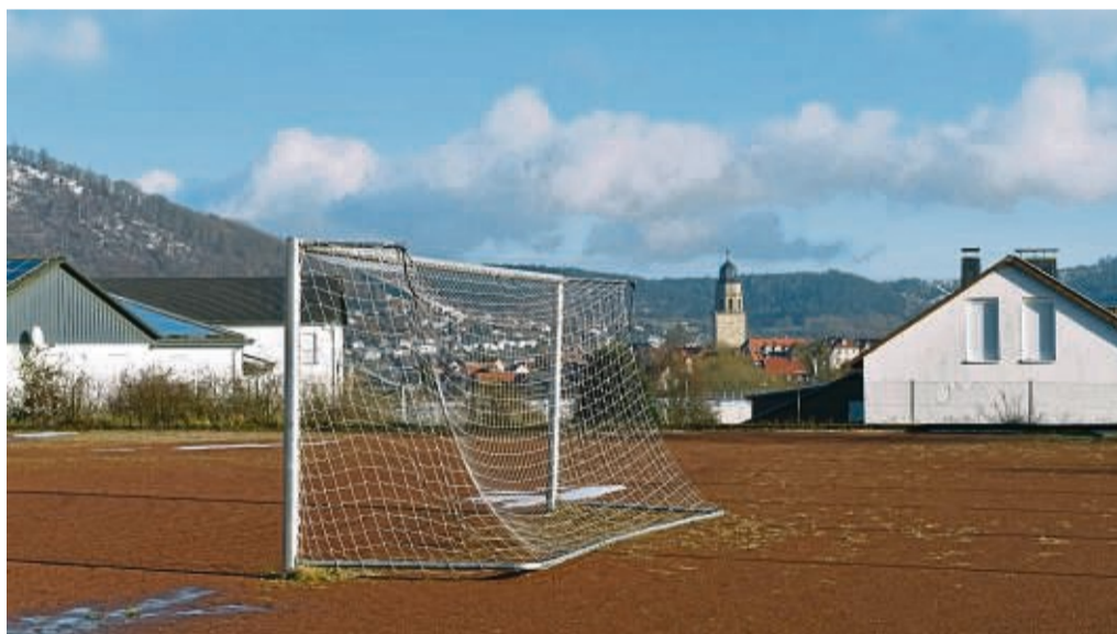
Hartplatz an der August-Gerhold-Kampfbahn am Stiegweg: Hier soll bis zum Sommer ein Kunstrasenplatz gebaut werden.