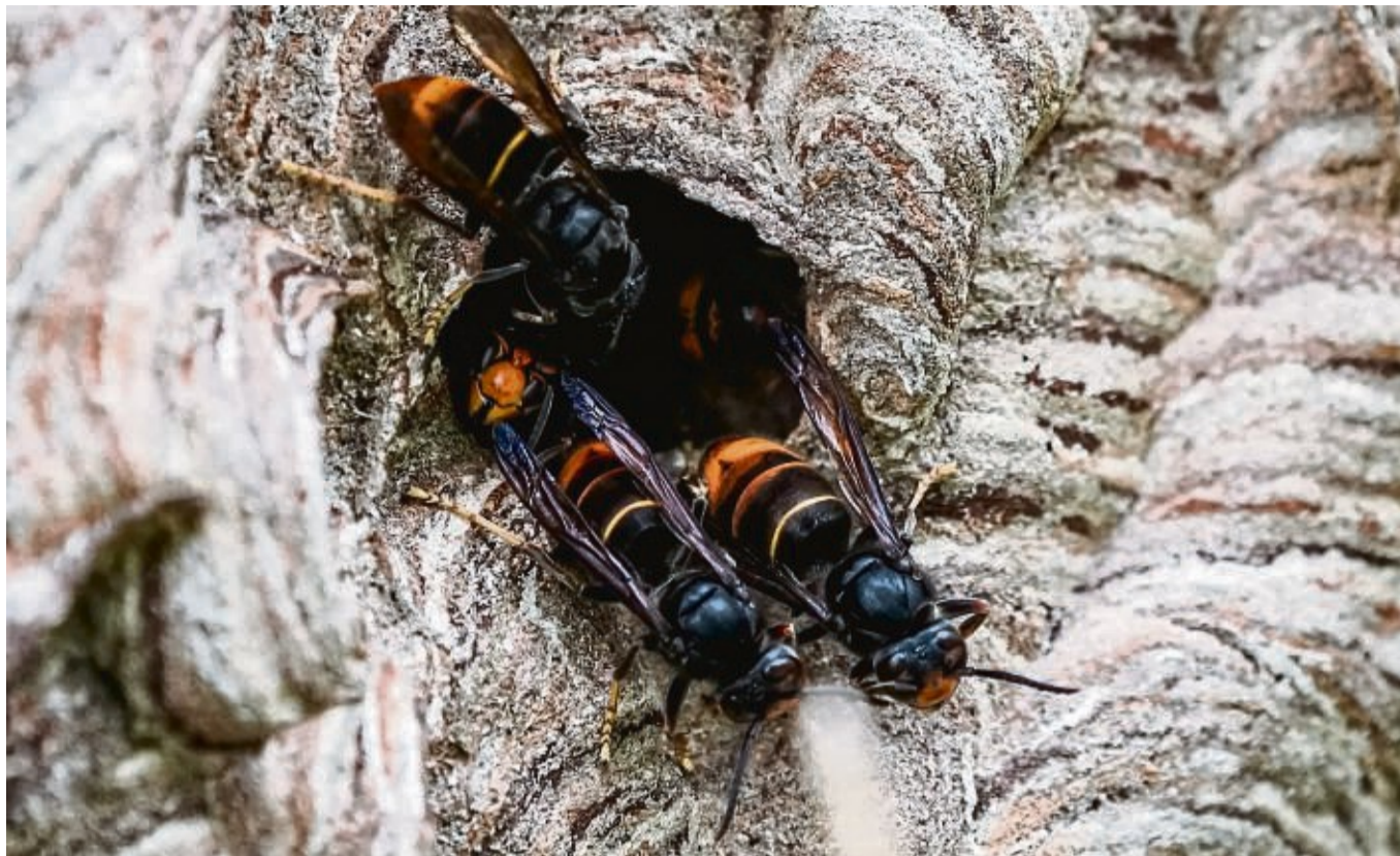
Die invasiven Asiatischen Hornissen ( Vespa velutina nigrithorax ) sind ein Problem für Bienen. Die Imker machen sich wegen der rasanten Ausbreitung große Sorgen. Das Foto entstand in Rheinland-Pfalz.