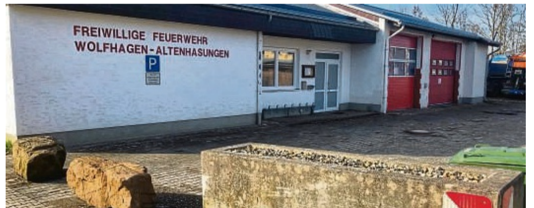
Beengte Verhältnisse: Gleich neben dem Feuerwehrgerätehaus in Altenhasungen befindet sich ein großes Transportunternehmen. Dessen Fahrzeuge sind oft rund um das Gerätehaus abgestellt.

Der fortgeschriebene Bedarfs- und Entwicklungsplan, den Wolfhagens Stadtparlament im Mai vergangenen Jahres einstimmig beschlossen hatte, sieht bis zum Jahr 2028 Investitionen in Höhe von 5,4 Millionen Euro in die Infrastruktur aller Feuerwehren vor. Ein Großteil des Geldes wird für die Sanierung von Feuerwehrgebäuden benötigt.