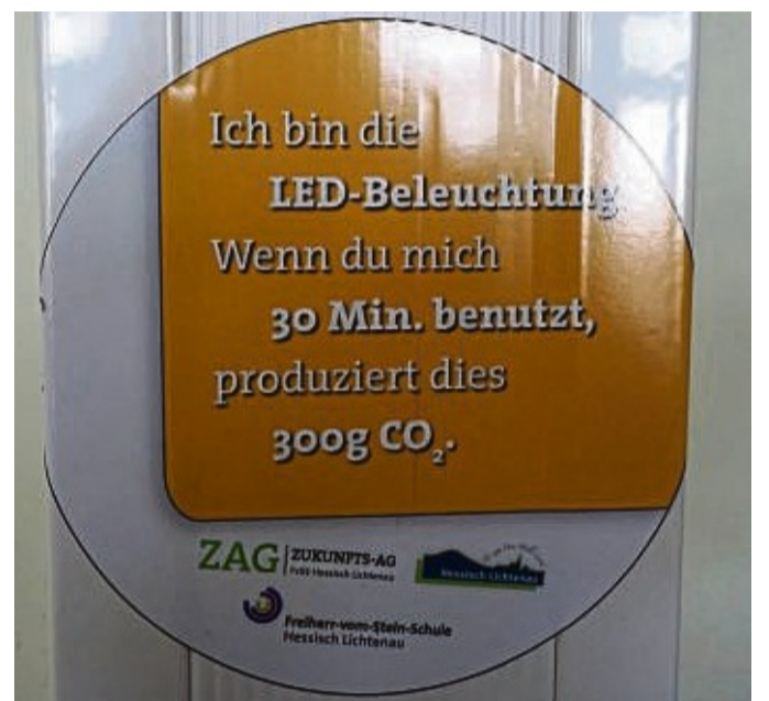
Diese Sticker brachten sie zum Gewinn: die Zukunft's-AG berechnete die CO 2 -Produktion der Lampen für eine halbe Stunde.