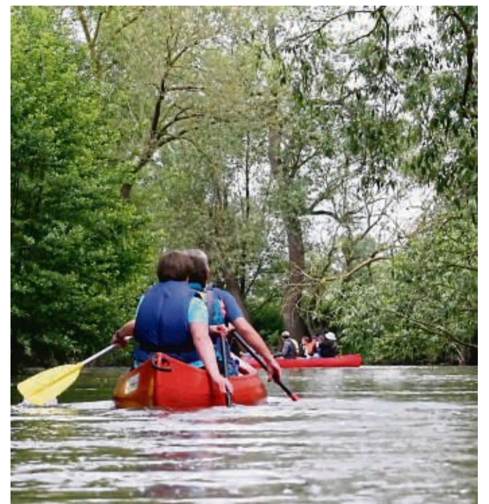
Ein Kanu-Wochenende ist ab dem 21. Juni geplant (Symbolbild).