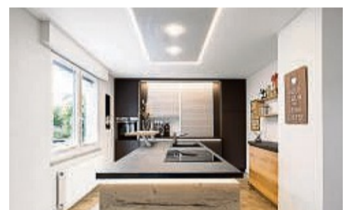
Die richtige Deckengestaltung für Ihre Küche

sind so vielseitig, dass du sie harmonisch jedem Wohnstil anpassen kannst. Wohn-, Schlaf- und Esszimmer sowie Küche, Flur und Bad erhalten damit schnell ein neues Gesicht. Montiert werden sie einfach unterhalb der vorhandenen Decke. Kein ausräumen nötig, lediglich die Möbel wer-