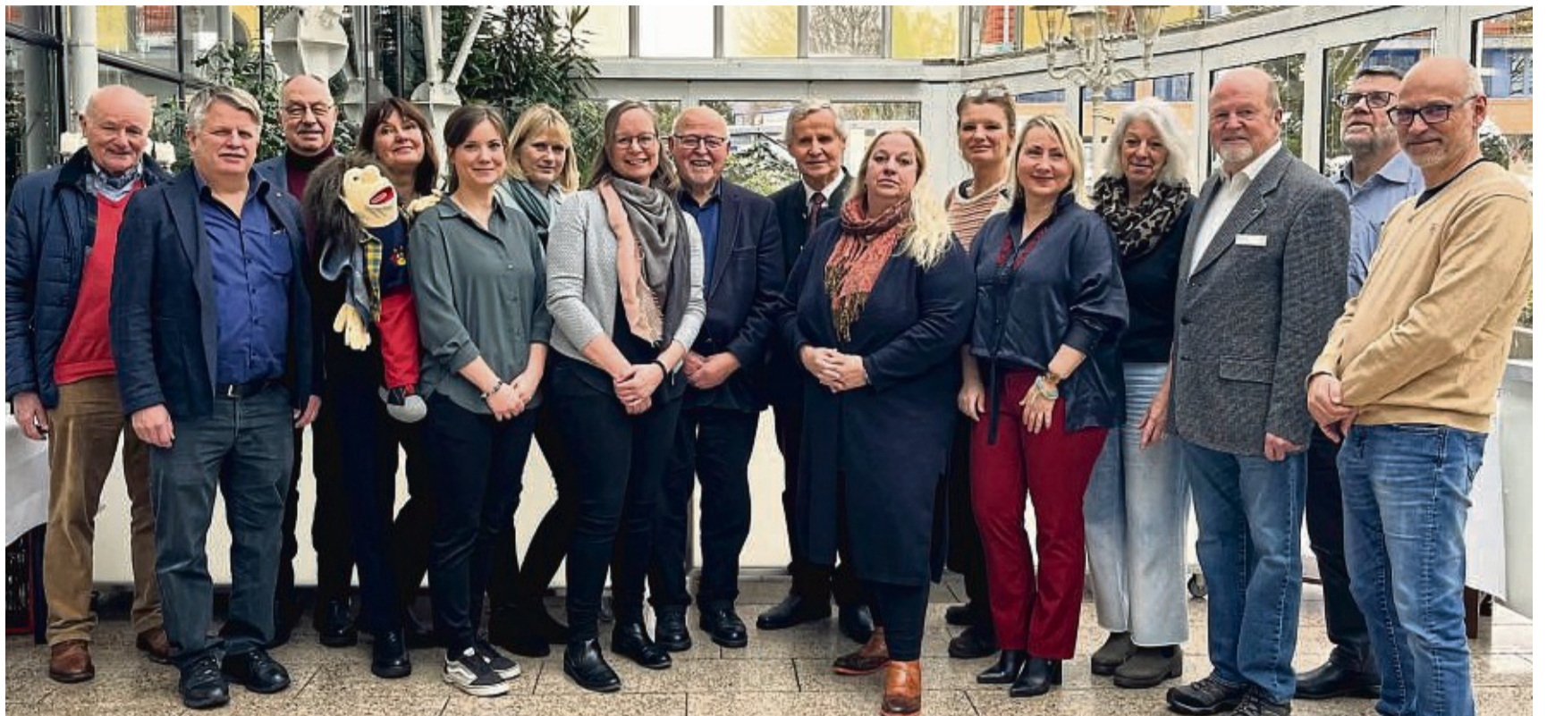
Die Mitglieder des Rotary Clubs Göttingen-Hann. Münden übergaben die Spenden des Jahres 2023 symbolisch an Vertreter verschiedener Organisationen und Institutionen im Göttinger Hotel Freizeit In.

Somit gingen im vergangenen Jahr Spenden in Höhe von 22 000 Euro an die Ukrainehilfe für Medikamente, Verbandmaterial und medizinische Geräte an ein Krankenhaus in Lwiw in der Westukraine. Außerdem erhielt der Verein „Brepal“ zur Finanzierung von zwei Augencamps in Nepal 7000 Euro. Hierbei untersucht ein augenärztliches Team in völlig abgelegenen und medizi-