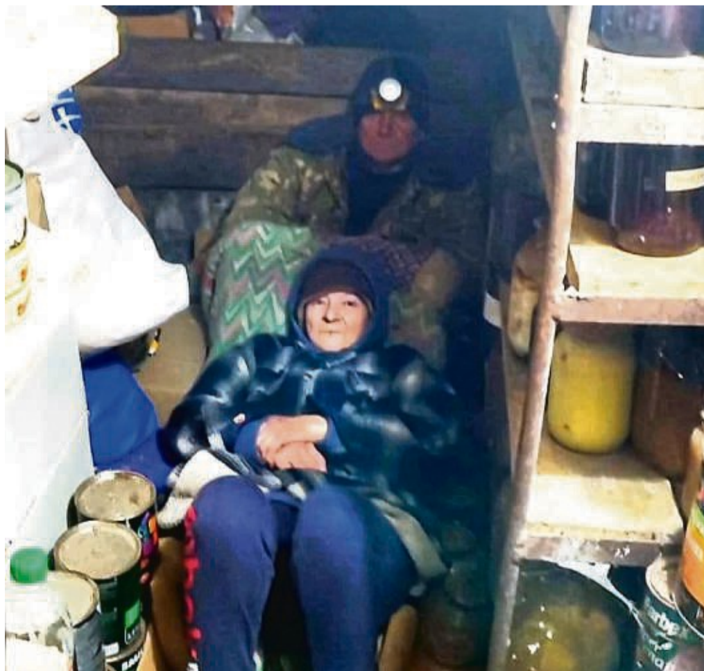
Ohne Strom und Heizung müssen Menschen in der Ukraine seit Monaten in ihren Kellern ausharren.