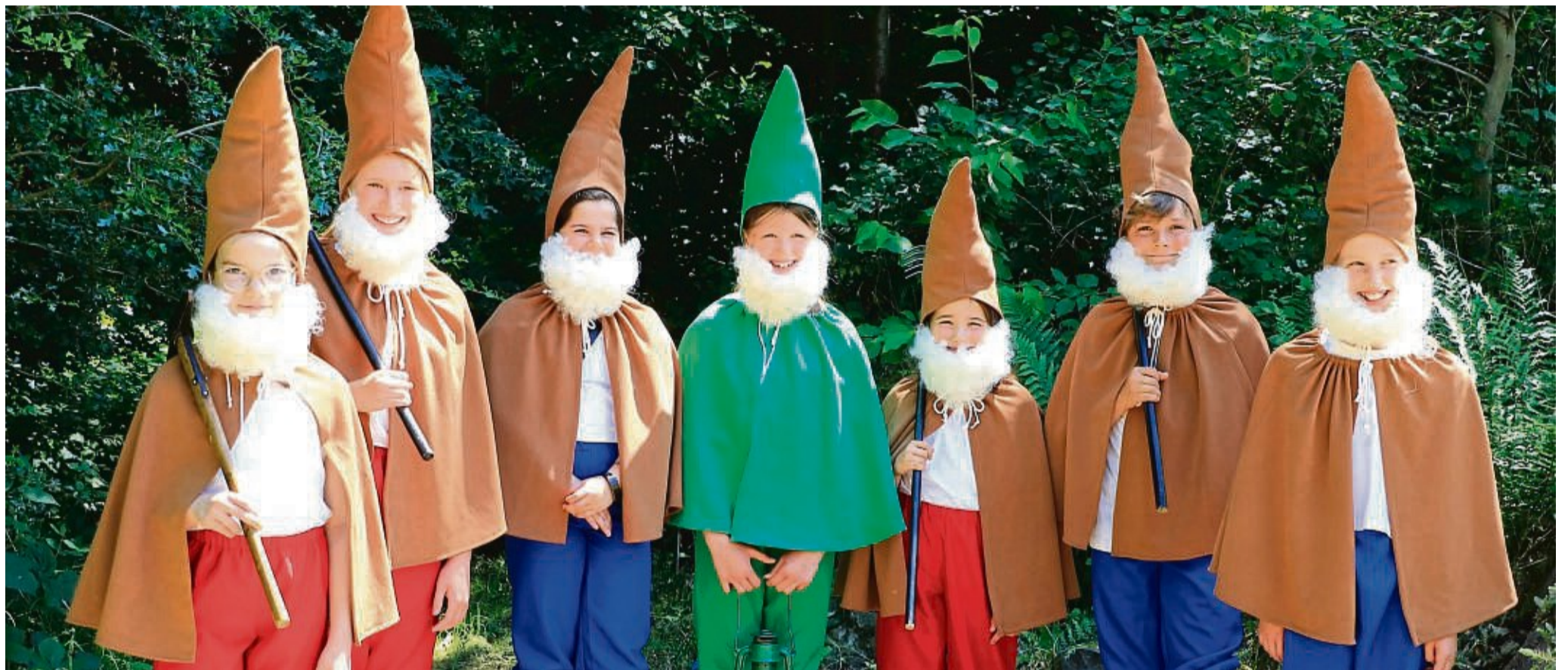
Aushängeschild: Ohne die Wichtel geht nichts beim Reichensächser Heimatfest. Bis März können sich „Alt-Wichtel“ bei der Gemeindeverwaltung melden.