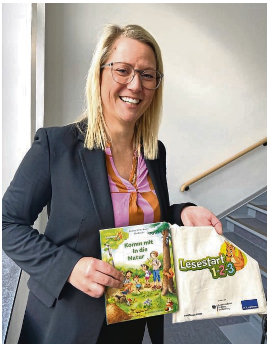
Landrätin Nicole Rathgeber unterstützt das Leseförderprogramm.

Aktions- und Basteltipps und viele weitere Informationen über „Lesestart 1-2-3“ auf lesestart.de .