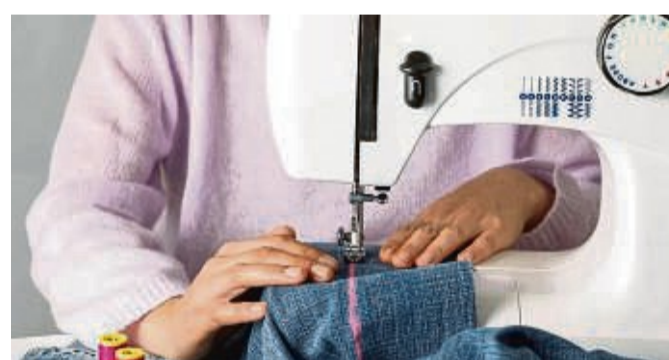
Kreativ werden beim Nähen – und dabei gute Gespräche führen: das geht bald in Herleshausen.