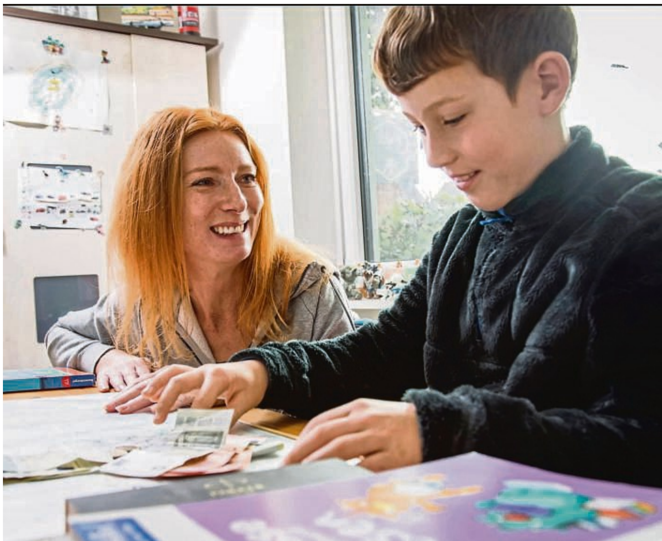
Früh übt sich: Wenn Eltern ihre Kinder beim Umgang mit Geld an die Hand nehmen, haben sie bessere Startvoraussetzungen.