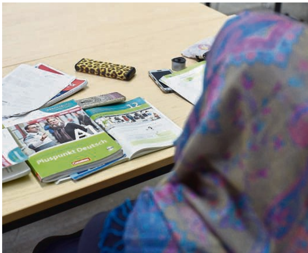
Ein Integrationskurs kann erster Anlaufpunkt sein, um Deutschkenntnisse für den Beruf zu erlangen.

Infos zu den Kursen gibt es auf der Website des BAMF. Wer allgemeine Fragen zu den Integrationskursen hat, kann sich an den Bürgerser-