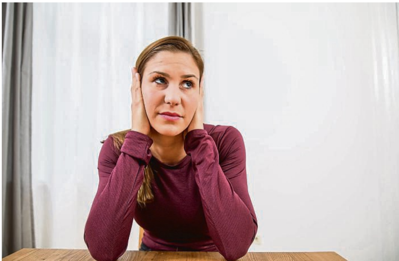
Gerade im Mehrfamilienhaus hört man oft mehr von den Nachbarn als einem lieb ist.

Glatte Flächen wie Fliesen, Betonwände, Glas, Laminat oder Terrazzoboden verstärken die Geräusche in der Wohnung, denn die Schallwellen werden von diesen