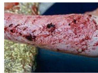
Unser Symbolbild zeigt, wie eine Brandverletzung am Unterarm aussehen kann. Entstanden ist es bei einer Übung der DLRG in Niestetal.

Die Johanniter frischen die Erste-Hilfe-Kenntnisse der Besucher auf. Der Einsatz von Feuerlöschern konnte ausprobiert werden. Außerdem hatten die Besucher die Möglichkeit, einen Notruf abzusetzen. Wer wollte, konnte die Ausstattung eines DRK-Rettungswagens unter die Lu-