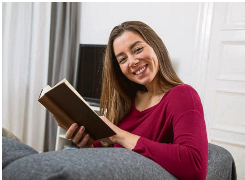
Ein bewusster Verzicht auf Social Media verleiht nicht nur ein zufriedenes Gesicht, sondern stärkt auch das Gefühl, das eigene Leben selbst in der Hand zu haben.

Fasten ist nicht gleich fasten. Es gibt Menschen, die