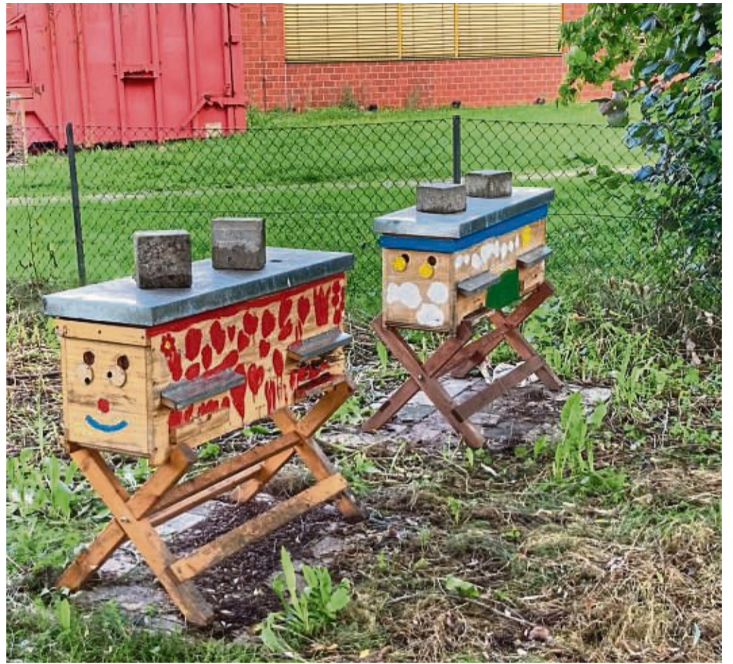
Selbst gebaut: Die Imkerei-AG der Käthe-Kollwitz-Schule kümmert sich um zwei Bienenvölker.

Zusätzlich habe die Gemeinnützige Arbeitsförde-