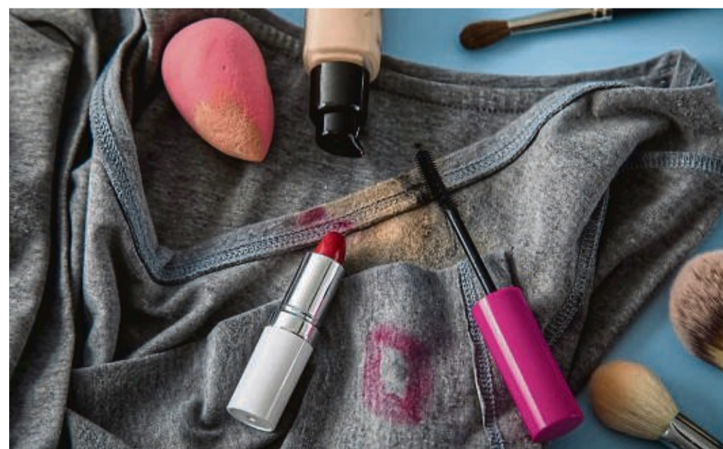
Make-up Flecken auf dem T-Shirt? Dieses Hausmittel soll helfen.