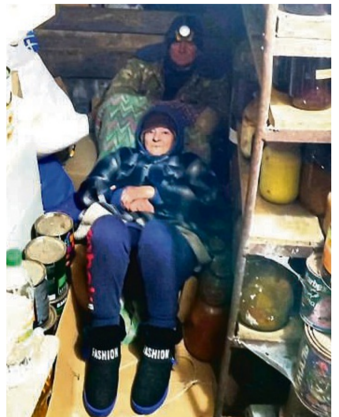
Ohne Strom und Heizung müssen Menschen in der Ukraine seit Monaten in ihren Kellern ausharren. Dieses Foto erhielt Ingrid Rathgeber aus dem kriegsgebeutelten Land.