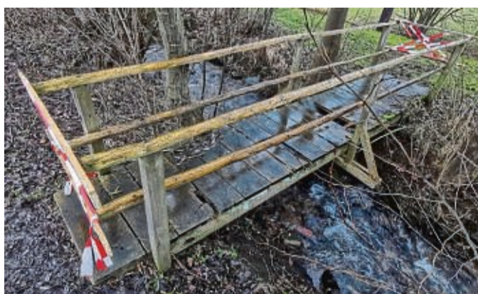
Am Wilhelmshäuser Bach in Roßbach besteht akuter Handlungsbedarf. Unter anderem soll die bereits gesperrte Holzbrücke in Höhe des Spielplatzes in der Unteren Bachstraße entfernt werden.

„Bei ansteigendem Wasserpegel ist der reibungslose Abfluss schon lange nicht mehr gewährleistet“, sagte Lück. Dass sei jedoch zwingend erforderlich, handele es sich bei dem Bach doch um einen sogenannten Hauptfließpfad. „Umso glücklicher sind wir jetzt über die Zusicherung seitens der Stadt, dass das