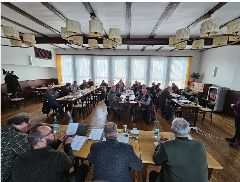
... und interessierte Zuhörer zur Jahrestagung der IG Muffel