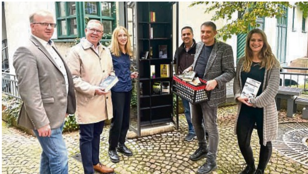
Im Oktober erst war der Bücherschrank seiner Bestimmung übergeben worden.

In der Stadt herrsche große Betroffenheit nach dem Motto „was kann man heutzutage überhaupt noch anbieten?“, so die Stadt weiter. Sie erinnert daran, viele Engagement nötig war, um den öffentlich zugänglichen Schrank im Freien vor drei Monaten letztlich zu installieren. Das Wochenende, an dem Unbekannte den Schrank anzündeten und damit zerstörten, habe, so die Stadt, „auf traurige Weise bewiesen, dass Vandalismus und Kriminalität in der Kurstadt ein bedrohliches Ausmaß angenommen haben“. Überall scheine das System eines öffentlich zugänglichen Bücherschranks ohne Probleme zu funktionieren. „Überall, nur nicht in Bad Wildungen. Das ist die Lehre, die man aus dem offensichtlich gescheiterten Projekt zie-