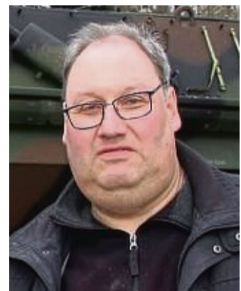
„Die Geschichte der Weserpioniere der Bundeswehr“ ist das neueste Buch von Uwe Walter.