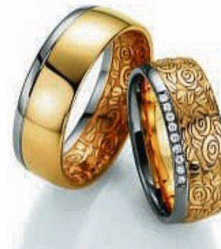
Florale Muster sorgen für einen zauberhaften Look.