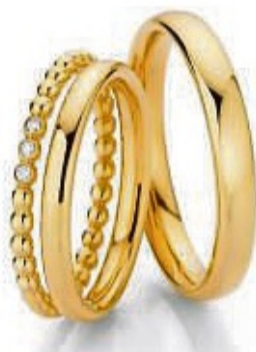
Ein Beisteckring oder Schmuckring sorgt für Abwechslung.