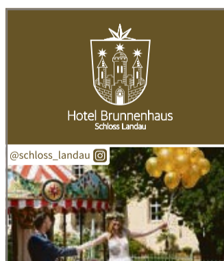
Hotel Brunnenhaus Schloß Landau @schloss_landau