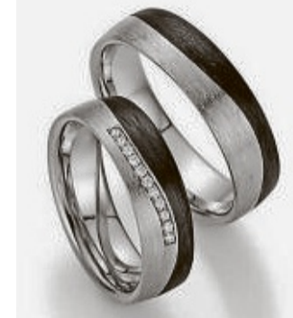
Schwarze Elemente aus Carbon bilden einen reizvollen Kontrast.

lich. Auf dieser Seite stellen wir die Trends für die Hochzeitssaison 2024 vor.