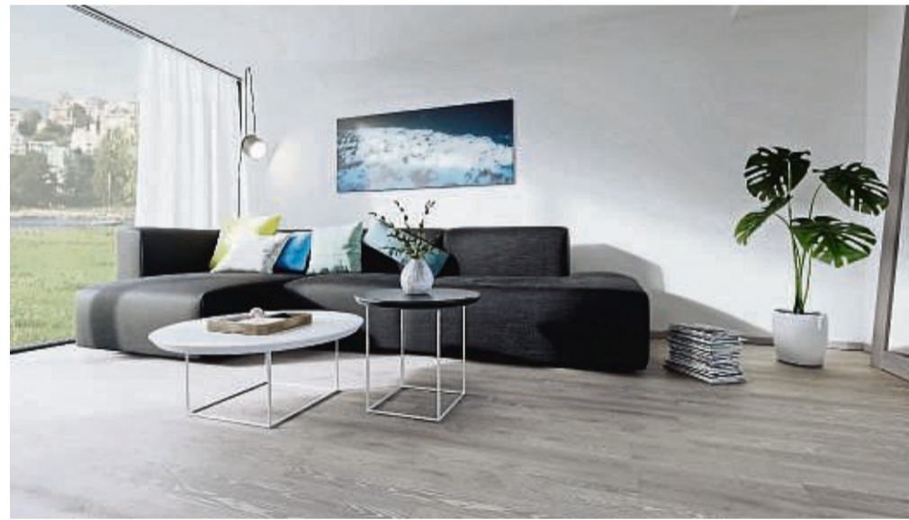
Landhausdielen mit Öl-Beize in den Farbtönen Silbergrau und Weiß in der Duo-Ton-Technik behandelt. Auf einer strukturierten Oberfläche werden zwei Farbtöne kombiniert.

Einen besonderen Farbtrend beobachten die Experten in London: In der englischen Hauptstadt werden intensiv schwarz gefärbte Parkettböden immer beliebter. „Das ist ein starkes Designstatement, sei es in Gewerbeimmobilien oder in den ei-