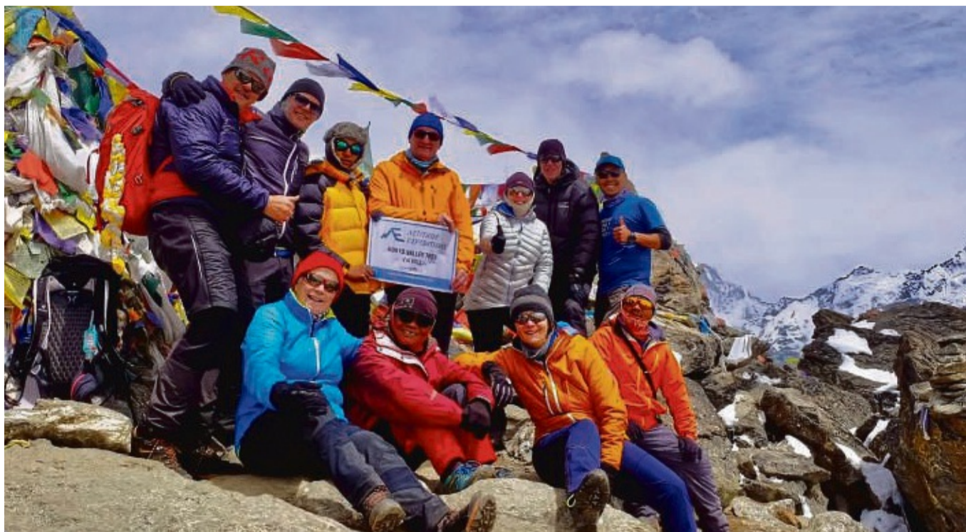
Lions-Freunde des Lions-Clubs Korbach-Bad Arolsen haben das Dorf Waku Hill in Nepal besucht, um sich über den Einsatz der Spenden ein Bild zu machen und anschließend auf Trecking-Tour zu gehen.