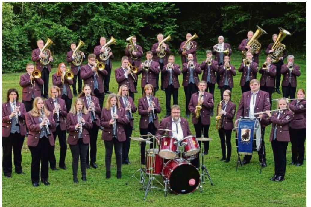
Abwechslungsreiches Programm: Der Musikverein Rhena lädt zu seinem Frühjahrskonzert in der Korbacher Stadthalle ein. Karten gibt es im Vorverkauf.

Im Programm sind neben zahlreichen neuen Polkas und Märschen auch moderne Arrangements. Mit Stücken wie „Jump and Joy“, „Forever young“ und dem Medley „James Last Golden Hits“ bietet der Musikverein eine musikalische Auswahl für jeden Geschmack an. Die jüngsten Musiker aus der Jugendgruppe gestalten den Auftakt des Konzertes. Zudem stellt sich die kürzlich gegründete neue Jugendgruppe vor. Durch das Programm