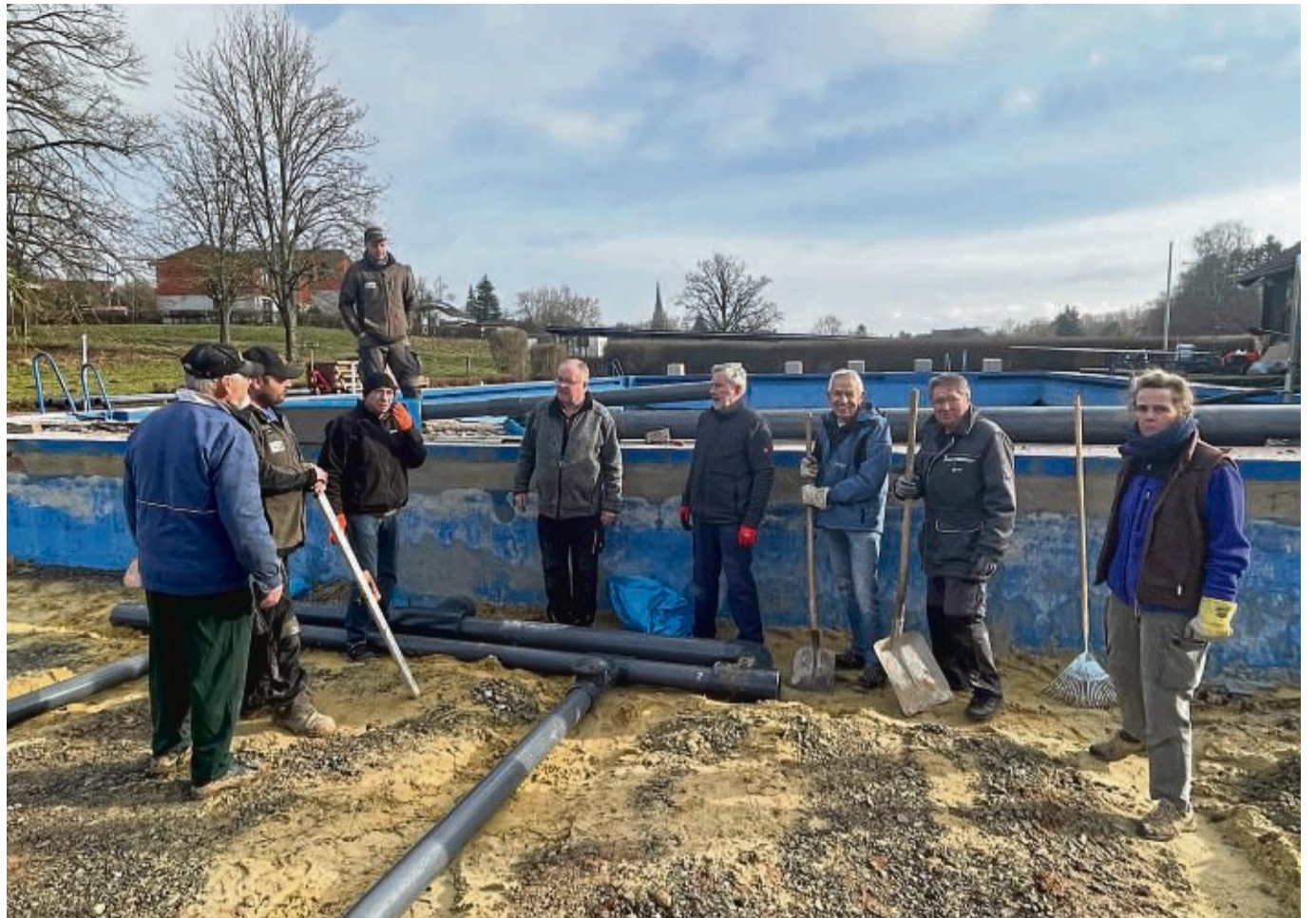
Der Teufel steckt im Detail: Die freiwilligen Helfer verlegen im Nichtschwimmerbecken derzeit das Rohrsystem für die Bodendüsen. Hier ist Präzision gefragt, damit alles in Waage liegt. FOTOS: HEIKE SAURE

Im Vorranggebiet KB 24 gibt es bereits sechs Bestandsanlagen. red