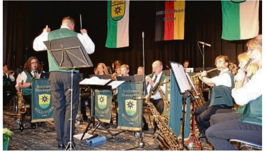
Zwei Kapellen in einem Konzert: Der Musikverein Rhenia (links) und die Schützenblaskapelle Willingen kehren am 21. April zum Blasmusikfrühschoppen in die Usselner Schützenhalle zurück.

Willingen-Usseln – Der Blasmusikfrühschoppen, zu dem die Usselner Schützengesellschaft am Sonntag, 21. April, in der Schützenhalle werden bei „Marsch-Marsch“ wieder viel Musik, beste Verpflegung und gute Laune versprochen.