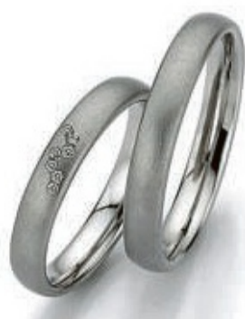
Filigrane Trauringe sind zeitlos und top in Sachen Preis-Leistung.

Individualität hat bei der Suche nach den passenden Ringen eine sehr hohe Priorität. Geschmäcker sind eben verschieden. Vom klassischen Goldring über kunstvoll gewundene und verzierte Schmuckstücke bis hin zu Ringen mit besonderen Farbgebungen und Materialmischen ist vieles mög-