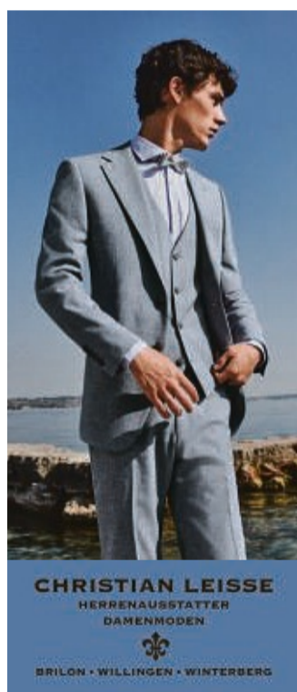
CHRISTIAN LEISSE HERRENAUSSTATTER DAMENMODEN BRILON • WILLINGEN • WINTERBERG