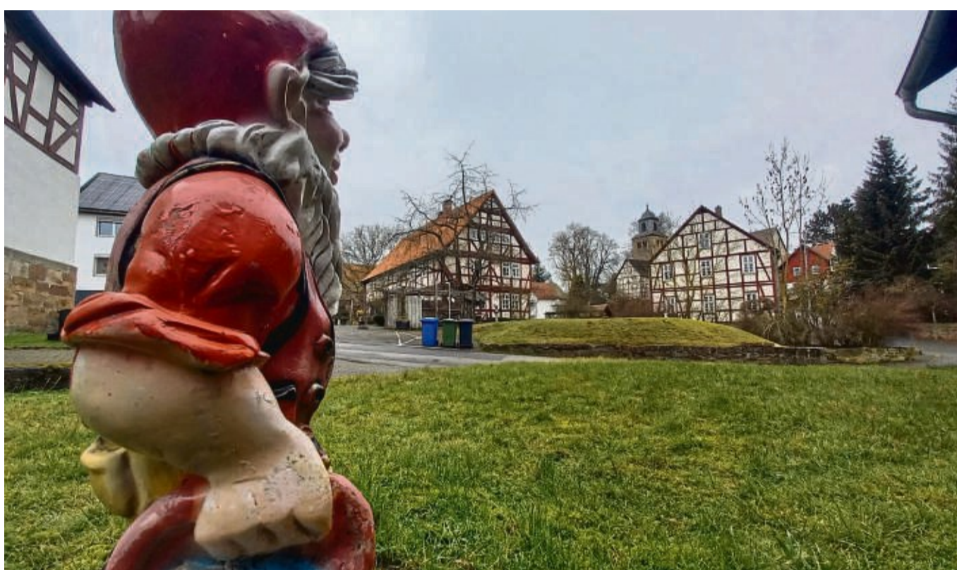
Die Ärmel hochkrepeln , um die Zukunftsaussichten zu verbessern heißt es in Waldeck. In Netze etwa (unser Bild) zählt zu den Ortsteilen mit den höchsten Leerstandsquoten in der Stadt.

Das beauftragte Büro für das nötige Konzept der Stadt hat eine breit angelegte Bestandsaufnahme der Lage Waldecks und Perspektiven für die Entwicklung aller Stadtteile entworfen – mit Ausnahme von Waldeck und Sachsenhausen, denn in diesen beiden Stadtteilen läuft gerade das Förderprogramm „Aktive Kernbereiche“. Der umgestaltete Waldecker Markt ist das bekannteste Projekt. Die Vorgehensweise bei den „Aktiven Kernbe-