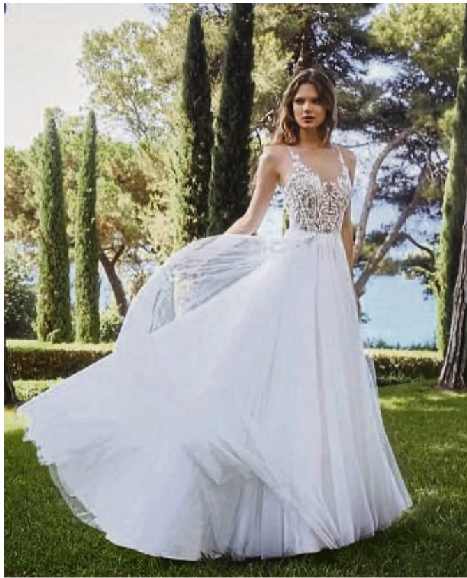
Exquisite Brautkleider in sanften Creme-Tönen mit aufwendigen Verzierungen und sexy Akzenten stehen in dieser Saison im Fokus.

Den aufregenden und eleganten Stil der Lilly-Brautmodenkollektionen unterstreichen auch tiefe V-Ausschnitte und interessante Cut-outs am Rücken und den Seitenpartien. Zarte Tulpenärmel, transpa-