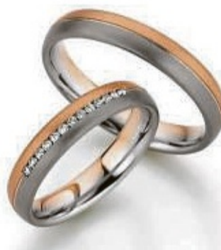
Mehrfarbige Trauringe ermöglichen zahlreiche Kombinationen.