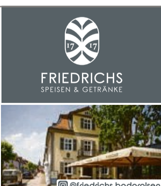
FRIEDRICHS SPEISEN & GETRÄNKE @friedrichs_badarolsen

Auf Schloss Landau verleihen Sie Ihrer Hochzeit einen glanzvollen Auftritt in historischem Ambiente. Mit viel Erfahrung stehen wir Ihnen bei der Planung zur Seite. Wir freuen uns auf Sie!