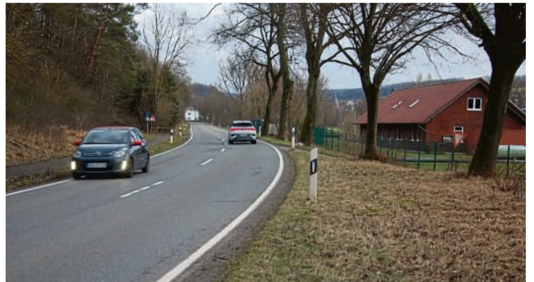
Nach dem tödlichen Unfall an der Adorfer Kläranlage: Die Gemeinde macht einen neuen Versuch, um auf der Landesstraße 3076 nach Padberg ein Tempolimit zu bekommen.