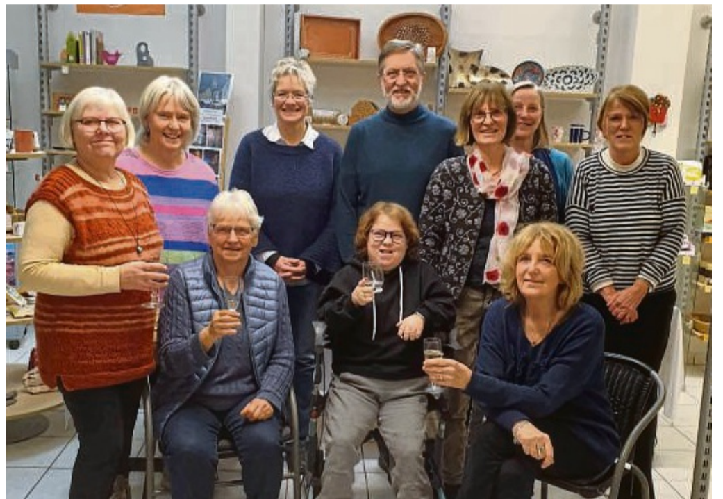
Die Vorstandsmitglieder des Weltladens mit einem Teil der aktuellen Mitarbeiterinnen.