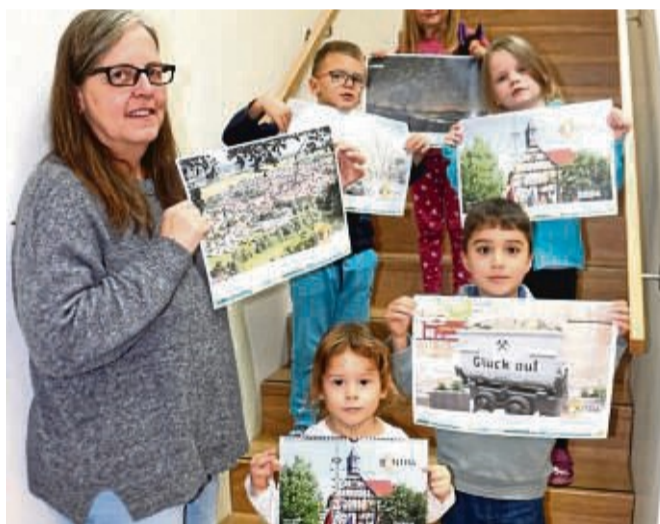
Fotowettbewerb: Aufruf an alle Sontraer Hobby-Fotografen: Senden Sie uns – wie es im vergangenen Jahr die katholische Kinderstätte getan hat – viele eindrucksvolle Fotos.

haben im vergangenen Jahr die Kinder der katholischen Kindertagesstätte bewiesen, deren Bild im Kalender veröffentlicht wurde. Gefragt sind Aufnahmen von unvergesslichen Momenten, nachhaltigen Begegnungen, prägenden Gebäuden und Landschaften zu allen Jahreszeiten. Alle Sontraer Bürgerinnen und Bürger können ihre Fotos bis zum 31. Juli 2024 per E-Mail an die Stadtverwaltung Sontra, bianca.schmidt@sontra.de, senden. Jede Person kann nur maximal 10 Fotos mit unterschiedlichen Motiven einreichen, um möglichst vielen Bürgerinnen und Bürgern die Teilnahme zu ermöglichen. Die Bilder sollen im Querformat sein und eine Größe von mindestens 2,5 MB (Auflösung 300 dpi) besitzen. Teilen Sie uns Namen, Anschrift und Telefonnummer mit und machen Sie Angaben, wo und wann das Bild entstanden ist und wie der Bildtitel lauten sollte. Wir freuen uns auf zahlreiche und beeindruckende Bildeinsendungen, die wir erneut für einen Fotokalender verwenden möchten.