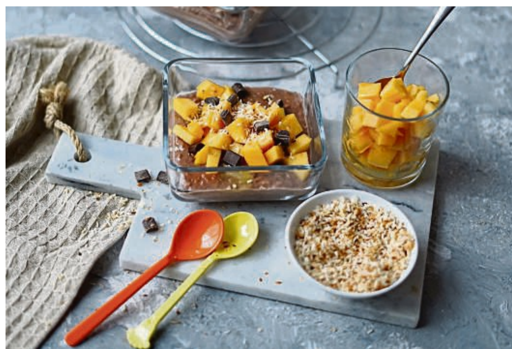
Während die schokoladigen Pudding-Oats schon am Vorabend zubereitet werden, kommt das Kaki-Topping frisch am Morgen dazu.

Wenn die Oats nicht sofort gegessen werden, lasse ich die Toppings extra und gebe sie erst morgens auf die Oats. Also fülle ich die Oats gleich in Glasbehälter mit gut verschließbarem Deckel, so muss morgens nur noch das Topping dazu und fertig ist das perfekte Bürofrühstück.