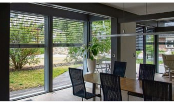
Ist der zweite Rettungsweg mit einem elektrisch betriebenen Rollläden ausgestattet, kann man einen Pufferakku einsetzen lassen, mit dem sich der Rollläden bei einem Stromausfall öffnen lässt.