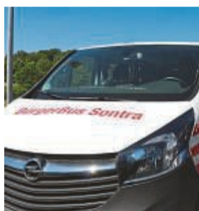
Bürgerbus Sontra: Fahrten am Mittwoch und Freitag auf Abruf

Sontra – Seit eineinhalb Jahren fährt der Bürgerbus Sontra bereits bei Bedarf und nach vorheriger telefonischer Anmeldung in der Stadtverwaltung immer mittwochs und freitags in der Zeit von 10 bis 13 Uhr seine wöchentliche Tour. Mit diesem geänderten Angebot wollte man flexibler auf die Wünsche der Fahrgäste reagieren und unnütze Leerfahrten bei einem festgelegten Fahrplan vermeiden. Der Bürgerbus ergänzt das Angebot des öffentlichen Personennahverkehrs und soll insbesondere Menschen, die selbst nicht mehr oder nur eingeschränkt mobil sind, einen kostenlosen Fahrservice bieten, um zum Beispiel einzukaufen und Arzt- oder Behördentermine wahrzunehmen. Gefahren wird der Bürgerbus von ehrenamtlichen Fahrerinnen und Fahrern. Zusätzlich gibt es vom LIDL-Parkplatz Sontra