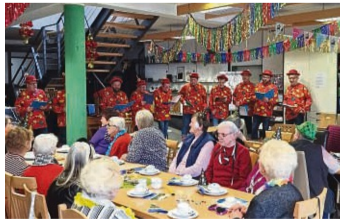
Viele Sontraerinnen und Sontraer waren zum Karnevalfeiern in die Bürgerhilfe gekommen.

Die Bürgerhilfe Sontra möchte sich ganz herzlich bei den Hänselsängern und Hänselfrauen für deren Auftritt bedanken.