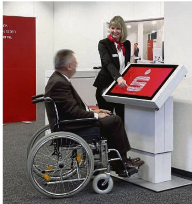
Für Rollstuhlfahrer ist es wichtig, dass sie einen Bankschalter oder einen Geldautomaten unterfahren können.

Für die Barrierefreiheit im Internet gibt es schon jetzt internationale Richtlinien, die sogenannten Web Content Accessibility Guidelines (WCAG). Ihre vier Prinzipien sind: Wahrnehmbarkeit, Bedienbarkeit, Verständlichkeit, und die Kompatibilität der Webseiten mit Assistenzsystemen – etwa einer Bildschirmlesoftware. Für den physischen Besuch in einer Filiale gilt: „Die Filialen müssen barrierefrei auffindbar, zugänglich und nutzbar sein“, sagt Jonas Fischer, vom Sozialverband VdK Deutschland.