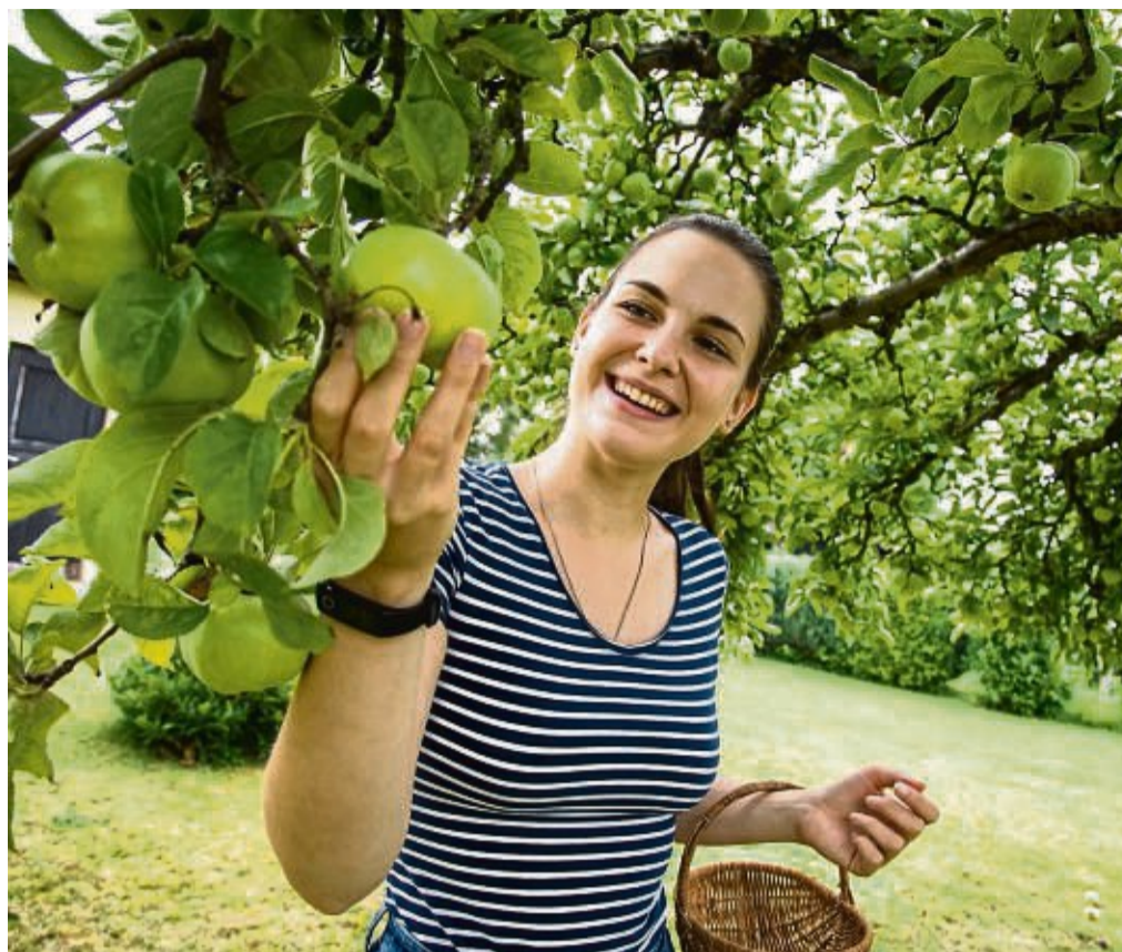
Im Supermarkt sind die meisten Äpfel rot. Der Winterapfel Ontario kommt stattdessen mit grünlich-gelber Schale daher.

Der Faktor Geschmack lässt sich mitunter auch durch etwas Geduld beeinflussen, denn bei vielen alten Sorten liegt eine erhebliche Zeitspanne zwischen dem Pflück- und dem optimalen Genusszeitpunkt, sagt Reinig. Er verweist dabei auf den Altländer Pfannkuchenapfel: „Dieser wird Anfang Dezember geerntet und ist erst im Januar verzehrreif.“ Diese Sorte kann dann auch noch