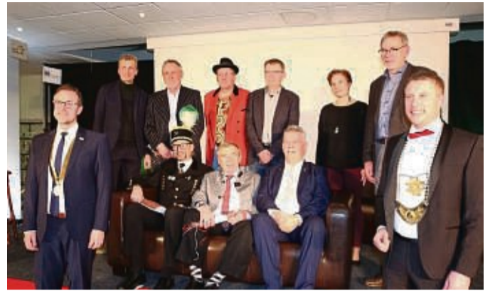
Neujahrsempfang: Im vergangenen Jahr bereiteten viele Interview-Partner und Gastredner den Gästen einen kurzweiligen Neujahrsempfang.

Es wird um baldige Anmeldung bei Gerald Schmidt 7623 oder Volkart Heyn 475 gebeten.