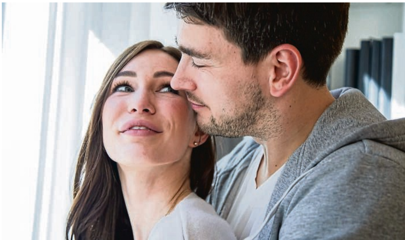
Gelangt ein zärtlich gehauchte Kosenamen wie „Muschi“, „Baby“ oder „Honigschnecke“ an fremde Ohren, kann das für die liebteste Person verletzend sein.