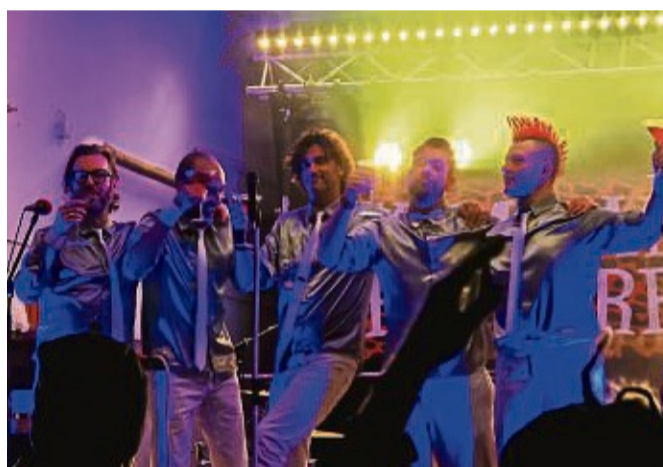
In Wichte auf der Bühne: Die Band „Kommando Butterfahrt“ trat beim Frostival auf.