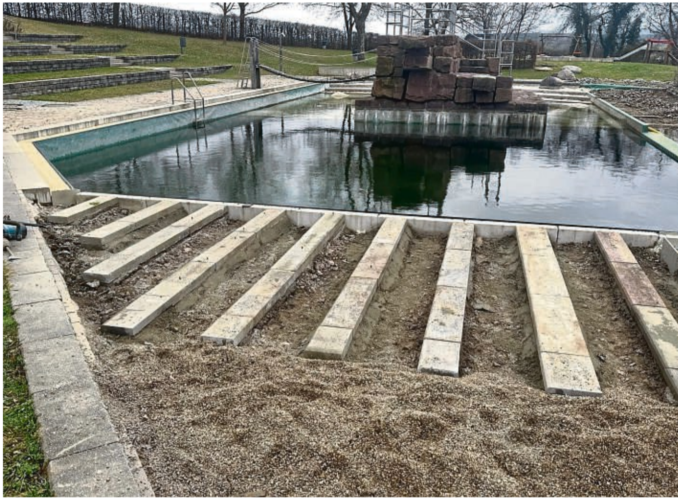
Das Terrano-Naturbad in Gudensberg wird derzeit saniert. Eine Firma aus Niedenstein ersetzt dort lose, am Rand des Schwimmerbeckens liegende Steine, durch eine mit Basaltquadern ausgepflasterte Fläche.

Die Kosten der Sanierungsarbeiten belaufen sich auf rund 270 000 Euro. Die Arbeiten sollen rechtzeitig zur geplanten Eröffnung im Mai abgeschlossen werden, heißt es vonseiten der Stadtverwaltung. Zudem werden die kompletten Holzlaufwege um die Becken von der Firma erneuert. Für die Laufflächen wird ein spezielles Kebony-Holz verwendet, das mit Bio-Alkohol getränkt wird. Am Ende entsteht eine harte Oberfläche, die den Eigenschaften eines Tropenholzes gleichkommt und so eine nachhaltige Alternative ist. Das Holz unterliegt der FSC-Zertifizierung für nachhaltige Waldwirtschaft und bietet