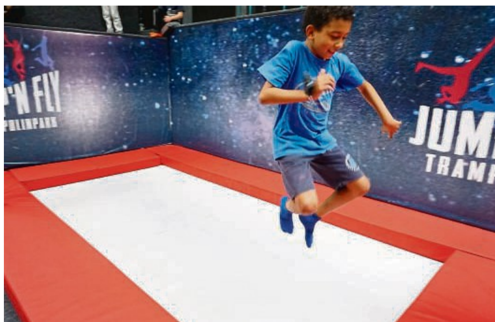
Steht auf dem Programm: Die Teilnehmer der Osterferienspiele des Melsunger Jugendtreffs – Die Haspel machen einen Ausflug in die Trampolinhalle.