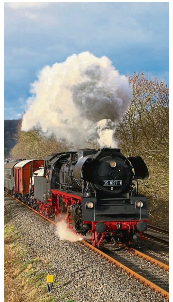
Die Dampflokomotive der Eisenbahnfreunde startet zur nächsten Tour.