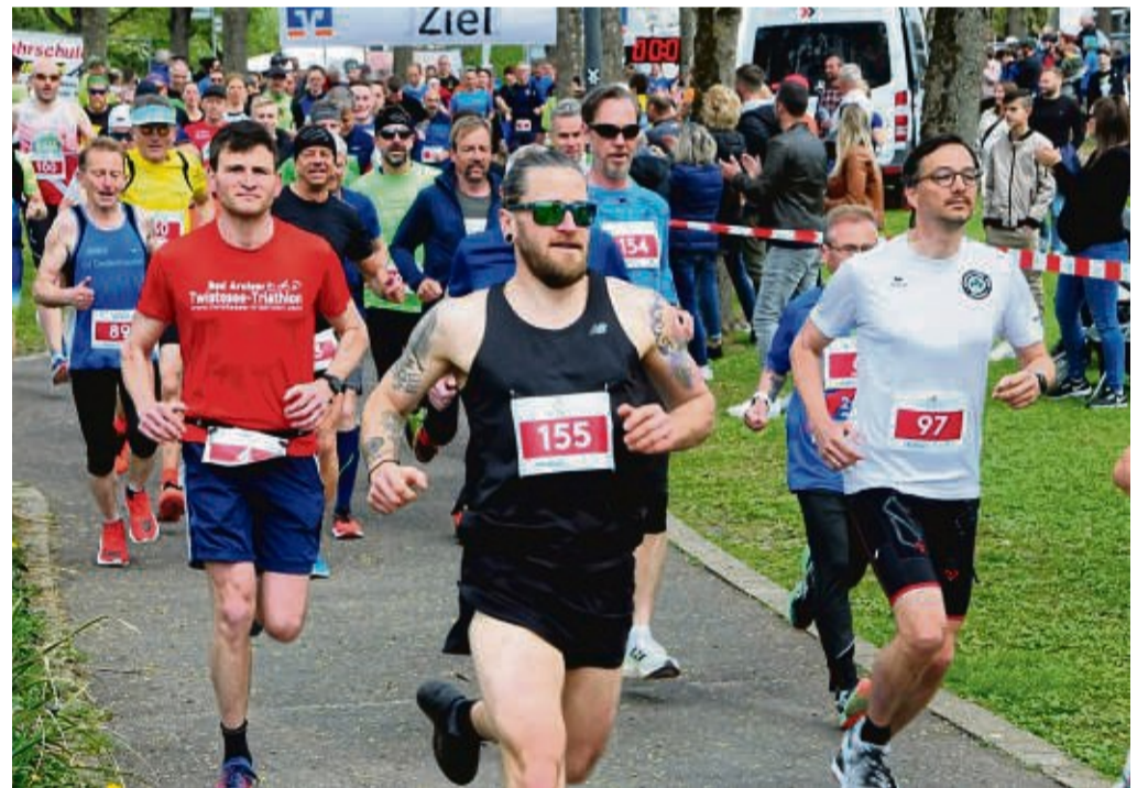
Teilnehmer beim Löwenlauf, bei dem verschiedene Strecken angeboten werden.