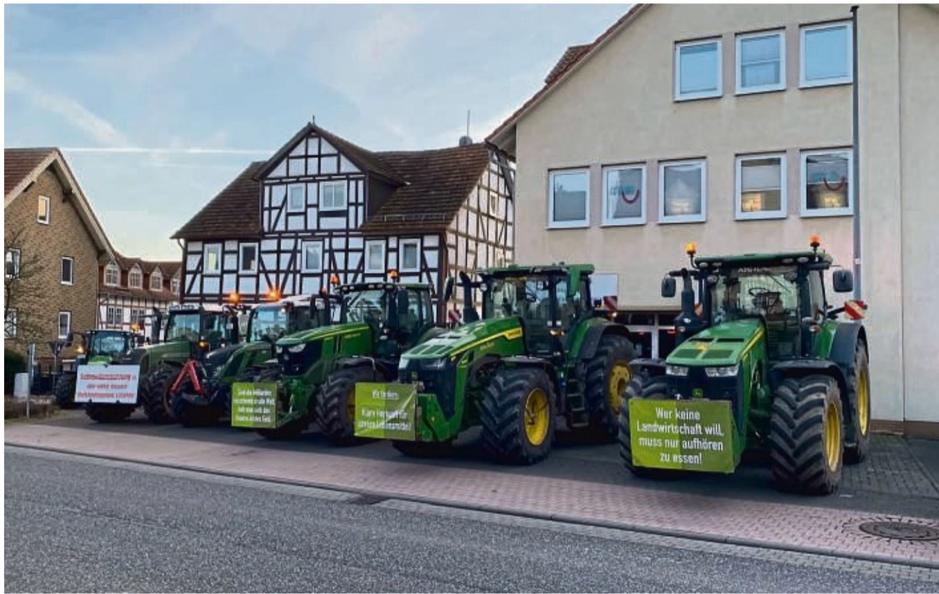
Protest in der Ortsmitte: Auch in Körle zeigten Ende Januar gut ein Dutzend Landwirte aus der Region ihren Unmut.

Beim Gespräch im Gasthaus Zur Krone machten die Landwirte deutlich, dass ihre Position zwischen Politik, Handel und Verbraucher