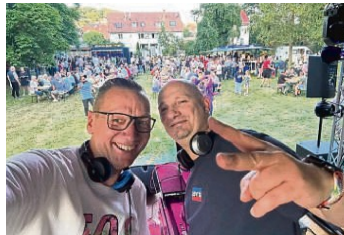
Beste Stimmung garantiert das Park Sound Festival am 12. und 13. Juli.