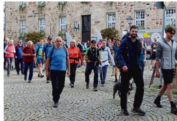
Kunst, Natur, und sportliche Herausforderung bietet die ARS NATURA Challenge am 1. September.