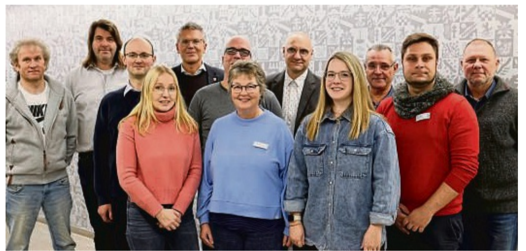
Die Leiterinnen und Leiter der ambulanten Pflegedienste im Landkreis mit dem Ersten Kreisbeigeordneten Dirk Noll (5. von links) und Vertretern des Sozialdezernats der Kreisverwaltung.

Zu dieser Informationsrunde hatte Dirk Noll, Erster Kreisbeigeordneter und Sozi-