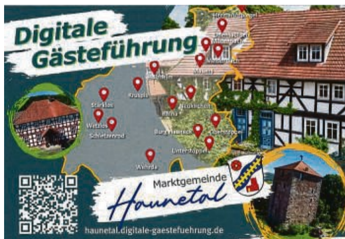
Einscannen und los: Über diese von Jenny Meeßen gestaltete Postkarte wirbt die Marktgemeinde Haunetal für ihren neuen digitalen Gästeführer.