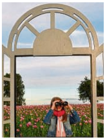
Beliebte Veranstaltungen sind Wanderungen durch Mohnfelder.