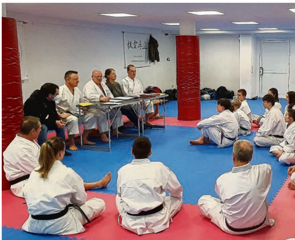
Bei der Mitgliederversammlung des Karate-Dojos wurde eine positive Bilanz gezogen.