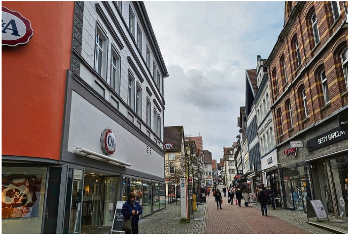
C&A geht, Woolworth kommt: Die Immobilie in der Fußgängerzone wird also nicht leerstehen.