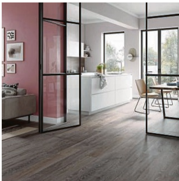
Alle Looks können auch im Wohnbereich weitergeführt werden, um einen sanften Übergang zu gewährleisten.

Bereits seit mehreren Jahren angesagt und nach wie vor aktuell ist der industrielle Charme von Beton pur. Fliesen und Möbeloberflächen in Beton-Optik harmonisieren mit Industrial Design im Stahl-Look oder in Schwarz. Neu ist die Kombination von Betongrau mit