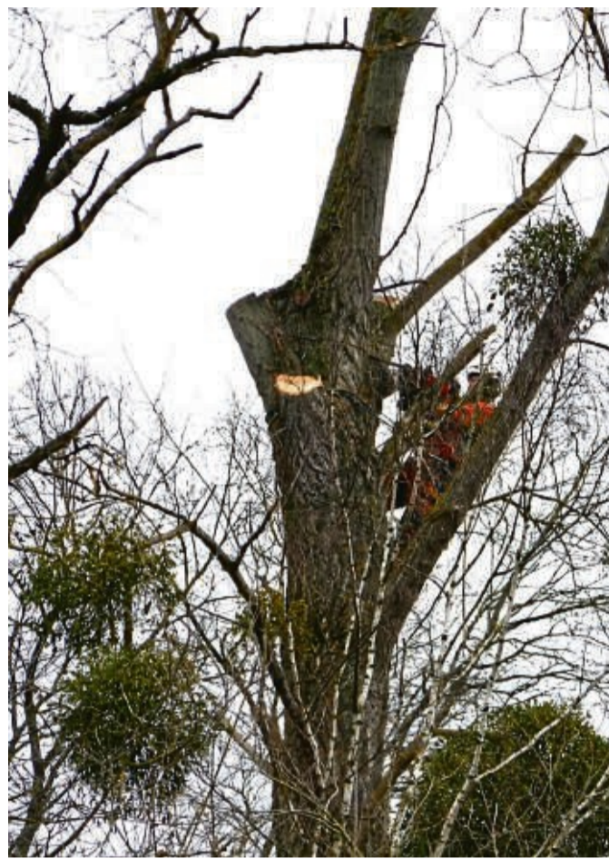
Mit der Kettensäge waren die Baumkletterer in luftiger Höhe zugeange.

mit der der Hubschrauberpilot und die in luftiger Höhe tätigen Forstarbeiter zu Werke gingen. Andererseits bedauerte er den Verlust der zahlreichen, seiner Meinung nach teils noch gesunden Bäume, unter anderem einige alte Eichen, die gefällt worden waren. „Neben einzelnen großen Pappeln mit Misteln und Wildkirschen wurden überwiegend achtzig bis hundert Jahre alte Eichen gefällt, oder bis auf einen Stammstumpf abgesetzt“, sagte er. Die Bäume wurden von dem Kletterer an einem herabhängenden Drahtseil des Helikopters befestigt und