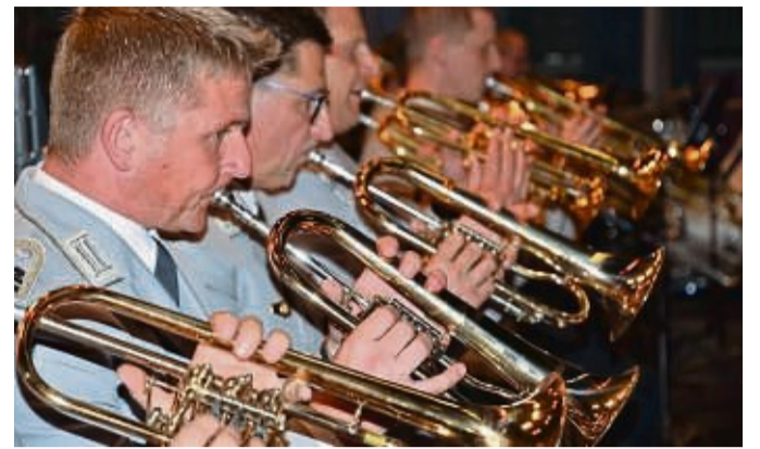
Haben Erfahrung mit Konzerten für den guten Zweck: die Musiker des Heeresmusikkorps.