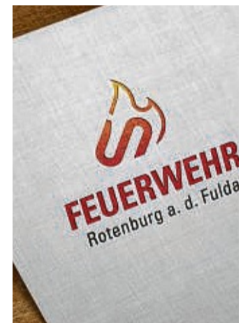
So sieht es aus: Das neue Logo der Feuerwehr Rotenburg.