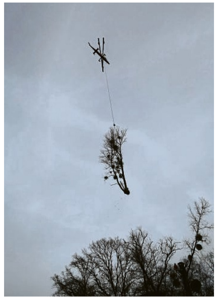
Ein Hubschrauber der Schweizer Firma Rotex transportiert bei Bosserode eine abgesägte Baumkrone ab.