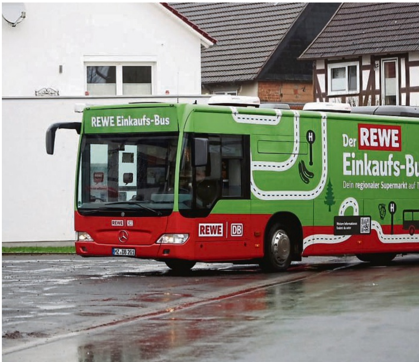
Fährt nicht mehr: Der Rewe-Bus stellt nach neun Monaten den Fahrbetrieb ein.

Volkmarsen-Ehringen – Unter dem Motto „Deutschland-Reise“ wird am Dienstag, 5. März um 19 Uhr im Ehringer Gemeindehaus gequitzt. Der Ortsbeirat und der Pfarrgemeinde Ehringen laden Interessierte zum gemütlichen Quizabend ein. red