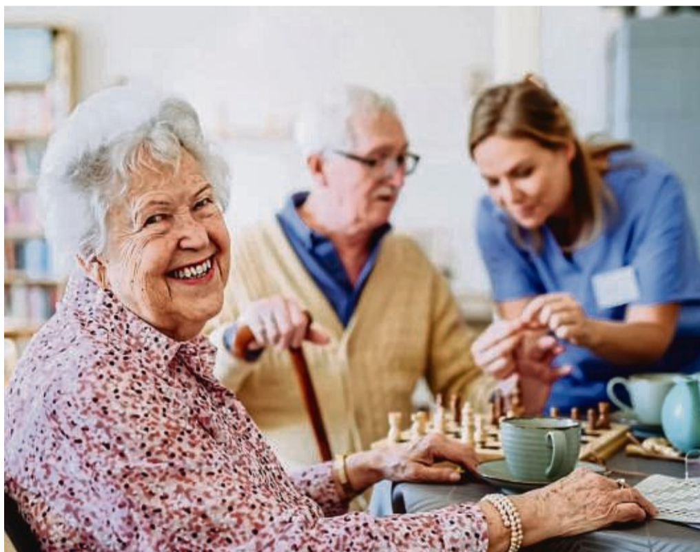
Welches Pflegemodell das richtige ist, will gut überlegt sein und sollte sich immer nach den individuellen Bedürfnissen des Pflegebedürftigen richten.

Wohngemeinschaften stellen ein weiteres alternatives Wohnkonzept dar, bei dem sich mehrere Senioren eine barrierefreie Wohnung tei-