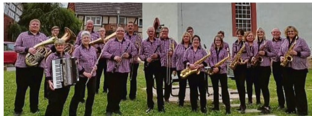
Der Musikverein Ober-Waroldern präsentiert bei seinem Konzert eine „Zeitreise durch die größten Hits der letzten Jahrzehnte“.

Der Musikverein übt jeden Freitagabend im Dorfgemeinschaftshaus Ober-Waroldern. Am Mittwoch, 20. März, findet dort um 18 Uhr eine Informationsveranstaltung für eine neue Erwachsenenblä-