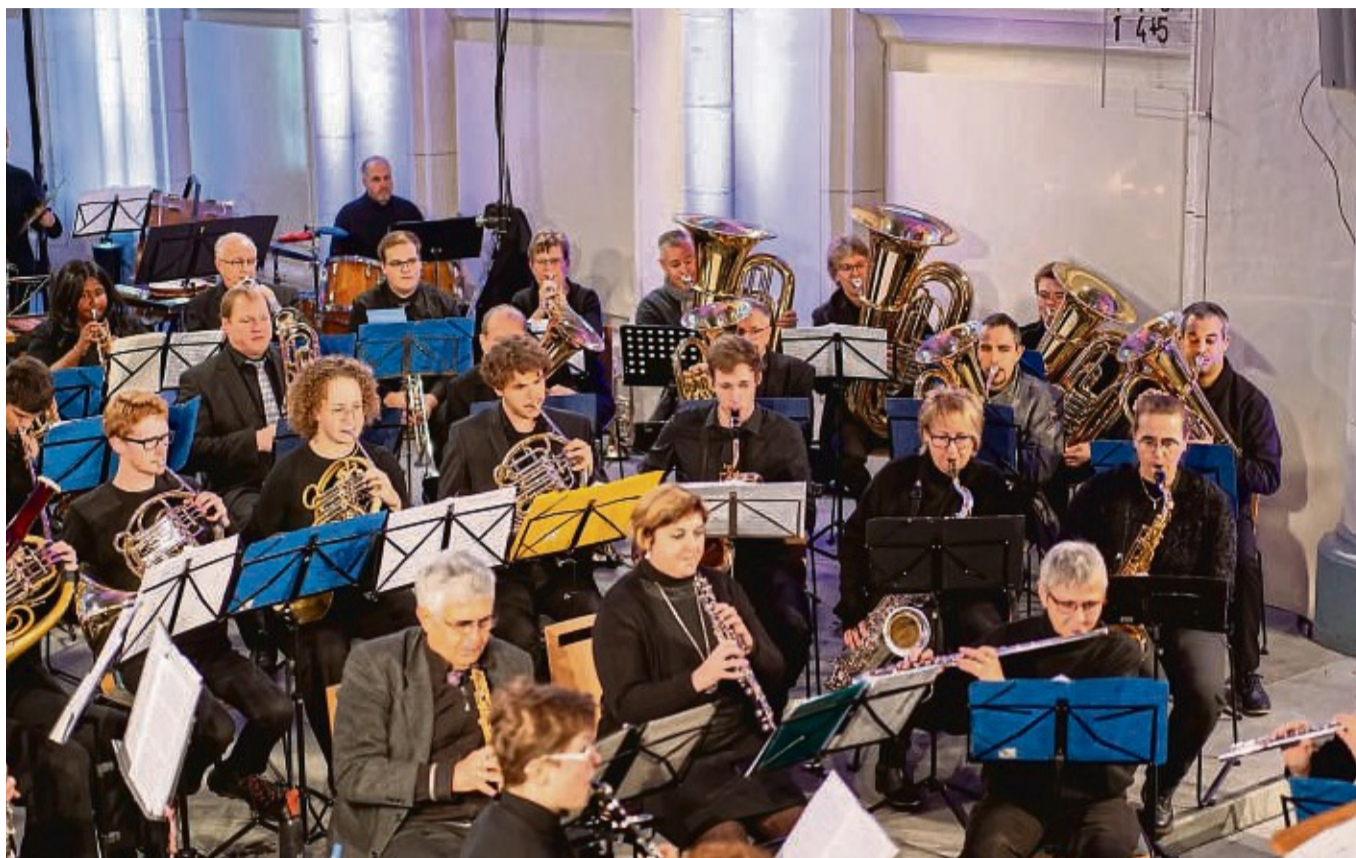
„Sound of Nature“ ist das Motto des Frühjahrskonzerts, mit dem das Sinfonische Blasorchester Korbach/Lelbach das Publikum begeistern will.

Der Komponist Otto Schwarz beschreibt eine Expedition, die sich bei schönstem Wetter auf den Weg zum Gipfel macht, das beeindruckende Panorama der Alpen erstrahlt im Sonnenschein. Das Wetter schlägt um, Steinschneelawinen und Schneesturm