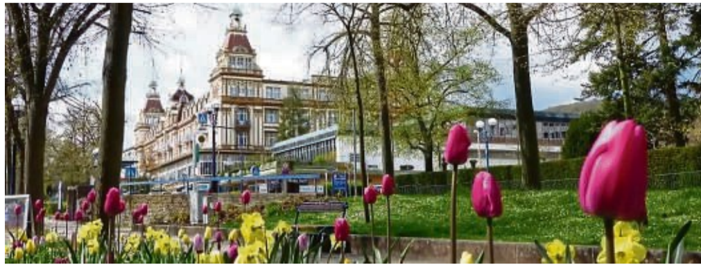
Aufwärtstrend: Bad Wildungen - hier die Brunnenallee mit Blick auf den Fürstenhof - ist bei Gästen wieder ähnlich stark nachgefragt wie in den Jahren vor der Corona-Pandemie.

Übernachtungszahlen nähern sich der Bestmarke