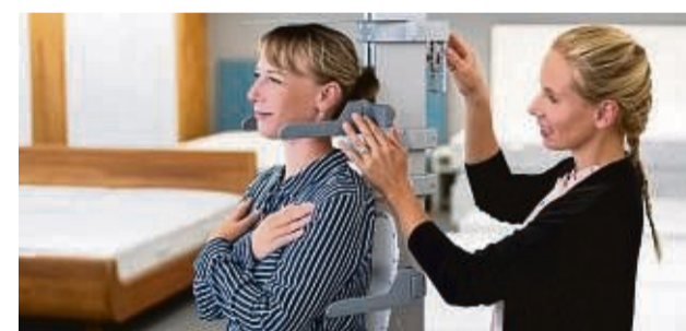
An diesem Messgerät wird bei Brack Maß genommen.

Einseitige, wiederkehrende Haltungen im Arbeitsalltag und mangelnde Bewegung bleiben nicht folgenlos. Die Wirbelsäule, die den Körper stützt, wird