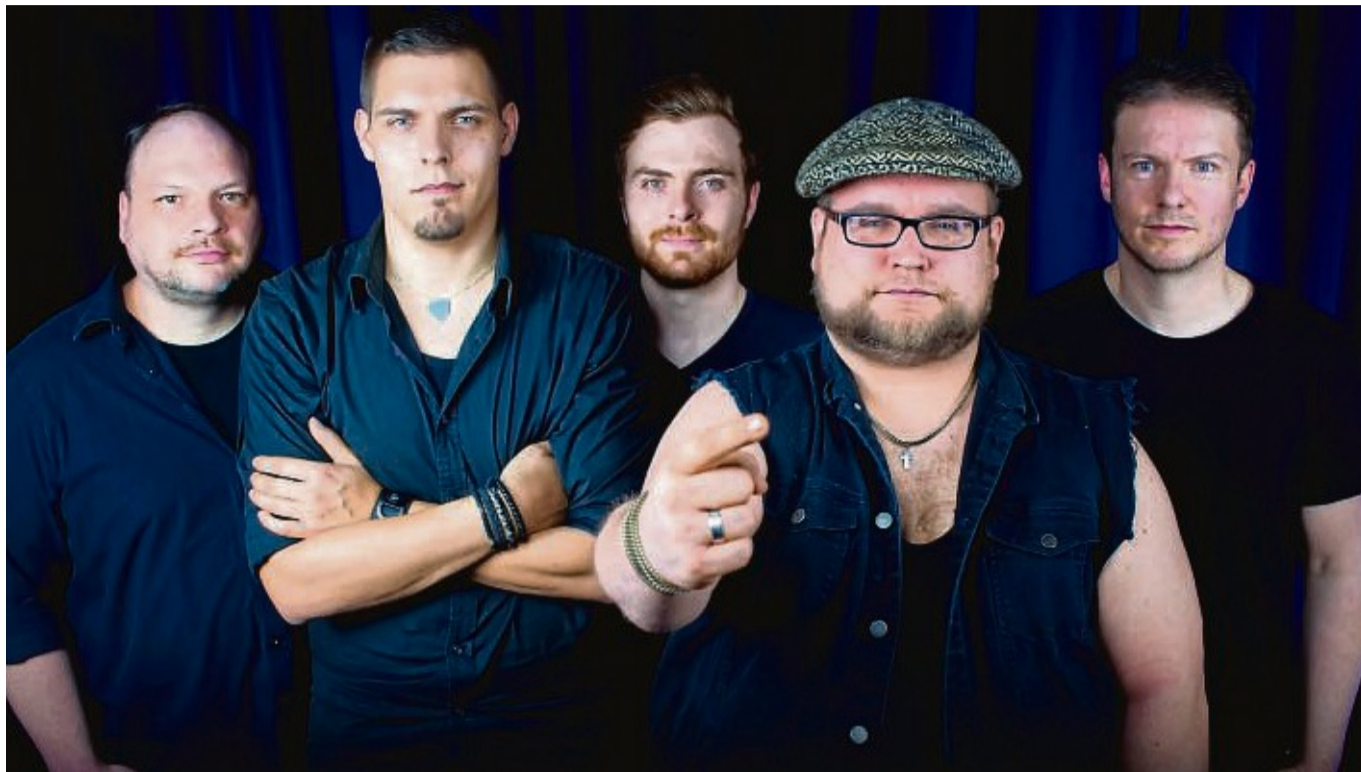
Sie sind Teil des rockigen Vatertags in Odershausen: die AC/DC-Coverband „Dezibel“ tritt bei der Tribute-Night zum Auftakt des Schleppertreffens in Odershausen auf.