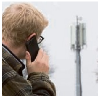
Masten erforderlich: Auch in Diemelsee gibt es noch „Funklöcher“.