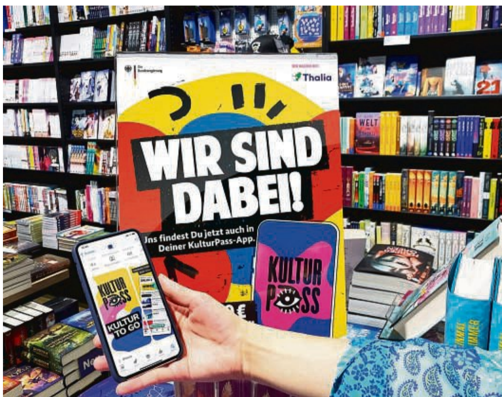
Das Kulturpass-Angebot wird auch in vielen Buchhandlungen beworben: Wie beispielsweise hier in einem Geschäft der Thalia-Kette.

In diesem Jahr erhalten Jugendliche, die 2006 geboren wurden, auf Antrag 100 Euro. Trotz der Halbierung der Summe dankte Claudia Roth dem Haushaltsausschuss des Bundestages dafür, dass weitere Mittel für den Jahrgang 2006 bereitgestellt werden,