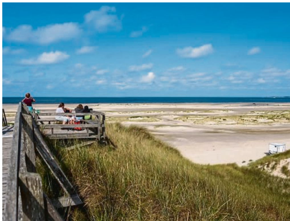
Touristen auf Amrum genießen den herrlichen Ausblick auf den Strand im Hintergrund rechts die Nachbarinsel Sylt.

Eine Reise ist meist die beste Möglichkeit, den Alltagsstress hinter sich zu lassen, sich zu erholen und einfach mal abzuschalten. Gerade zu dieser Jahreszeit plagt viele Menschen die sogenannte Frühjahrsmüdigkeit. Ein Phänomen, das typischerweise zwischen März und Mai auftritt und rund die Hälfte der Menschen betrifft. Wechselt die Temperatur von den kalten Wintermonaten in die wärmere Frühlingszeit, muss sich der Körper an den Wetterschwung gewöhnen und reagiert mit einem Blutdruckabfall. Dieser natürliche Prozess macht die Menschen müde. Um dem bestmöglich entgegenzuwirken, eignet sich eine sogenannte Sleepcation. Ein Urlaub, bei dem Reisende den Fokus auf ruhige Nächte und eine erholsame Auszeit legen. Die Experten des Online-Reiseportals Urlaubspiraten geben Tipps für die perfekte Sleepcation im Frühjahr.