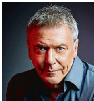
Krimi-Autor Arno Strobel kommt zu einer Lesung nach Korbach.

Arno Strobel wurde 1962 in Saarlouis geboren. Er hat drei Kinder und lebt mit seiner Partnerin in der Nähe von Trier. Mit Anfang 40 veröffentlichte er die ersten Kurzgeschichten in Internetforen. Da sein erster Roman keinen Verleger fand, gründete er zunächst einen eigenen Verlag. Nach dem großen Erfolg seines Erstlingswerkes „Ma-