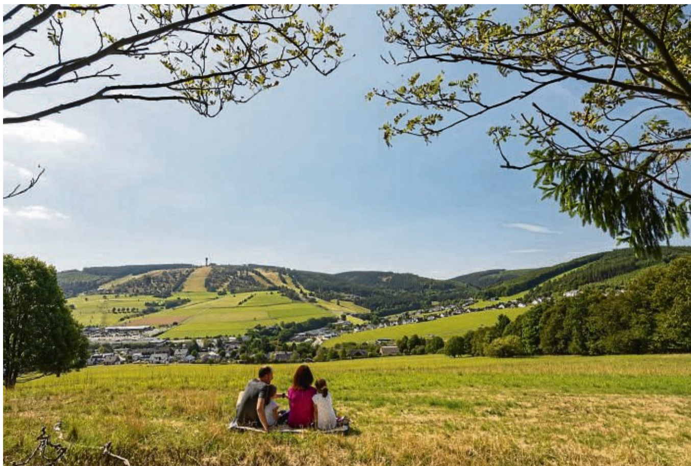
Die Übernachtungszahlen in der Urlaubsregion Willingen haben im Jahr 2023 erstmals wieder die Millionengrenze überschritten.

Fer Trend zum spontanen Kurzurlaub mit kurzen Anreisewegen setzt sich also fort. Menschen, die es sich leisten können, buchen in-