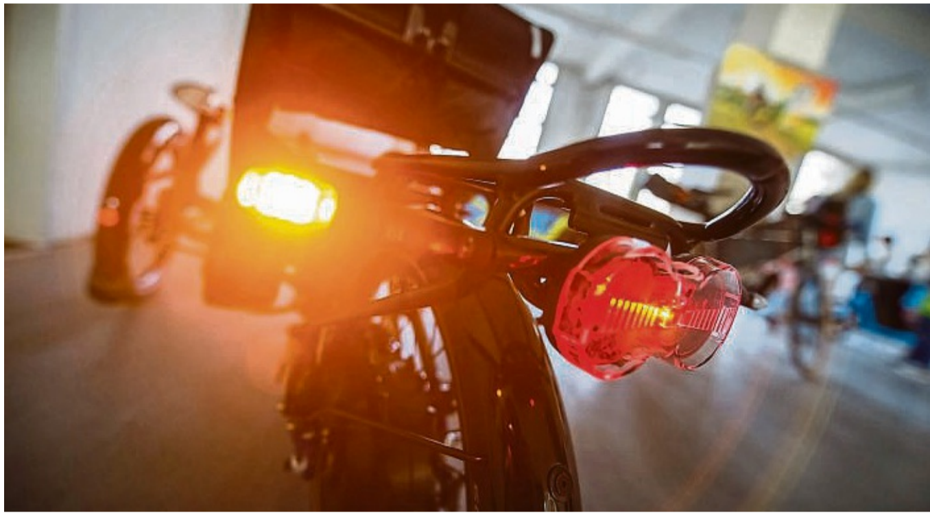
Die Bundesregierung will Blinker für alle Fahrräder beim Abbiegen erlauben.

„Ein Blinker ist bei einem Unfall rechtlich kein bindendes Argument“, sagt Siegfried Brockmann. Die Stadt Kassel hingegen sieht eher die Beleuchtung am Fahrrad als Schlüsselfaktor, weniger den Blinker: „Noch wichtiger als der Einsatz des Blinkers wäre es, dass Radfahrende bei entsprechenden Lichtverhältnissen die Beleuchtung ihrer Fahrräder einschalten und Kleidung tragen, die von anderen gesehen werden kann. Wenn es um das Thema Sicherheit für Radfahrer geht, wird auch immer über eine