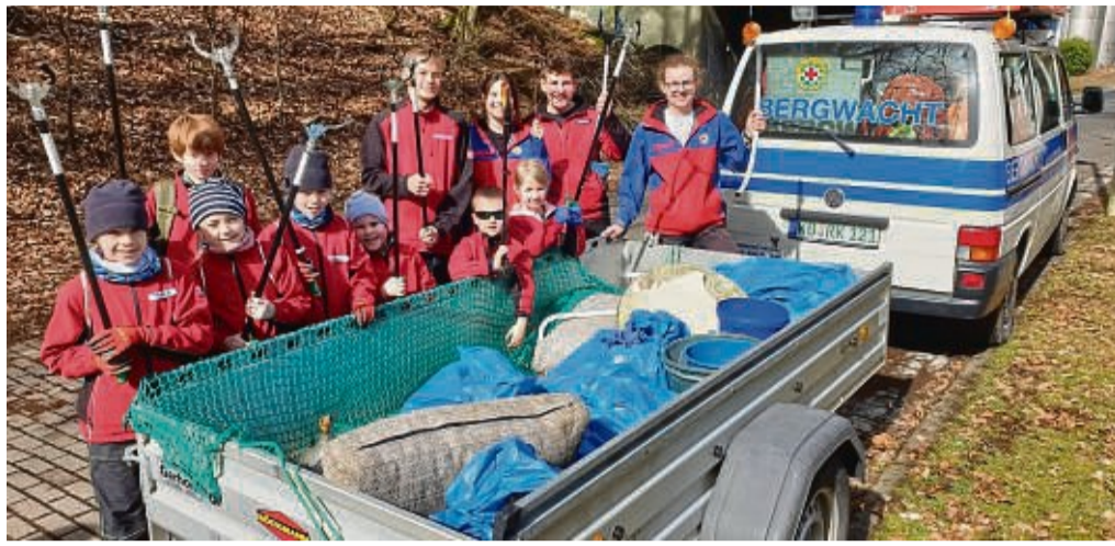
Wie die Bergwacht (unser Bild) halfen 2023 mehr als 500 Freiwillige bei der Frühjahrsputzaktion mit.