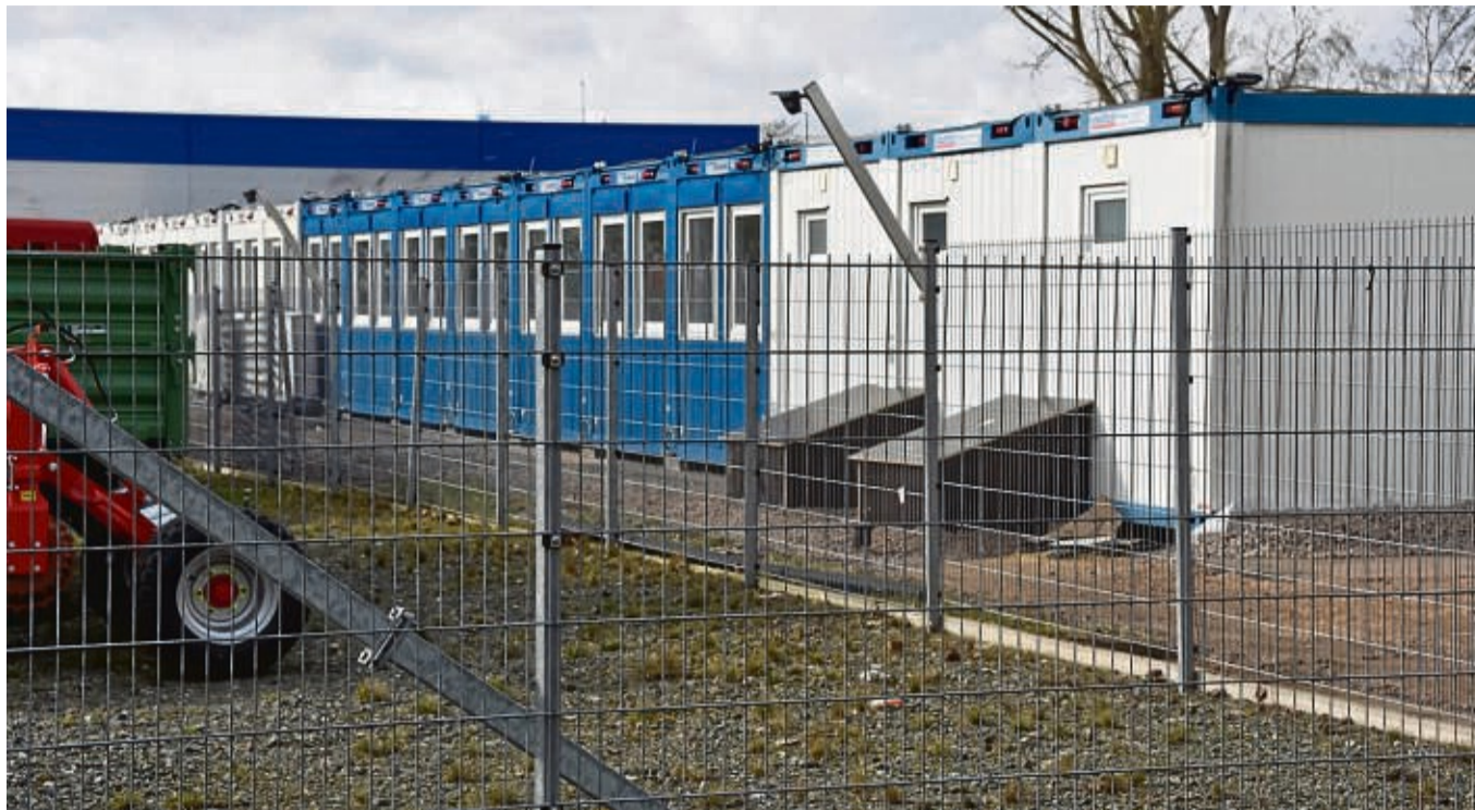
Containerdorf für Flüchtlinge in Korbach: Für das Wohnquartier in der Flechtdorfer Straße mit bis zu 290 Plätzen läuft der Mietvertrag am Jahresende aus, er soll nicht verlängert werden, wenn die Zahlen es zulassen. Stattdessen will der Landkreis dort „was Festes“ bauen.

Die Kreisverwaltung hat deshalb nun die Bürgermeister aus dem Landkreis über