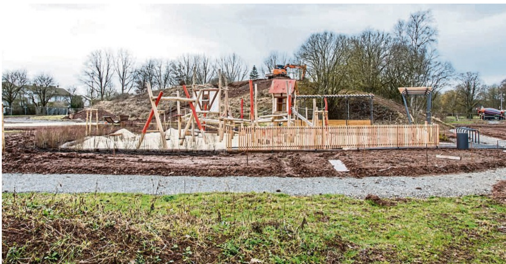
Der neue Spiel- und Sportpark in der Laake nimmt Formen an: Für die kleineren Kinder hält ein separater Bereich vor dem Hügel Spielmöglichkeiten parat.

Korbach – Aufgrund der Witterung und des durchweichten Bodens ruhen die Arbeiten derzeit am großen Spiel- und Sportpark. Ein Bagger steht auf dem großen Erdhügel in der Laake. Dort ist schon alles für den Einbau der Spielgeräte vorbereitet. „Wegen des Wetters mussten die Arbeiten abgebrochen werden“, erläuterte Bauamtsleiter Stefan Bublak im Bauausschuss. Die alte Hanse liefert die Idee für die Gestaltung: Ein Geflecht aus Netztunneln, Kletterseilen, Hängebrücken und anderen Kletterseilelementen mit Einsteigen symbolisiert die weitreichenden Verbindungen der früheren Hanse. Das Ende der „Netzreise“ bildet ein Turm auf dem Hügel mit einer langen Rutsche. Zusätzliche Spiel- und Sportangebote sollen sich in der Ebene davor verteilen. Ein Trampolinparcours und ein Basketballkorb sowie eine große Rasenfläche für verschiedene Ballspielarten und überhohe Schaukeln sind vor allem für ältere Kinder bis 14 Jahren gedacht. Die ersten Spielgeräte sind schon aufgestellt. Ein langes Dach – die „Spielbude“ – soll sich daneben über einen Platz spannen. Gedacht ist die Fläche als Treffpunkt. Dort werden unter anderem Tisch-