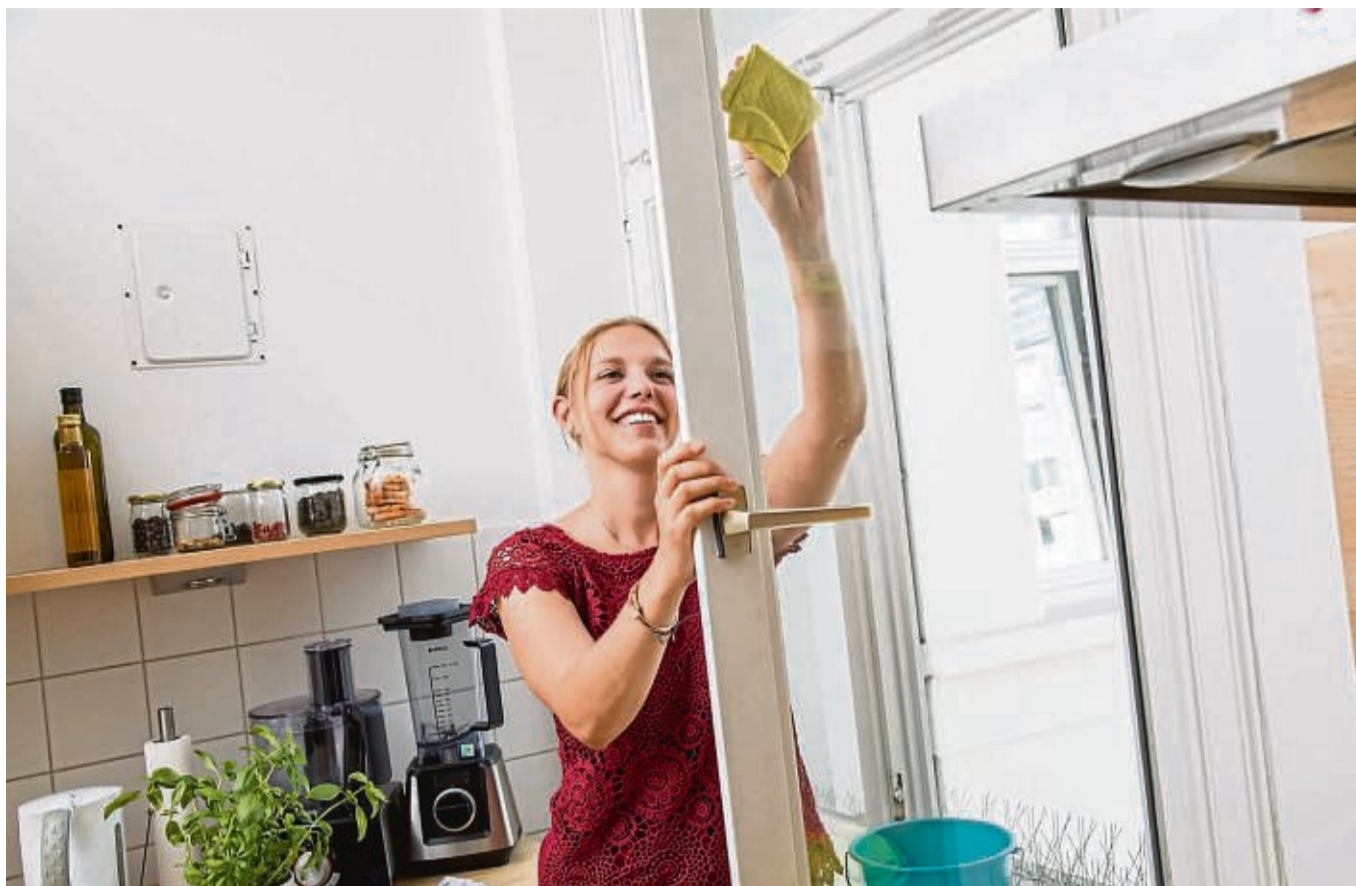
Alles glänzt: Der Frühjahrsputz kann nicht nur der Wohnung guttun, sondern auch die Stimmung aufhellen.

Es gibt aber noch andere Gründe. Zum Neujahr suchen sich viele Menschen Neujahrsvorsätze, stecken sich hohe Ziele und merken dann meist ab Februar, März, dass