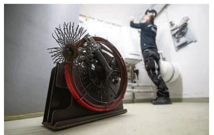
Älteren Heizungen in größeren Wohngebäuden mit Einbaudatum 1.10.2009 steht die Prüfung auf Energieverluste bevor.