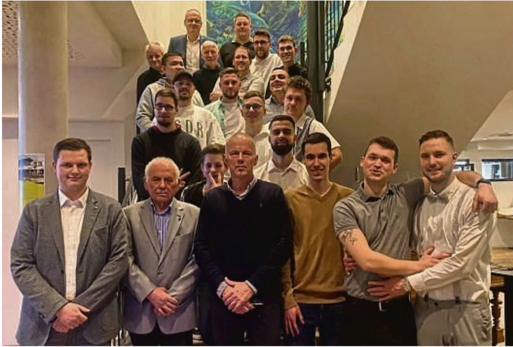
Die Auszubildenden zum Kfz-Mechatroniker dürfen sich nun Gesellen nennen. Alle freuen sich über ihre bestandenen Prüfungen.

Trotzdem erschienen die Azubis im August 2020 zum ersten Berufsschultag an den Berufsbildenden Schulen (BBS) Münden. In der Folgezeit wurden die Unterrichte