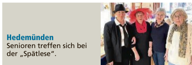
Hedemünden Senioren treffen sich bei der „Spätlese“.