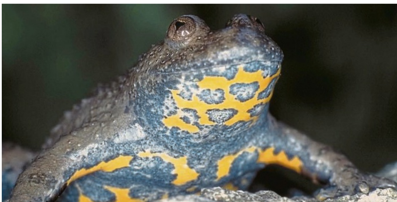
Gelbbauchhuhn wie diese überqueren bei der Amphibienwanderung von Anfang März bis Mitte April viele Straßen im Kreis.

In dem Gremium wurden Aktionen für die kommende Amphibienwandersaison im Werra-Meißner-Kreis besprochen. „Wir hoffen, dass die Autofahrer nicht wieder die Feldwege rund um den Meinhardsee nutzen, um die Umleitung zu umgehen“, schreibt der BUND in Bezug auf die Aktion auf der Straße zwischen Grebendorf und Je-