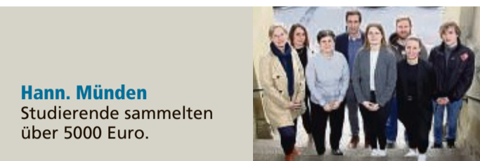
Hann. Münden Studierende sammelten über 5000 Euro.