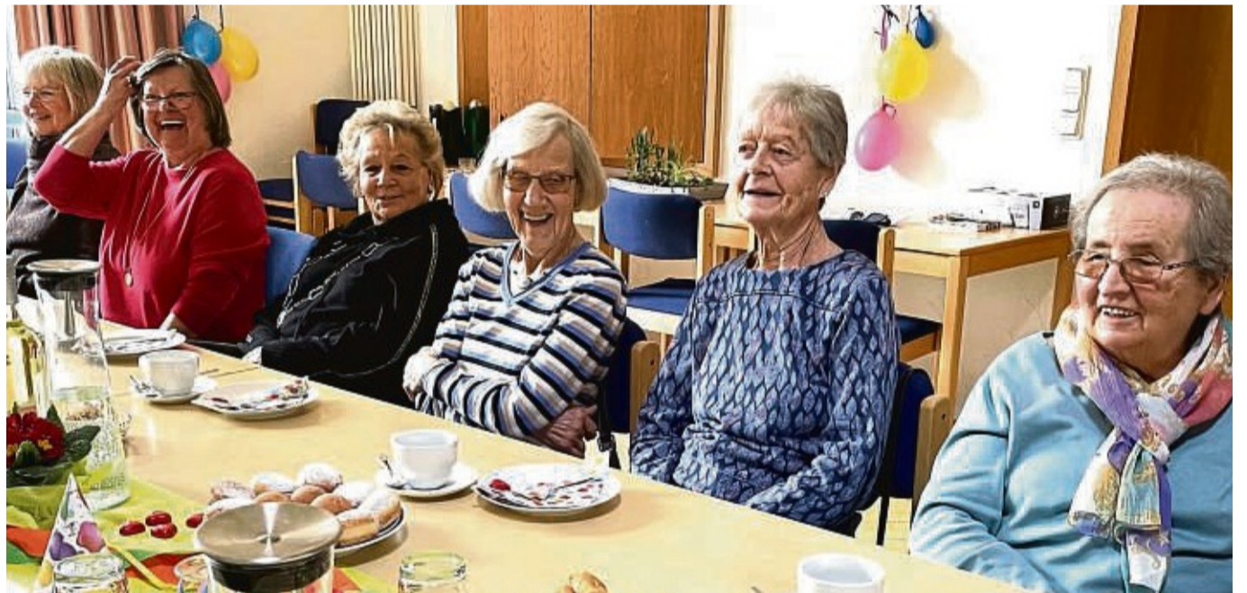
Die Frauen kommen gerne zur Hedemündener Spätlese, sie bringen gute Laune mit und haben Spaß.

Aber das Wichtigste seien die Unterhaltungen über dies