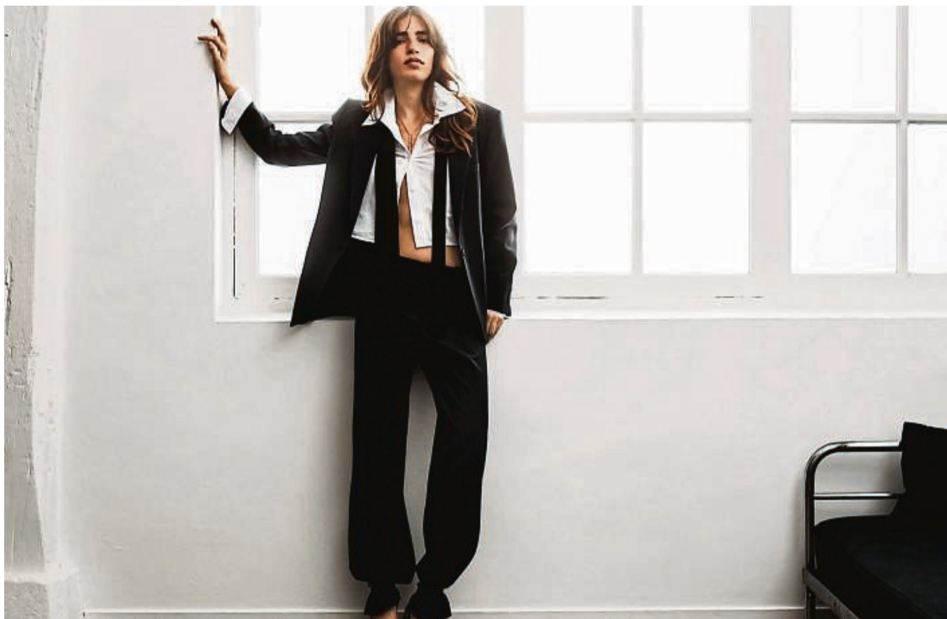
Kleidung, die sich vielseitig kombinieren lässt: Blazer, Hemden und gerade Hosen, hier ein Look von ba&sh (Hemd ca. 180 Euro, Hose ca. 250 Euro, Blazer ca. 360 Euro, Schuhe ca. 315 Euro).