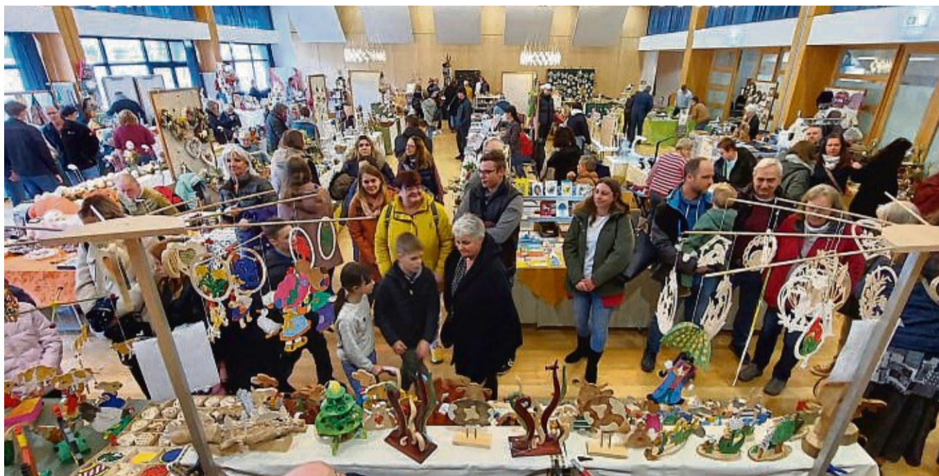
Gut besucht: Pünktlich zur Eröffnung füllte sich der Bürgerhaussaal Gudensbergs mit Besuchern.