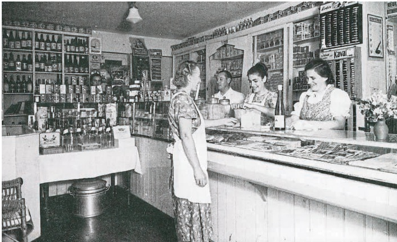
Historische Aufnahmen: Bei der Auftaktveranstaltung zu 950 Jahre Körle gibt es auch eine Reise durch die Geschichte der Gemeinde. Unser Bild zeigt den Kaufmannsladen an der Nürnberger Straße um 1955.

Die Gemeinde Körle feiert in diesem Jahr mit einer Veranstaltungsreihe und einem Festwochenende ihren 950. Geburtstag, heißt es weiter. Dazu gehören beispielsweise