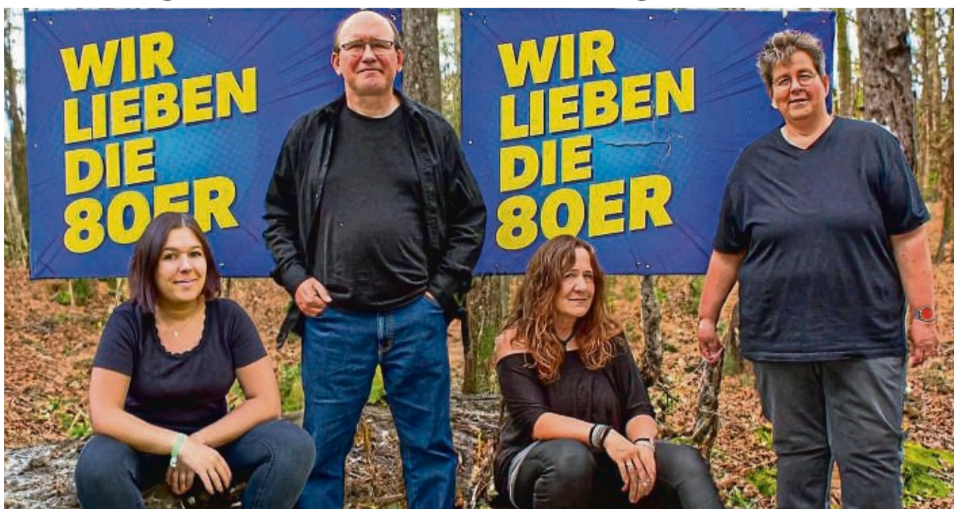
Highlight auf dem Marktplatz: Die Band Just for fun unternimmt eine musikalische Reise in die 80er Jahre.

Das Programm des diesjährigen Ostermarktes ist so bunt und vielfältig wie die Ostereier.