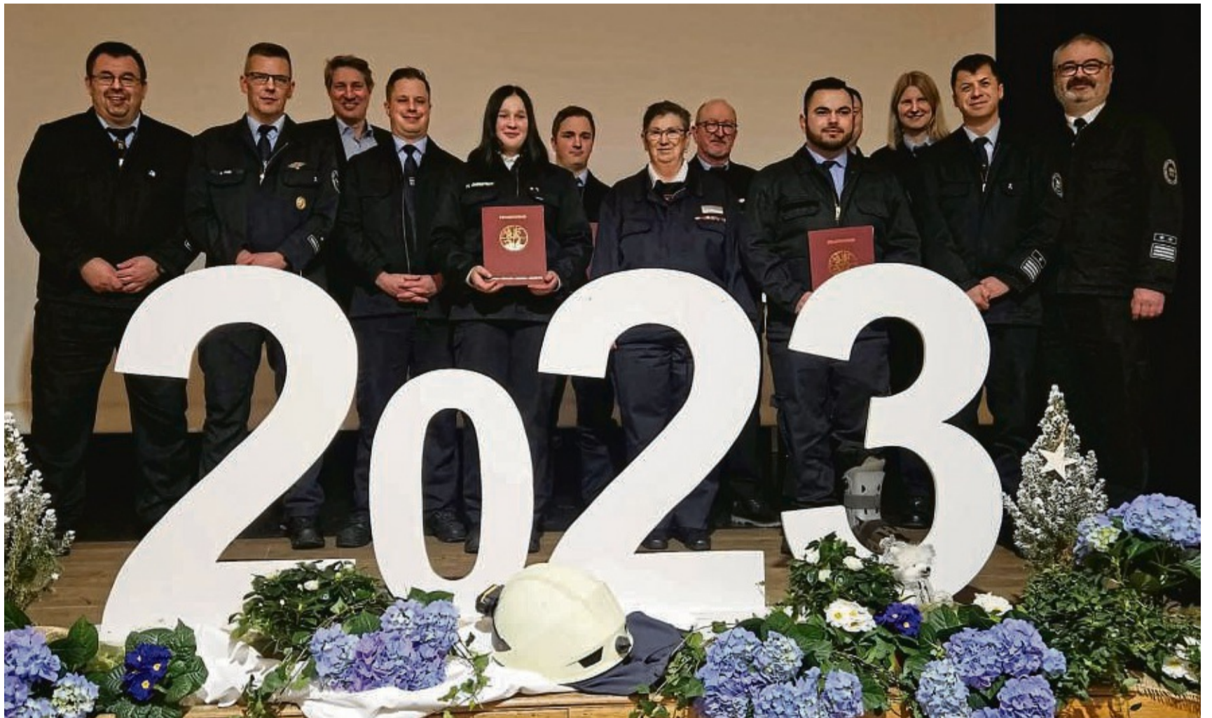
In der Versammlung der Feuerwehr Homberg standen Ehrungen und Auszeichnungen an.