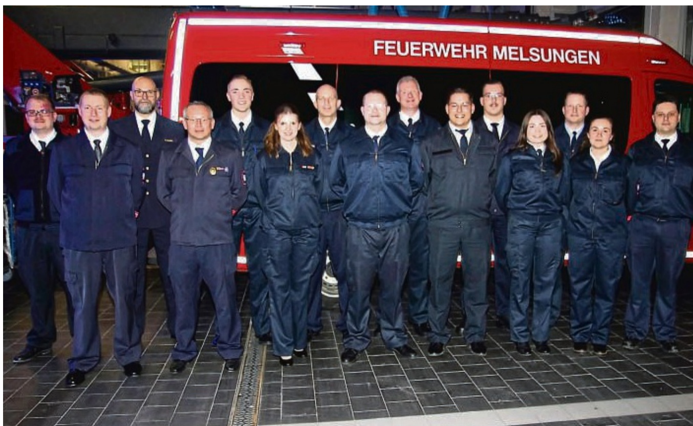
Die neue Wehrführung wurde in der Jahreshauptversammlung der Melsunger Kernstadtwehr gewählt.

Um alle Einsätze und die Anforderungen erfolgreich abarbeiten zu können, sind regelmäßige Ausbildungen, Übungen und Schulungen in Lehrgängen und Seminaren nötig. Insgesamt wurden 64 Lehrgänge und 57 Seminare besucht. Die Einsatzkräften leisteten 11 404 Stunden Arbeit. Nur mit viel Engagement und großem Verzicht auf Freizeit