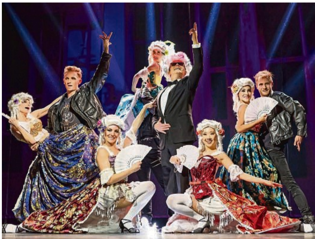
Ein Leckerbissen für Musical-Liebhaber und ein Muss für alle Falco-Fans: „Falco – Das Musical.“

„Unsterblich bin ich erst, wenn ich tot bin!“ - Um diese düsteren, vorausahnenden Worte rankt sich die Hommage an das größte Genie der deutschsprachigen Pop- und Rap-Geschichte. Folgerichtig beginnt die Musical-Biographie mit dem Autounfall in der Dominikanischen Republik 1998. Die allegorischen Figuren „Jeanny“ und „Ana Conda“ markieren die Zerrissenheit des musikalischen Ausnahmetalents zwischen dem arrogant-egomanischen Weltstar und dem verletzlich-grüblerischen Hans Hölzel. Das zweistündige Live-Erlebnis führt durch prägende Stationen im Leben des markanten Musikers. Bildgewaltig und exzentrisch gewährt die Musical-Biographie durch kunstvolle Projektionen und Original-Videosequenzen einen tiefen Einblick in die Gedanken- und Gefühlswelt des Künstlers und den Menschen, der hinter der schillernden Pop-Ikone steckte. Einem Menschen, der das Leben bis an seine Grenzen auskostete und durch viele Höhen und Tiefen ging - bis hin zur Selbstzerstörung. Dabei werden alle großen Hits und