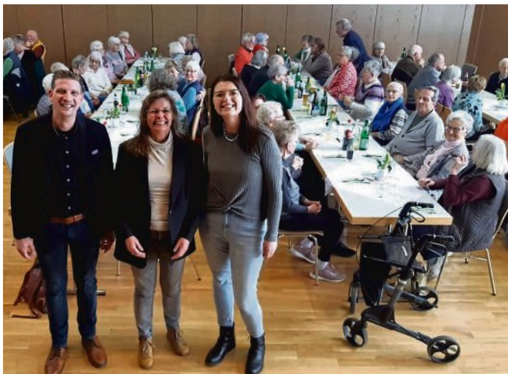
Das Seniorenessen des Seniorenbeirates im Kurhaus in Bad Zwesten war ein großer Erfolg.