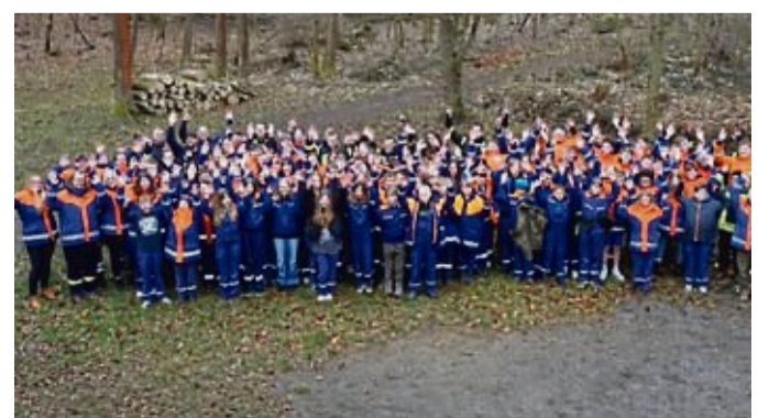
Viel Freude hatten die jungen Teilnehmer der Jugendfeuerwehr der Samtgemeinde Dransfeld bei ihrem Wochenendausflug, wie auf dem Foto zu sehen ist.