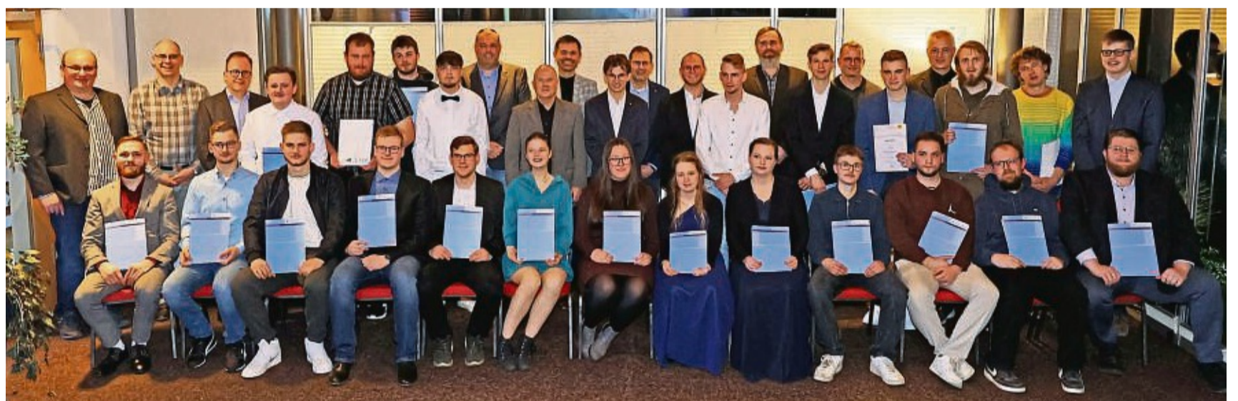
Die Lehre ist beendet: Die Elektroinnung Südniedersachsen sprach ihre Lehrlinge in Levershausen frei.