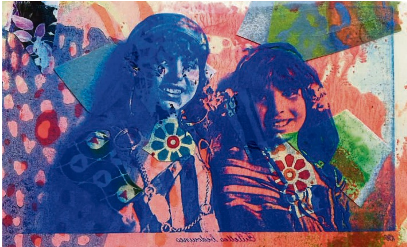
Ein Werk von Sam Flowers, das bei der Ausstellung des Mündener Kunstnetz zu sehen ist.