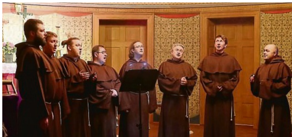
Das ukrainische Vokalensemble „The Gregorian Voices“ waren zu Besuch in der St. Martini-Kirche in Dransfeld.

Margueritenweg 5 37213 Witzenhausen 05542 999182 0170 2101959 lipnik@t-online.de