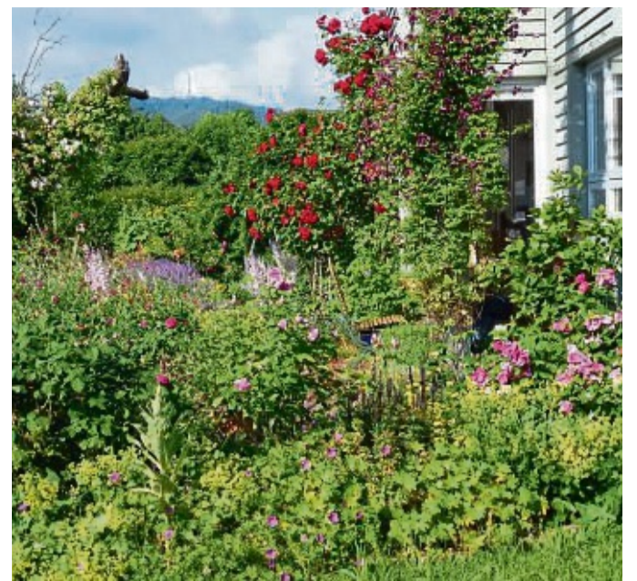
Gärten wie dieser öffnen bei der Garten-Tour ihre Pforten.