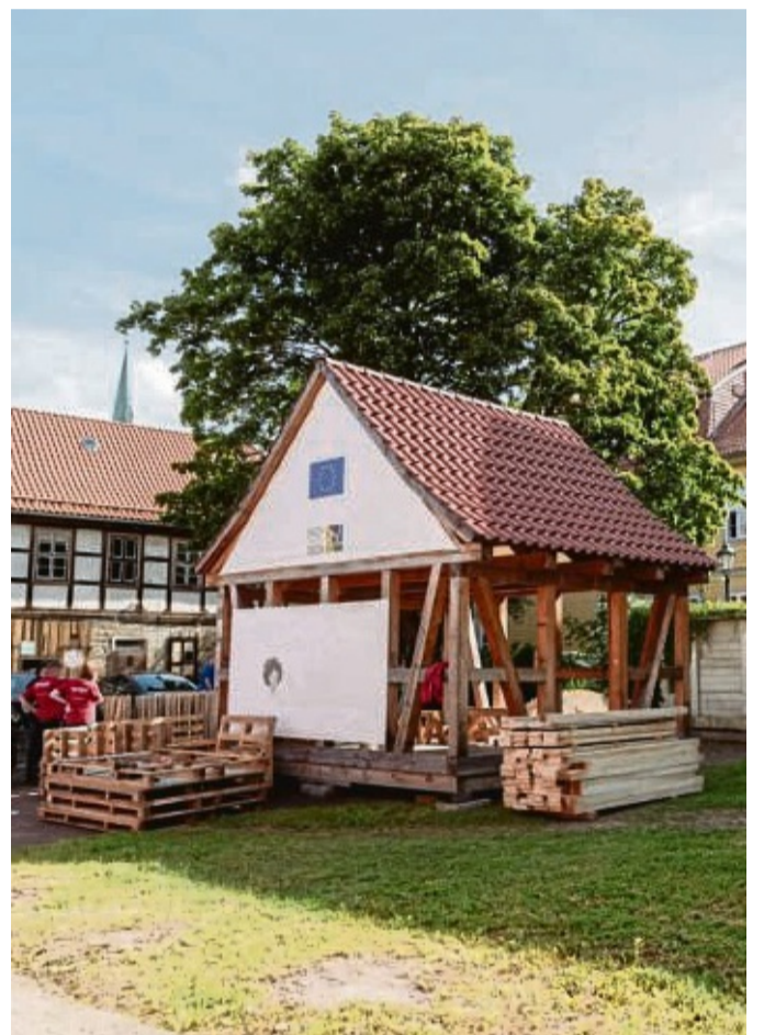
Hier wird die Praxis geübt: Das Foto zeigt das offene Fachwerkmodellhaus, das in Osterode am Parkplatz der Stadtbibliothek steht.

Kontakt: Interessierte können sich bis 12. März bei Axel Franke, E-Mail: fachwerkfans-osterode@email.de, anmelden. Infos zum Seminar sind auch im Internet abrufbar: wohnraum5eck.de