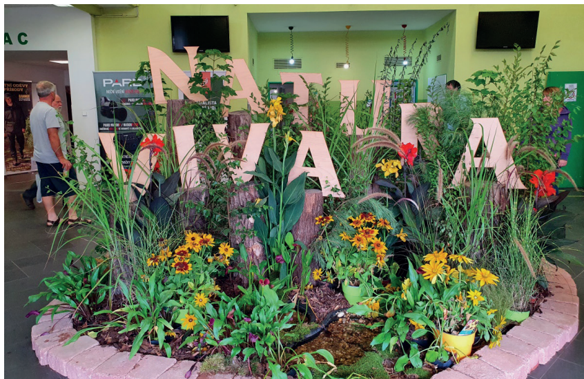
Natura Viva – Tschechiens große Jagdmesse mit Thüringer Beteiligung

2020/2021 hervor. Bundesamt für Naturschutz und die Dokumentations- und Beratungsstelle des Bundes zum Thema Wolf haben die aktuellen Zahlen vorgestellt. Die Zahl der gerissenen Nutztiere wuchs sogar noch stärker als die Anzahl der Rudel. Während im Monitoringjahr 2019/2020 noch 128 Wolfsrudel, 35 territoriale Paare und 10 territoriale einzelne Wölfe in Deutschland lebten, waren es 2020/21 schon 157 Wolfsrudel, 27 Wolfspaare und 19 sesshaften einzelne Wölfe. Das geht aus den jüngsten veröffentlichten amtlich bestätigten Wolfszahlen hervor, die auf den jährlichen offiziellen Bestandserhebungen der Bundesländer beruhen. Bundesamt für Natur-