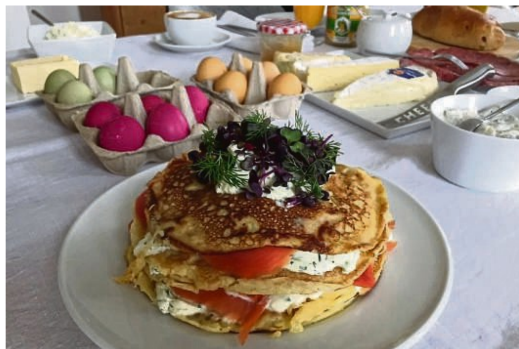
Zum Osterbrunch gehören Eier, ein Hefezopf und vielleicht auch Raffinessen wie diese Crêpes-Torte mit Räucherlachs.