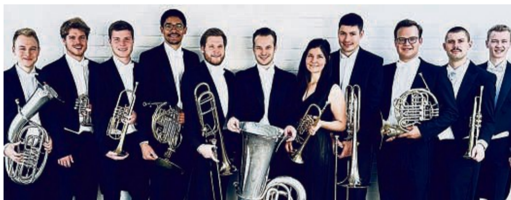
Darauf darf man sich freuen: Am 23. März, ist das elfköpfige Blechbläserensemble Hessen Brass wieder in der Ev. Lukaskirche in Reinhardshausen zu Gast.

Die M-TOURS Erlebnisreisen GmbH, Große Straße 17 - 19, 49074 Osnabrück, tritt als Veranstalter und Mittler auf. Der Vertragspartner ist jeweils vermerkt. Irrtümer und Druckfehler vorbehalten. Angebote solange der Vorrat reicht, inkl. MwSt. sowie exkl. kommunaler Abgaben. Alle Reisen mit eigener An- und Abreise.