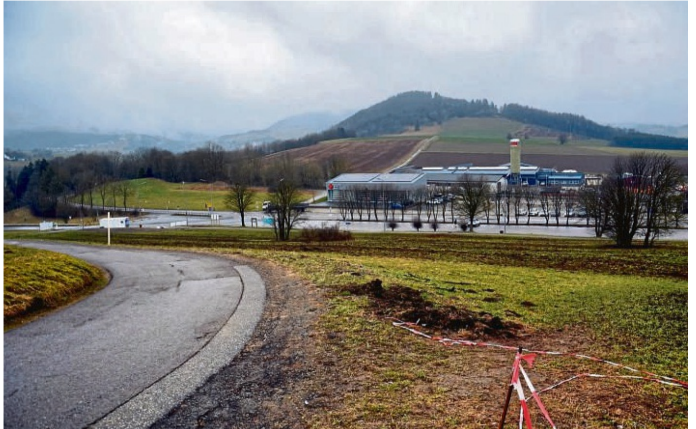
Am Weg zum Skywalk soll mittelfristig ein Gebäude mit Kiosk und Toiletten entstehen. Die nötige Planänderung geht die Kommunalpolitik an – und sieht Lösungsbedarf bei Abkürzungen über die grüne Wiese.

Der Bau sei derweil nicht kurzfristig geplant, erklärte Trachte: Die Gesellschaft wolle die weitere Entwicklung