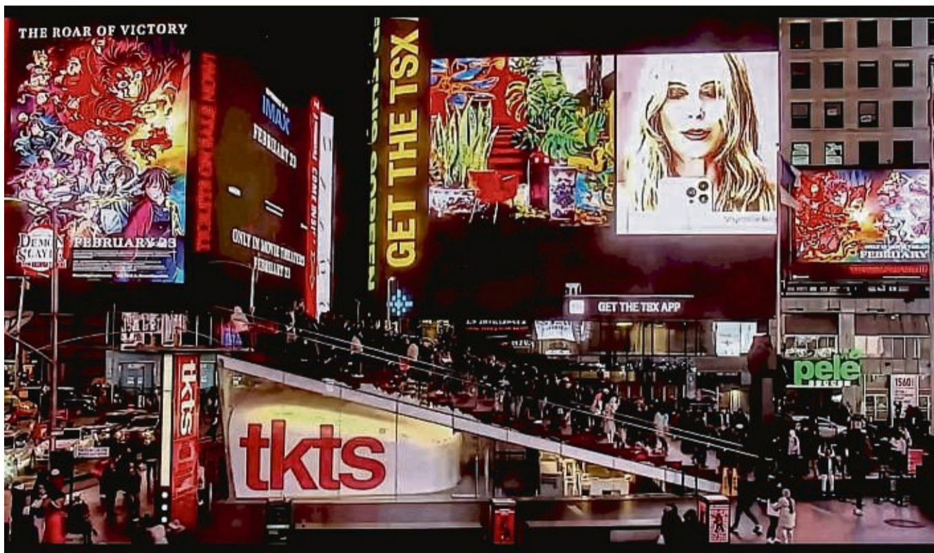
Bei einer Online-Solo-Ausstellung wird die Kunst der Korbacherin Stephanie Bing auf dem Times Square in New York auf großen Bildschirmen gezeigt.

Durch die virtuelle Präsentation von Kunst können Kunstinteressierte bequem von zu Hause aus einzigartige Werke entdecken und erwerben, dies eröffnet eine neue Welt der Kunstentdeckung für gerade für einen Personenkreis, der in entlegenen Gebieten lebt oder keine Zeit hat, persönlich Galerien zu