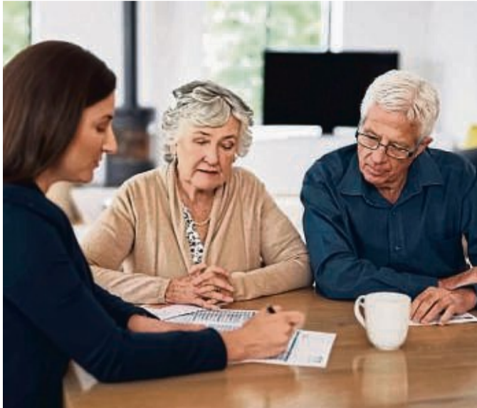
Qualifizierte Bestatter bieten persönliche Beratungsgespräche rund um die Bestattungsvorsorge.