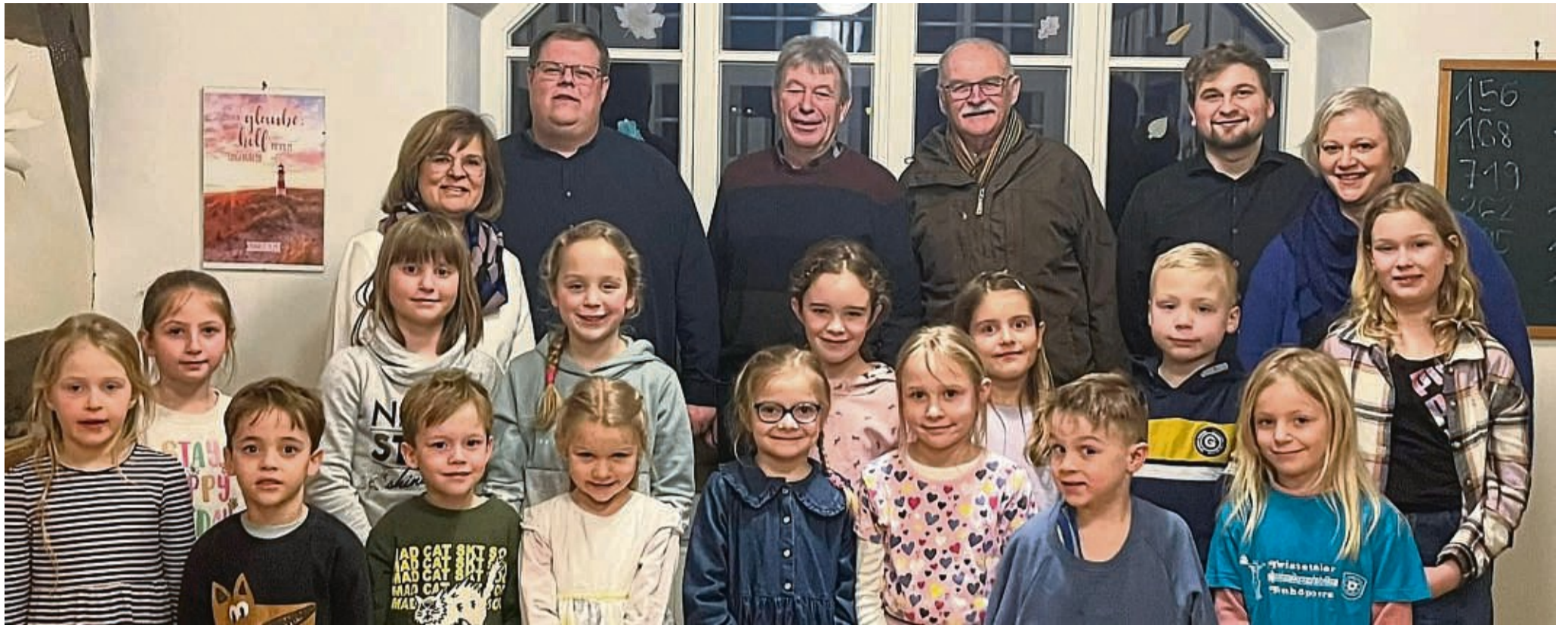
Früh übt sich: Die Twistetaler Tonhoppers werden zum Gelingen des Freischießens beitragen. Sie haben ihren großen Auftritt beim Kommersabend.