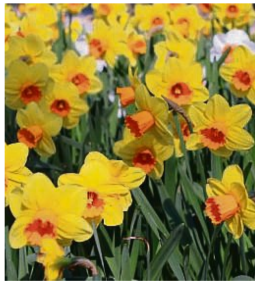
Zwiebelblüher wie Krokusse und Narzissen sorgen für ein leuchtendes Farbenspiel auf dem Grab. Zudem bieten sie Bienen und Hummeln früh im Jahr Nahrung.

blüher wie Krokusse, Narzissen und Tulpen, die jetzt in Kombination mit einem bunten Primel-Mix das Grab zum Leuchten bringen. Außerdem eignen sich Tausend-schön bzw. Gänseblümchen (Bellis), die es in den Farben Weiß, Rosa, Rot und Variationen gibt, Stiefmütterchen (Viola) in einem riesigen Farbspektrum sowie weiße, rosa- und blaublühende Vergissmeinnicht (Myosotis) als dankbare Kombinationspartner. Gänseblümchen, Vergissmeinnicht und Stiefmütterchen haben übrigens eine lange Tradition und gelten als Symbolpflanzen für die Grabgestaltung. Das Gänseblümchen steht für Bescheidenheit, Mutterliebe und Unschuld. Mit dem Vergissmeinnicht, das für Liebe