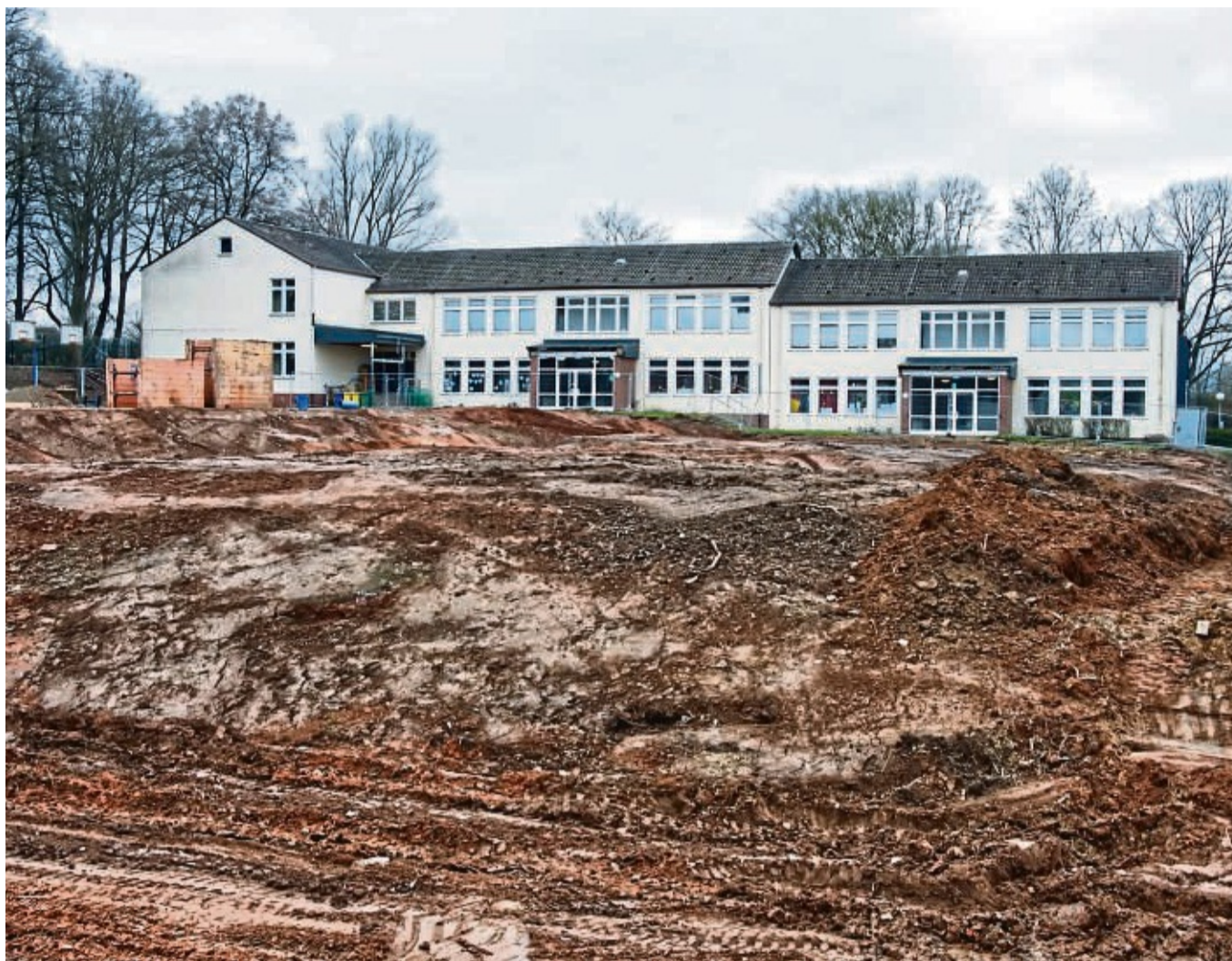
Die Berliner Schule in Korbach: Der Abriss ist fast abgeschlossen. Wenn der Neubau fertiggestellt ist, sollen die Schulbezirke in Korbach neu geordnet werden.

Der Schulbezirk umfasst das nordöstliche Stadtgebiet sowie Meininghausen. Für die vorhandene Schülerzahl wird die Schule laut Plan dauerhaft nicht über gute Raumkapazitäten verfügen. Entlastung soll die Änderung der Grundschulbezirke nach erfolgtem Neubau der Berliner Schule bringen. Der Zustand der Räume ist baulich und technisch angemessenen und entspricht teilweise den Anforderungen. Die Anforderungen an den Rechtsanspruch auf Ganztagsbetreuung sind in ausreichendem