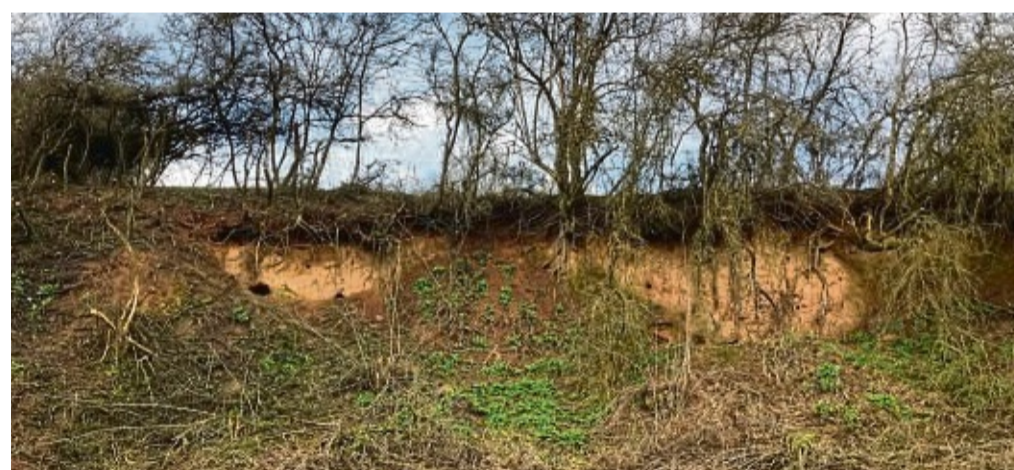
Der Landschaftspflegeverband hat eine Steilwand bei Königshagen freischneiden lassen.