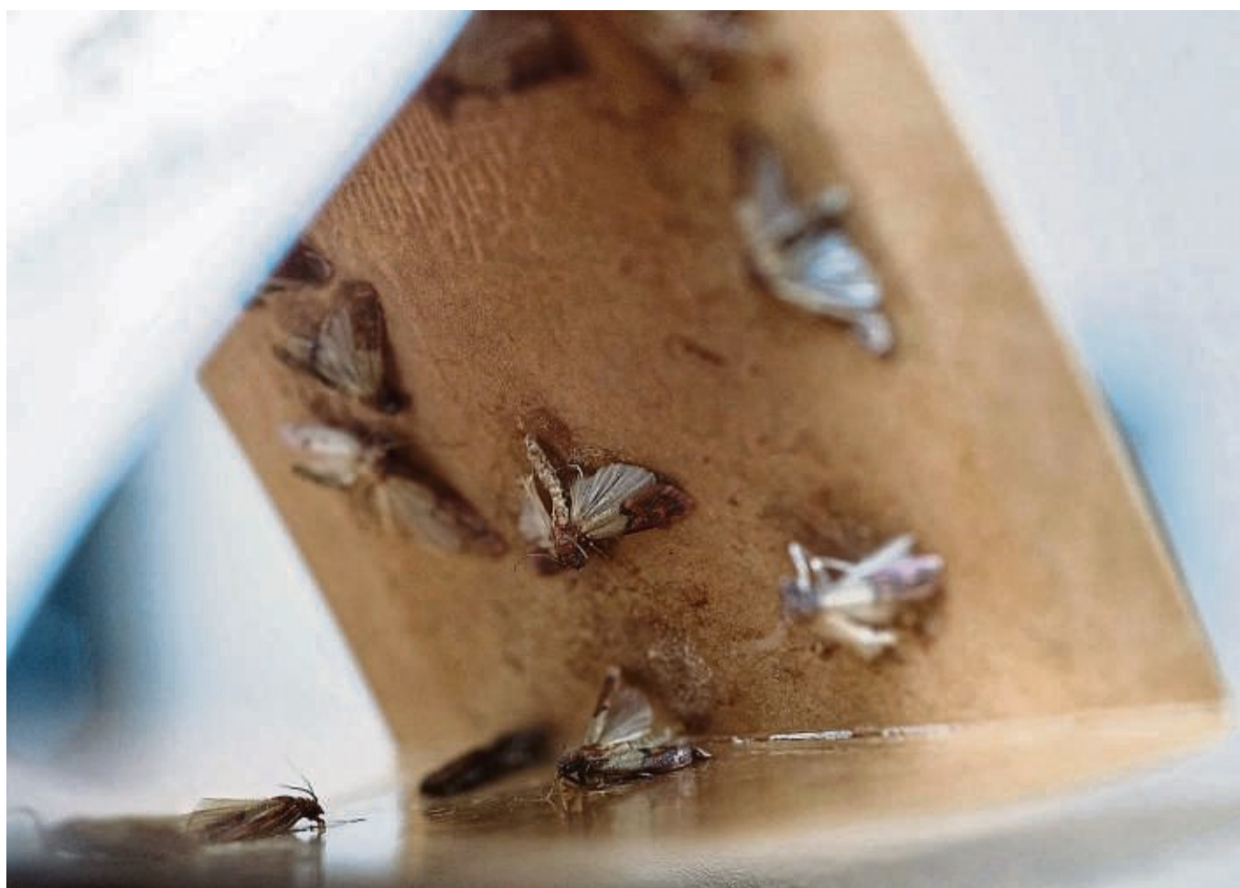
Den Mottenbefall überprüfen: Das geht mit einer Pheromonfalle.