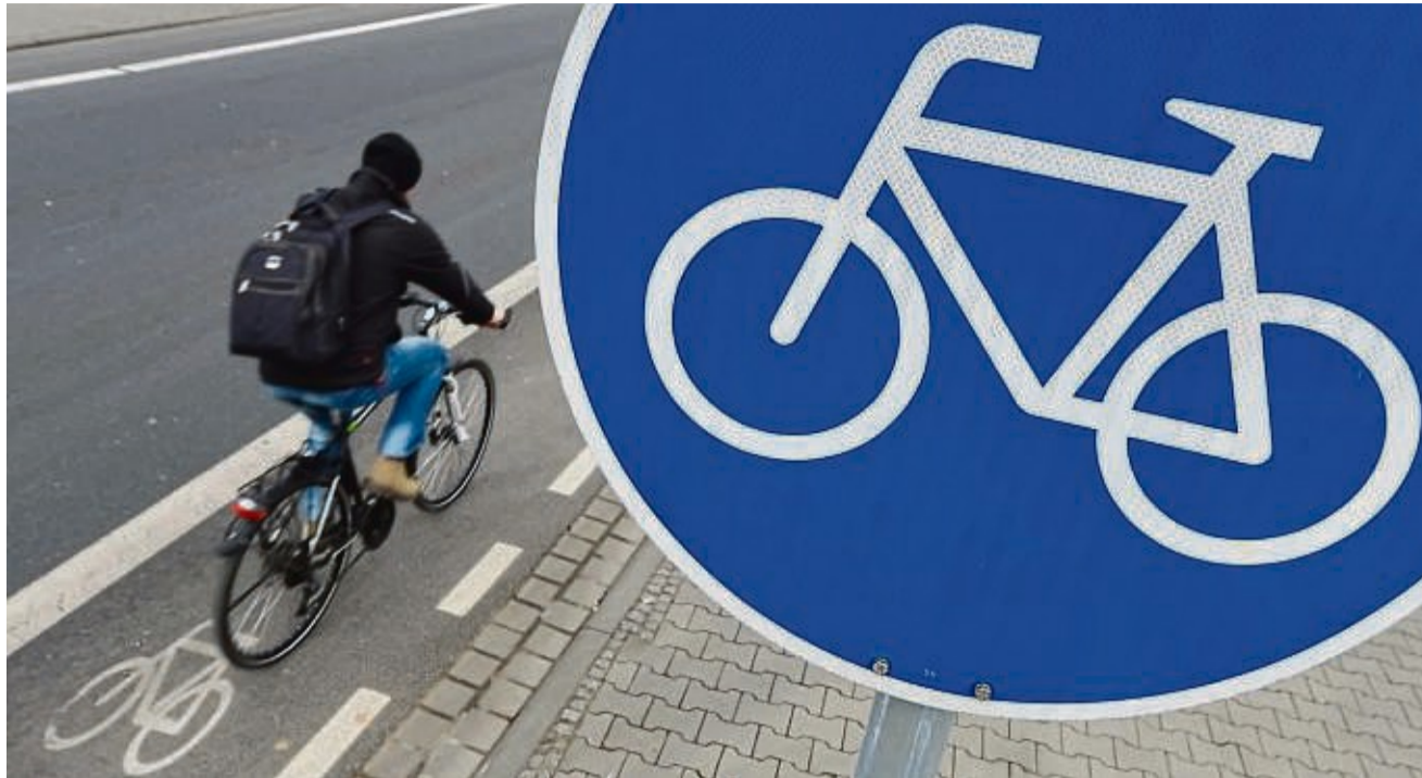
Das Fahrrad im Alltag nutzen: Um die Voraussetzungen dafür zu verbessern, hat der Landkreis ein entsprechendes Konzept aufgelegt. Den Grünen geht der Ausbau der Radinfrastruktur allerdings nicht schnell genug.

Allerdings kritisierte Koswig die aus Sicht der Grünen zu langsame Umsetzung. „Bei diesem Tempo werden wir noch Jahrzehnte für eine entscheidende Verbesserung im Radverkehr brauchen.“ Die Finanzausstattung sei viel zu gering. Neue Radwege sollten vor allem auch dann gebaut werden, wenn sie nötig seien – und nicht erst, wenn ir-