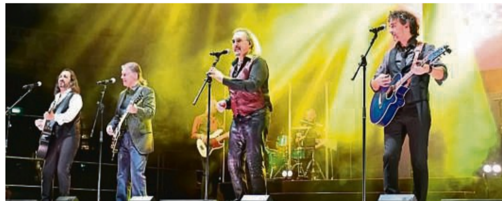
Eine farbige und temperamentvolle Show erwartet die Besucher bei: „Massachusetts – Das Bee Gees Musical.“

Bei der Auswahl sollte man sich auch an den Ergebnissen von Sommerreifentests orientieren. Online lassen sich Preise vergleichen, die auch bei einem Kauf vor Ort für einen bestimmten Verhandlungsspielraum hilfreich sein könnten. Wer online kaufen will, sollte idealerweise darauf achten, dass die Reifen sich als Option auch bei einem Vertragspartner vor Ort aufziehen lassen. Denn manche Werkstätten lehnen laut ACE die Montage ab oder verlangen einen hohen Aufpreis, wenn die eigenen Reifen mitgebracht werden.