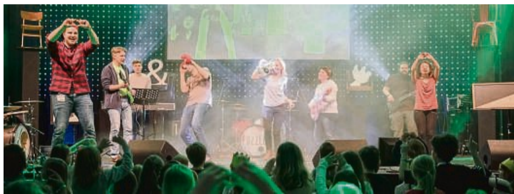
„Familienfreizeit, Glaubensfest und Schulung“ vereint das Spring-Festival in Willingen an sechs Tagen.

Zum ersten Mal ist ein „Hoffnungsfestival“ geplant. Als prominenter Gast ist Samuel Koch geladen, der vor einigen Jahren in der Fernsehshow „Wetten, dass ...“ verunglückte und seitdem querschnittsgelähmt ist. Er wird am Abend des 4. April in der Konferenzhalle des „Sauerland Stern Hotels“ darüber berichten, wie er ins Leben zurückgefunden und neue Hoffnung bekommen hat.