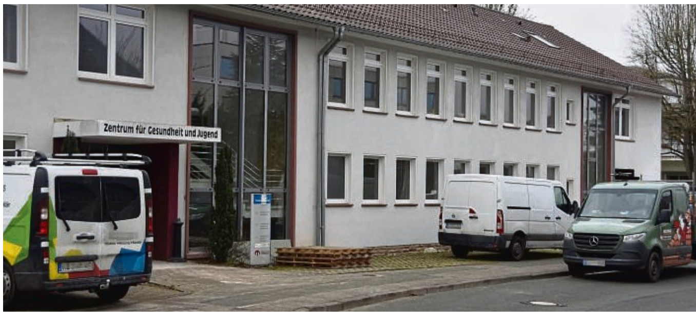
Ehemaliges Kreisgesundheitsamt in Korbach: Dort werden derzeit Kapazitäten für die Unterbringung von Flüchtlingen geschaffen.

Das meiste Geld steckt der Landkreis in diesem Jahr in seine Schulen. So sind beispielsweise drei Millionen Euro für den Neubau der Berliner Schule in Korbach vorgesehen. Außerdem fließen 2,5 Millionen Euro in die Generalsanierung der Beruflichen Schulen an der Kassler Straße