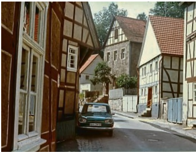
Welchen rasanten Wandel das Leben auf dem Land vollzogen hat, zeigt der Journalist Klaus Brill in seinem Vortrag am 21. März im Korbacher Museum. Das Bild zeigt den Ascher in Korbach im Jahr 1974.

Der Vortrag ist am Donnerstag, 21. März, im Museum zu hören. Beginn ist um 19.30 Uhr.