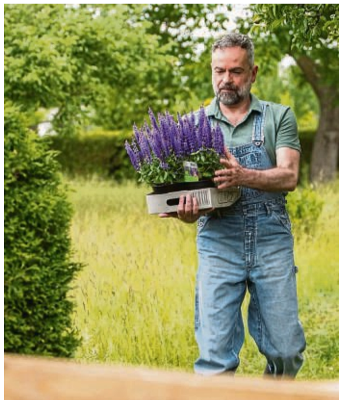
Stauden wie der Ziersalbei sollten erst ins Beet, wenn der Boden frostfrei ist. Am besten wartet man damit bis nach den Eisheiligen.

Für das Beet besonders geeignet ist der Blutweiderich (Lythrum salicaria), erklärt der Bund deutscher Staudengärtner. Diese Staude lässt sich unter anderem schön kombinieren mit A stern, Salbei und Sonnenhut.