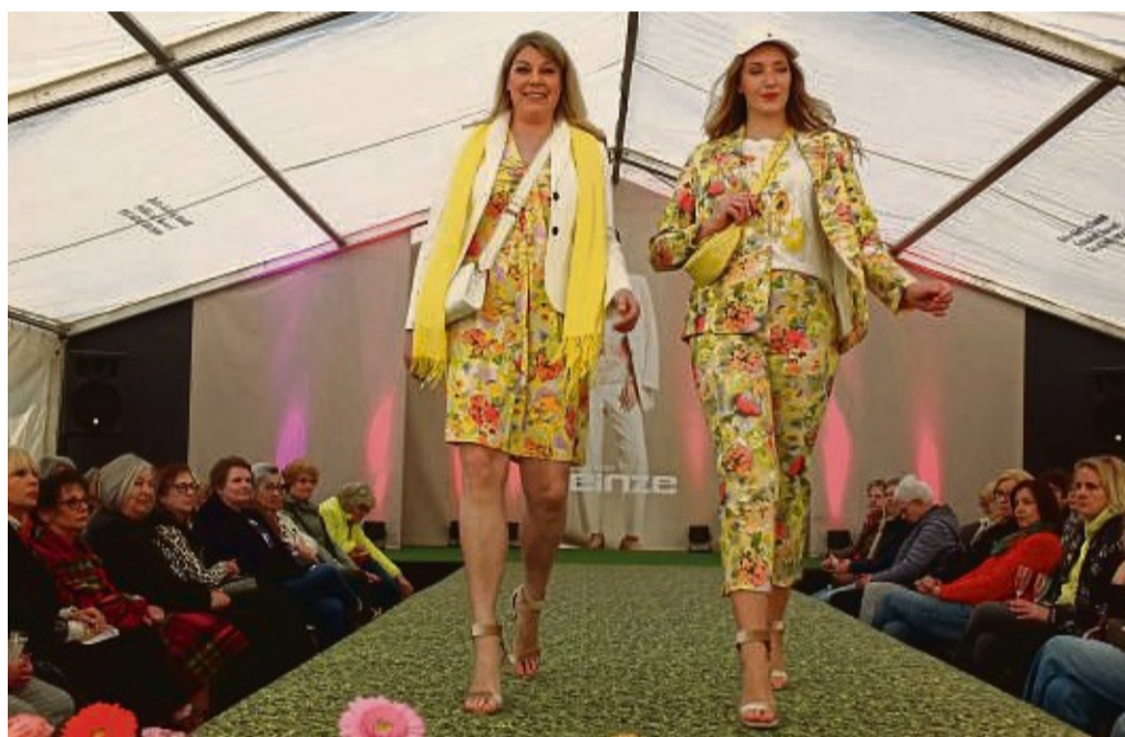
Kunterbunte Sommermode wurde bei den Präsentationen des Modehauses Heinze gezeigt.

Wem das großzügige Orange, Pink oder Lila zu auffällig ist, der kann jederzeit auf schwarz-weiße Eleganz zurückgreifen - hier wurden schlichte, gut tragbare Kleider gezeigt, geeignet fürs Bü-