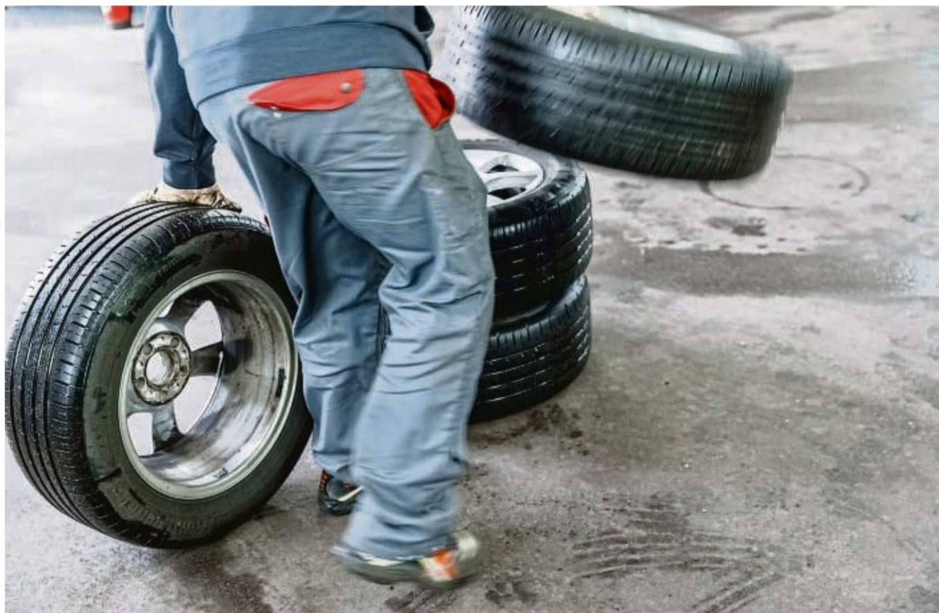
Faustregeln können nur ein grober Anhaltspunkt sein. Für den richtigen Zeitpunkt zum Reifenwechsel sollten Autofahrer besser den langfristigen Wettertrend im Auge behalten.

Ab einem Alter von sechs Jahren sollten zudem Experten die Reifen auf Tauglichkeit überprüfen. Mit der Zeit kann nämlich die Gummimischung spröde werden. Das Alter verrät die vierstellige DOT-Nummer (für Kalenderwoche und Jahr der Produktion) auf der Reifenflanke.