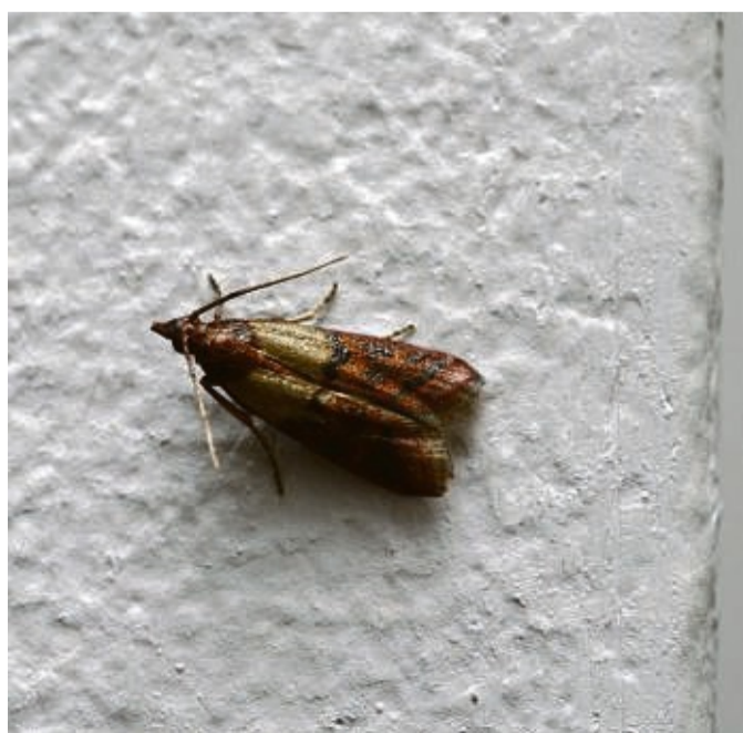
Befällt Trockenobst, Nüsse, Kakao, Kräuter und Gewürze: die Dörrobstmotte.