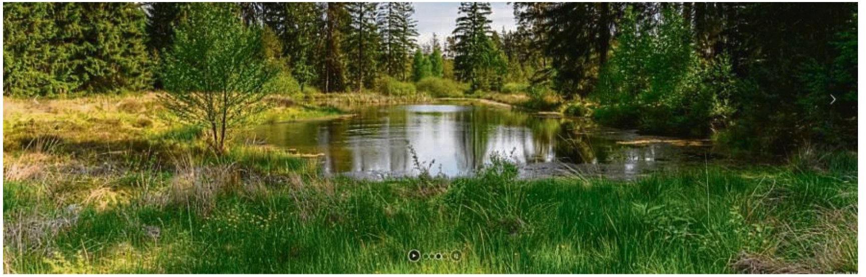
Auf die Schönheiten der Natur in der Region Burgwald-Ederbergland macht der neue Internetauftritt der Wanderregion Burgwald-Ederbergland aufmerksam.