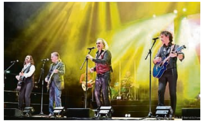
Eine farbige und temperamentvolle Show erwartet die Besucher bei: „Massachusetts – Das Bee Gees Musical.“

Den musikalischen Part übernehmen „The Italian Bee Gees“. Die ambitionierten italienischen Egiziano-Brüder (es sind wirklich drei Brüder!), stehen in engem Kontakt mit der Familie Gibb und sind seit Jahren auf den Spuren ihrer großen Vorbilder unterwegs. Weltweit haben sie sich bereits eine eingeschworene Fangemeinde erworben und erspielt und besitzen die alleinige Legitima-