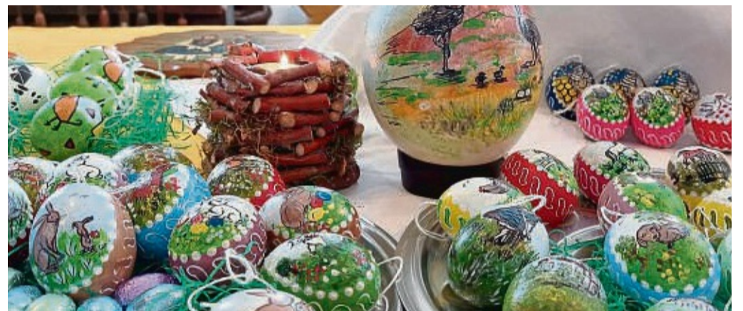
Vom Wachtelei bis zum großen Straußenei: Die Besucher konnten zahlreiche bemalte Eier bestaunen.