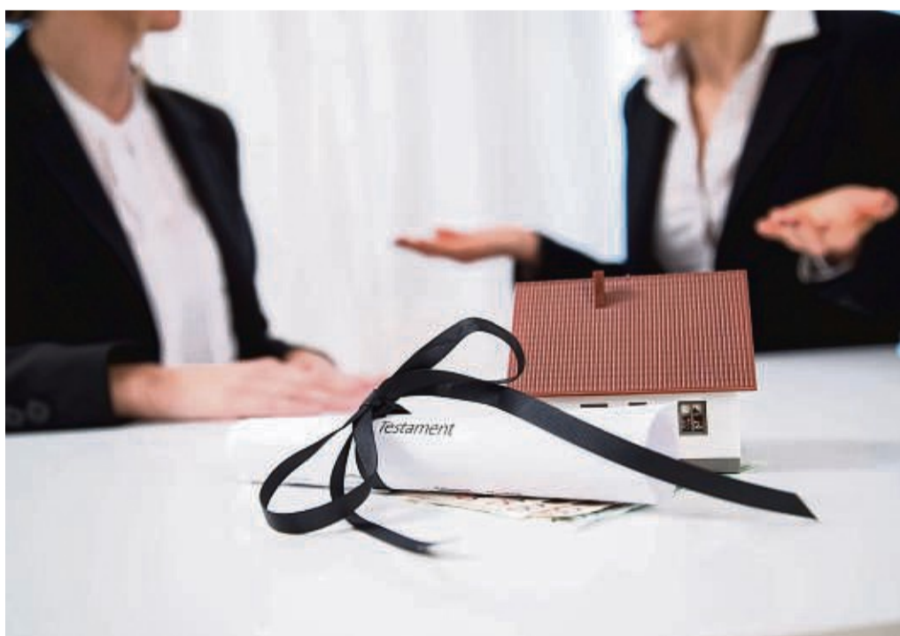
Was soll nach dem Tod der Eltern mit dem Familienheim passieren? Gibt es mehrere Erben, müssen sich diese untereinander einigen, wenn keine klare Regelung aus dem letzten Willen der Erblasser hervorgeht.

Erben zum Beispiel drei Kinder das Elternhaus, müs-