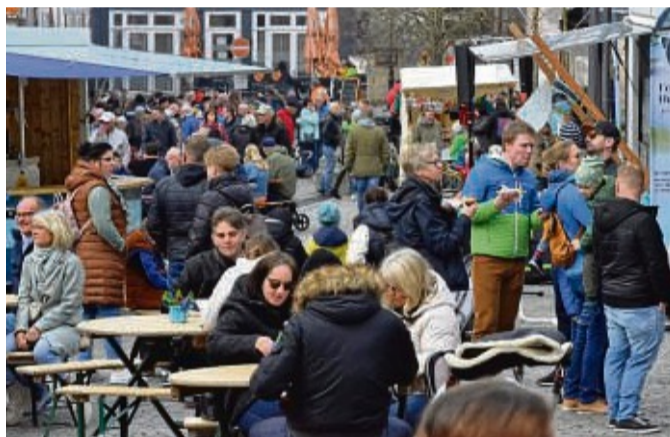
Vereinzelt zeigte sich die Sonne: Das Wetter nutzten zahlreiche Besucher, um zum Ostermarkt zu gehen.