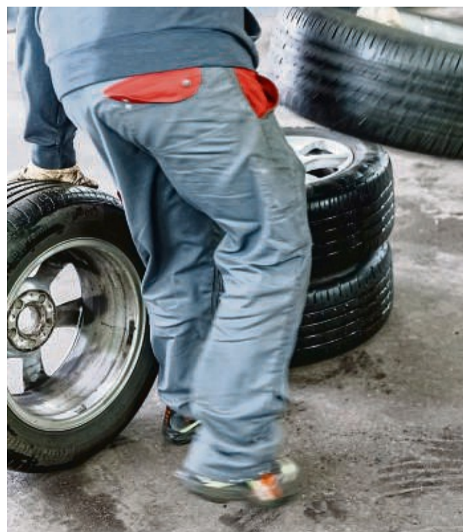
Faustregeln können nur ein grober Anhaltspunkt sein. Für den richtigen Zeitpunkt zum Reifenwechsel sollten Autofahrer besser den langfristigen Wittertrend im Auge behalten.

Bei der Auswahl sollte man sich auch an den Ergebnissen von Sommerreifentests orientieren. Online lassen sich Preise vergleichen, die auch bei einem Kauf vor Ort für einen bestimmten Verhandlungsspielraum hilfreich sein könnten. Wer online kaufen will, sollte idealerweise darauf achten, dass die Reifen sich als Option auch bei einem Vertragspartner vor Ort aufziehen lassen. Denn manche Werkstätten lehnen laut ACE die Montage ab oder verlangen einen hohen Aufpreis, wenn die eigenen Reifen mitgebracht werden.