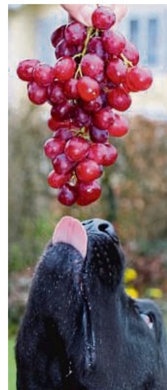
Viele Hunde vertragen Weintrauben und Rosinen nicht – also besser nicht füttern.