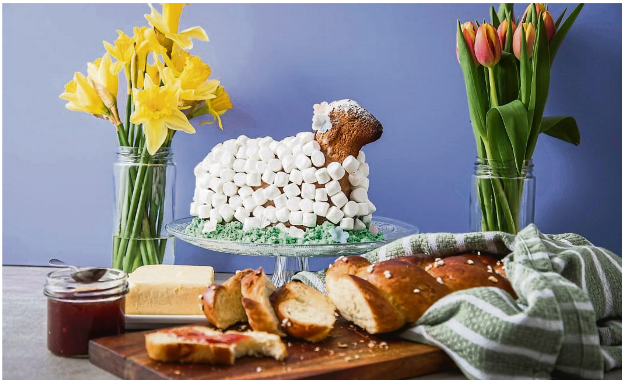
Das mit Marshmallows betupfte Osterlamm thront auf einer Wiese aus grün gefärbten Kokosraspeln. Davor lädt der angeschnittene Hefezopf zum Zugreifen ein.