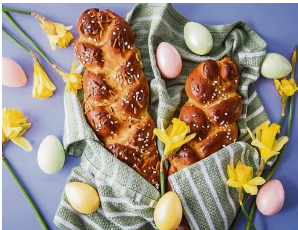
Hagelzucker und Mandelsplitter verpassen den Hefezöpfen den letzten Schliff.

Für eine 0,8-Liter-Osterlamm-Backform trennt die Konditormeisterin 2 Eier. Das Eigelb schlägt sie mit 1 Pck. Vanillezucker, etwas abgerie-