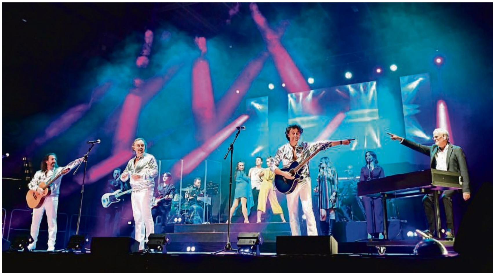
Eine farbige und temperamentvolle Show erwartet die Besucher bei: „Massachusetts – Das Bee Gees Musical.“