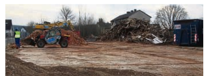
Die Süßmuth-Hallen in Immenhausen sind Geschichte: Das Gelände wird jetzt geprüft.

Vor der weiteren Planung hatte die Stadt den Boden im Bereich des ehemaligen Schleifereigebäudes untersuchen lassen. Demnach sei die Bodenbelastung in dem Bereich „überschaubar“. Für gezielte Bebauungen und Entsiegelungen könnten weitere Untersuchungen notwendig werden, sagte Obermann. Das werde entschieden, wenn das Konzept für die zukünftige Bebauung vorliegt. Nach dem Abriss der Hallen waren Sperrmüll aus dem Keller geräumt und das Baumaterial abgefahren worden. Obermann rechnet mit dem Abschluss der Aufräumarbeiten bis Ende März.