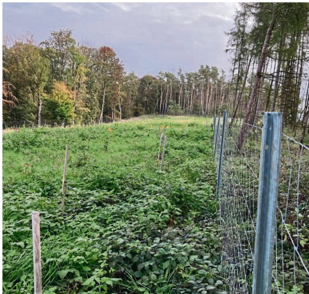
Wie hier im Gatter Deiselberg hat Trendelburg seinen Stadtwald seit 2020 umfangreich aufgeforstet. Insgesamt wurden 29 500 Bäume gepflanzt.

Darin sollen insbesondere die neuen Radwege Diemel-Twiste-Runde und Twiste-Radweg sowie die Bio-Börde-Tour vorgestellt werden.