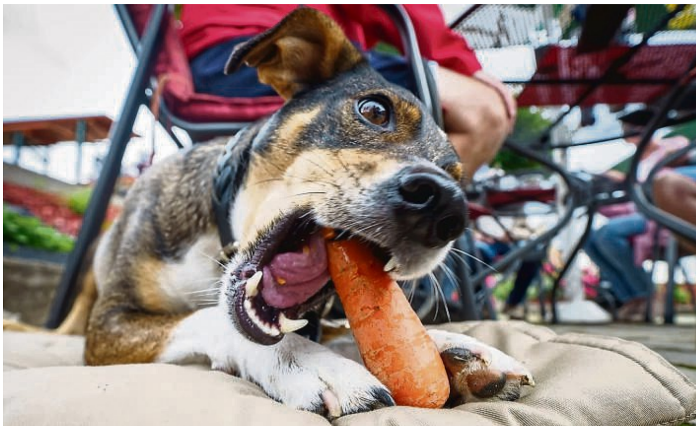
Kein Problem, wenn Hunde gerne Karotten fressen – Gemüse ist bis auf einige Ausnahmen unbedenklich.

Auch Formeln, wie viel von einem Lebensmittel für welchen Hund schädlich sein könnte, gibt es nicht: „Das ist ein schwieriger Punkt, weil ja