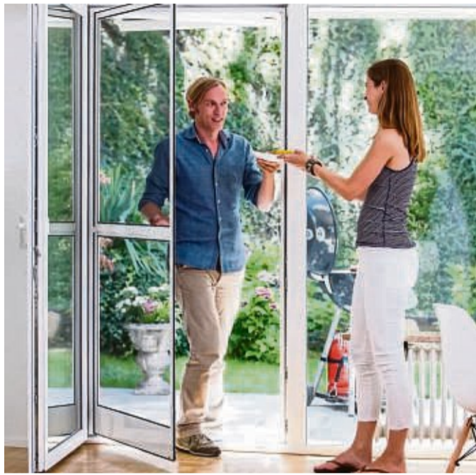
In beide Richtungen öffnende und selbstschließende Insektenschutz-Pendeltür.

„Achten Sie darauf, dass der Ein- und Ausbau der Rahmen rasch mit den entsprechenden Haltern am Fenster vorstatten gehen kann“, empfiehlt Fensterexperte Lange und ergänzt: „Übrigens lassen sich die Spannrahmen nach längerer Nut-