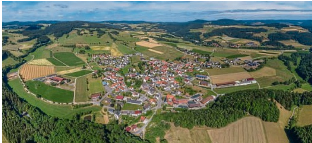
Eimelrod liegt inmitten der Berge. Beim Jubiläum lässt sich der Ort bei Hubschrauberrundflügen aus der Luft bewundern.

Dem Tourismus der Region hat Eimelrod wohl seine vergleichsweise hohe Dichte an