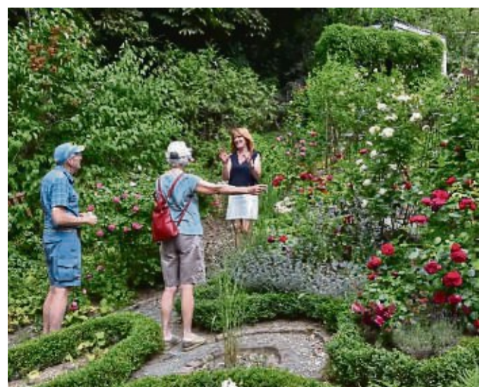
Für die Tage der offenen Gärten 2024 können sich noch weitere Teilnehmer anmelden, die ihre grünen Oasen in diesem Jahr vorstellen möchten.