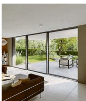
Bodentiefe Schiebefenster ermöglichen weite Ausblicke.

Bei Fassadenverglasungen spielen sowohl funktionelle als auch ästhetische Faktoren eine Rolle. Wer Elemente wünscht, die auch geschlossen möglichst weite Ausblicke nach draußen ermöglichen, sollte bodentiefe Schiebefenster einsetzen. Sie bieten auch in der dunklen