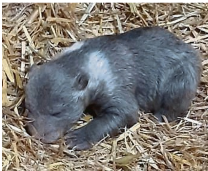
Linnea heißt das Braunbärbaby, das seit Anfang des Jahres zur tierischen Familie im Wildpark Knüll gehört.

Nun komme es in den nächsten Wochen darauf an, dass die Bärenmutter die Aufzucht ihres Jungen wei-