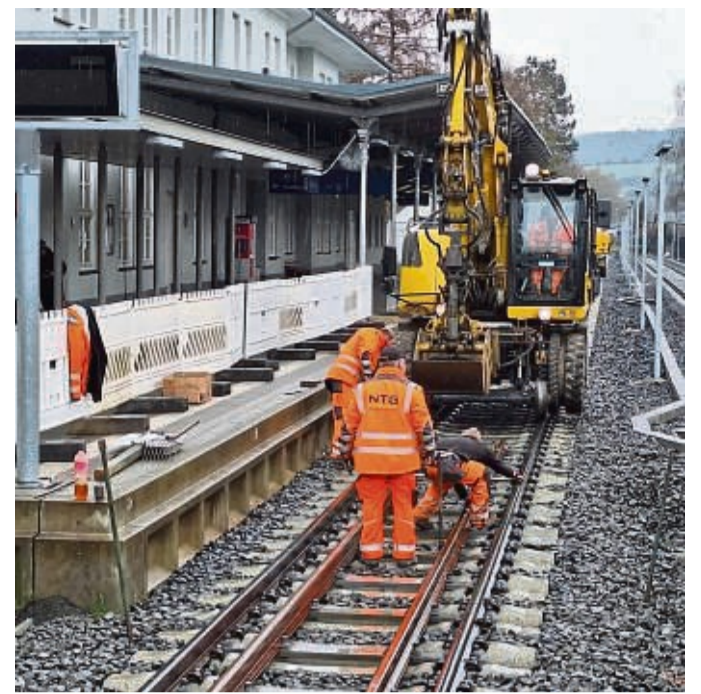
Gleisarbeiten am Bahnhof Bad Wildungen. Die Wiedereröffnung der Strecke verzögert sich bis Mitte Mai.