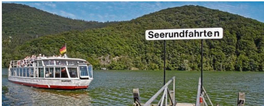
Beliebte Rundfahrten: Es gibt Hoffnung, dass die „MS Muffert“ auch künftig auf dem Diemelsee ihre Runden drehen kann.