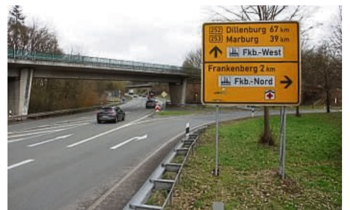
Die Brücke, die aus Frankenberg auf die B252/253 führt, wird bis Anfang Juni voll gesperrt.