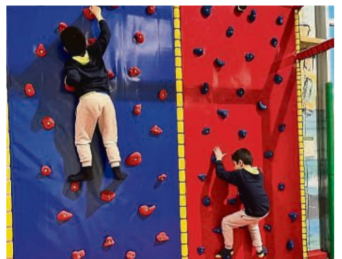
Spaß an der Kletterwand ist nur eine der vielen Möglichkeiten im LaLeLu Abenteuerland.

Mit der kleinen Braunbärin ist der Tierpark wieder um eine echte Attraktion reicher. Aber auch bei anderen Tierarten im Wildpark Knüll hat sich inzwischen Nachwuchs eingestellt. So ist bei den Rhönschafen und den Zwergziegen der erste Nachwuchs schon da. Und in den nächsten Wochen wird sich auch bei weiteren Tieren der Nachwuchs noch einstellen, so z.B. bei den Wildschweinen und Wildschafen sowie dem Rotwild und den Wildpferden. ma