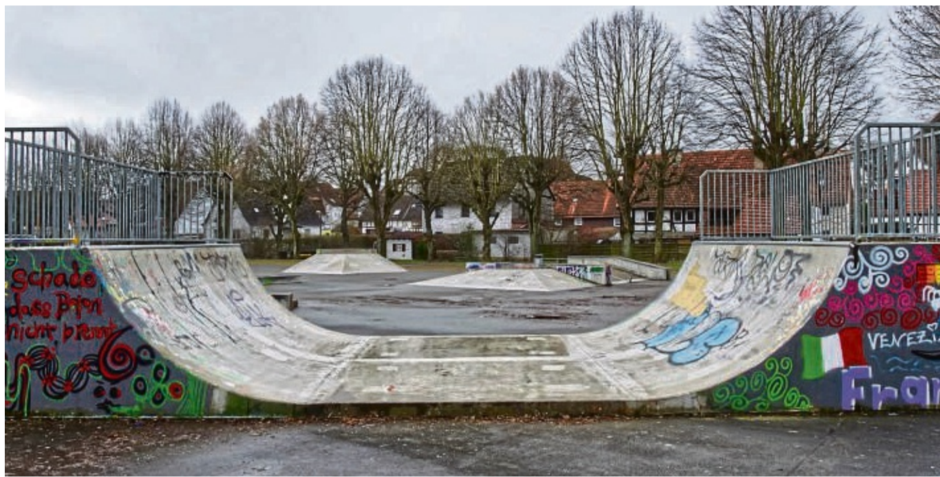
Die Skateranlage in der Allee: Das Areal soll zum zentralen Spiel- und Aufenthaltsplatz umgebaut werden.