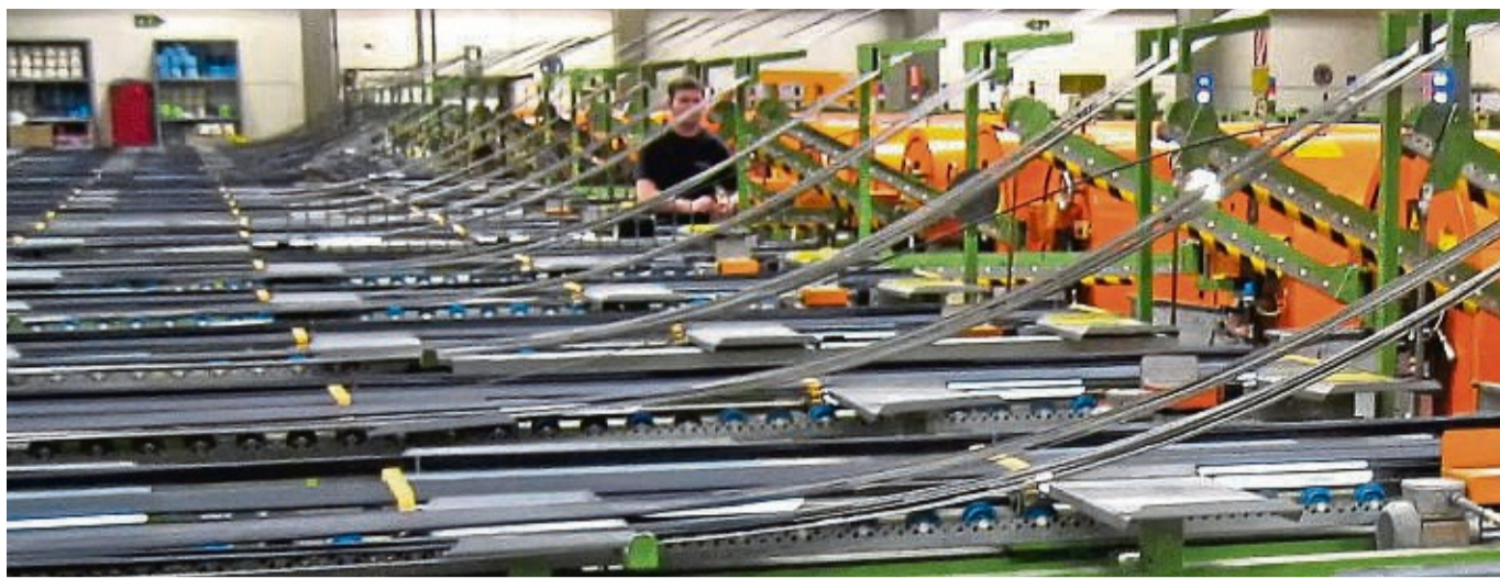
Schlauchproduktion bei Contitech in Korbach: Durch die Umstrukturierungen sollen bis zu 20 Arbeitsplätze wegfallen. Betriebsbedingte Kündigungen sollen aber weitgehend ausgeschlossen werden.