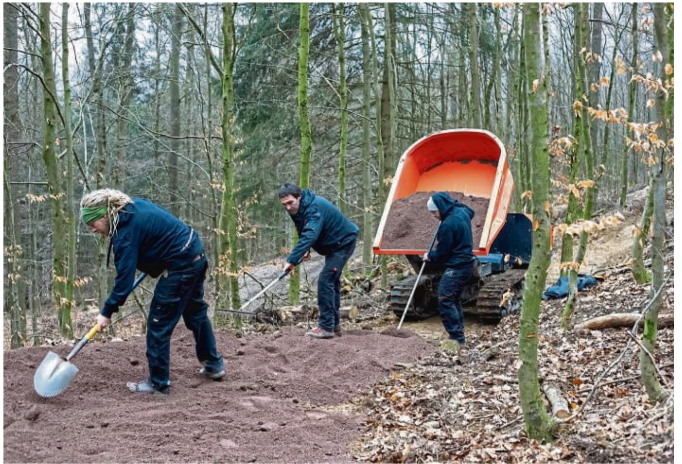
Zuwachs für die Green-Trails: Der Streckenbelag wird auf dem Themen-Trail am Diemelsee aufgebracht. Der Transport des Materials erfolgt mit leichtem Gerät, die Verteilung per Hand.

Einfache Orientierung auf den Trails, aktuelle Informationen sowie touristische und gastronomische Angebote in den Regionen – all das verspricht die App, die aktuell dank einer Smart-Region-Förderung des Landes Hessens entsteht. Die Anwendung wird vom Zweckverband Green Trails gemeinsam mit der Agentur „Scholz & Volkmer“ aus Wiesbaden entwickelt und wird auch eine Funktion bieten, Schäden oder Verbesserungsvorschläge zu melden. „So bieten wir der Bike-Community die Möglichkeit, aktiv an der Qualitätssicherung des Projekts mitzuarbeiten“, beschreibt Projektleiter Matthias Schäfer eine der besonderen Funktionen der App. Spätestens ab Frühsommer wird die App für Apple und An-