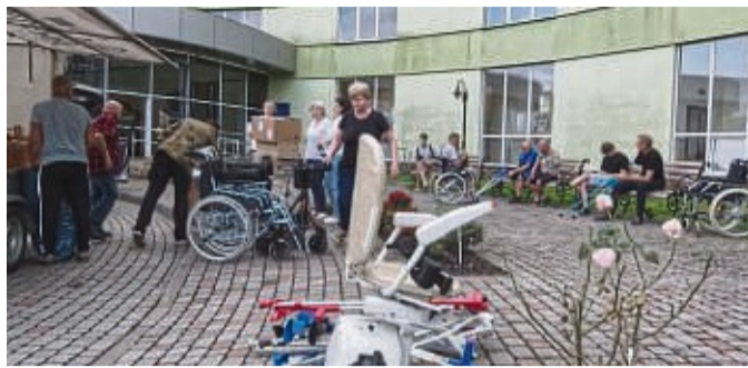
Hilfe aus Nordwaldeck für ein Sanatorium in der Ukraine. Der nächste Hilfstransport ist in Vorbereitung.

In der ersten Aprilwoche wollen sie nach Lviv (Lem-