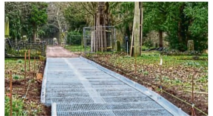
Im Totenhagen werden Wurzelbrücken zum Schutz der Bäume an den Wegen eingebaut.

In den nächsten Tagen werden im Herrschaftlichen Hagen die neuen Bäume gepflanzt. Die bestehenden Bäume zwischen Freilichtbühne und Wollweberturm werden an den Wegen mit sogenannten Wurzelbrücken aus Gitterrosten aus feuerverzinktem Stahl geschützt. Sie überspannen die Baumwur-