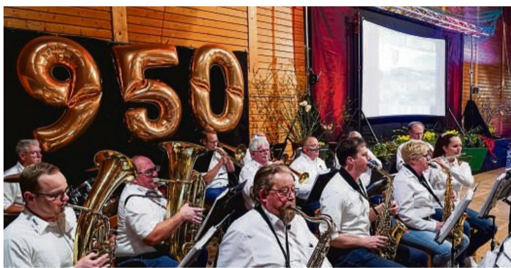
Sorgen für die musikalische Begleitung: Das Ahle Blech vom TSV umrahmte den Abend in der Berglandhalle musikalisch.