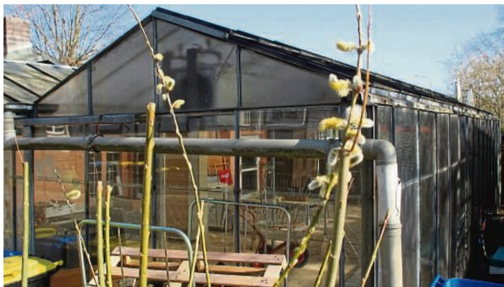
Vom Glashaus zum Gasthaus: Die ehemaligen Gewächshäuser des Blumenhauses werden in die Gastronomie mit einbezogen und werden dann auch vom Biergarten aus begehbar sein.

Geöffnet ist die Kleine Kneipe von 11.30 bis 14 sowie