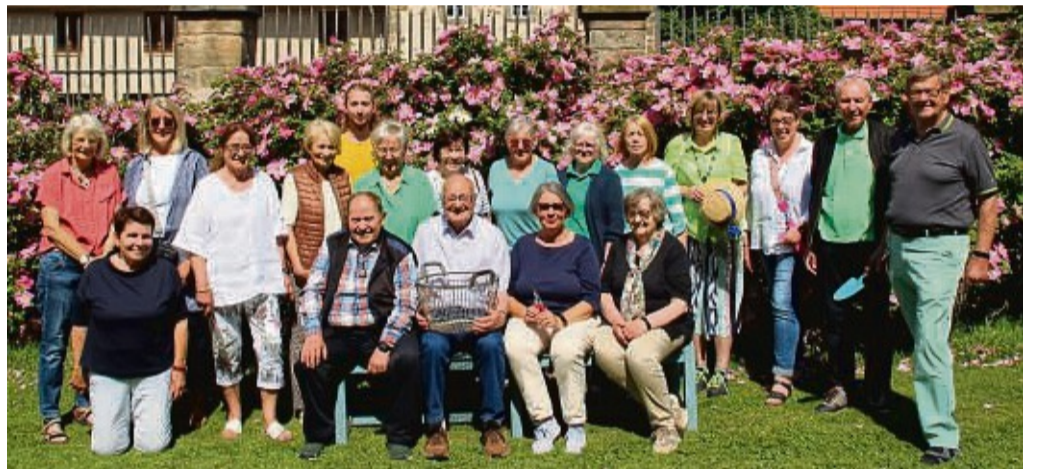
Die Rosenfreunde des Fördervereins Kloster Haydau: Es zeigt die Helferschar nach einem Arbeitseinsatz im Sommer vorigen Jahres.

Der Arbeitskreis Orts- und Klostergeschichte habe 2515 Euro investiert. Das sei durch