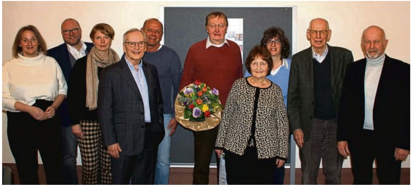
Ehrungen beim Förderverein Kloster Haydau: Unser Bild zeigt nur einen Teil der Geehrten. Ihnen wurde für die finanzielle Unterstützung und für 25-jährige Mitgliedschaft gedankt.

Die umfangreiche Dachsanierung sei abgeschlossen. 78 627 Euro seien investiert worden. Davon seien 40 300 Euro aus der Stiftung Kloster Haydau geflossen. 12 081 Euro gehen in eine Rücklage für die Dachsanierung. Man hoffe noch auf eine Versicherungsentschädigung von 7000 Euro, erläuterte Koch. Geplant sei, in eine energie-