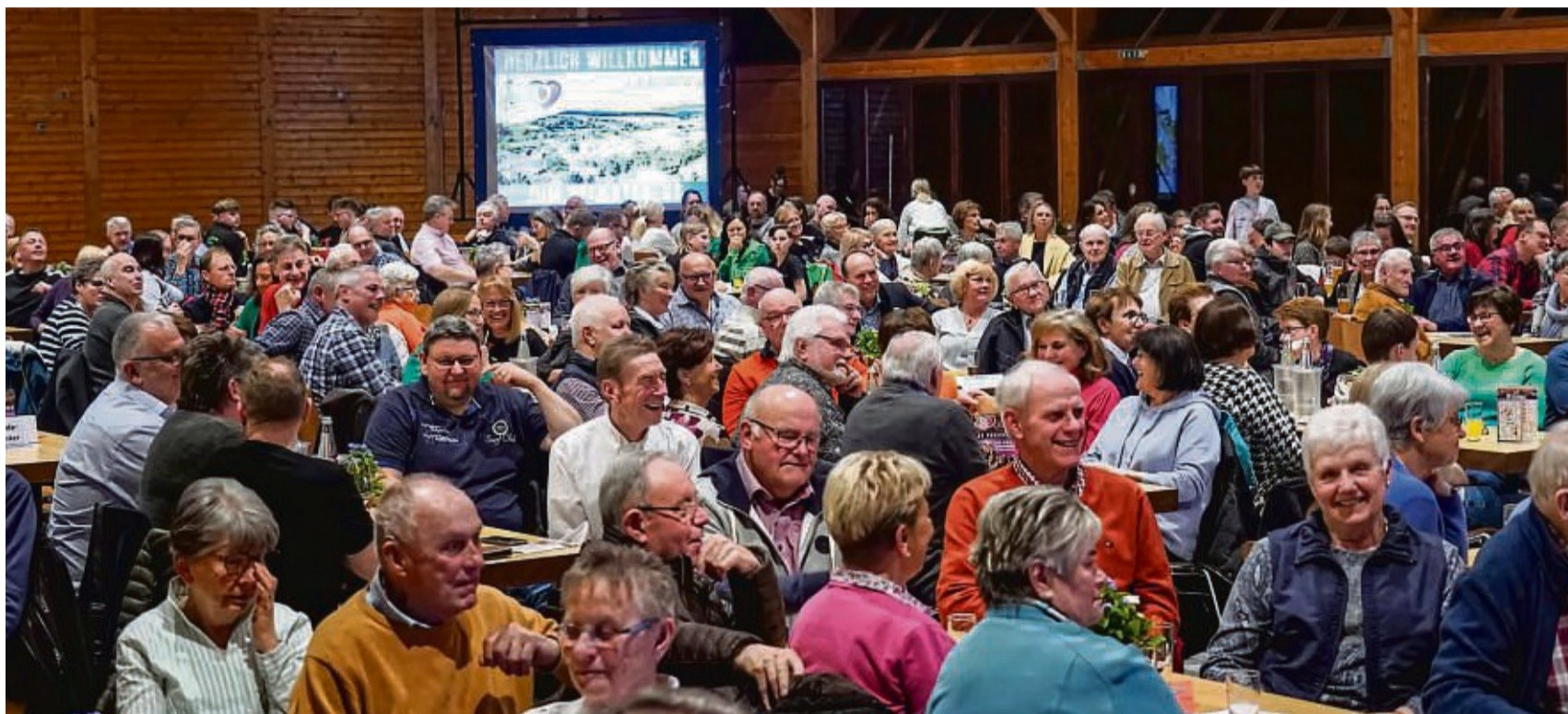
Volles Haus im Jubiläumsjahr: 450 Gäste kamen zum Körler Heimatabend in die Berglandhalle. Ein launiger Abend mit prominenten Gästen.

Die Besucher erwartete ein abwechslungsreiches Programm, das feierlich vom TSV Ahle Blech eröffnet wurde. Und es dauerte nicht lang, bis die ersten Gäste im Takt mitwippten. Mit seinem stolzen Alter von 142 Jahren durfte ein Verein beim Fest nicht fehlen: der Gesangverein Körle, der älteste Verein in der Gemeinde. „Dies ist ein großer Tag“ – besser hätte der