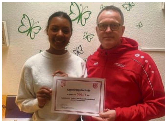
Finanzielle Unterstützung: Der Ambulante Kinder- und Jugendhospizdienst Kassel/Nordhessen freute sich über die Spende des TSV 05 Remsfeld.