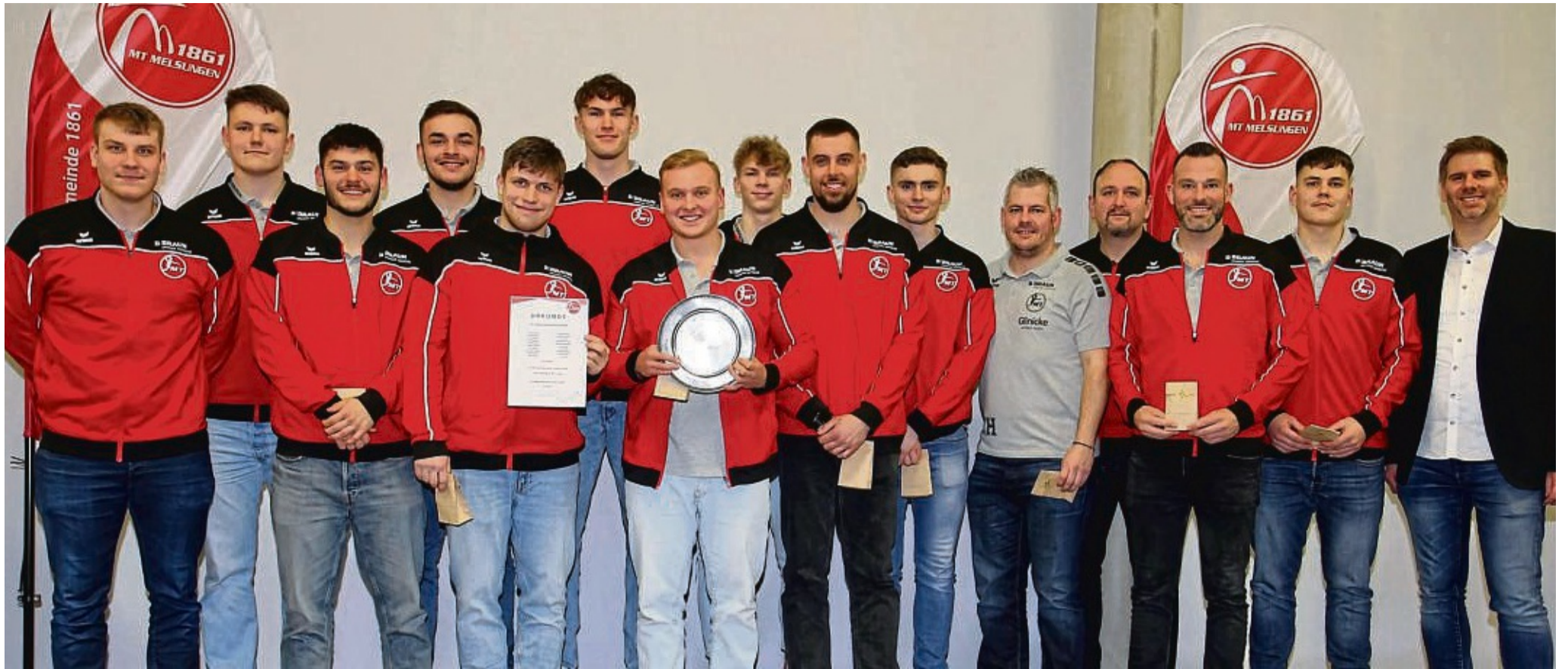
Hauen sich immer voll rein: Als Mannschaft des Jahres wurde die 2. Männermannschaft der Handballer ausgezeichnet.