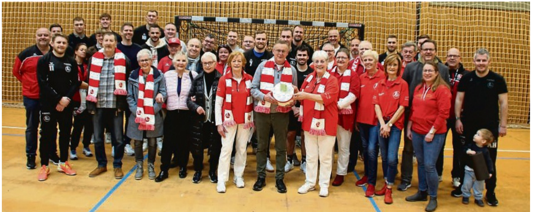
Spendenübergabe in der Melsunger Stadtsporthalle: MT-Handballer, Mitglieder des Bartenwetzter-Fanclubs und Gäste aus der Gemeinde Schuld im Kreis Ahrweiler. Sie haben die Melsunger Spendenaktion als vorbildlich gewürdigt und sich bedankt.