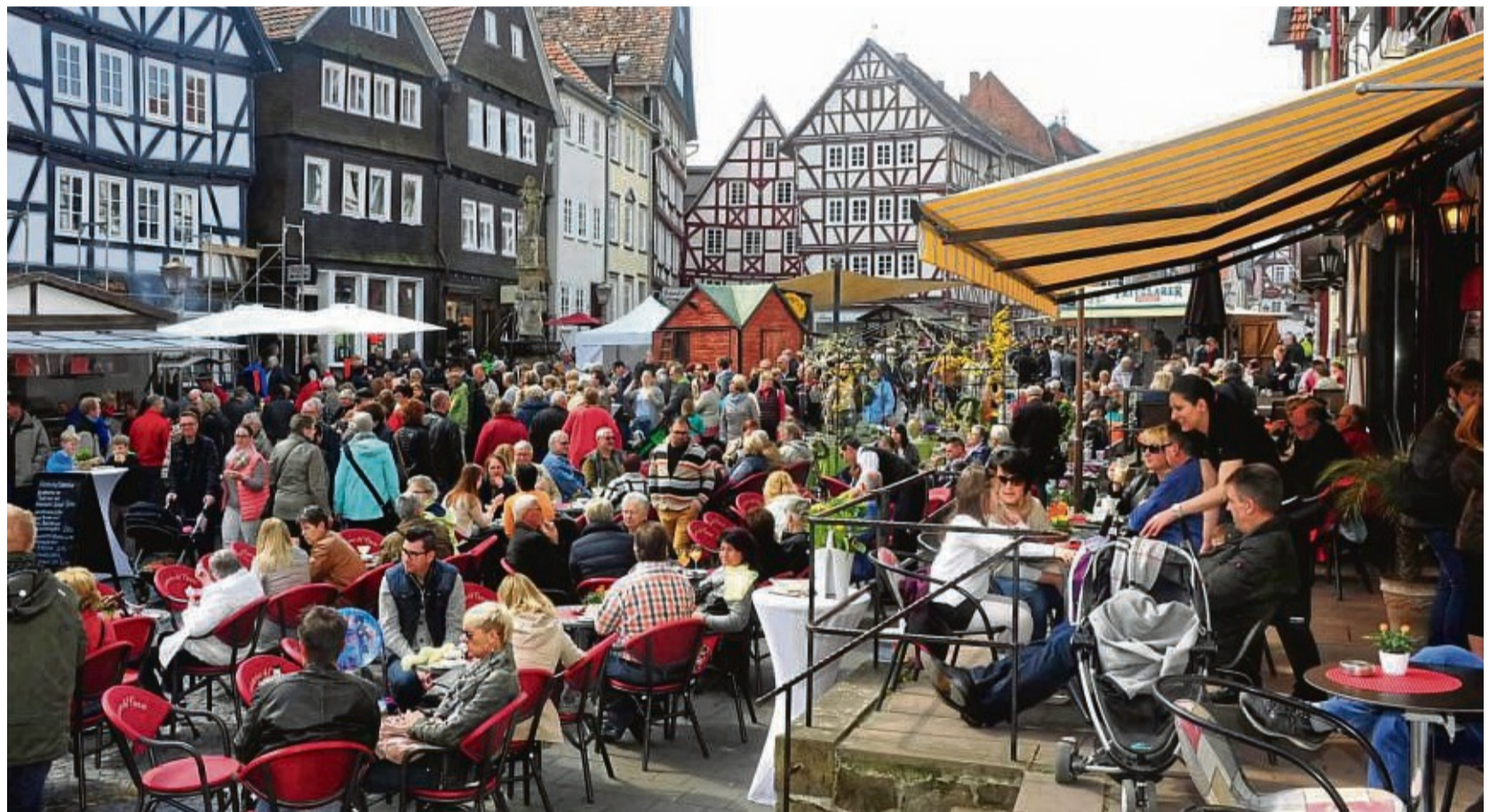
Es ist einladend, auf den Terrassen der Cafés, Eisdielen und Restaurants zu verweilen und deren Spezialitäten zu genießen.