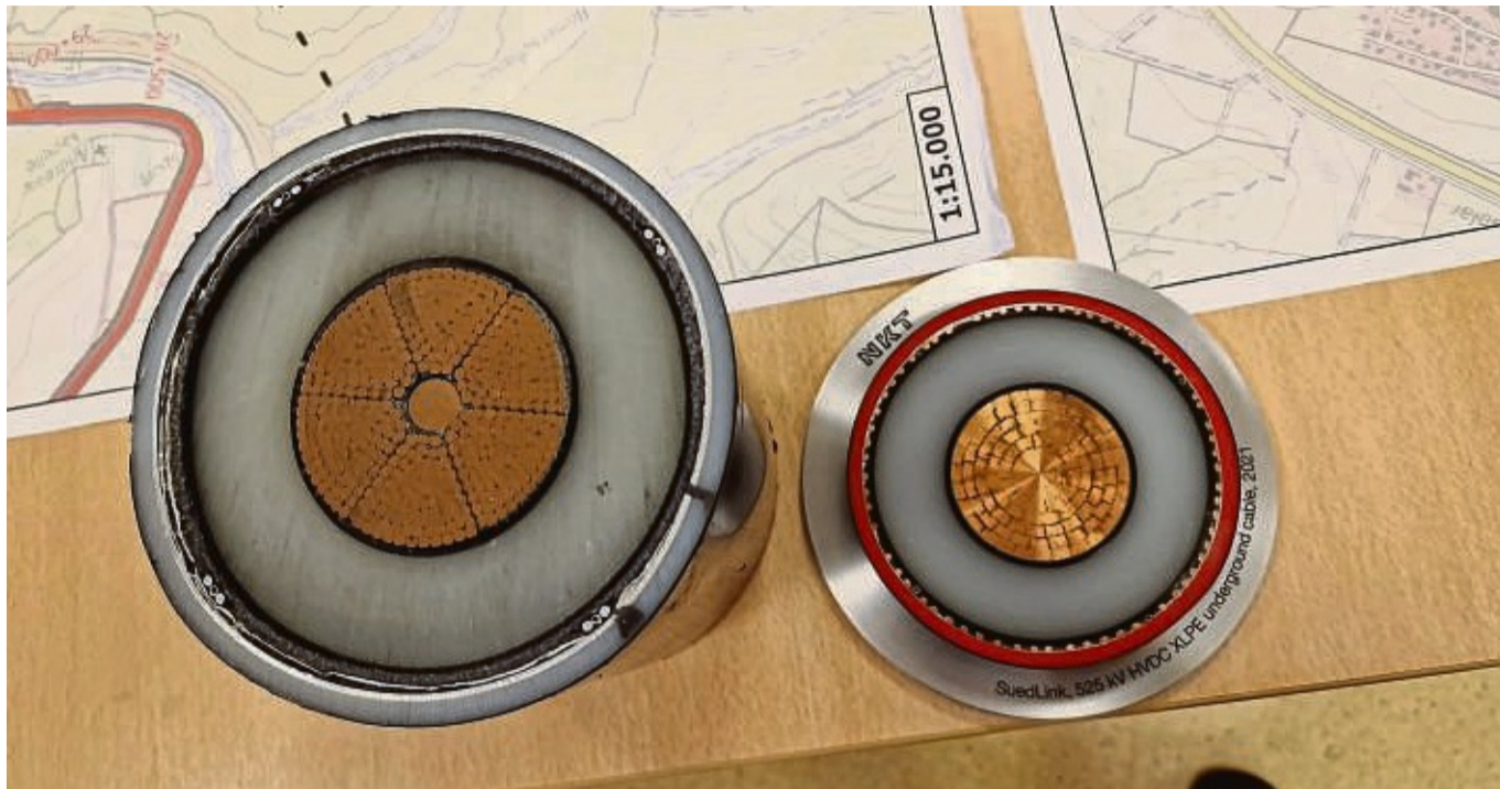
Sie sollen den Süden mit Strom aus Windkraft versorgen: die Starkstromkabel der Trassen Suedlink, NordWestlink und SuedWestlink, die auch durch den Werra-Meißner-Kreis verlaufen werden.

Bei der Trassenführung habe man sich bemüht, mög-