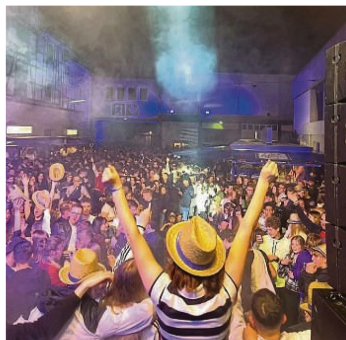
Voller Hof beim Brauereifest der Eschweger Klosterbrauerei vor zwei Jahren.

Für die kleinen Besucher gibt's ein Spielmobil, eine Hüpfburg, Infos für Groß und Klein hält die Markthalle Werra-Meißner bereit, ebenso kulinarisches heimischer Anbieter, während „Eschwege hilft“ Gebäck aus der ganzen Welt anbietet.