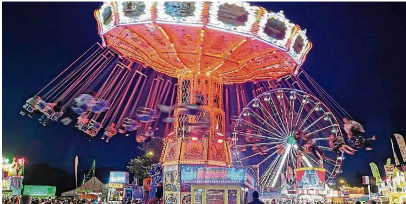
Eschwege in Bildern zeigen: Wie hier das Johannistfest. Zum großen 1050-Jahre-Jubiläum der Kreisstadt ruft der Kunstverein alle Hobbyfotografen dazu auf, Fotos zum Motto „typisch Eschwege“ einzureichen.

Foto zugelassen. Der Ausstellungsraum im Hochzeitshaus bietet Platz für 70 Arbeiten.