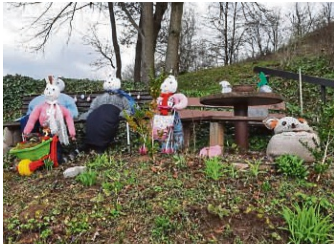
Wo man hinsieht, kann man süße Figuren entdecken: In Wichmannshausen wurde eine Osterausstellung aufgebaut.

Auch auf dem „Alten Graben“, in dem kleinen Stra-