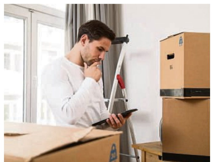
To-do-Liste mit Zeitplan für den Umzug gemacht? Das kann helfen, den Überblick zu behalten.