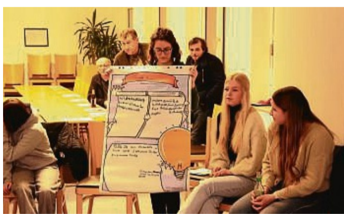
Generationsübergreifend haben sich die Einwohner der Gemeinde Weißenborn auf neue Idee, Regeln und Zuständigkeiten für die Jugendräume verständigt.

Die Gemeinde Weißenborn geht die Aufgabe, eine Freizeitperspektive für die 59 in Frage kommenden Jugendlichen der Kommune zu bieten, ernsthaft an. Bevor alle im DGH zusammenkamen, wurde eine Online-Umfrage erstellt (wir berichteten). 21 Jugendliche gaben ihre Rückmeldungen ab. Immerhin fast 20 junge Menschen im