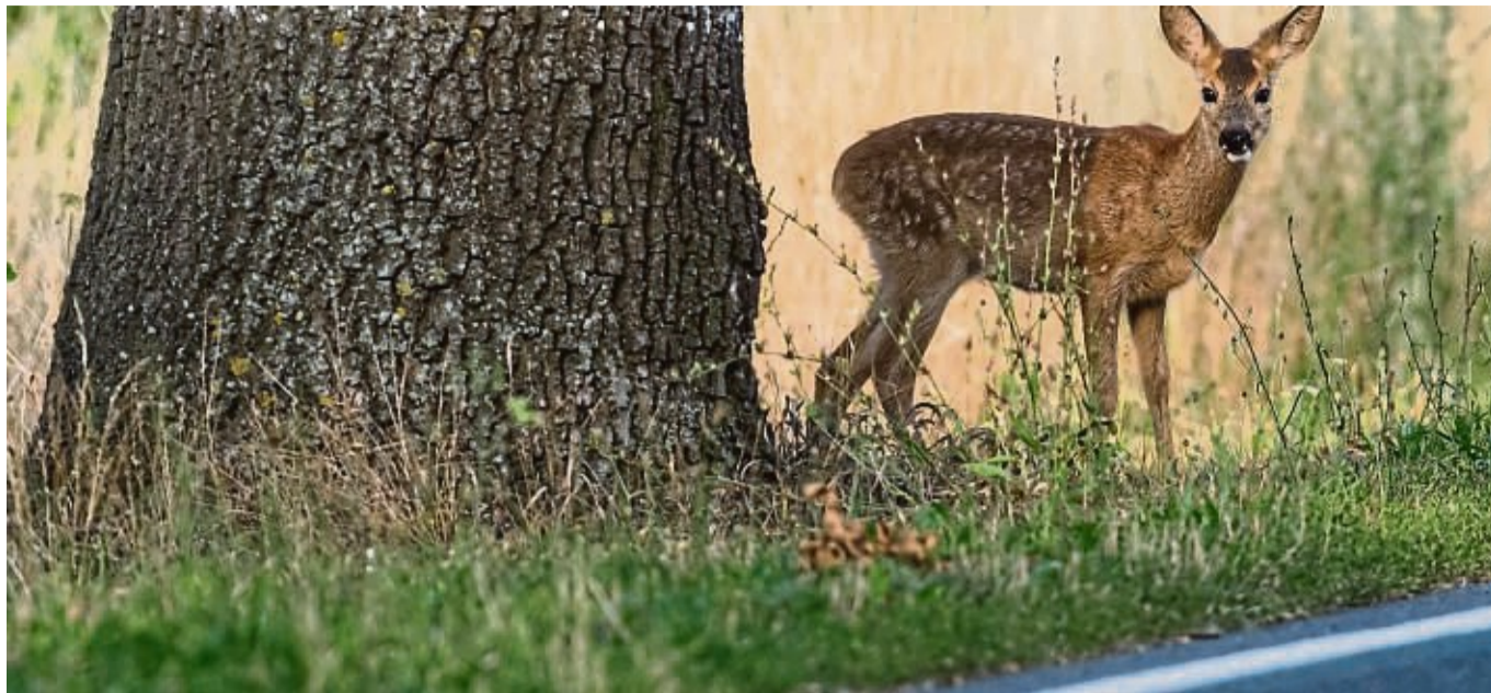
Besonders in den morgendlichen und abendlichen Dämmerungszeiten ist die Gefahr von Wildwechseln auf Straßen besonders hoch.

Die Zeitumstellung erhöht zwar die Gefahr, ist aber nur ein Grund. Denn nach der winterlichen Fastenzeit gehen die Tiere aktuell ganz verstärkt auf Futtersuche. „Dabei wechseln sie quasi aus ihrem Schlafzimmer ins Ess-