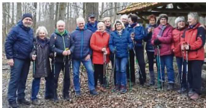
Zusammen macht alles mehr Spaß: Daher organisiert die Walkinggruppe wieder ein Treffen.

Wetterlehrpfad, den man nebenbei erkunden kann, da das Klima immer mehr in den aktuellen Focus gerät. Nach dem sportlichen Teil können sich die Teilnehmerinnen und Teilnehmer in der Uwe-Seeler-Halle an einer reichhaltigen Tafel stärken. Die Entscheidung, wieder einen Walkingtag anzubieten, trafen die Mitglieder der Walkinggruppe bei ihrer traditionellen Aschermittwochswanderung die sie, wie in den Jahren zuvor, nach Grandenborn in die Gaststätte „Teichhof“ führte.