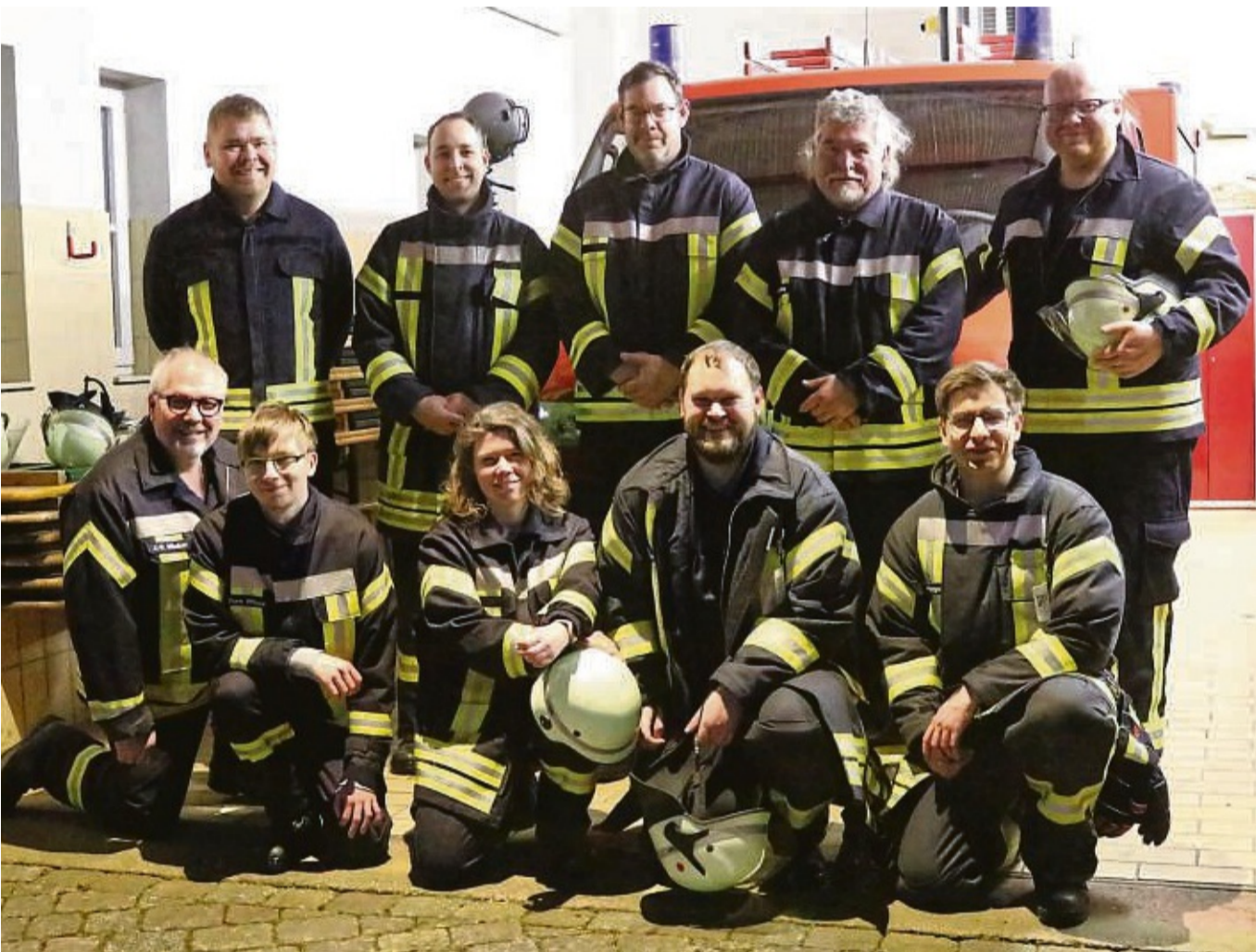
Ein gutes Team: Mitglieder der Einsatzabteilung in Blankenbach.