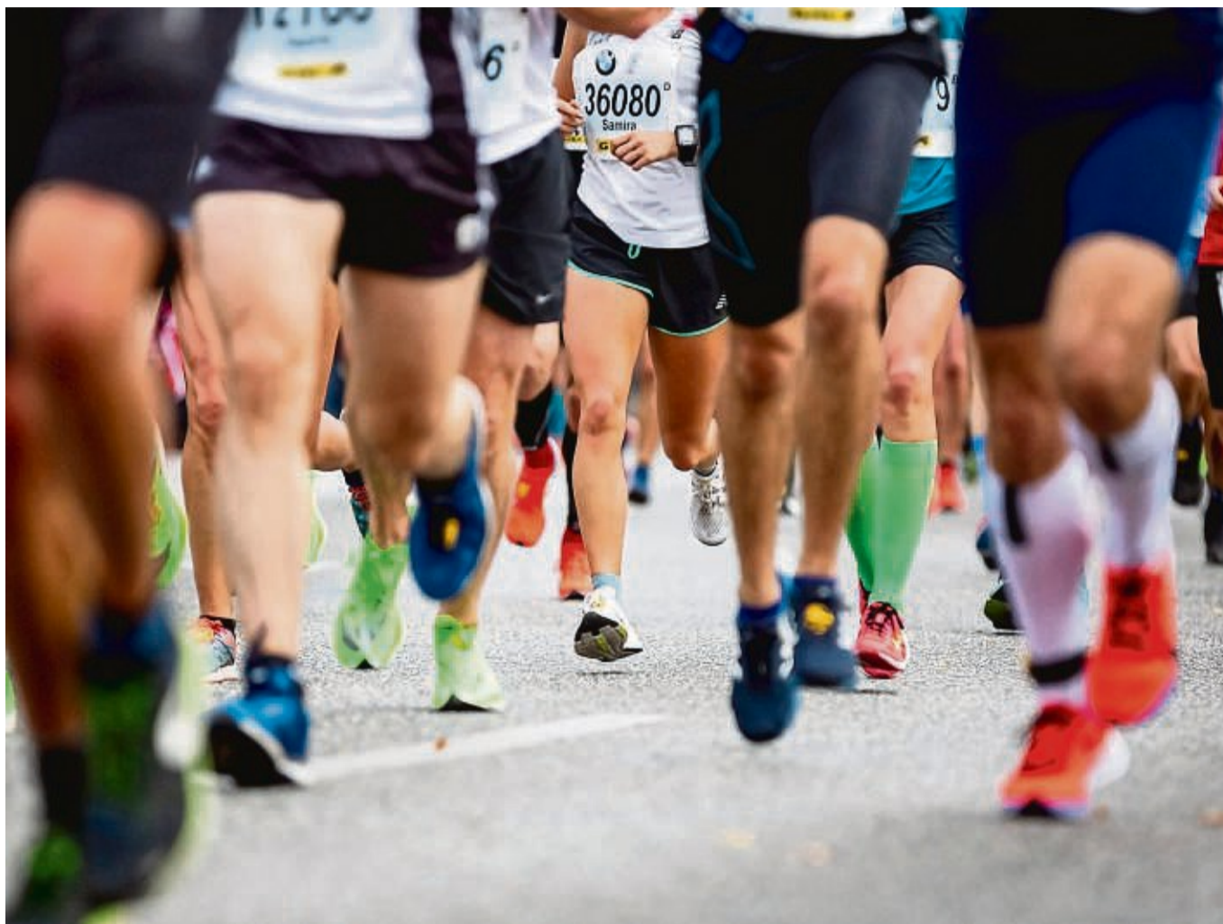
Los geht's! Einem Lafevent geht mitunter monatelanges Training voraus.

Ohne gutes Schuhwerk besteht die Gefahr, dass die Füße irgendwann schmerzen – und damit die Laufmotivation sinkt. Ideal ist es, wenn Laufschuhe ein, zwei Num-