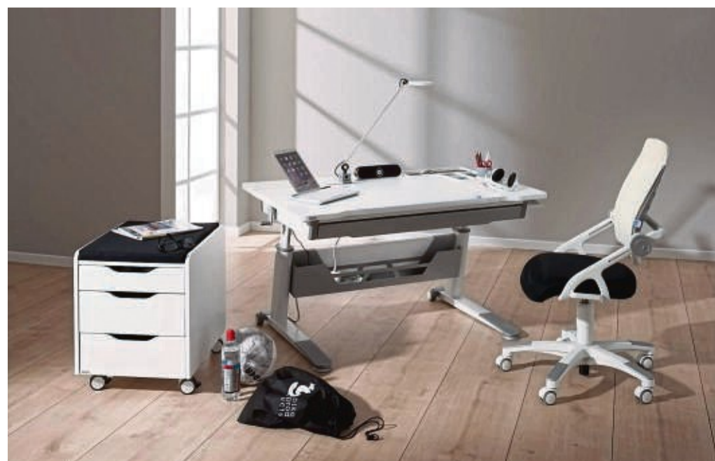
Beweglicher Stauraum auf Rollen kann sinnvoll sein, wenn man den Arbeitsplatz fürs Schulkind mobil halten will.

Wichtig in jedem Fall, bevor man sich für eine Lösung entscheidet: einmal durchgehen, was im Alltag für einen persönlich tatsächlich am besten funktionieren könnte, rät Katja Kessler. Und was vom Kind auch gern genutzt wird. tmn