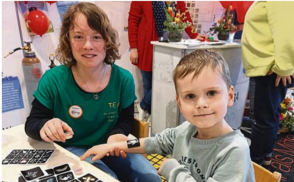
Bei den städtischen Kindertagesstätten konnten sich die Kinder Glitzertattoos machen lassen und Button selbst gestalten.

Sontra – 40 Aussteller, eine unterschriebene Kooperationsvereinbarung zwischen Schule und dem Gewerbeverein, zahlreiche Besucherinnen und Besucher, zufriedene Aussteller - was will man mehr. Bei der ASH Messe in der Adam-von-Trott Schule (AvT) konnten am vergangenen Wochenende die Besucherinnen und Besucher bei einer großen Anzahl von Ausstellern viel erfahren, Produkte ausprobieren, sich beraten lassen, selbst aktiv werden oder einfach nur ein Schwätzchen halten. Aber auch für die Kinder standen viele Mitmachangebote der Kindertagesstätten und der Schule sowie an den Ständen der Gewerbetreibenden zur Verfügung. Für ein umfangreiches Kaffee- und Kuchenbuffet sorgten die Abiturienten der AvT und für das herzliche Essen hatte die ASH den Feuertruck am Start. Eine positive Bilanz zog das ASH-Vor-