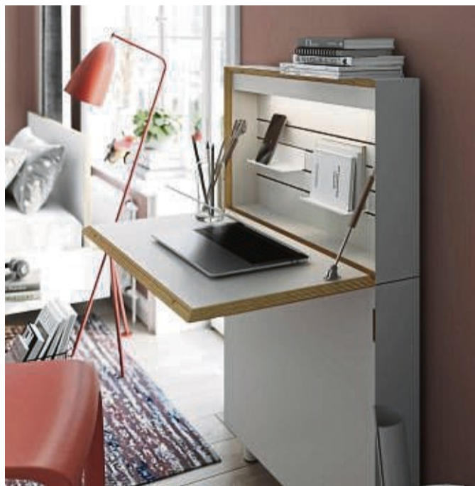
Können auch für Kinder funktionieren: ausklappbare Schreibtischlösungen.

Gut, wenn hier ohne großes Umräumen ein höhenverstellbarer Schreibtisch und ein ergonomischer Schreibtischstuhl für den Nachwuchs Platz finden. Ist das Schlafzimmer eher knapp bemessen, kann man aber auch Stauraum und Arbeitsplatz kombinieren. Etwa indem man eine Arbeitsplatte an der Wand montiert und jeweils unter beiden Enden der Platte Kommoden unterbringt, schlägt Einrichtungsbekannterin Sabine Stiller vor. Oder indem man Sideboards anschafft, die einen Schwenk-Oberboden haben. Dreht man den heraus, wird in Kombination mit einem Schreibtischstuhl eine Ar-