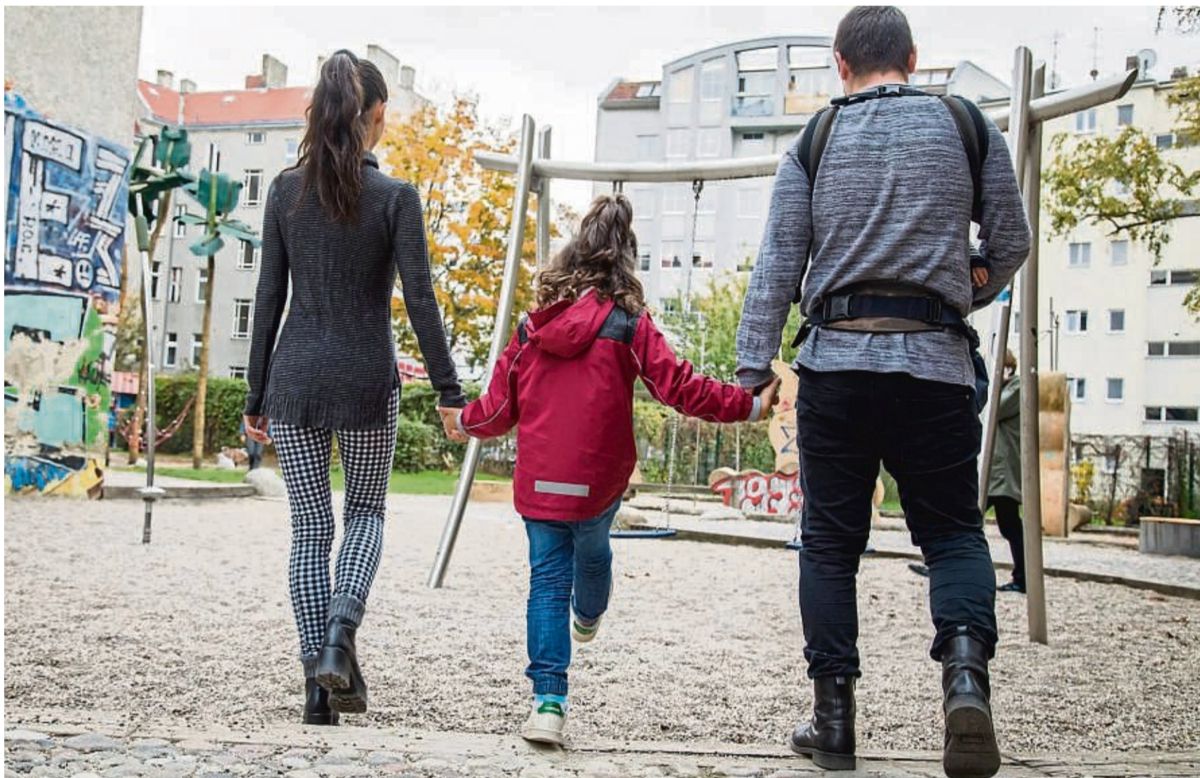
Das Wohl des Kindes steht für viele Eltern an erster Stelle. Doch nicht immer können sie sie vor Gefahren behüten. Eine Kinderinvaliditätsversicherung kann unter Umständen zumindest finanziell helfen.

Wie wahrscheinlich es ist, dass so eine Situation eintritt, lasse sich kaum sagen. „Kinder haben zwar durch Spielen und Toben ein signifikant höheres Unfallrisiko“, sagt Michael Nischalke von der Stiftung Warentest. Statistisch gesehen würden sie aber seltener krank. Und ge-