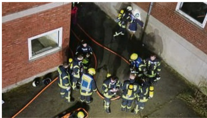
Der im Schnitt fünf bis zehn Minuten lange Einsatz der Notfallstaffel verlangt den Atemschutzgeräteträgern viel ab.