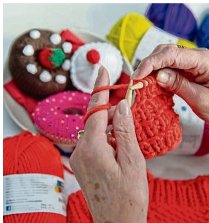
Hobbys fördern die körperliche, geistige und soziale Beweglichkeit.

Und: Viele Hobbys bedeuten körperliche Aktivität – auch das zählt auf die Gesundheit ein. Schon regelmä-