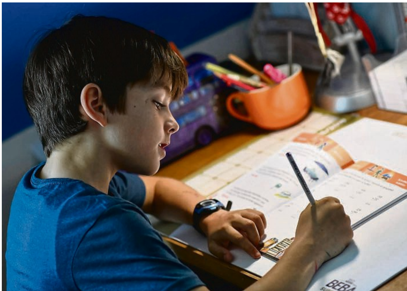
Ohne ein ruhiges Plätzchen in der Wohnung geht's nur schwer: Hausaufgaben machen und lernen.

Auch die Hamburger Inneneinrichterin Sabine Stiller (Autorin von „Aus 4 Zimmern mach 6 Räume. Wohnkonzepte für Familien“), be-