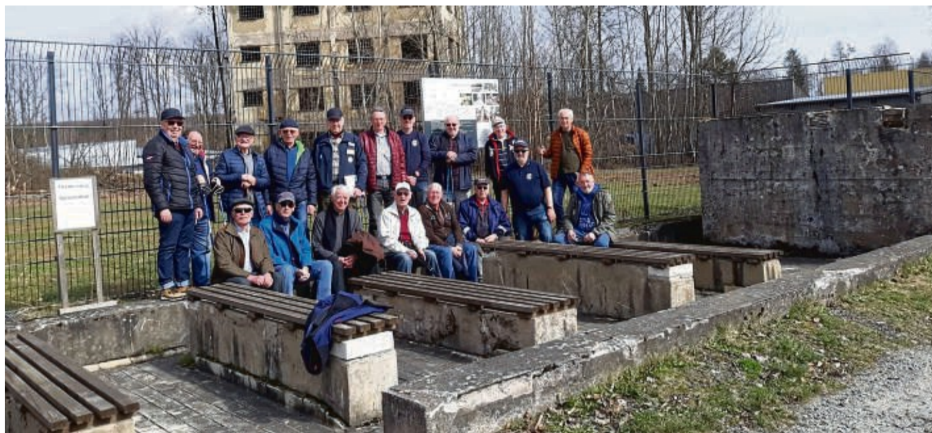
Entlang des Themenwegs waren die 18 Teilnehmer bei ihrem Ausflug nach Hirschhagen unterwegs. Weitere Besichtigungen sollen folgen.

Schon seit den frühen 1990er Jahren besteht die Seniorenabteilung der Feuerwehr Germerode. Zu ihren