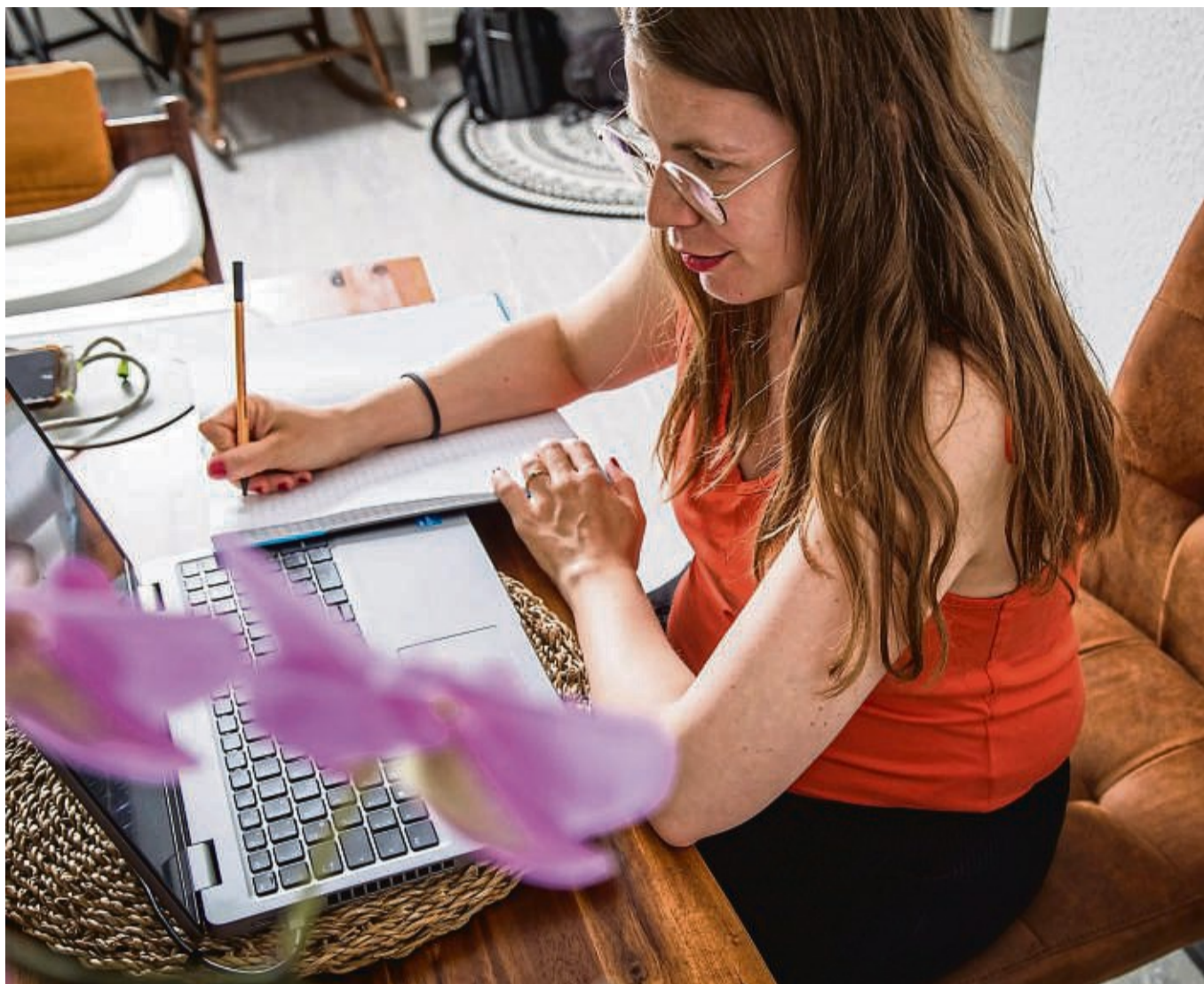
Zeitmanagement ist Typsache: Es lohnt sich verschiedene Methoden zu testen, um sehen, was für einen persönlich am besten funktioniert.

Ein guter erster Schritt zu mehr Struktur im Arbeitstag: Dinge aufschreiben, die zu erledigen sind, um mehr Ruhe ins Denken zu bringen. „Wenn man etwas schriftlich festgehalten hat, ist es erst einmal raus aus dem Kopf und man muss sich nicht mehr angestrengt bemühen, es nicht zu vergessen“, sagt