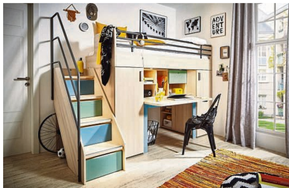
Bringen oft zusätzlichen Stauraum und Arbeitsflächen ins Kinderzimmer: Hochbetten, unter denen sich ein Arbeitsplatz integrieren lässt.