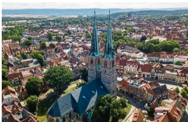
Quedlinburgs Altstadt gehört seit 1994 zum Unesco Weltkulturerbe.

Schon rund um den offiziellen Unesco-Welterbetag am ersten Sonntag im Juni verbreiten die „Königstage“ vom 30. Mai bis 2. Juni 2024 mit historischem Markt nicht nur Mittelalterflair, sondern