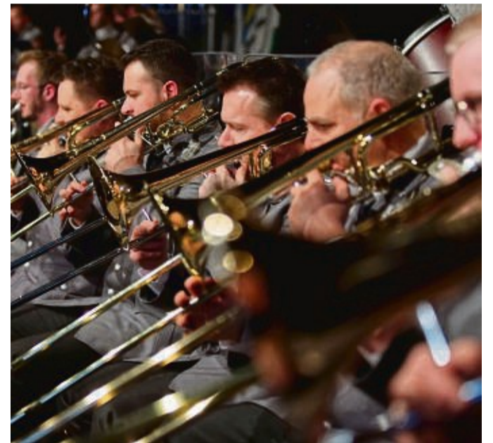
Das Heeresmusikkorps Kassel gastiert am 16. April in Willingen.

Um ins Kulturgut eingegangene Werbeslogans und Schlager, Petticoats und Bossa Nova hat Autor Thomas Schiffmann eine flotte Geschichte mit Verwicklungen und schrägen Künstlerseelen gestrickt. flb-korbach.de