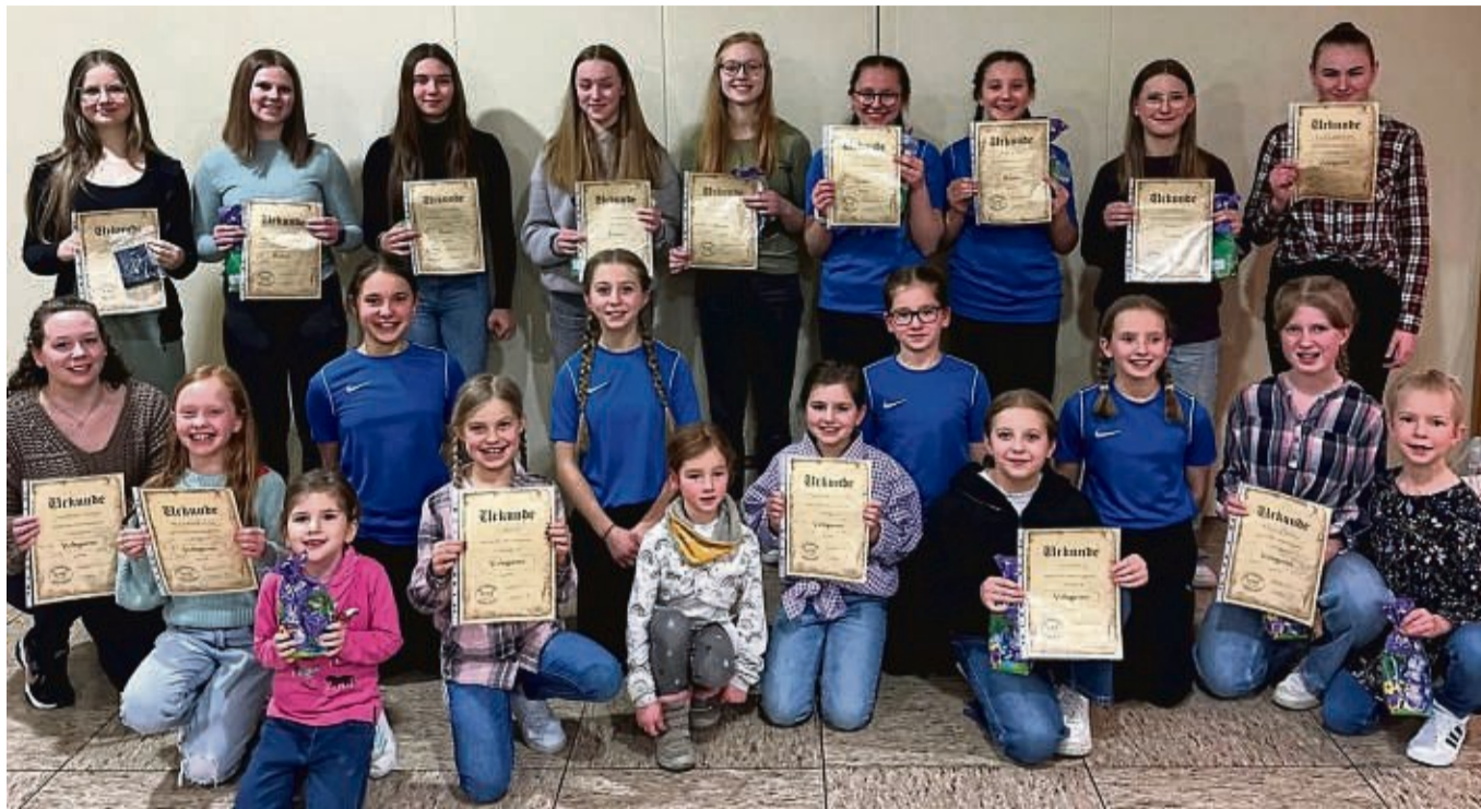
Ehrungen beim Reit- und Voltigierverein Bromskirchen: Auf dem Foto sind alle Geehrten zu sehen.

Aber die Vereinsmitglieder mussten auch schwere Stunden erleben. Im Juni suchte ein Unwetter Bromskirchen heim und zerstörte nahezu die gesamte Reitanlage. Erst nach vielen Wochen konnte alles wieder hergestellt werden. In der Zwischenzeit durfte der Verein in Sachsenberg, Medebach und Füllnhäusern trainieren. Im September feierte der Verein die