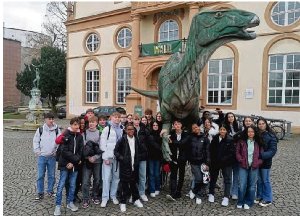
◀ Erinnerungsfoto am Dinosauriermodell: Schüler aus La Réunion waren zu Gast an der Cornelia-Funke-Schule in Gemünden. Hier mit ihren Gastgebern in Kassel vor dem Naturkundemuseum.