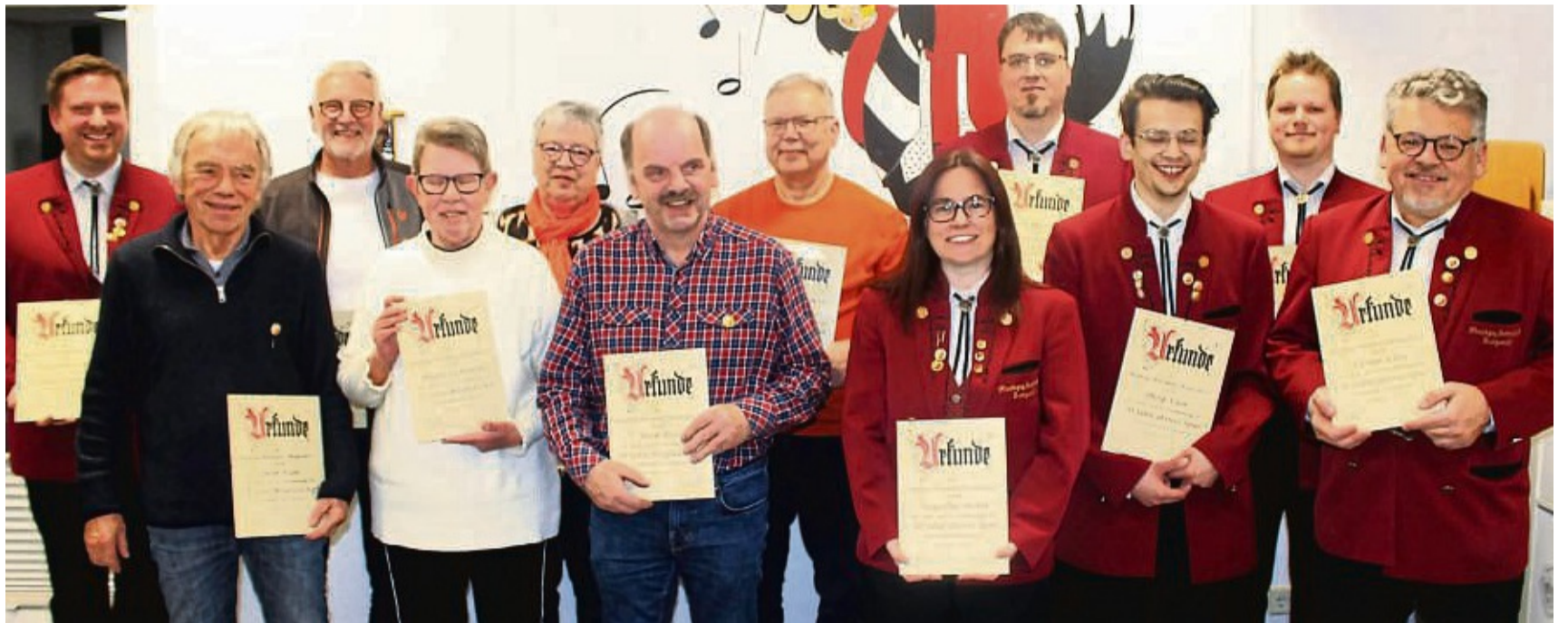
Ehrungen: Der Musikzug Bottendorf zeichnete in der Jahreshauptversammlung langjährige aktive und passive Mitglieder aus.

Auch das 2. Festival der Blasmusik sei ein voller Erfolg gewesen. „Das Festival und der Ort Bottendorf sind nun international in der Blasmusikszene bekannt und genießen den Respekt bei Gästen und Profikapellen“, sagte