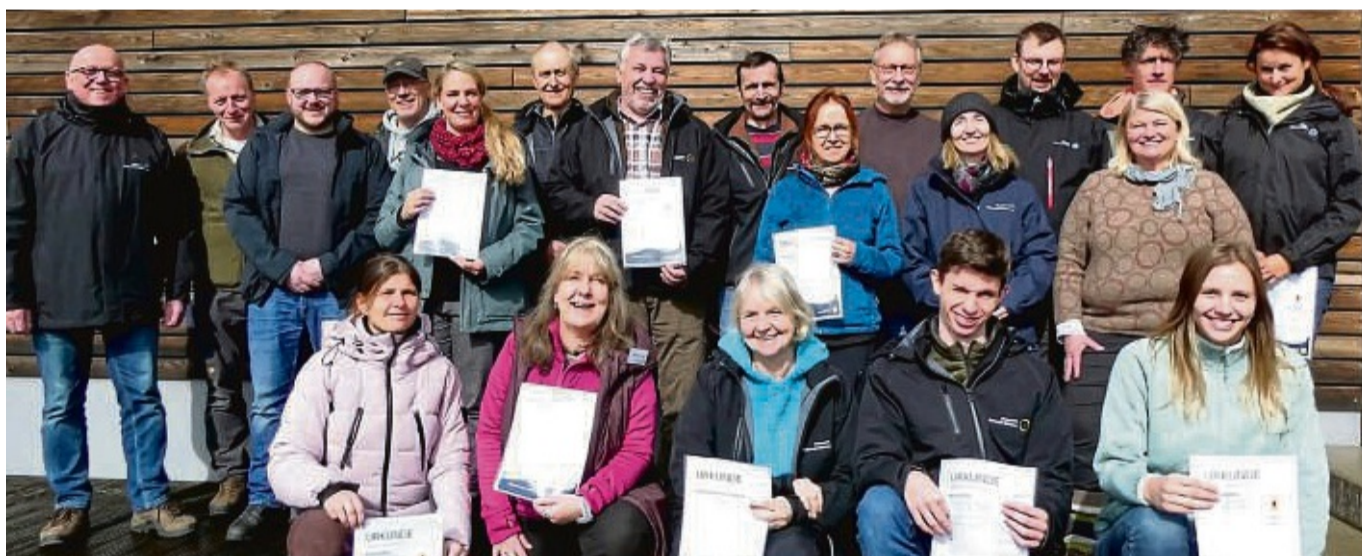
Urkundenübergabe: 17 neue Nationalpark-Führerinnen und -Führer unterstützen künftig das Schutzgebiet und erweitern das Bildungsangebot des Schutzgebietes.

Um Anmeldung bei Iris Kalhöfer, E-Mail u.i.kalhoefer@online.de oder Tel. 05633-1596, wird bis zum 13.04.24 gebeten. red