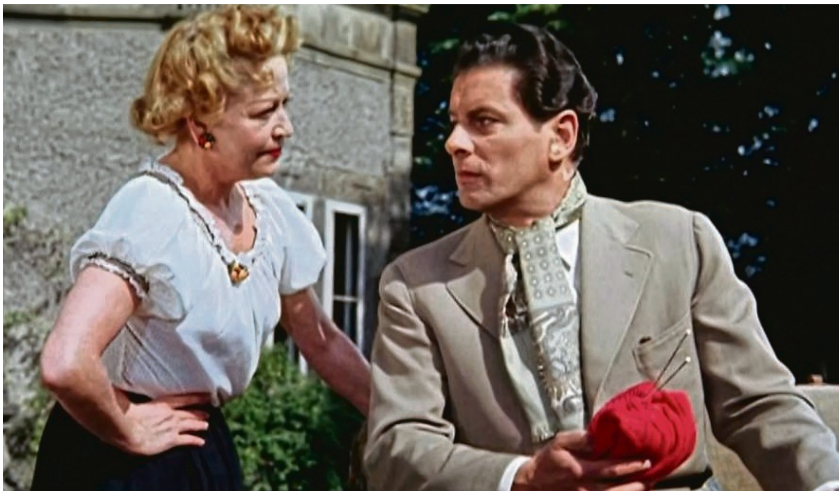
Eine Filmkomödie aus dem Jahr 1952: In „Ferien vom Ich“ war das Schloss im Kreis Lippe der Hauptdrehort.