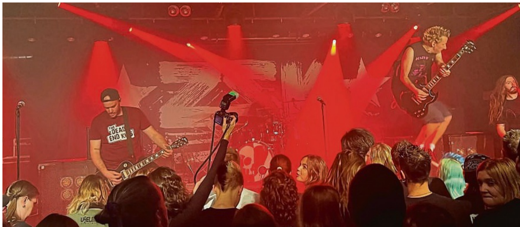
Punk aus Berlin: Die Band ZSK stammt ursprünglich aus Göttingen. Sie treten zum ersten Mal auf dem Rock for Tolerance auf. Unser Bild stammt von einem Konzert der Band aus Göttingen im Dezember 2023.

lacht. Heavysaurus trat im vergangenen Jahr beim Forest-Rock-Festival in Northheim auf. In diesem Jahr werden sie neben Hann. Münden noch in Rostock, Essen, Coburg, Frankfurt und zahlreichen anderen Städten auf der Bühne stehen. In diesem Jahr wird das Rock-for-Tolerance-Festival, welches bisher kostenfrei war, zum ersten Mal Eintritt kosten. Dabei gibt es