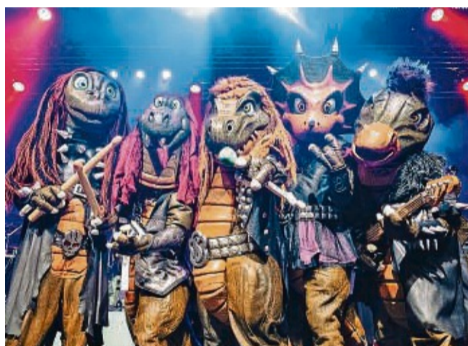
Auch Heavysaurus ist in Münden dabei.

Tickets in drei Kategorien. „Für jeden Geldbeutel“, so Maaßen. Tickets gibt es für 15 Euro, 25 Euro und 35 Euro. „Der Ticketverkauf läuft gerade an“, so der Vorsitzende. „Es wäre schön, wenn noch viele Menschen ganz viele tolle Tickets kaufen.“ Auch für alle Fans von politischem Punkrock wird einiges geboten. Als Headliner für den Samstag konnte die Punkband ZSK, die ihre Wurzeln in der Unistadt Göttingen hat, gewonnen werden. „Es ist die bisher größte Band, die wir für das Festival gewonnen haben“, freut sich Maaßen.