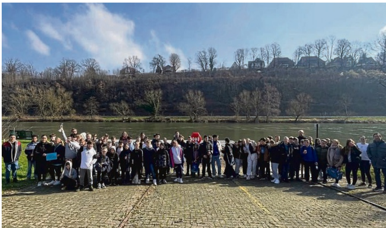
Strahlende Gesichter am MRV-Steg: Mehr als 70 Schülerinnen und Schüler der fünften, sechsten und siebten Jahrgangsstufe nahmen auch in diesem Jahr am Schulsportwettbewerb „Mündens schnellste Klasse teil“.

Der Ergometer-Wettbewerb wird vom Mündener Ruderverein in Kooperation mit der Deutschen Ruderjugend (DRJ) ausgerichtet. In Achter-Staffeln müssen die Schülerinnen und Schüler dabei gemeinsam die olympische Distanz von 2000 Metern und damit 250 Meter pro Person absolvieren. Den Anfang machten die fünften Klassen. Hier kam es zu einem spannenden Duell zwischen der 5a und 5b der Drei-