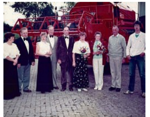
Für die Fahrzeugübergaben warfen sich in den 1980ern Kunden und Händler richtig in Schale.