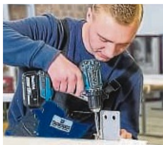
Beim Metallbau kommt es auf präzise Arbeit an.

Das Metallbauunternehmen Pistorius Türen- und Fensterbau GmbH aus Vasbeck fertigt Aluminiumelemente: Fenster, Türen, Fassaden, Wintergärten, Insektenschutz, Brand- und Rauchschutztüren. Durch die Fertigung im eigenen Haus kann Pistorius bei der Produktion gezielt auf Kundenwünsche eingehen. Da das Metallbauunternehmen in ganz Deutschland tätig ist, steht der Kundendienstservice auch nach Beendigung der Arbeiten zur Verfügung. Zum nächsten Ausbildungsstart bietet Pistorius freie Plätze für den Beruf Metallbauer/in in Fachrichtung Konstruktionstechnik (m/w/d). Die Tätigkeit ist abwechslungsreich, mit vielen spannenden, aufregenden und neuen Aufgaben. Die Azubis produzieren in der firmeneigenen Werkstatt und fahren mit auf die Baustelle, um die Elemente zu montieren. Nach der Ausbildung haben die bestens