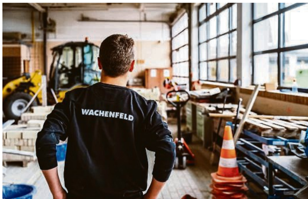
Mit dem fachlichen Abschluss in der Tasche stehen frisch gebackenen Baufachleuten alle Türen offen.

Wachenfeld, das bundesweit für seine Leistungen im Tief- und Straßenbau bekannt ist, setzt auf modernste Mess- und Steuerungstechnologien. Denn sogar im Straßenbau geht es um millimetergenaues Arbeiten. Da ist der Kopf gefordert, dennoch gibt es auch für die Arme genug zu tun – das Geld für ein Fitnessstudio können sich die Auszubildenden der Baubranche locker sparen. Als Spezialist für