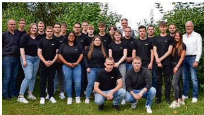
Die Auszubildenden bei HEWI haben gute Berufsperspektiven.

Die HEWI Heinrich Wilke GmbH ist ein Familienunternehmen mit Tradition. Gegründet von Heinrich Wilke 1929, ist sie noch heute regional verwurzelt und im nordhessischen Bad Arolsen angesiedelt. HEWI bietet übergreifende Lösungen für die Bereiche Baubeschlag und Sanitär. Clevere Funktionen und ausgezeichnetes Design zeichnen sowohl die Produkte für das Bad als auch die Beschläge aus. Zudem ist das Unternehmen stolz, dass in fast jedem Auto ein Bauteil von HEWI steckt – HEWI Kunststofftechnik ist Zulieferer für die Automobilindustrie und zum Beispiel in Porsche, Ja-