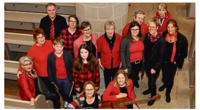
„Just for Joy“ feiert sein 20-jähriges Bestehen.