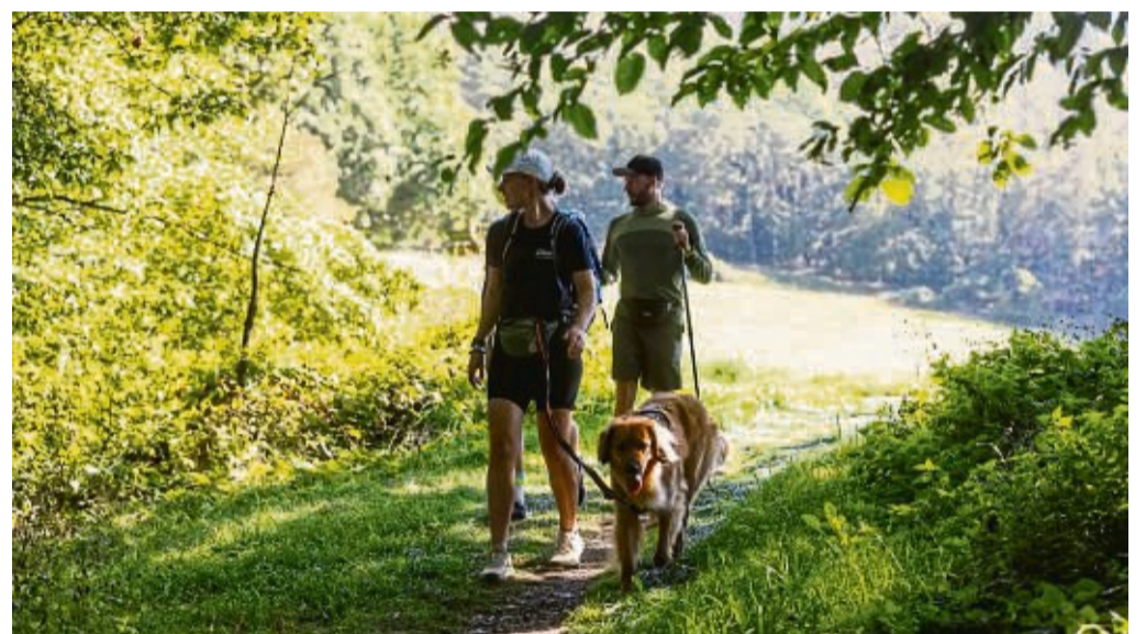
24-Stunden Wanderabenteurer: In den vergangenen Jahren nahmen viele Wanderer das Angebot an.

Das Team des Wandermagazins, der ersten deutschen Wanderzeitschrift, kündigt zudem Überraschungen an den Strecken an. Die Zeitschrift, die 2024 nun schon seit 40 Jahren veröffentlicht