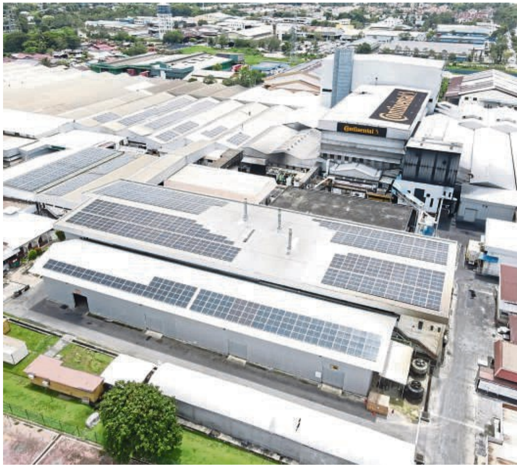
Weltweit setzt Continental verstärkt auf Photovoltaik , wie hier im Reifenwerk in Alor Star (Malaysia). Auch in Korbach wurden neue Anlagen errichtet.