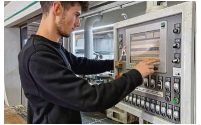
Für Holzbearbeitungsmechaniker/innen ist das Arbeiten mit Maschinen ein wichtiger Teil der Tätigkeit, zumal Automatisierung und computergesteuerten Anlagenführung zunehmen.

Geregelte Arbeitszeiten, ein Firmenfitnessprogramm, betriebliche Altersvorsorge und vieles mehr runden das Ausbildungsangebot der BrassGruppe ab: „Wir freuen uns auf einen Besuch, deine WhatsApp oder deinen Anruf. Nimm Deine (Logistik-) Zukunft in die Hand und komm nach BRASSilien!“, ruft das Unternehmen auf.