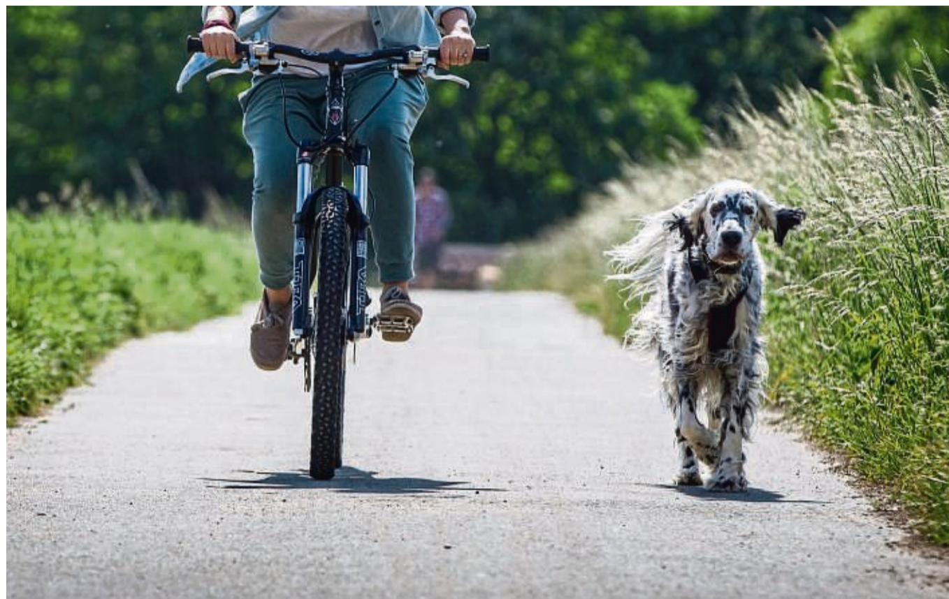
Die Kommandos sitzen? Dann darf der Hund gern ohne Leine neben dem Rad herlaufen.