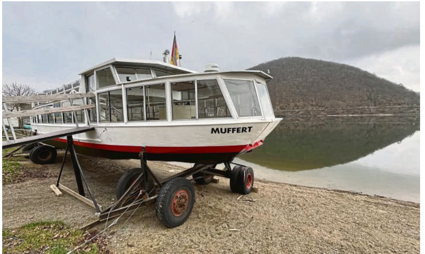
Aus für MS Muffert: Betreiber stellt Betrieb endgültig ein.