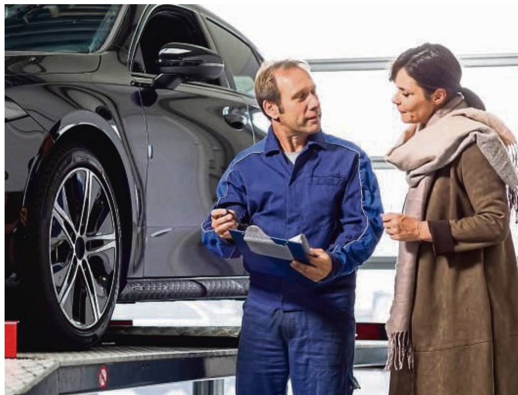
Experten helfen gern. Im Winter setzen Kälte, Matsch, Split und Lauge dem Auto zu. Vor dem Sommer sollte es daher am besten noch einmal in der Werkstatt durchgecheckt werden.

Bremsen, Auspuff, Stoßdämpfer, Elektronik und vieles mehr. Mit Hebebühne und auch sonstigem Know-