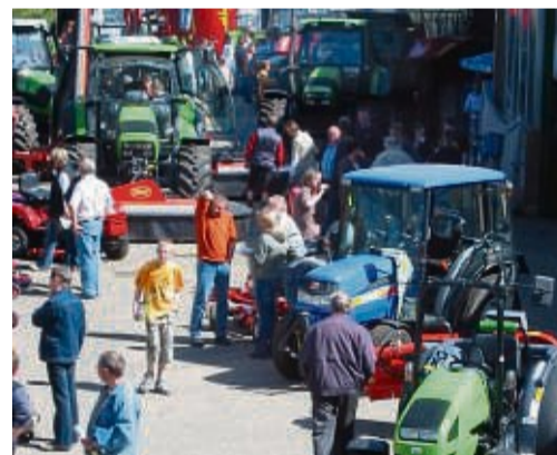
Die Ausstellungen bei Kalhöfer Landtechnik sind regelmäßig Publikumsmagneten.