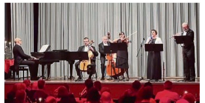
Das Salonorchester Cappuccino tritt im salonartig eingerichtete Bürgerhaus auf.

Eintrittskarten sind im Touristik-Service im Bürgerhaus (Tel. 05691-801240), bei allen Reservix-Vorverkaufsstellen sowie online über www.reservix.de erhältlich.