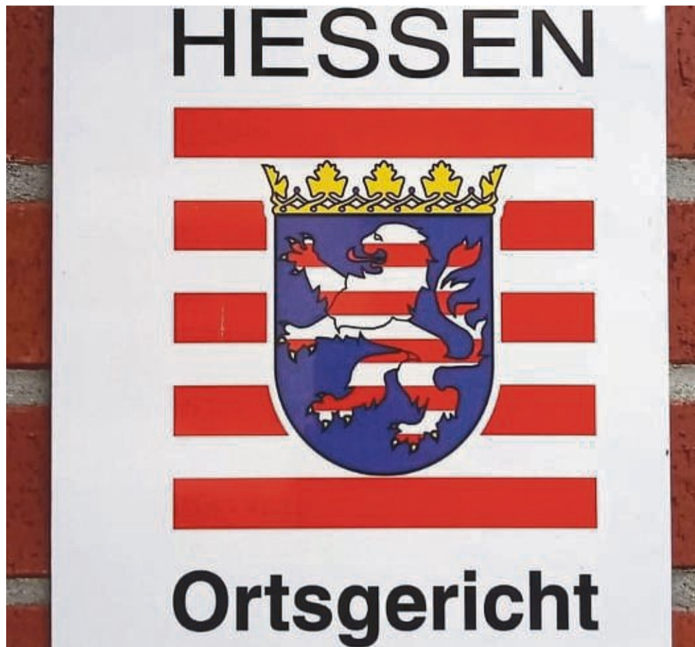
Die Mitglieder der Ortsgerichte bieten einen bürgernahen Service, der immer aufwendiger wird.

Sobald das Thema gegenüber dem Amtsgericht angesprochen worden sei, habe es geheißen, „dass es sich schließlich um ein Ehrenamt handele“. Darüber, dass das Amtsgericht auf den aktuellen Fall mit Fristsetzung und Dienstaufsichtsbeschwerde