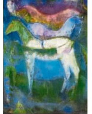
Zauber der Verwandlung: Titelbild des Flyers zur Ausstellung im Marstall bei Schloss Friedrichstein.