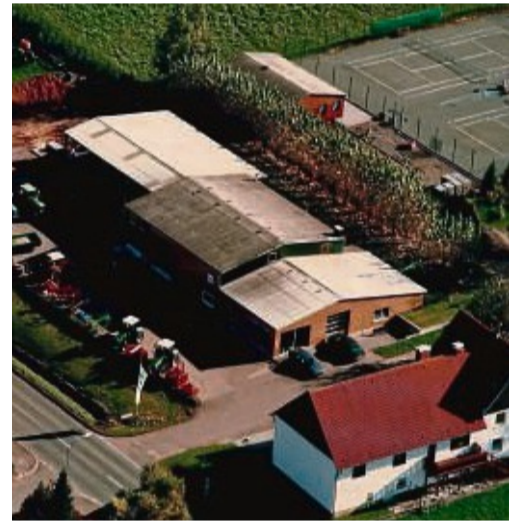
Vor rund 40 Jahren erfolgte Umzug an den heutigen Standort, der seither mehrfach modernisiert und vergrößert wurde, wie die Luftaufnahmen belegen.