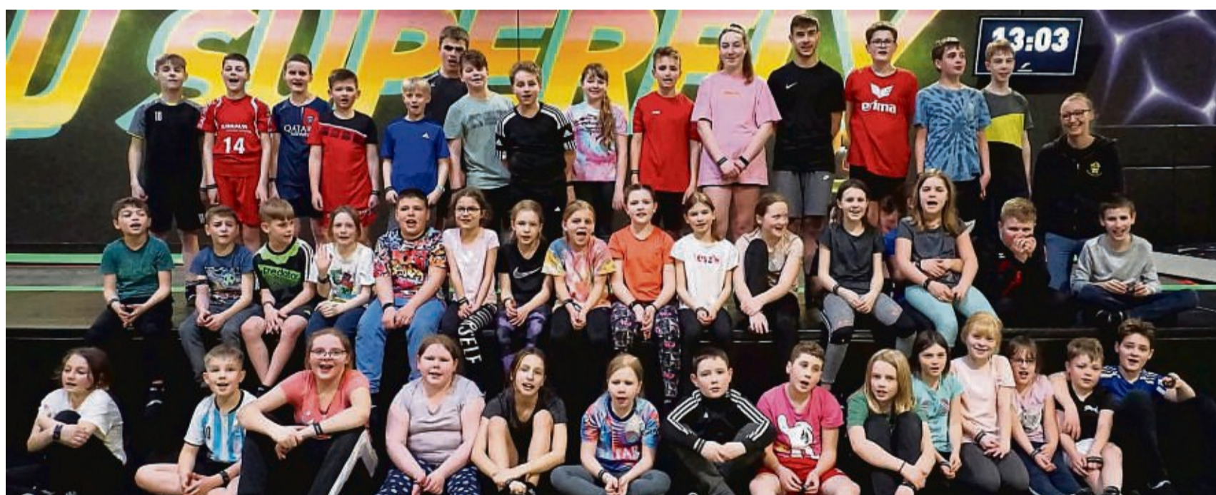
Ausgetobt: Kinder und Jugendliche waren mit dem Melsunger Jugendtreff – Die Haspel in der Trampolinhalle in Vellmar.

Spielgeräte des Spielmobils der Haspel erweiterten das Programm und ein großes Bastelangebot rundete den