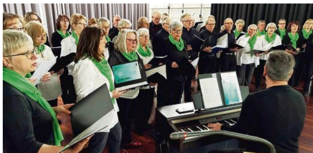
Mit grünem Tuch: Der Chor aus Wabern war Gastgeber beim Kreissängertag in der Waberner Mehrzweckhalle.