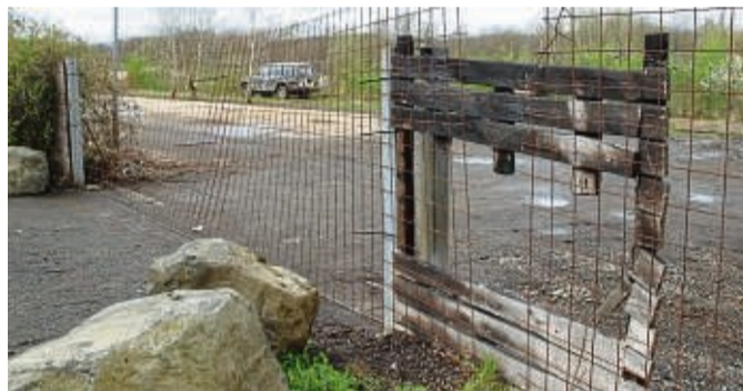
Verbranntes Tor: Noch sind Reste vom Feuer am 17. Mai 2023 erkennbar.

werde eine Einfriedung schaffen und das Gelände „für eine etwaige Begrünung, die nicht unwahrscheinlich ist, vorbereiten“. Eine abschließende Aussage sei aber noch nicht möglich, da dies mit der Unteren Naturschutz-