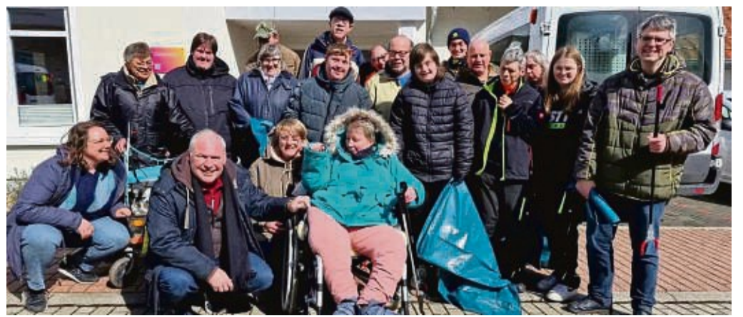
Die Teilnehmer des Klimatages der Viva-Stiftung.

Ziegler danke den Betreuern im Namen der Kunden, dass sie den Klimatag ermöglicht haben.