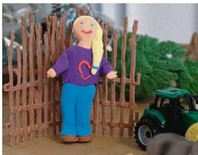
Selbstgebastelte Figuren waren Teil der Trickfilme.