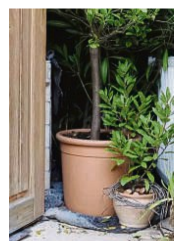
Kübelpflanzen können langsam aus ihrem Winterquartier ins Helle herausgebracht werden, endgültig ins Freie sollten jedoch erst nach den Eisheiligen Mitte Mai.

Haben Geranien, Fuchsien, Strauchmargeriten oder andere Kübelpflanzen über den Winter fast alle Blätter abgeworfen und aus Lichtmangel lange, dünne Triebe gebildet, sollten Sie diese nun stark einkürzen und teilweise entfernen. Außerdem wichtig: die Pflanzen sorgfältig auf Schädlingsbefall kon-