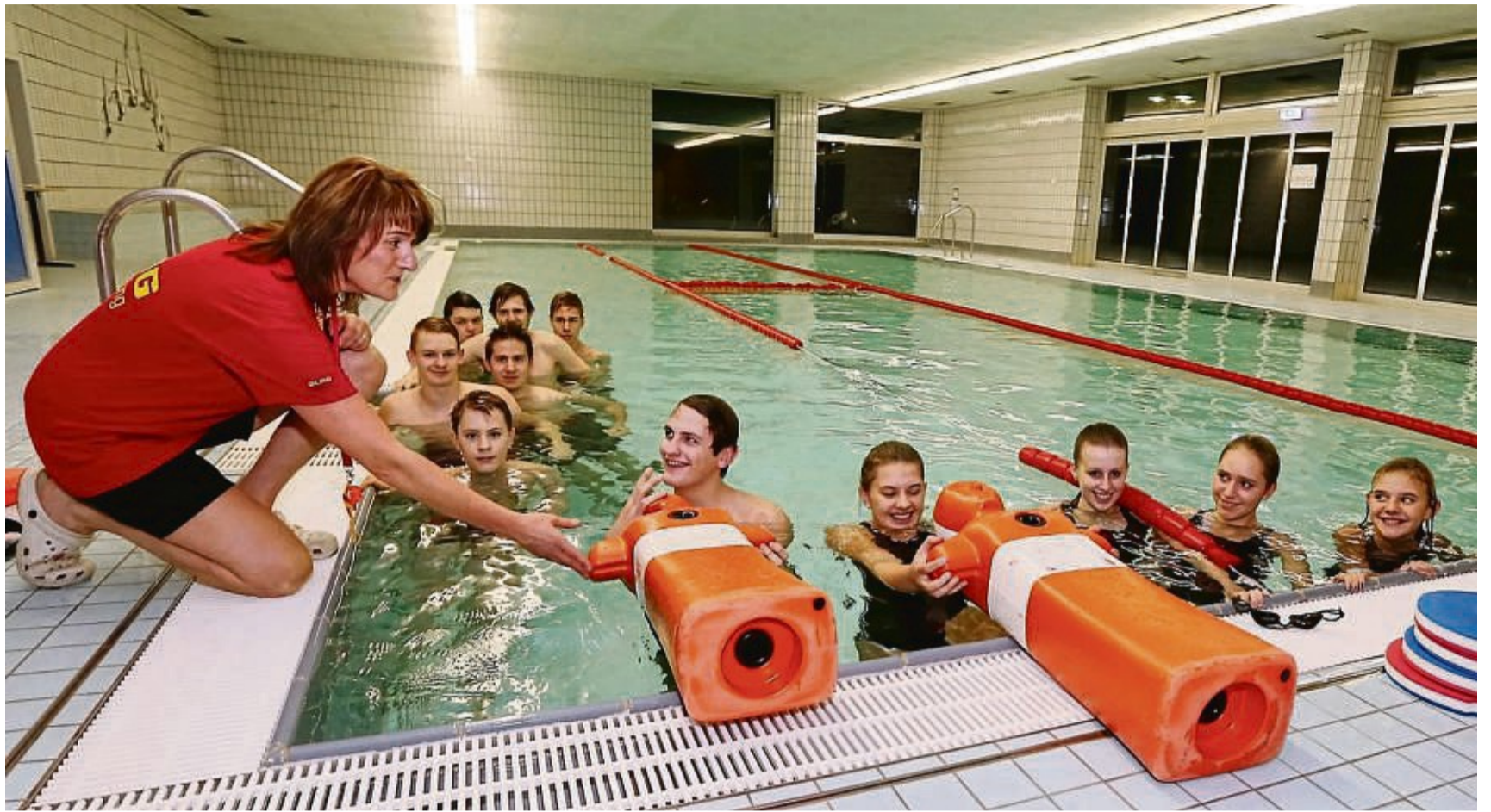
Im Hallenbad in Adelebsen bildet die DLRG Ortsgruppe Adelebsen-Dransfeld ihre Rettungsschwimmer aus. Ab dem kommenden Jahr soll das Bad grundlegend saniert werden.

Der Baustart solle nach aktueller Planung im Sommer 2025 erfolgen. „Die Kröte, die es dann für uns zu schlucken gilt, ist eine 18- bis 24-monatige Schließungszeit, die wir überleben müssen“, so Paetsch. Denn obwohl die Mitgliederzahlen gegenwärtig weiter steigend seien, man