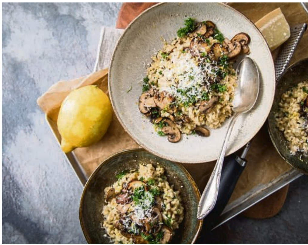
Graupen-Risotto mit Champignons, Parmesan und Petersilie: Dieses Gericht hat keinerlei Ähnlichkeit zur Gerstengrütze, wie man sie vielleicht noch aus der Kindheit kennt.

Graupen bestehen in der Regel aus Gerste, die zuvor enthüllt, entspelzt, geschält und poliert wurde. „Weil dabei die Frucht- und Samenschalen des Kornes entfernt werden, gehen leider viele wichtige und wertvolle Nährstoffe verloren“, sagt Diplom-Ökotrophologin Silke Restemeyer von der Deutschen Gesellschaft für Ernährung (DGE).