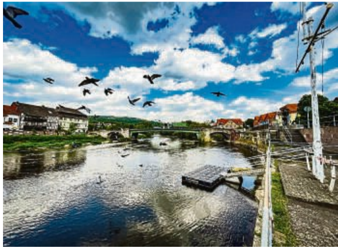
Die Werra, wie hier in Witzenhausen, bietet landschaftlich reizvolle Radtouren.