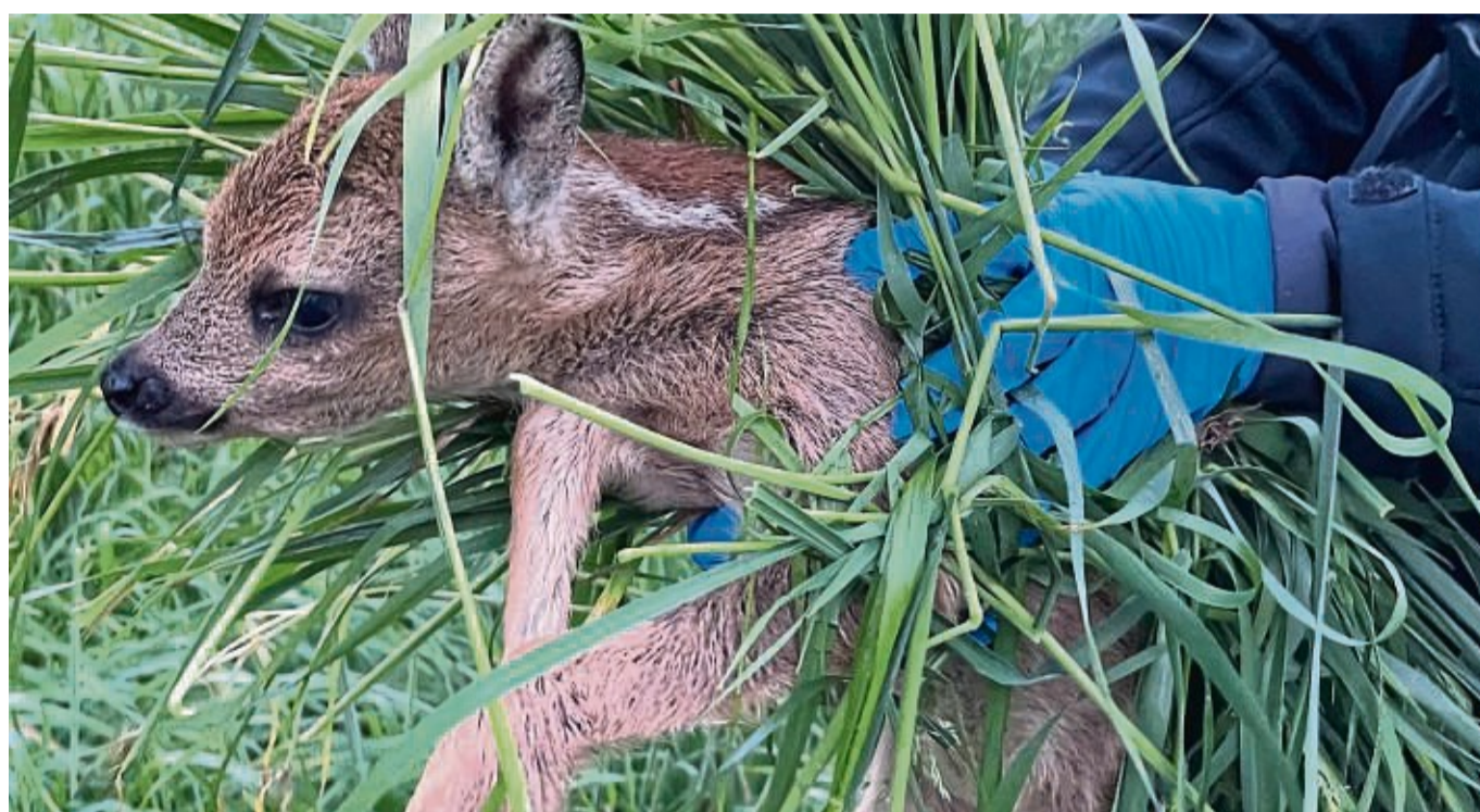
Mit Drohnen können Kitze vor dem Mähtod gerettet werden.

Neue Drohnen-Verordnung der EU zunächst außer Kraft gesetzt