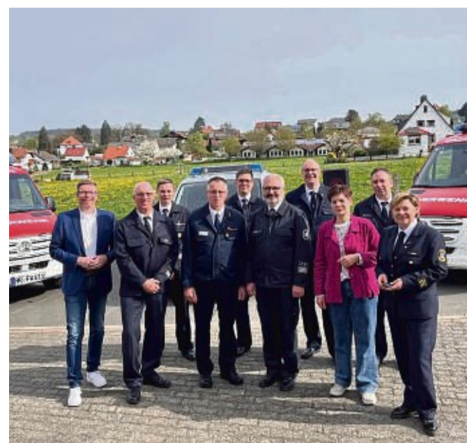
Neue Fahrzeuge: Die Homberger und Knüllwälder Feuerwehr erhielten jeweils einen Einsatzleitwagen.