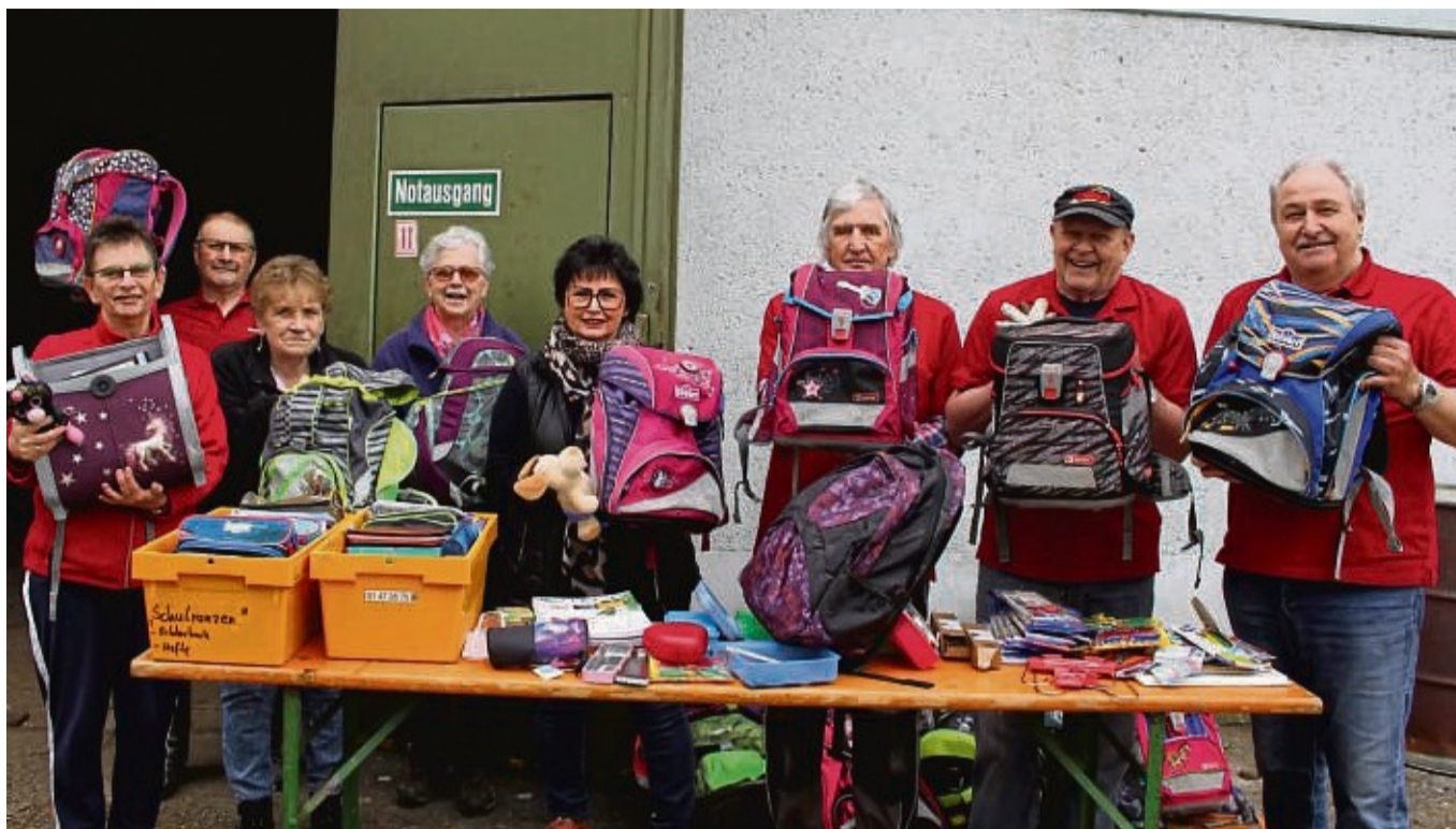
Fleißig: Die Mitglieder des Neuentaler Patenschaftsvereins Siebenbürgen packen die gespendeten Schulranzen für die Kindergartenkinder in Hermannstadt.

Damit besuchen die Mitglieder des Patenschaftsvereins Siebenbürgen Altenheime, Kranken- und Gemeindehäuser sowie Schulen und Kindergärten. Gerade letztere werden bei dieser Reise mit einer Ladung Schulranzen beglückt, um Kinder für den Schulstart vorzubereiten.