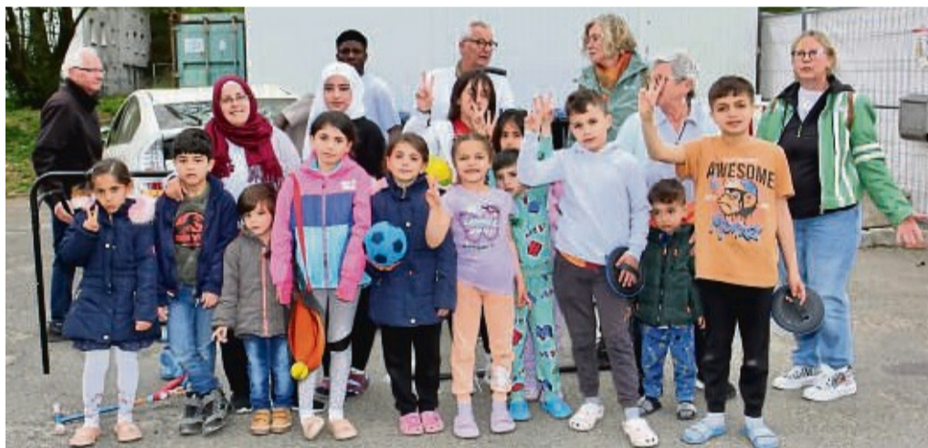
Freuten sich über die neuen Spielgeräte: die Bewohner der Unterkunft in Adelshausen und die Helfer vom Team der Spendenkammer.

Direkt ausprobiert werden konnte das Tor nicht, denn das Wetter machte Erwachsene und Kinder einen Strich durch die Rechnung. Aber bestimmt wird in den nächsten Tagen viel Fußball auf der Wiese gespielt. zot