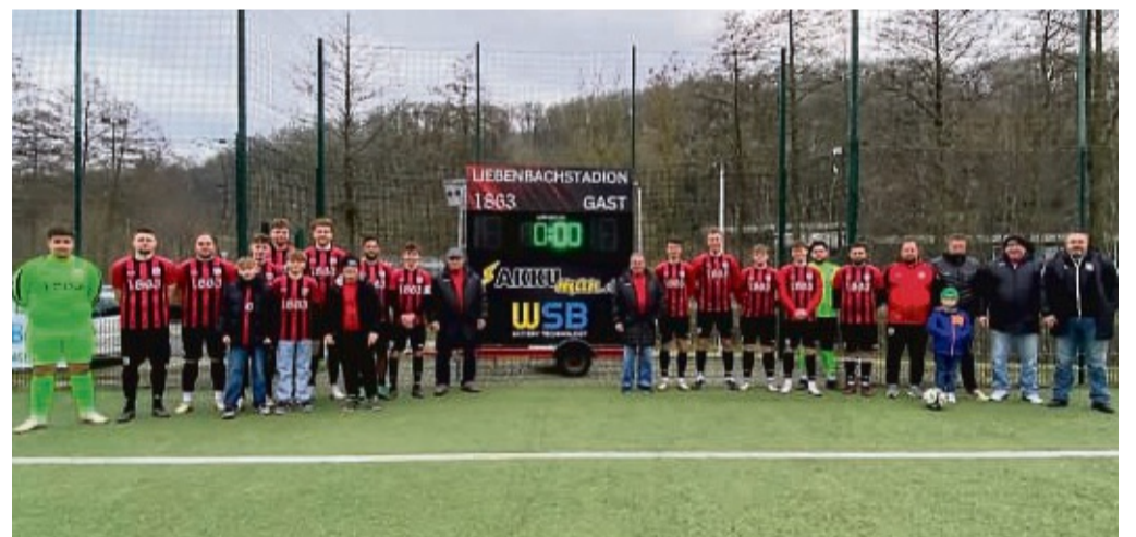
Ein neues Highlight im Liebenbachstadion: Der TSV 1863 Spangenberg e.V. freut sich über die neue digitale Anzeigetafel, die dank der Unterstützung von Sponsoren angeschafft werden konnte.