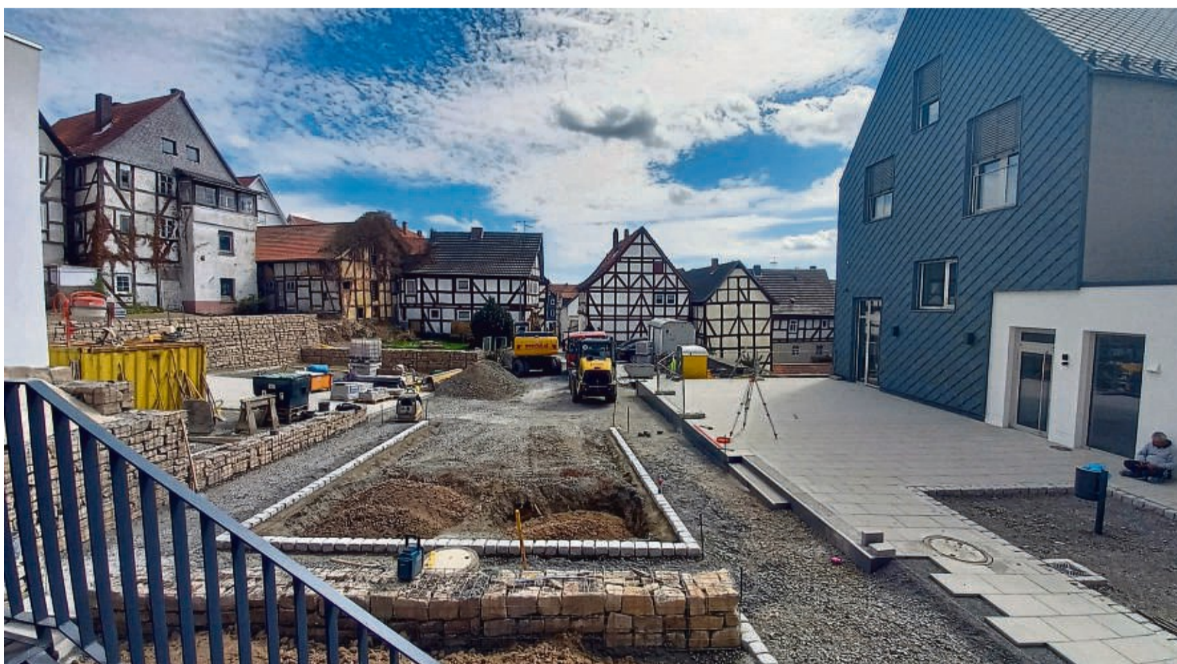
Terrassen, Sitzbänke, neue Wege: Die Arbeiten an der Außenanlage im Innenhof des Multifunktionshauses in Homberg sind fast beendet. In den kommenden Wochen soll alles noch bepflanzt werden.

Damit außen alles genauso strahlt wie innen, wurden in den vergangenen Monaten die Außenanlagen des Multifunktionshauses gestaltet: