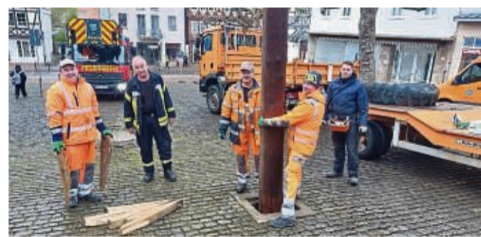
Gemeinsam richten die Bauhofmitarbeiter, die Feuerwehr und ein Mitarbeiter der Firma Lehmann den Maibaum aus.