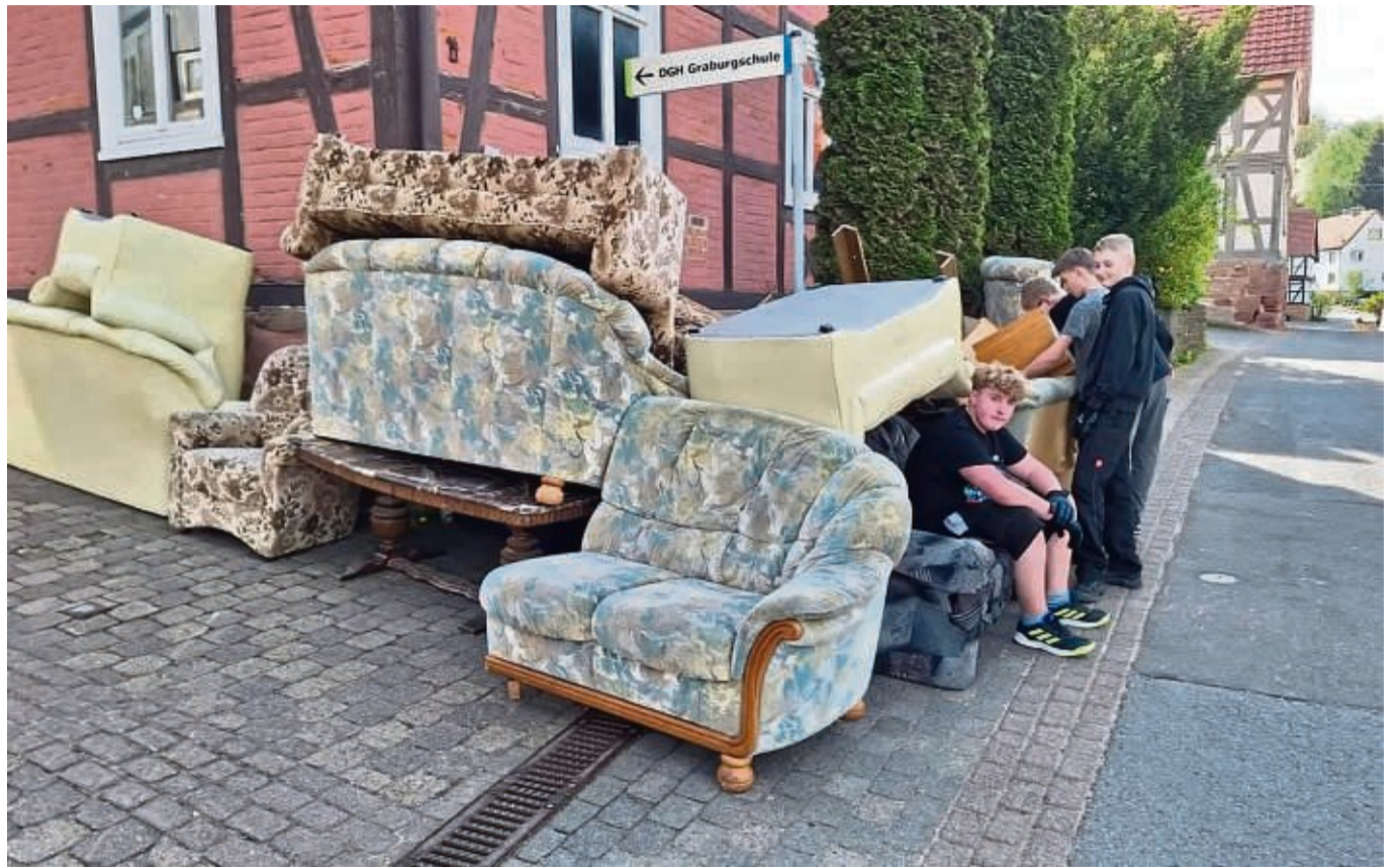
Entrümpelt: Die Teenager in Weißborn brauchen für ihre Jugendräume neue Möbel.

„Wie wir den Raum am Ende gestalten und einrichten steht noch nicht fest, aber wir brauchen neue Möbel. Ein Billardtisch wäre auch schön“, so die Verantwortlichen.