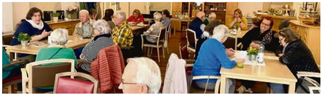
Gut besucht: Viele Besucher informierten sich im Awo-Seniorenzentrum über das Pflegeheim.