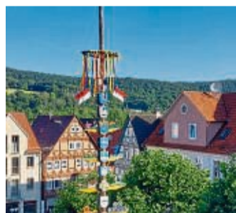
Im herrlichen Glanz erstrahlte im vergangenen Jahr der erneuerte Maibaum.

direkt vor dem historischen Rathaus um ein optisches und vor allem traditionelles Highlight reicher ist. Damit dies auch gelingt, wurden im