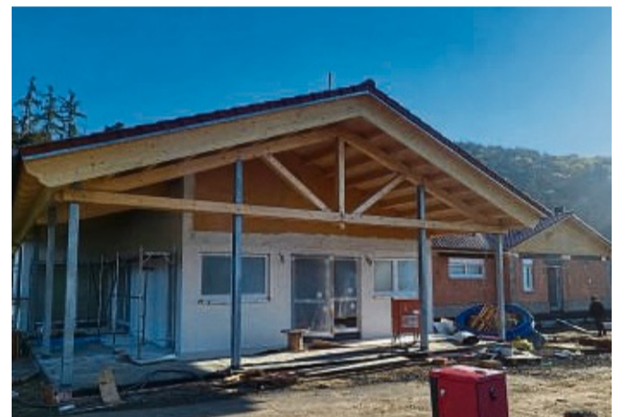
Die letzten Arbeiten finden aktuell an dem Multifunktionsgebäude statt.