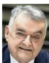
Herbert Reul Innenminister des Landes Nordrhein- Westfalen.

„Freiheit und Sicherheit gehören für uns als Union un-