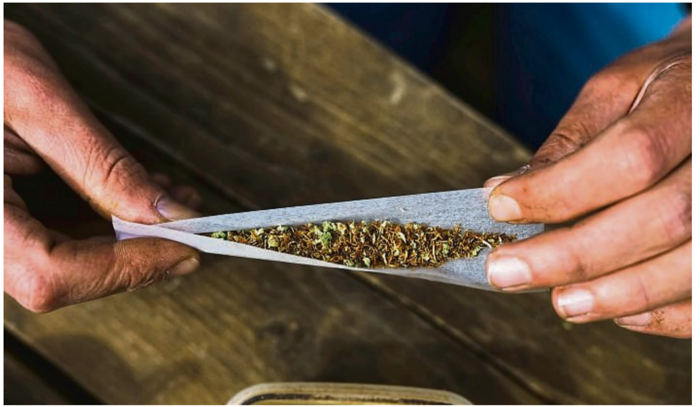
Bereiche, in denen nicht gekifft werden darf, sind gesetzlich festgelegt. Eine Orientierungshilfe soll dabei die sogenannte „Bubatzkarte“ sein, in der Verbotszonen jeweils rot markiert sind.

Woher soll man also den richtigen Abstand zu Spielplätzen und anderen Stätten kennen? Eine Orientierung soll dabei die sogenannte „Bubatzkarte“ bieten. Sie ist online frei verfügbar und zeigt in rot gekennzeichneten Bereichen auf, wo vor Ort das Konsumverbot zutrifft. Doch ein genauer Blick in die Karte zeigt schnell, dass auch hier eine Orientierung nur schwer möglich ist. Besonders deutlich wird dies in den Städten im Landkreis, wo viele Bereiche rot gekennzeichnet sind. Entscheidend für ein Konsumverbot ist eine Sichtweite zu bestimmten Einrichtungen innerhalb von 100 Metern.