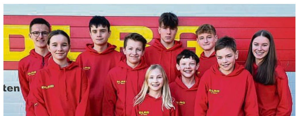
Das neue Jet-Team der DLRG Bebra.

Die Abschluss-Herausforderung bestand an diesem Abend darin, den Achtknoten und Palstek über Kopf zu kneten. red/czi