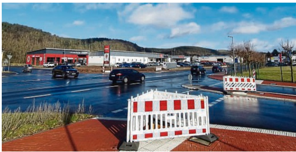
Lässt weiter auf sich warten: Die fehlende Ampelanlage am Ortseingang von Philippsthal soll laut Hessen Mobil voraussichtlich Mitte Mai aufgestellt werden.

Zur fehlenden Ampel hatte Hessen Mobil darauf verwiesen, dass die Lieferzeit insbesondere für die Signalmasten als Einzelanfertigungen deutlich länger ausfalle, als ursprünglich absehbar. Im vergangenen Februar war Hessen Mobil allerdings noch davon ausgegangen, dass die Ampel voraussichtlich noch im ersten Quartal des laufenden Jahres – also bis spätestens Ende März aufgestellt werde (unsere Zeitung berichtete). Derzeit befindet sich die Ampelanlage in der Ferti-