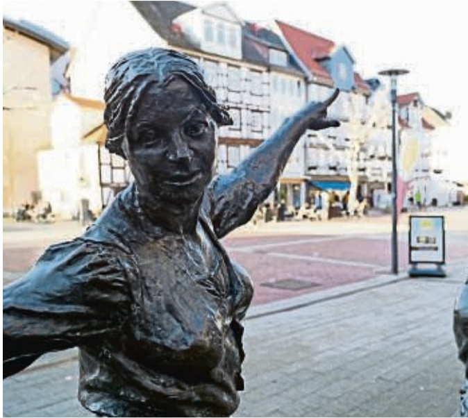
Vor 350 Jahren wollten die Hersfelder Bürger einen Brand auf dem Kirchturm löschen. Doch sie fanden nur Mücken, keinen Rauch.