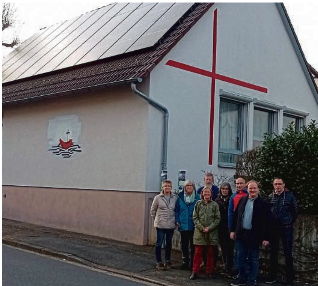
WEG baut Photovoltaikanlage auf Gemeindehaus in Hönebach.