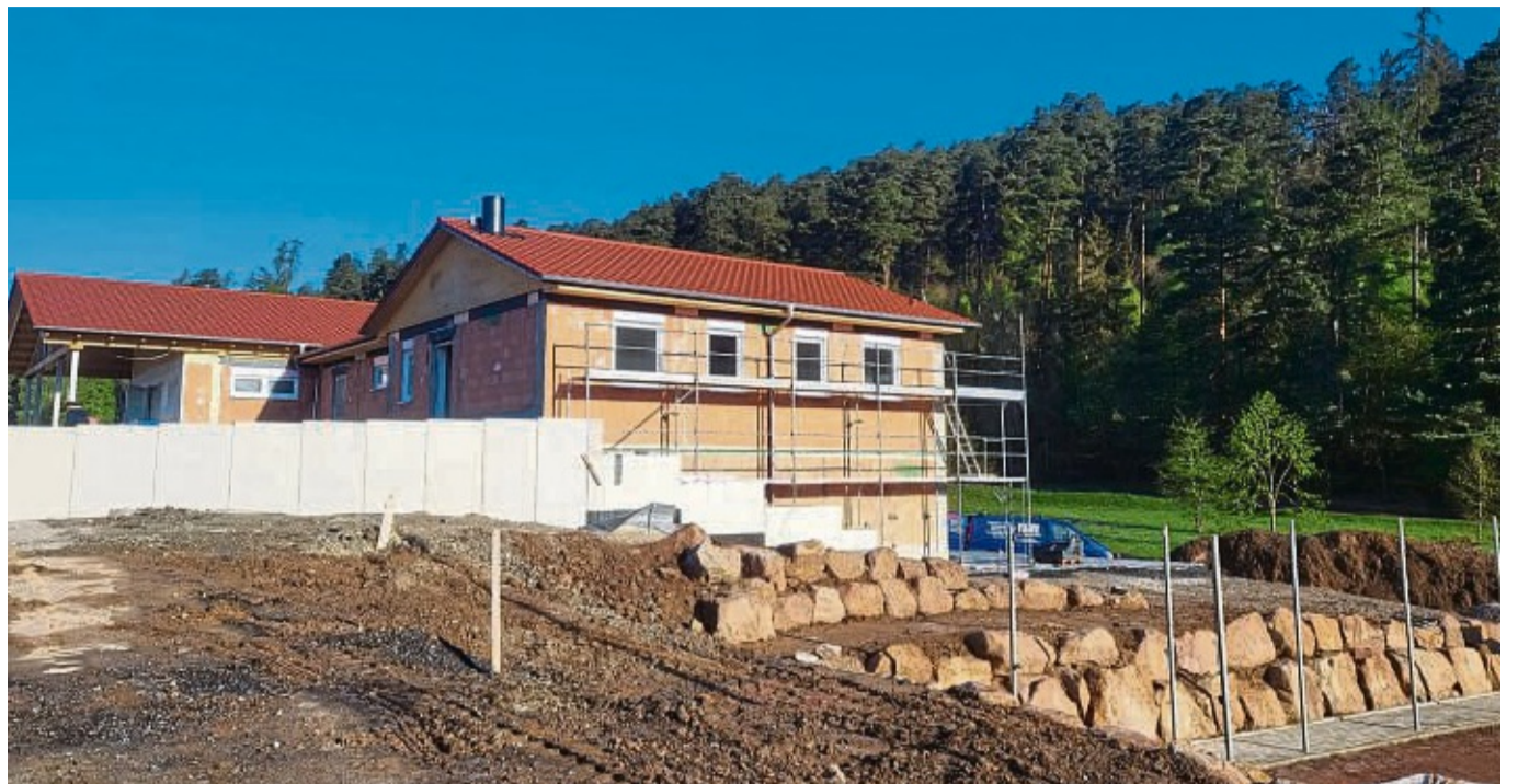
Das Naherholungszentrum am Silbersee nimmt zunehmend Gestalt an: Ab 1. Mai bis zur offiziellen Eröffnung im Sommer wird es dort einen eingeschränkten Betrieb geben.

„Ich bin fest davon überzeugt, dass wir hier am Ende ein tolles Areal haben werden, auf dem sich Besucher, Camper und Familien mit Kindern wohlfühlen werden“, so Jaritz. Und auch Pächter Achim Hinz freut sich auf viele neugierige Besucher, die er ab 1. Mai am Silbersee begrüßen möchte.