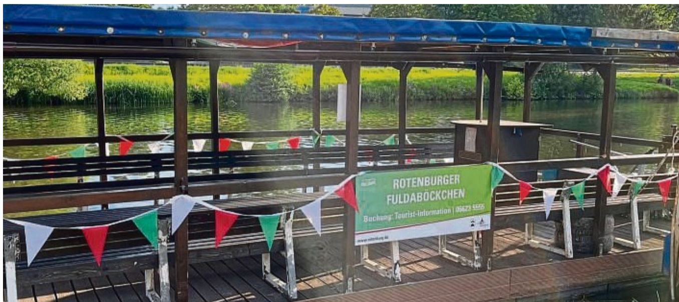
Das Fuldaböckchen wird von der Stadt Rotenburg betrieben.

Die Saisoneroöffnungsfahrt am 1. Mai startet um 10.30 Uhr. Eine Teilnahme kann nur nach vorheriger Anmeldung bei der Tourist-Info un-