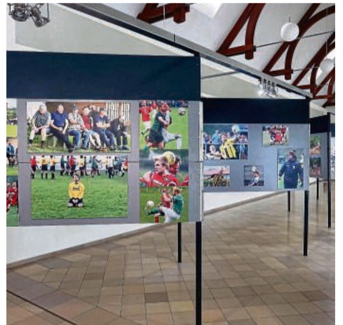
Die Ausstellung „Sport ist ... voller Einsatz!“ des Sportfotografen Friedhelm Eyert in der Wandelhalle.