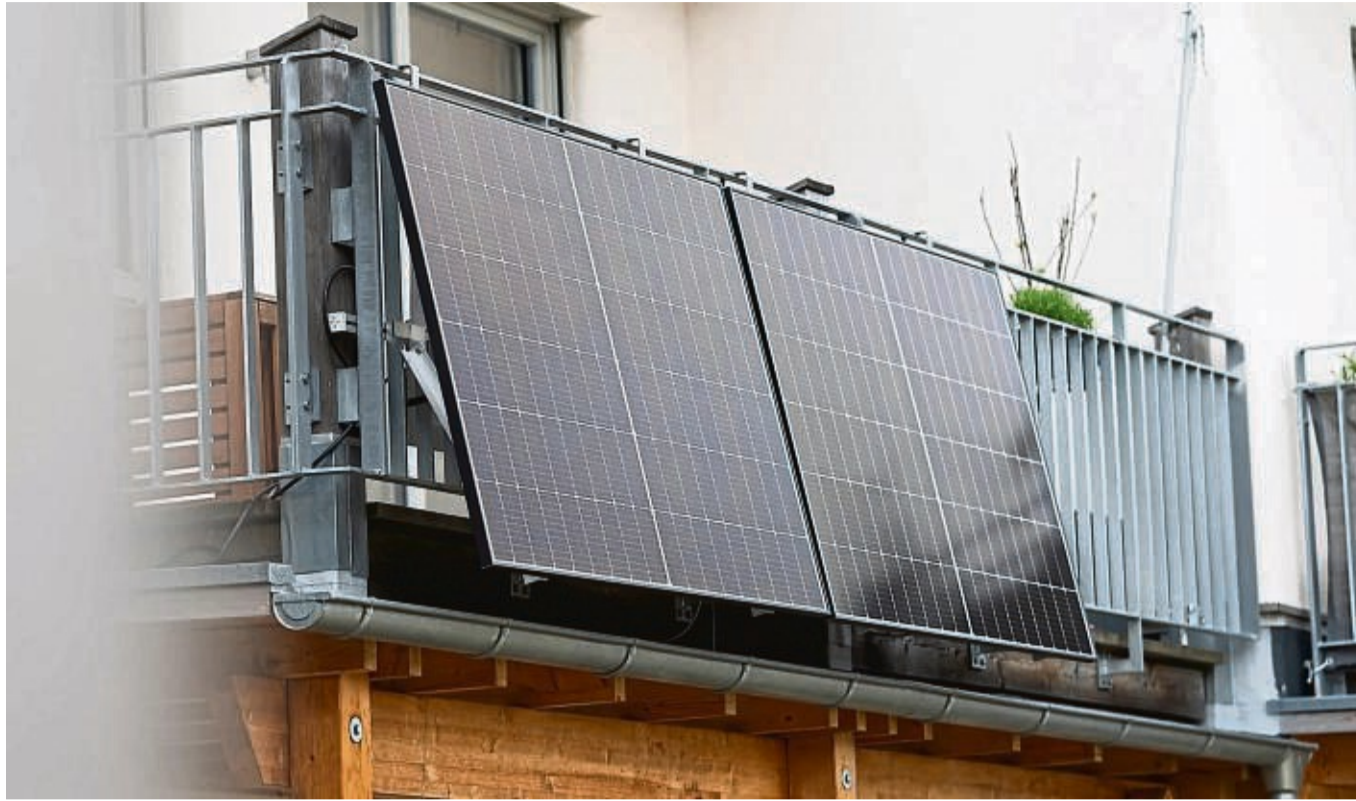
Eine Balkonsolaranlage hängt an einem Wohnhaus. Mit der richtigen Ausrichtung kann man kräftig Stromkosten einsparen.

Geht man jetzt von einem Strompreis von 35 Cent je Kilowattstunde aus, läge die Ersparnis durch den selbst produzierten Strom bei 122,50