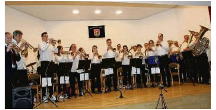
Der Posaunenchor Edertal lädt zum Frühlingskonzert am 8. Mai in Hemfurth ein.