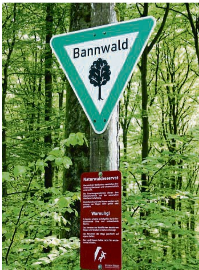
Ein Hinweisschild weist auf das Naturwaldreservat beziehungsweise den Bannwald im Haasenblick bei Osterfeld hin.

31 solcher Naturwaldreservate wie im Haasenblick mit einer Gesamtfläche von 1228 Hektar gab es schon vor 10 Jahren in Hessen. Die Fläche zwischen dem alten Amtsweg im Haasenblick und der Bundesstraße 236 wurde 1988 unter besonderen Schutz gestellt. Im Haasenblick hat da-