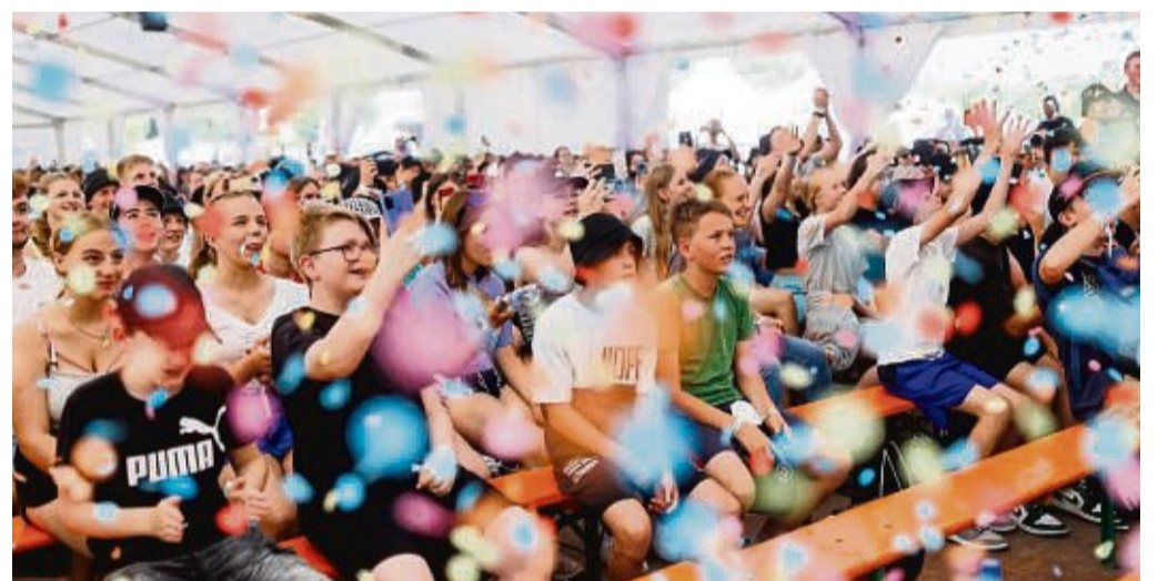
Der letzte Jugendkirchentag der Evangelischen Kirche in Hessen und Nassau fand 2022 in Gernsheim statt, der nächste findet in Biedenkopf statt.

Das Motto des Kirchentags wird dabei in drei Themenparks aufgegriffen, die auf der Biedenkopfer Bleiche zu finden sind. So können sich die Jugendlichen im Themenpark „Kopf frei, Herz offen – für mich“ mit Fragen wie „Wer bin ich?“ und „Wer will