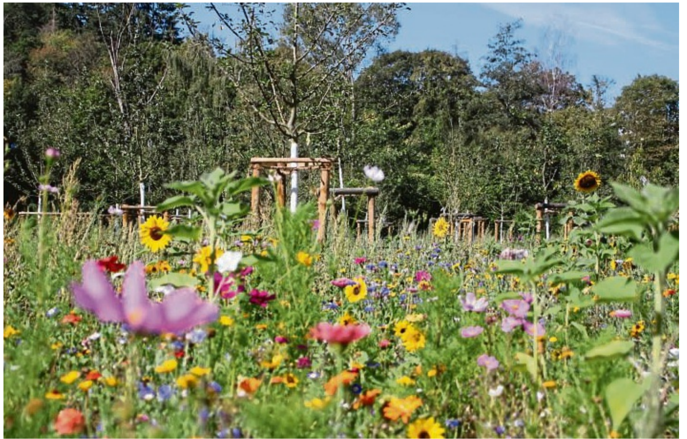
Ein Blühfläche im Frankenger Teichgelände im Jahr 2019.

Mit der Aktion möchte die Stadt Frankenberg (Eder) dem Rückgang der Insekten aktiv entgegenwirken. Denn schwindende Lebensräume, fehlende Nahrungsquellen und der vermehrte Einsatz von Pestiziden sind Ursachen für das flächendeckende Insektensterben der letzten Jahre. Jede noch so kleine Blühfläche vergrößert die Artenvielfalt, macht eine bunte Stadt und erfreut das Auge. Die Stadt nutzt die Blühsamenmischung auch selbst für viele eigene Flächen. Auf insgesamt knapp 10 000 Quadratmetern im gesamten Stadtgebiet wird die Samenmischung ausgebracht - damit Frankenberg kräftig aufblüht.