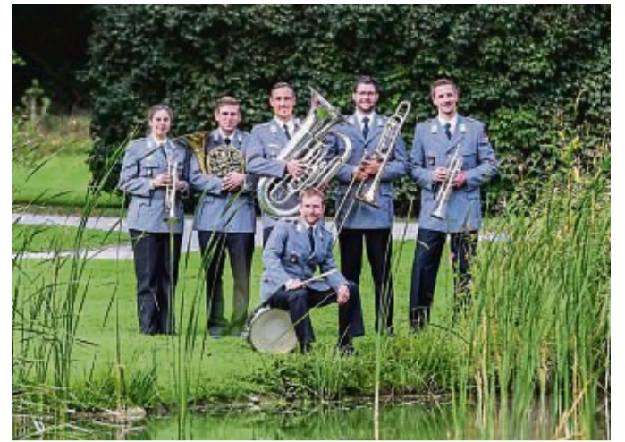
Benefizkonzert: Ein Ensemble des Heeresmusikkorps Kassel spielt am 18. Juni im Marstall auf Hof Campf in Dalwigkthal zugunsten der Kinderkrebshilfe Waldeck-Frankenberg.

Verwaiste Jungvögel oder verletzte Tiere: werden gehegt und gepflegt, um sie gesund wieder in die freie Wildbahn zu entlassen. Sie bringt neben ihrem Falknerschein für ihre neue Position eine Menge weiteres, nützliches Wissen aus ihrer Ausbildung zur Berufs- und Revierjägerin mit.