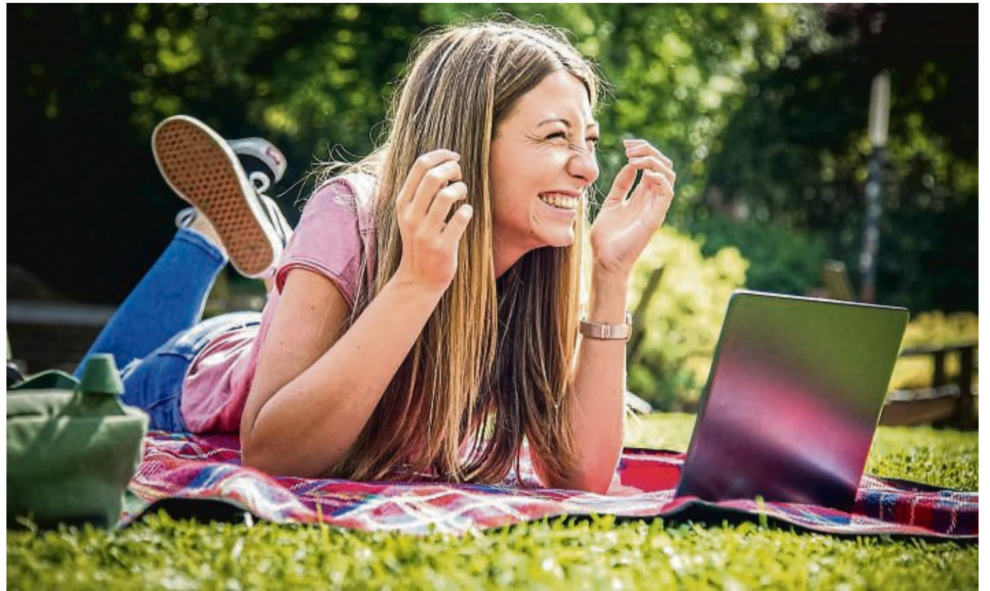
Fremdsprachen lernen – in einem sicheren Raum, ohne Angst vor Blamage: So lautet das Versprechen von KI-Sprachtrainern.

Sowohl die männliche als auch weibliche Stimme klingen bei diesem Tool natürlicher als bei den Vergleichstrainern. „Teacher AI“ gibt zudem mündliche Hinweise und Korrekturen in der Ausgangssprache. Außerdem listet das Tool die Wörter auf, die Lernende und die KI-Trainer im Dialog bisher verwendet haben. Das ist praktisch, denn: Mithilfe der integrierten Übersetzungsfunktion kann man so Vokabeln üben. Die Zeitschrift bemängelt,