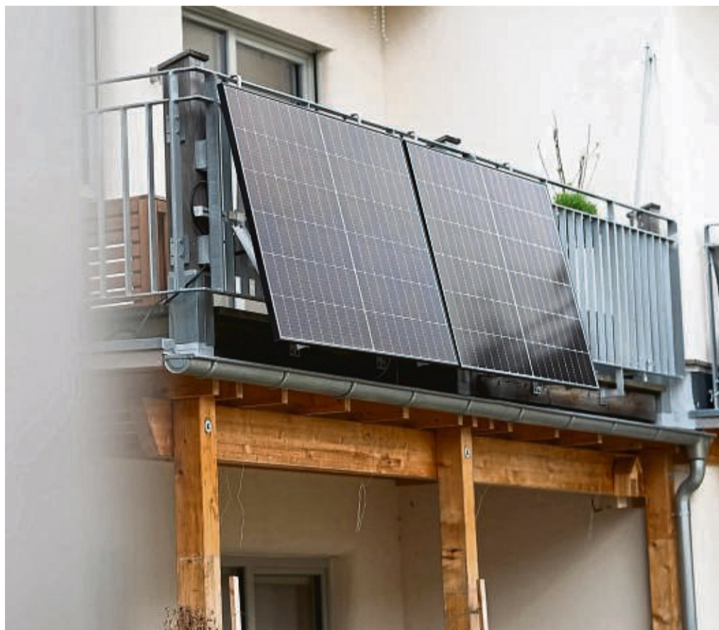
Eine Balkonsolaranlage hängt an einem Wohnhaus. Mit der richtigen Ausrichtung kann man kräftig Stromkosten einsparen.