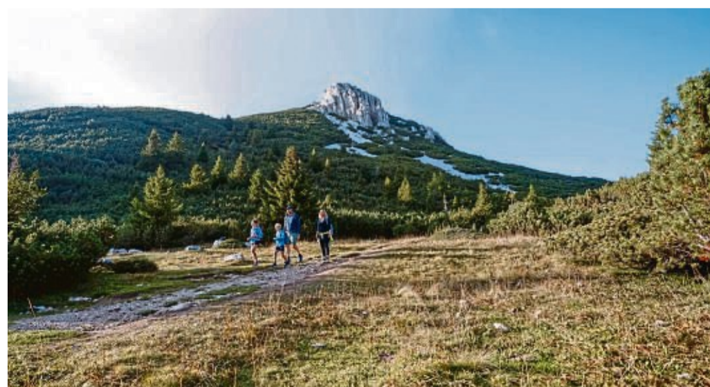
Der letzte Schnee liegt noch am Gipfel, aber die Wanderer tragen schon kurze Hosen: typische Südtiroler Gegensätze auf dem Schwarz-Weiß-Weg.

net. Am 31. Juli gibt es hier ein Familienfest, bei dem die Teilnehmenden auf eine Schatzsuche gehen, Rätsel lösen und ein Souvenir mit nach Hause nehmen. djd