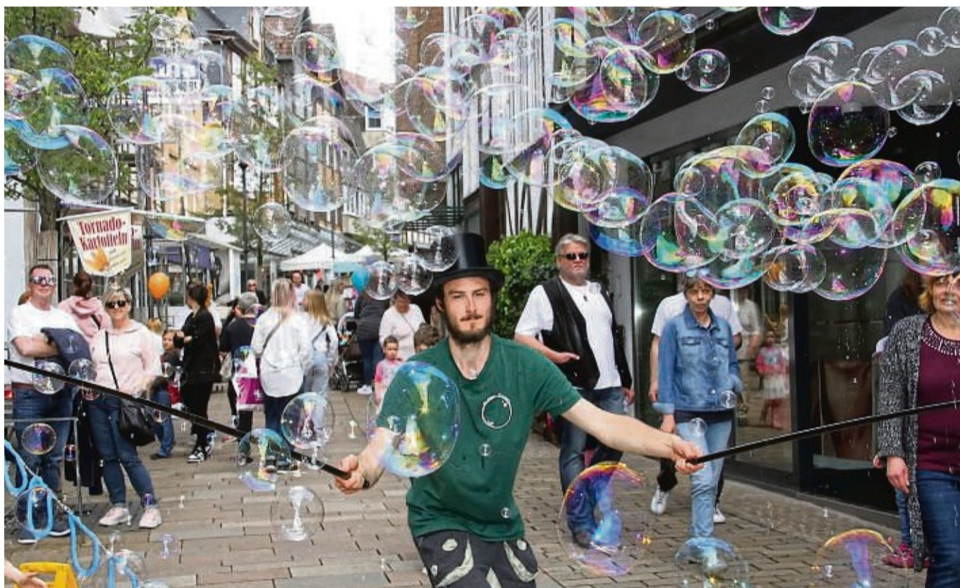
Beim Maistadtfest an diesem Wochenende in Frankenberg wird es auch wieder Seifenblasenkunst in der Fußgängerzone geben, wie hier 2023. ARCHIVFOTO: MJX

Die heimischen Einzelhändler sind die Gastgeber des Maistadtfests und haben für die Besucher wieder ein ganz spezielles Bonbon parat: An beiden Tagen sind die Läden der heimischen Geschäfte