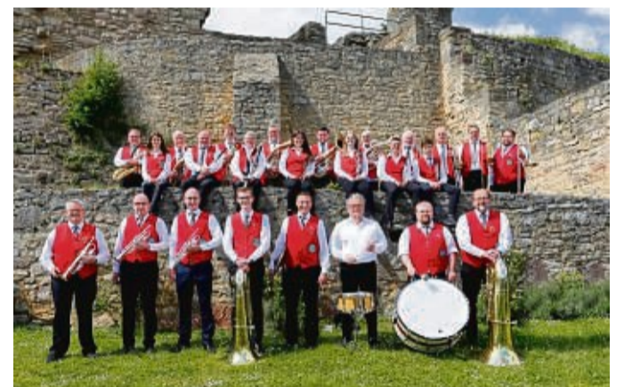
Der Musikverein Volkmarsen lädt unter dem Motto „Mit Musik in den Mai“ zum Konzert ein.