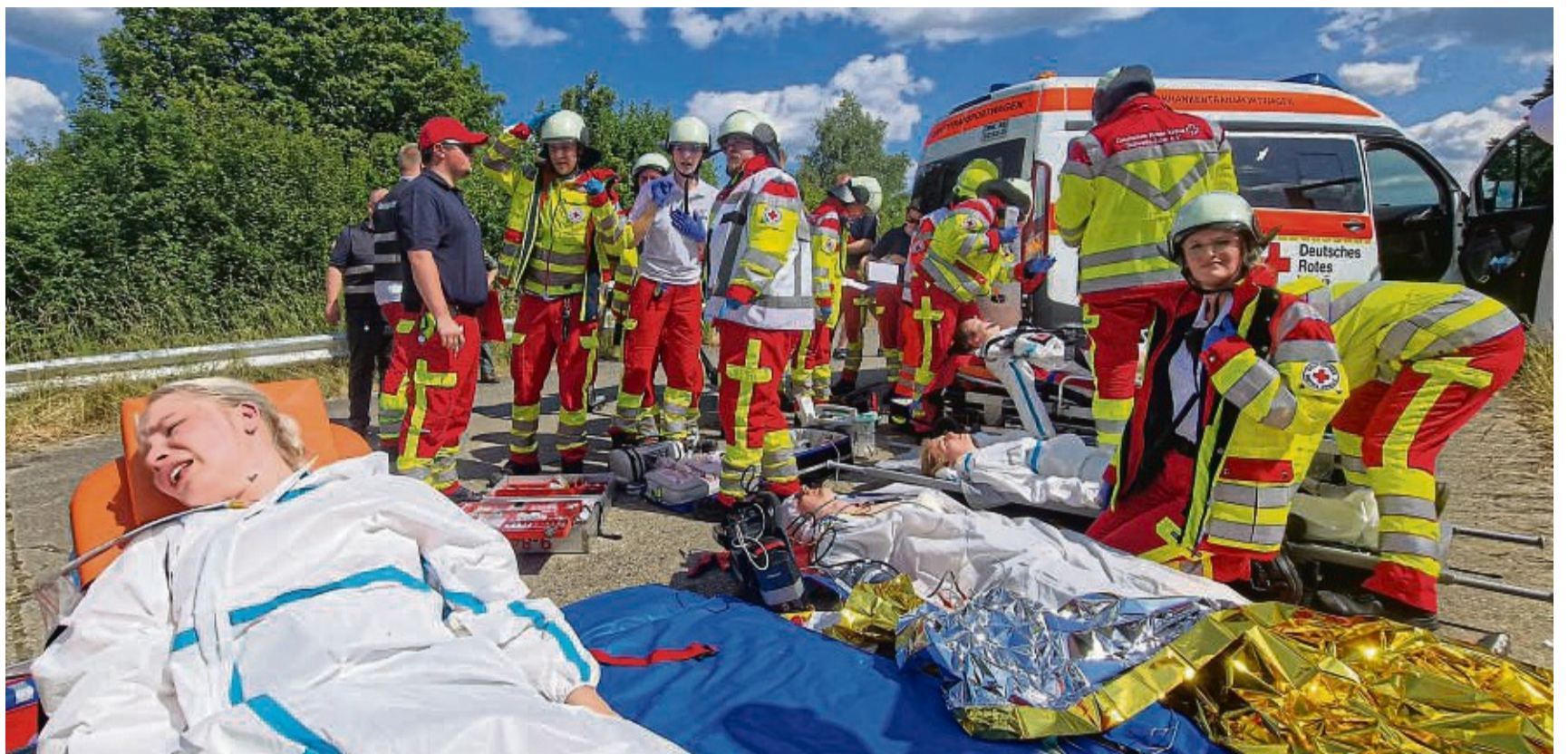
Notfallübung der DRK Rettungsdienstschule Schwalm-Eder: Auch durch die Ausbildung an der DRK Rettungsdienstschule in Homberg kämpft das Deutsche Rote Kreuz nicht mit Nachwuchs (Archivbild).

Laut der Pressemitteilung lebt die Autorin mit Mann, Pferd und Hund in der Wetterau.