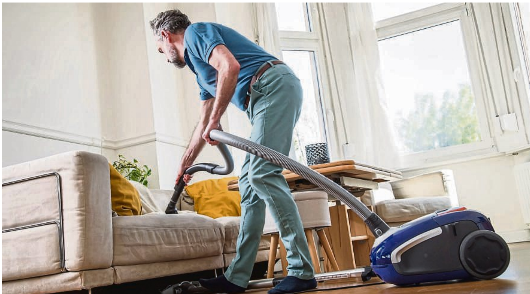
Ordnung kann Zeit sparen. Denn ist alles aufgeräumt, fällt auch das Putzen etwas leichter.

Und Ordnung zu schaffen, das heißt fast immer eines: zu reduzieren. Ob Hosen, Brotzeitboxen oder Schuhe – die meisten Menschen haben von vielem zu viel im Schrank. „Es ist aber nicht unbedingt das Ziel, Minima-