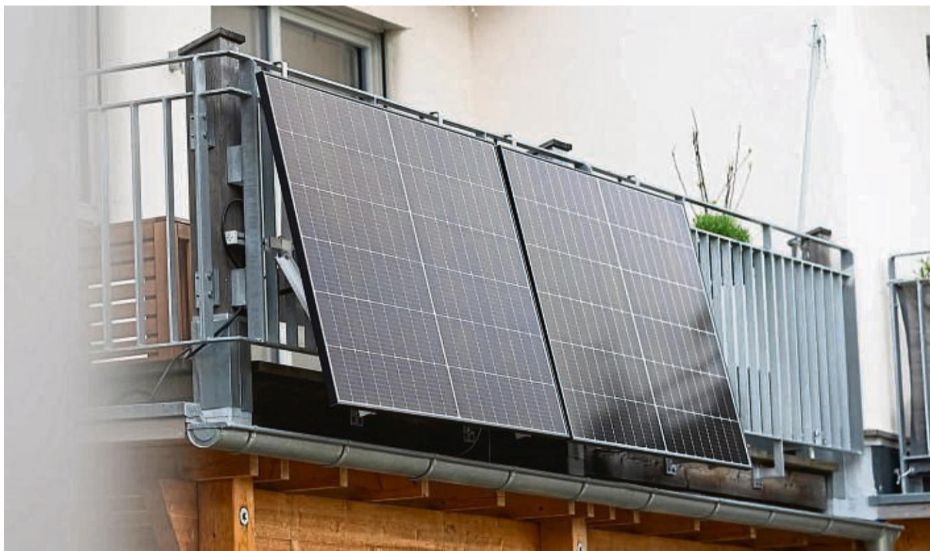
Eine Balkonsolaranlage hängt an einem Wohnhaus. Mit der richtigen Ausrichtung kann man kräftig Stromkosten einsparen.

Geht man jetzt von einem Strompreis von 35 Cent je Kilowattstunde aus, läge die Ersparnis durch den selbst produzierten Strom bei 122,50