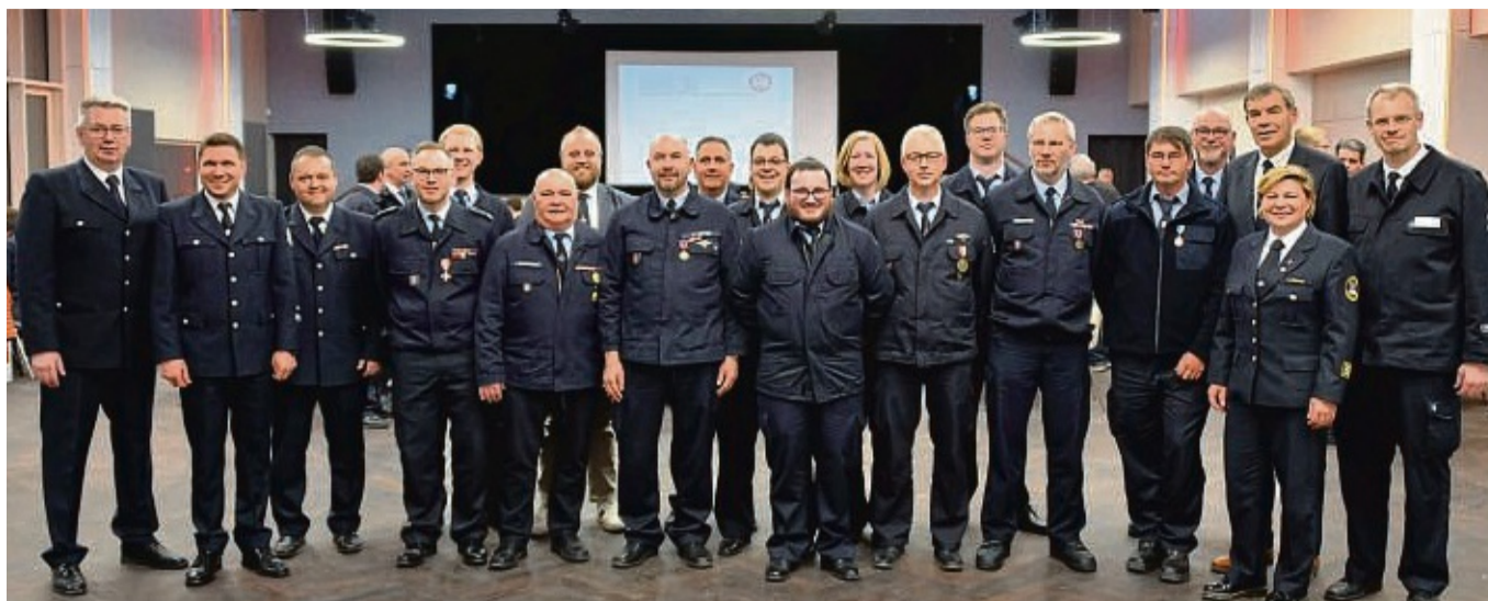
Geehrt und befördert: Bei der gemeinsamen Jahreshauptversammlung wurden langjährige und verdiente Feuerwehrleute ausgezeichnet und befördert.

Deutlich ist die Zahl der Einsätze gestiegen. Im Berichtsjahr 2023 rückten die Fritzlarer Feuerwehren zu insgesamt 190 Einsätzen aus. 2021 waren es noch 121 Einsätze. Nicht nur im eigenen Gebiet, sondern auch in Sachen Nachbarschaftshilfe in Gudensberg, Borken, Edermünde, Bad Wildungen und Naumburg waren die Fritzlarer Feuerwehren im vergangenen Jahr im Einsatz.