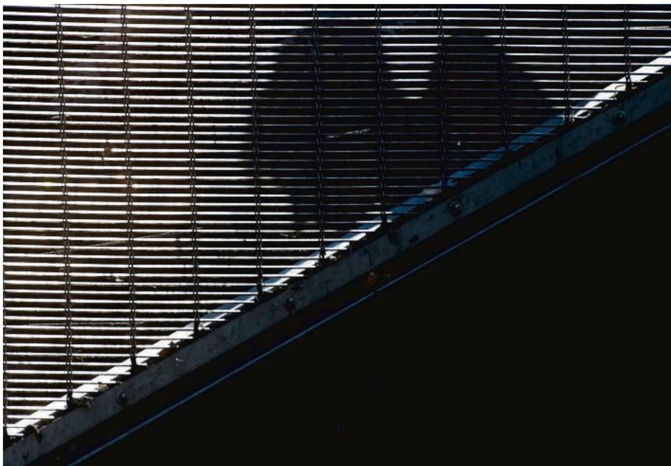
Kindheitstraumata können langanhaltende Auswirkungen auf die psychische Gesundheit haben.

„Auch anhaltender Streit oder Gewalt in der Familie ist für Kinder nicht zu ertragen