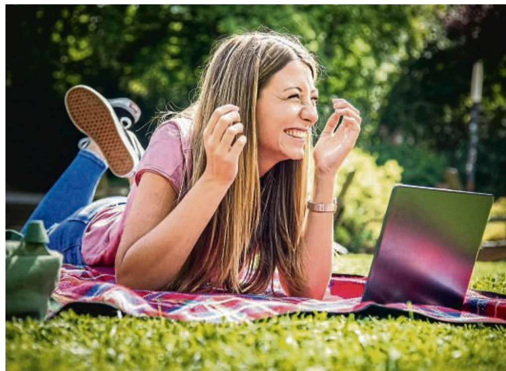
Fremdsprachen lernen – in einem sicheren Raum, ohne Angst vor Blamage: So lautet das Versprechen von KI-Sprachtrainern.

Die Zeitschrift bemängelt, dass dieses Tool keine vorgegebenen Rollenspiele bietet, sondern nur einen freien Sprach-Chat, der aber auf Zuruf reagiert. In der Testphase gab es laut „c’t“ Serverprobleme. Auf seiner Website weist der Anbieter darauf hin, dass gerade an der Plattform gearbeitet werde, um dem zunehmenden Nutzungsvolumen