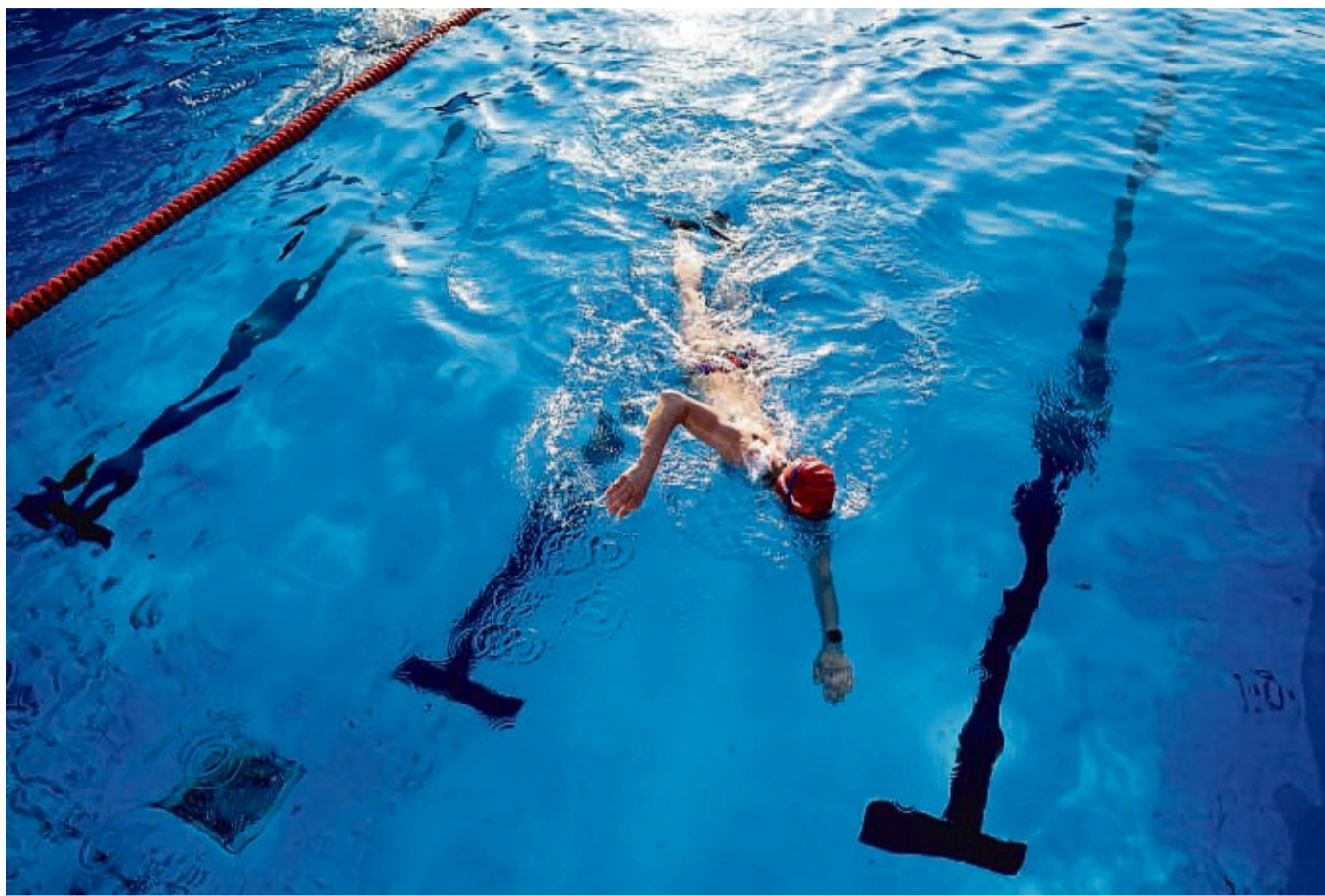
Die DLRG hat so viele Mitglieder wie noch nie. Die Menschen geben zum Beispiel Schwimmunterricht oder werden Rettungsschwimmer.

Und: Echte Profis tauchen ein, ohne sich die Nase zuzuhalten. Im schlimmsten Fall haut man sich durch den