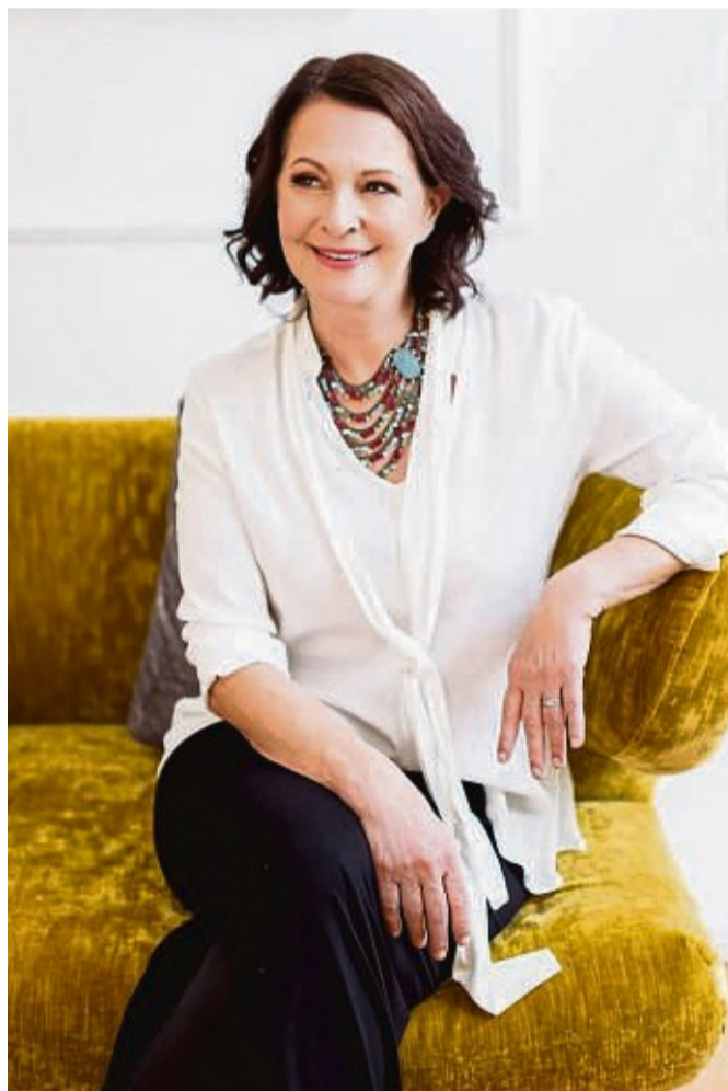
Stefanie Stahl ist eine deutsche Psychologin und Autorin.

Ein wichtiger erster Schritt ist das Erkennen und Akzeptieren des Traumas als Teil der eigenen Lebensgeschichte. „Traumatisierte sind oft