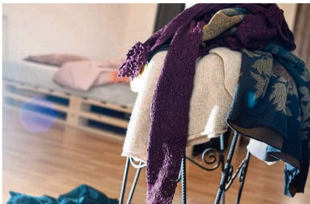
Manche stören sie mehr, manche weniger: Wäscheberge, die sich im Schlafzimmer ansammeln.

Helfen kann es, sogenannte Mikroroutinen zu etablieren. Also etwa Liegengebliebenes wegräumen, während der Wasserkocher das Tee-wasser erhitzt. Oder bei jedem Gang in den ersten Stock etwas mitnehmen. Grundsätzlich sinnvoll: sich angewöhnen, Dinge nach ihrer Nutzung möglichst sofort