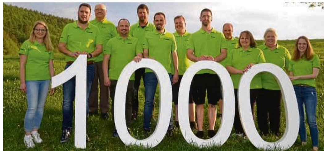
Nächstes Wochenende feiert Eimelrod seine Geschichte mit einem großen, bunten und abwechslungsreichen Jubiläumsfest.

Die Besucher können sich dabei auf Leckereien freuen, etwa Gebrilltes und Spiralkartoffeln, Suppen und Hofeis, Wein, Jubiläumsschnaps und Cocktails. Eine breite Auswahl an