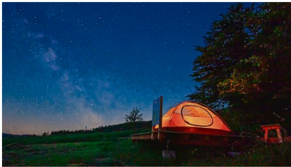
Projektidee für dieses Jahr: Den stark nachgefragten Trekking-Park soll es auch für Radler geben.