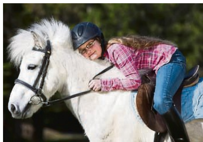
Reiten kann vielfältig die Entwicklung bei Jugendlichen und Kindern fördern.

Die Bewegungen auf dem Pferderücken sind einzigartig im Bewegungsleben des Menschen und beeinflussen ihn umfassend. Damit wird u.a. die Koordination aller Muskeln in hohem Maße gefördert. Der Umgang mit und das Bewegen auf dem Pferd fördern Gesundheit im umfassenden Sinne. Die Erlebnisse mit dem Pferd und die vielfältigen Bewegungsanforderungen leisten einen Beitrag für das körperliche und gefühlsmäßige Wohlbefinden eines Kindes. Grundschulkindern werden durch