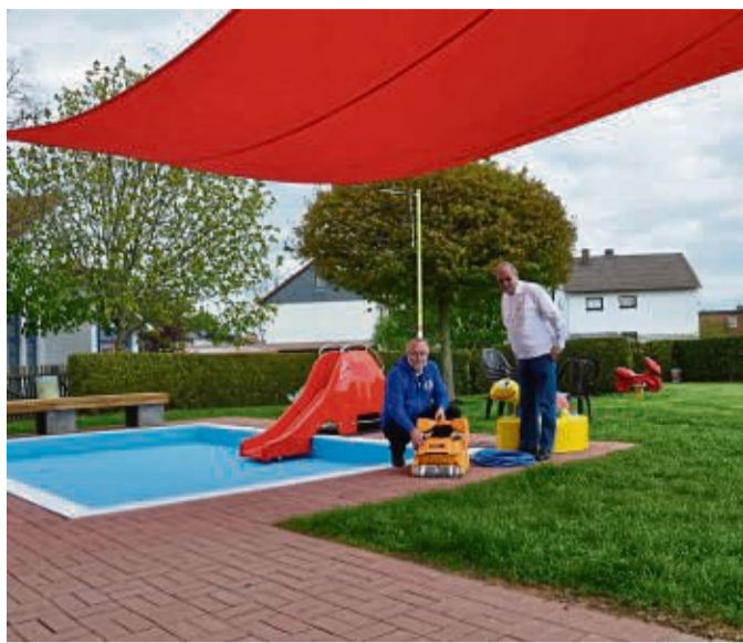
Leader-Projekt: Das Vasbecker Walmebad erhielt in der vorigen Periode ein Kinderbecken mit Sonnensegel.

Gefördert werden die Gründung und Erweiterung von Unternehmen, die Verbesserung der Basisinfrastruktur wie Dorfläden, die touristische Infrastruktur und Bildung und Kultur. Ver-