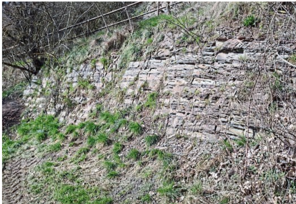
Bereits zum achten Mal hat der Nationale Geopark Grenz-Welten den Titel eines „Geotops des Jahres“ vergeben. Titelträger wurde der Adorfer Bänderschiefer, der sich mitten im Ort befindet und auf den ersten Blick wie eine Mauer aussieht.