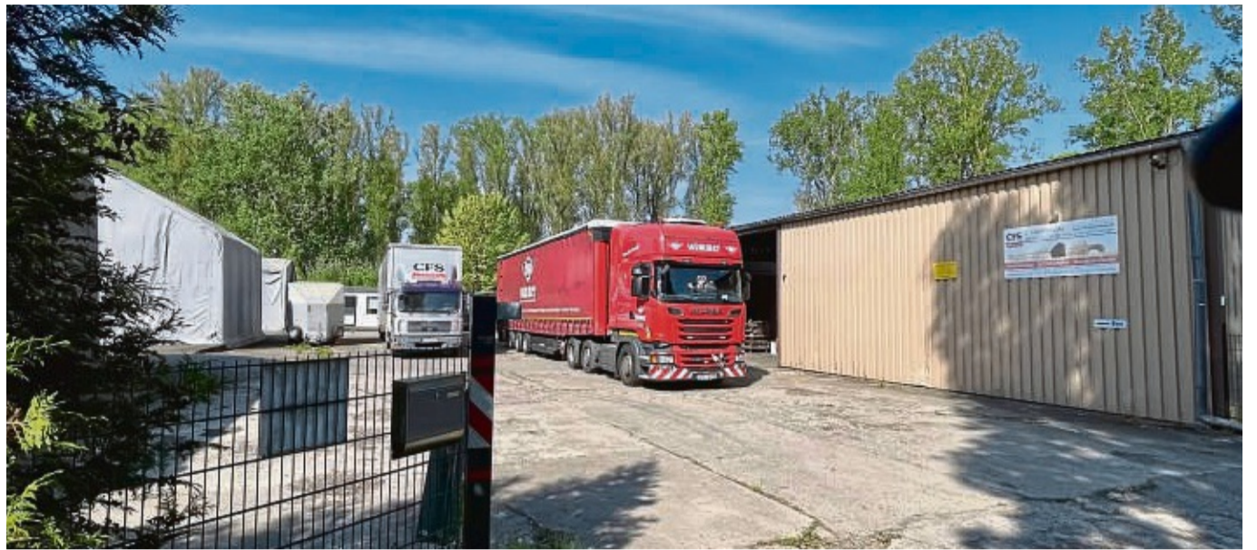
Bei einer Immobilienauktion zum Verkauf angeboten: die Anraffer Schaumstoff-Fabrik. Die Gemeinde Edertal hat Interesse an der Gewerbe-Immobilie, die als Nebenstelle des Bauhofs genutzt werden könnte.