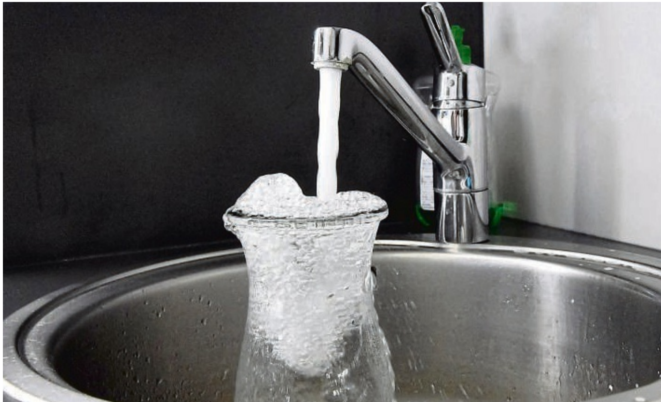
Es sollte nun sauber sein: Zwischenzeitig waren Kohlenstoffwasserbindungen im Trinkwasser nachgewiesen worden. Die Proben sind zurzeit wieder negativ.