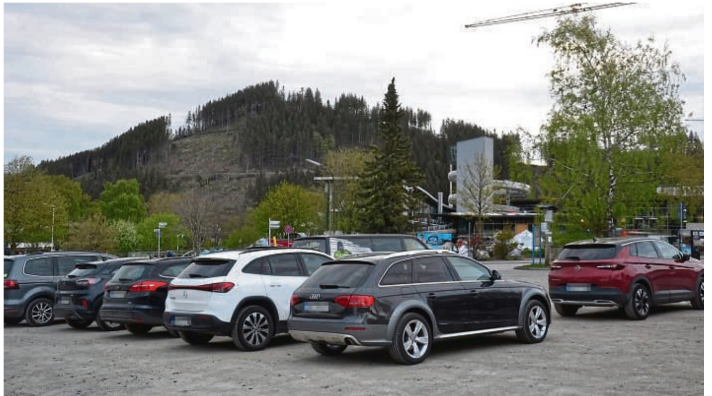
Parken in Willingen wird teurer – die Lage am Lagunenbad muss derweil noch geklärt werden.

Willingen verabschiedet sich von kostenfreien Stellplätzen