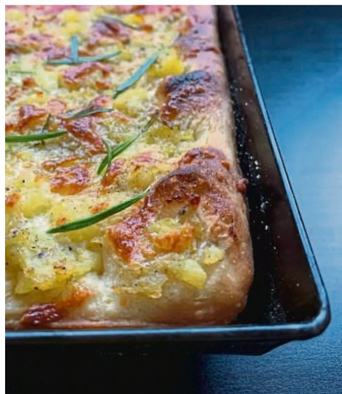
Kartoffeln eignen sich perfekt für einen Belag auf einer Blechpizza à la Romana.

4. Den Teig mit den Fingern auf einem mit Olivenöl bepinseltem Blech verteilen und eine dünne Mozzarellaschicht drüberstreuen. Darauf die Kartoffelmischung sowie noch etwas Olivenöl und am Ende den Rest Mozzarella geben. 15 Minuten backen und vor dem Servieren noch etwas Salz auf die Pizza streuen.