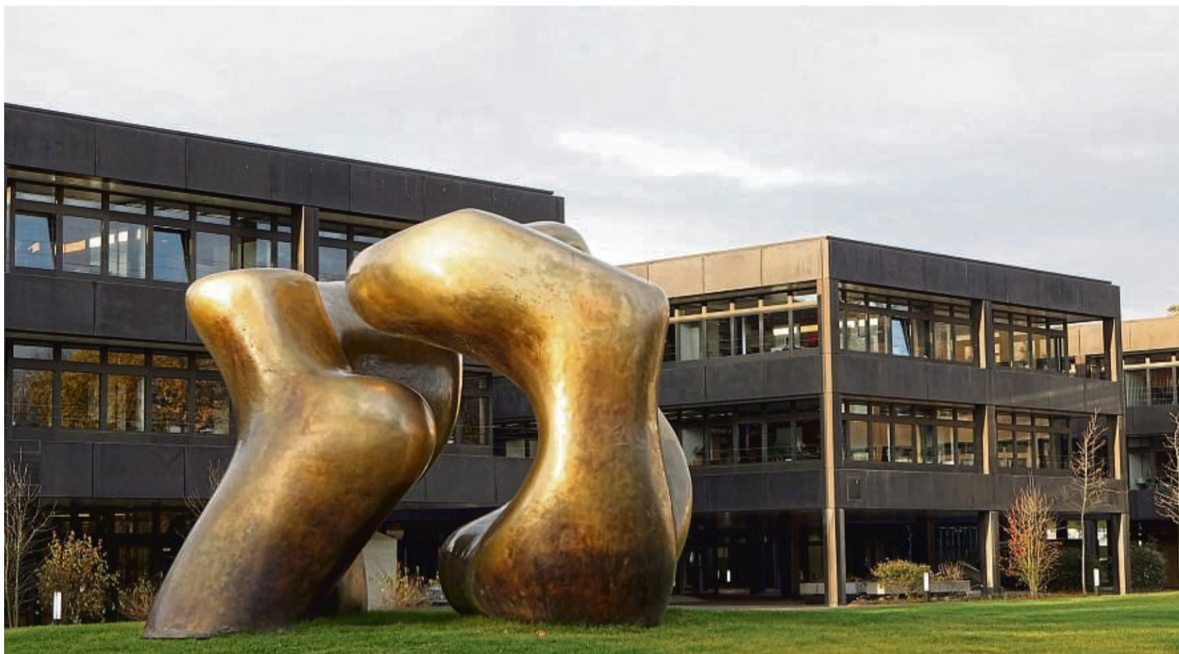
Bronzeskulptur vor dem früheren Kanzleramt in Bonn: „Large Two Forms“ des Bildhauers Henry Moore.

Der Empfangsraum zeigt das Mobiliar im Stil der