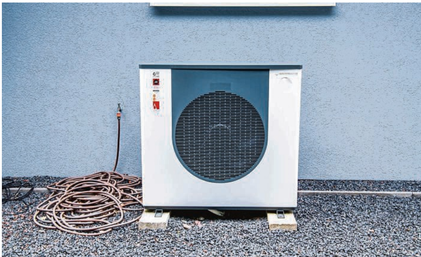
Wärmepumpenbesitzer können von einem Wärmestromtarif profitieren, der jedoch mindestens einen separaten Stromzähler erfordert.

Das kommt unter anderem daher, dass Anbieter die Leistung der Geräte in Zeiten, in denen Strom besonders teuer ist, drosseln können. So kann