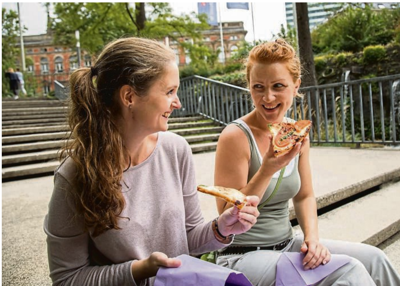
Der Vorteil von Blechpizza: Die einzelnen Stücke sind perfekt für den kleinen Hunger einfach auf die Hand.

Auch im Geschmack unterscheidet sich die römische von der neapolitanischen Variante. „Der Boden ist di-