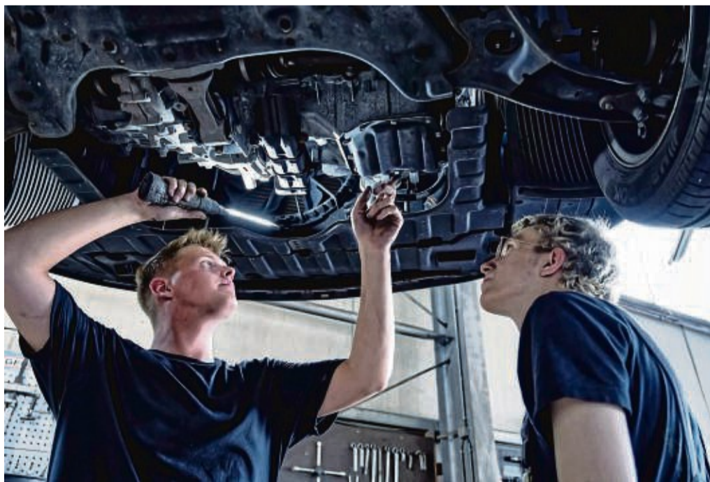
Beim Klimaanlage-Check prüft der Kfz-Mechaniker alle Teile der Anlage und ihre Funktionen.

Der Zentralverband Deutsches Kfz-Gewerbe weist auf Probleme hin, die durch eine mangelhafte Wartung entstehen können. Ein niedriger Stand des Kältemittels etwa kann die Leistung beeinträchtigen und zu Schäden am Kompressor der Klimaanlage führen - die Reparatur geht richtig ins Geld. Ein Aus-