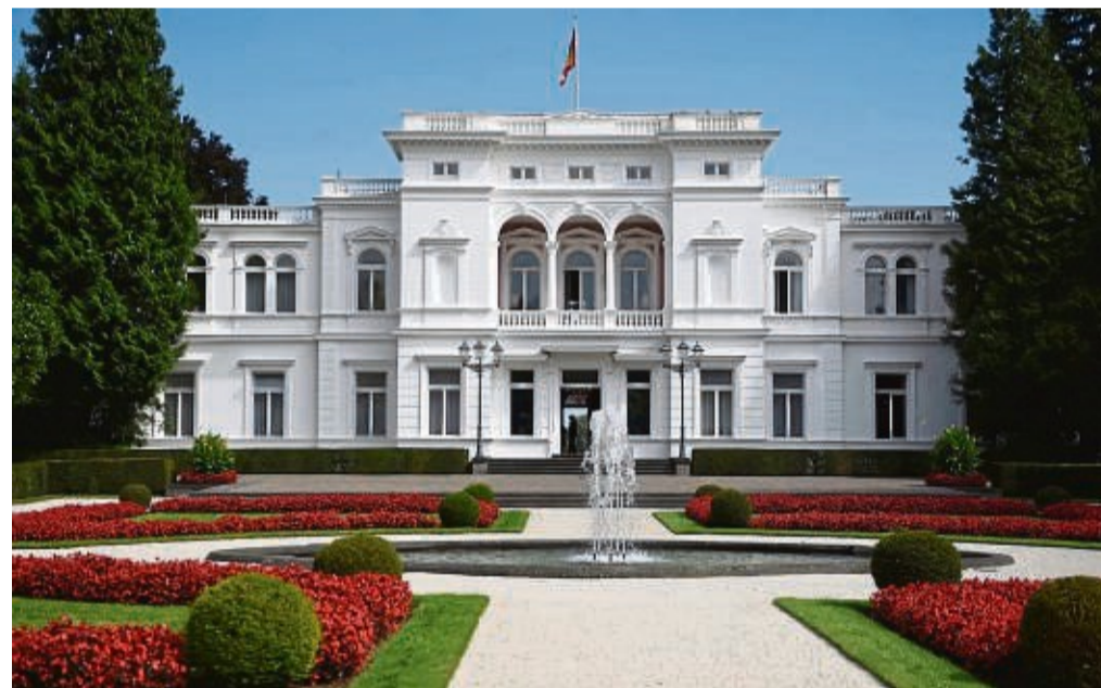
Der zweite Amtssitz des Bundespräsidenten: die prachtvolle Villa Hammerschmidt.

Die Geschichte der Giraffe im Naturkundemuseum Koenig zählt dazu: „Hartnäckig hält sich das Gerücht, dass die Exponate des Museums, also Giraffen, Zebras, Elefanten und andere Savannentiere den Parlamentariern beim Festakt am 1. September 1948 anlässlich der Beratungen zum Grundgesetz über die Schulter geschaut hätten“. Stimmt nicht, bekräftigt Just. Die präparierten Tiere waren mit Vorhängen ab-