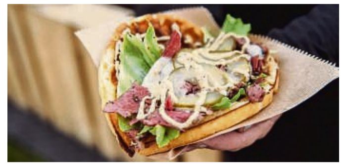
Beim „Cheat Day“ gibt es kulinarisches aus aller Welt. Hier im Bild: Pastrami in einer Kartoffelwaffel.