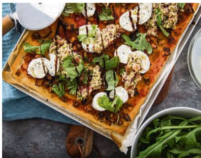
Wie ein Gemälde: Pizza vom Blech mit Süßkartoffel, Büffelmozzarella, Guacamole, Rucola, Balsamico.

Nun den Teig zu einer Kugel einrollen und in eine gefettete Schüssel oder Box geben, die für 24 Stunden in