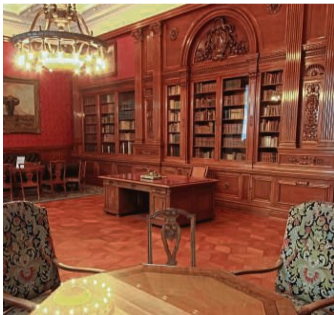
Das Arbeitszimmer von Konrad Adenauer, wie es im Bonner Museum Koenig zu sehen ist.